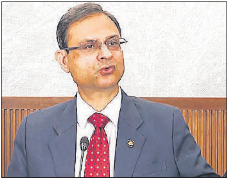
● एफई मॉडर्न बीएफएसआई शिखर सम्मेलन में कहा बहुपक्षवाद अब बीते दिनों की बात

मल्होत्रा ने कहा, उम्मीद है कि ब्रिटेन के साथ एफटीए से हमें मदद मिलेगी... अब आगे बढ़ने का यही रास्ता है, क्योंकि दुर्भाग्य से बहुपक्षवाद पीछे छूट गया है। उन्होंने साथ ही कहा कि अमेरिका के साथ बातचीत काफी आगे बढ़ चुकी है। आरबीआई के गवर्नर ने कहा कि वर्तमान वास्तविकताओं को