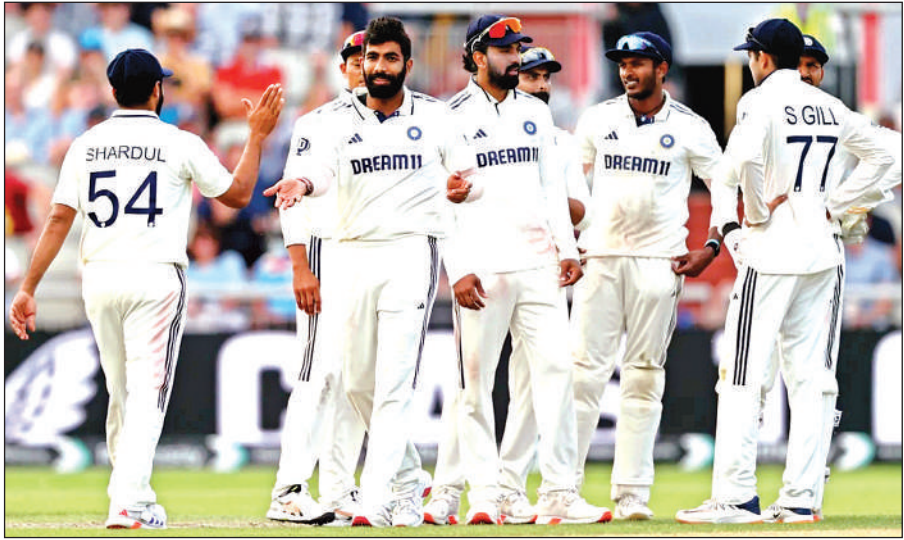
जसप्रीत बुमराह ने पहला विकेट लेने के बाद टीम के साथ जश्न मनाते हुए।

मैनचेस्टर, एजेंसी जो रुट (150) के 38वें टेस्ट शतक से इंग्लैंड ने पांच मैचों की श्रृंखला के चौथे टेस्ट के तीसरे दिन अपनी पहली पारी में सात विकेट पर 544 रन बनाकर भारत के खिलाफ अपनी पकड़ काफी मजबूत कर ली है। भारत की पहली पारी 358 रन पर सिमटी थी जिससे इंग्लैंड की कुल बढ़त अब 186 रन की हो गयी और उसके तीन विकेट शेष हैं। स्टंप्स के समय इंग्लैंड के कप्तान बेन स्टोक्स 77 रन पर खेल रहे थे जबकि लियाम डॉसन 21 रन बनाकर क्रीज पर डटे हुए हैं। रुट ने अपनी इस यादगार पारी के दौरान ओली पोप (71) के साथ तीसरे विकेट के लिए 144 और बेन स्टोक्स के साथ 142 रन की साझेदारी की। स्टोक्स 66 रन के व्यक्तिगत स्कोर पर रियायर्ड हट्ट हो गए, लेकिन क्रिस वोक्स (चार) के रूप में छठा विकेट गिरने के बाद फिर से बल्लेबाजी के लिए क्रीज पर आए। पिच की असमान उछाल को देखते हुए इंग्लैंड की कोशिश बड़ी बढ़त कायम कर भारत पर दबाव बनाने की होगी क्योंकि मैच के चौथे और पांचवें दिन गेंद के नीचे रहने के कारण बल्लेबाजी और मुश्किल