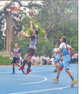
प्रतियोगिता में भाग लेती खिलाड़ी।

शनिवार को टूर्नामेंट की शुरुआत में एपीएस लखनऊ का मुकाबला एपीएस फतेहगढ़ से, एपीएस आगरा का मुकाबला एपीएस बरेली से हुआ। जिसमें एपीएस लखनऊ ने एपीएस