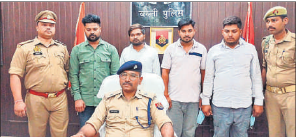
गिरफ्तार आरोपियों के बारे में जानकारी देते एसपी क्राइम।