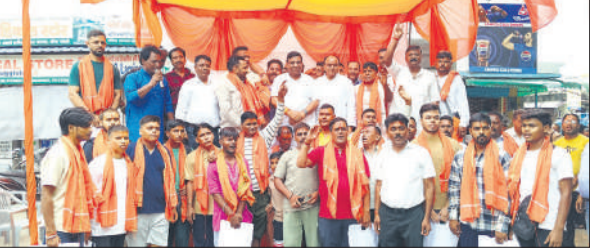
श्रद्धालुओं का स्वागत करके रावाना करते सांसद और विधायक।