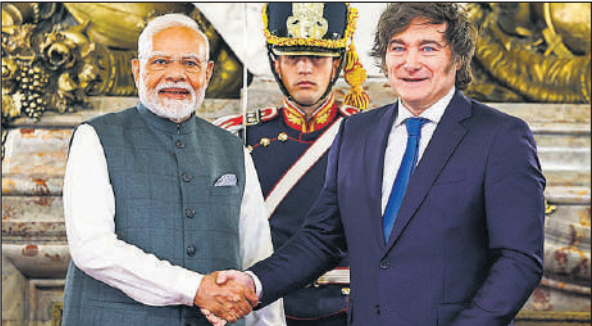
प्रधानमंत्री नरेन्द्र मोदी त्रिनिदाद एवं टोबैगो की अपनी समकक्ष कमला प्रसाद से मुलाकात करते हुए। (दाएं) अर्जेंटीना के राष्ट्रपति के साथ मोदी।

राष्ट्र सुरक्षा परिषद में अस्थायी सीट के लिए त्रिनिदाद और टोबैगो की उम्मीदवारी का समर्थन करेगा तथा यह द्वितीय राष्ट्र 2028-29 की अवधि