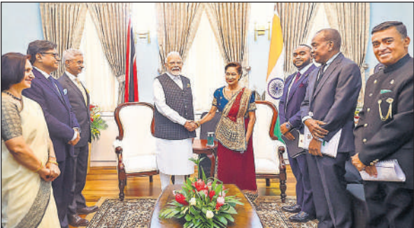
प्रधानमंत्री नरेन्द्र मोदी त्रिनिदाद एवं टोबैगो की अपनी समकक्ष कमला प्रसाद से मुलाकात करते हुए। (दाएं) अर्जेंटीना के राष्ट्रपति के साथ मोदी।

शनिवार को जारी संयुक्त बयान में कहा गया कि त्रिनिदाद और टोबैगो ने विस्तारित संयुक्त राष्ट्र सुरक्षा परिषद में स्थायी सदस्यता के लिए भारत को अपना पूर्ण समर्थन देने की पुष्टि की है। वैश्विक मुद्दों पर गहन विचार-विमर्श करते हुए मोदी और बिसेसर ने संयुक्त राष्ट्र में व्यापक सुधारों की आवश्यकता पर बल दिया, जिसमें संयुक्त राष्ट्र सुरक्षा परिषद का विस्तार भी शामिल है ताकि वर्तमान वास्तविकाओं को बेहतर ढंग से प्रतिबिंबित किया जा सके। संयुक्त वक्तव्य में कहा गया, बढ़ते भू-राजनीतिक तनाव और वैश्विक संघर्षों को स्वीकार करते हुए