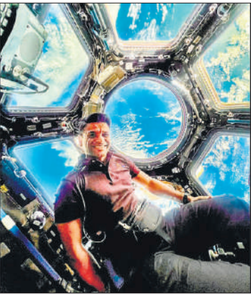
अंतर्राष्ट्रीय अंतरिक्ष स्टेशन पर शुभांशु शुक्ला।

शुभांशु के साथ अन्य अंतरिक्ष यात्री हुए शामिल, इससे पृथ्वी पर ऑस्टियोपोरोसिस के बेहतर इलाज की संभावना