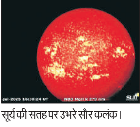
सूर्य की सतह पर उभरे सौर कलंक।

अभी तक की टेस्टिंग में आदित्य एल 1 के अधिकांश उपकरणों ने सटीक रिजल्ट दिए हैं। सूर्य की गतिविधि का डेटा प्रोसेसिंग का एक केंद्र हल्द्वानी में भी बनाया गया है। आर्यभट्ट प्रेक्षण विज्ञान शोध संस्थान