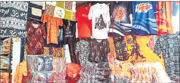
बाजार में कांवड़ियों के लिए टी-शर्ट भी आ गई है।

झंडों समेत सभी दुकानदार करीब 5 करोड़ रुपये का माल मंगाते हैं।