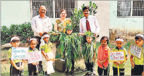
वन महोत्सव के दौरान शिक्षक और विद्यार्थी।