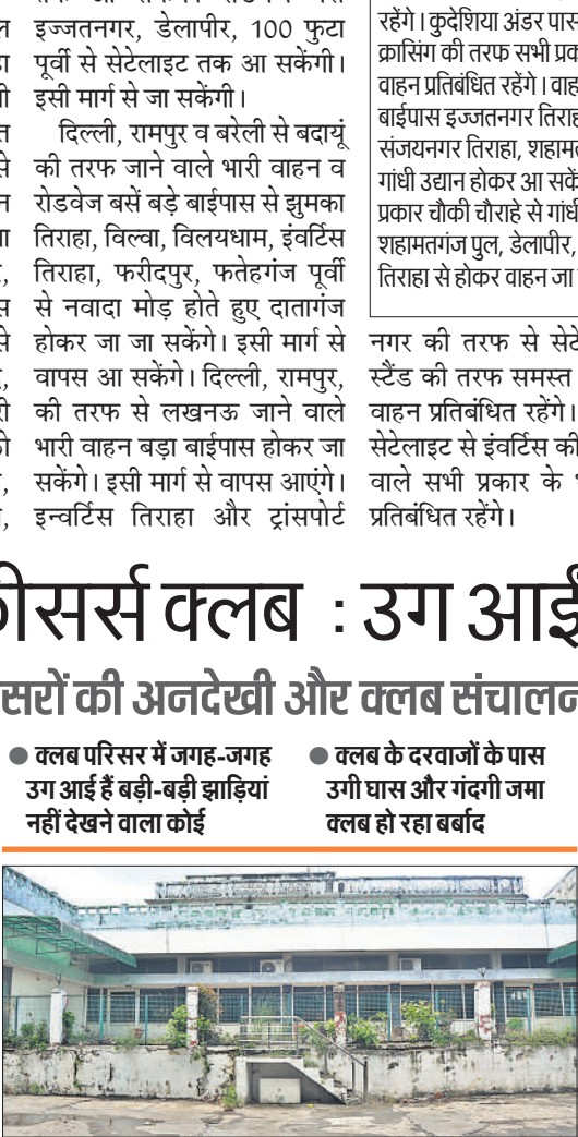
बदहाल स्थित में है बरेली ऑफीसर्स क्लब।

अमृत विचार : अनदेखी और क्लब संचालन के लिए कोई नीति नहीं बनाने की वजह से कभी एलन यूनियन क्लब के नाम से फेमस रहा बरेली ऑफीसर्स क्लब बदहाल है। लीज समाप्त होने के बाद शासन के निर्देश पर जब से क्लब की संपत्ति प्रशासन के कब्जे में आई है, तब से क्लब की सभी गतिविधियां ही नहीं ठप हुई, ताले तक नहीं खुलते हैं। युवाओं के लिए मनोरंजन के कई साधन भी तालों में कैद हैं। क्लब के अंदर लाखों के उपकरण खराब हो चुके हैं। परिसर में ऊंची-ऊंची झाड़ियां खड़ी हैं।