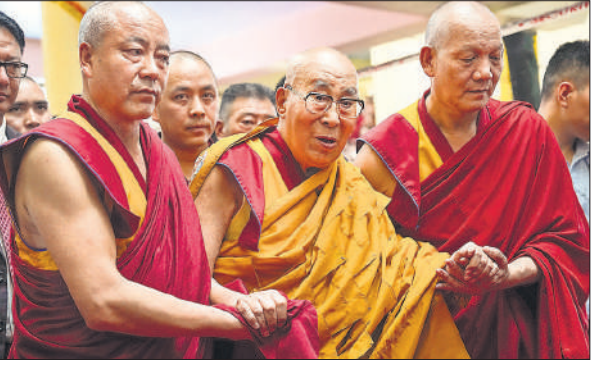
मैकलोडगंज में अपने जन्मदिवस के अवसर पर दलाई लाला।

तिब्बत के आध्यात्मिक गुरु ने कहा कि आपकी प्रार्थनाएं अब तक फलदायी रही हैं। बचपन से ही उन्हें लगता था कि उनका अवलोकितेश्वर से गहरा नाट है। उन्होंने कहा, मैं अब तक बुद्ध धर्म और तिब्बत के लोगों की अच्छी तरह से सेवा कर