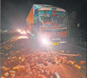
हादसे के बाद मौके पर खड़ा कंटेनर।