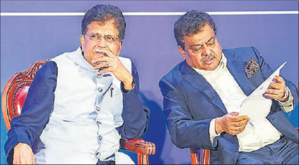
बेंगलुरु में कर्नाटक के मंत्री एमबी पाटिल के साथ केंद्रीय मंत्री पीयूष गोयल।

कांग्रेस नेता राहुल गांधी ने भारत-अमेरिका व्यापार सौदे पर प्रधानमंत्री मोदी पर दावा किया कि प्रधानमंत्री ट्रंप प्रशासन द्वारा निर्धारित शुल्क समयसीमा के आगे विनम्रतापूर्वक झुंकेंगे। गोयल ने शुक्रवार को कहा था कि भारत-अमेरिका के साथ प्रस्तावित व्यापार समझौते को तभी