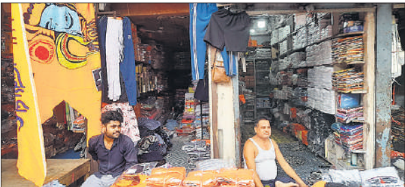
कांवड़ यात्रा से जुड़े सामान से दुकानें सज गई हैं।