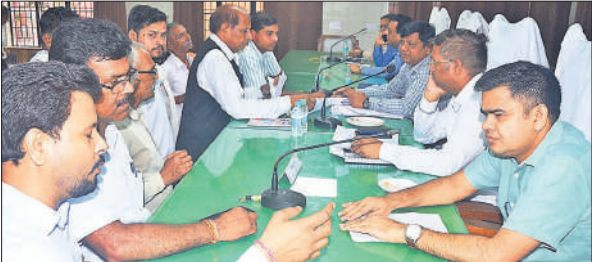
सदर तहसील में आयोजित समाधान दिवस में लोगों की समस्याएं सुनते अफसर।

किया गया था। बताया कि स्वतंत्रता सेनानी का नाम बरेली प्रशासन की ओर से छापी गई किताब में अंकित है। आजादी का अमृत महोत्सव के पोर्टल में भी नाम दर्ज है।