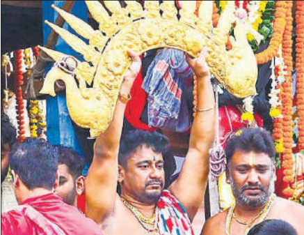
भगवान जगन्नाथ, बलभद्र और सुभद्रा को पहनाने के लिए सोने के आभूषण ले जाते सेवकजन।