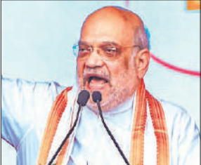
गुजरात के आणंद में आयोजित कार्यक्रम को संबोधित करते अमित शाह।

जवाहरलाल नेहरू विवि (जेएनयू) ने 2025-26 के लिए पीएचडी प्रवेश के दूसरे चक्र की घोषणा की और यह संभवतः दिसंबर में आयोजित होगा। विवि ने कहा कि यह प्रक्रिया यूजीसी/सीएसआईआर-जेआरएफ-नेट, डीबीटी-जेआरएफ, आईसीएमआर-जेआरएफ और अन्य ऐसी फेलोशिप के माध्यम से संचालित होगी। एक अलग अधिसूचना में जेएनयू के कुलसचिव ने शोधपत्र