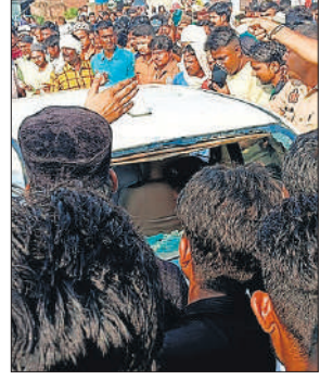
कार को धेकर खड़े लोग।

नवाबगंज, अमृत विचार : गांव गरगईया में हाईवे के पास एक तेज रफ्तार कार मोहर्रम के जुलूस में घुस गई, जिससे कई लोगों को हल्की- फुल्की चोटें लग गईं। जुलूस में शामिल लोगों ने आक्रोश जताते हुए कार के शीशे तोड़ दिए। लोगों ने बताया चालक शराब के नशे में था। पुलिस ने चालक सहित कार को अपने कब्जे में ले लिया और बाद में उसके माफी मांगने पर छोड़ दिया गया।