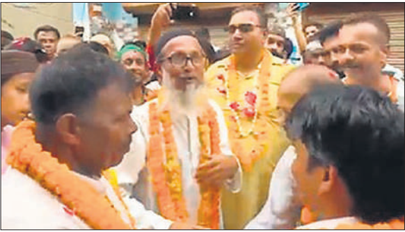
जुलूस में शामिल लोगों का स्वागत करते हिंदू समुदाय के लोग।