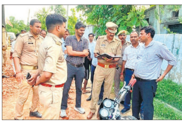
गांव दुआवट में लोगों से जानकारी लेते पुलिस अधिकारी।

सेंथल से सटे दुआवट गांव के ताजिये किसी समय गांव के ब्रह्मदेव स्थल के नजदीकी रास्ते से होकर सेंथल के कर्बला जाते थे, लेकिन दो साल से गांव के दूसरे समुदाय के लोग इस रास्ते से ताजिये ले जाने का विरोध कर रहे हैं, जिससे तनाव के हालात बने रहते हैं। विरोध पर पिछले साल पुलिस और प्रशासन ने इस रास्ते पर रोक लगाते हुए दूसरे रास्ते से ताजिये निकलवाने का प्रस्ताव रखा था। विवाद बढ़ने पर