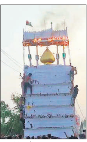
ताजिये में लगी आग।