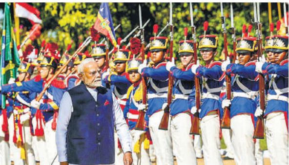
ब्राजील में प्रधानमंत्री नरेंद्र मोदी गाई ऑफ ऑनर दिया गया।

मोदी ने कहा कि दोनों पक्ष इस बात पर स्पष्ट हैं कि आतंकवाद पर दोहरे मापदंडों के लिए कोई जगह नहीं है। मोदी ने मीडिया को दिए अपने बयान में कहा, आतंकवाद के खिलाफ लड़ाई में हमारी सोच एक जैसी है, यथा- आतंकवाद को कतई बर्दाश्त नहीं करने की नीति और यह कि इसे लेकर दोहरा मानदंड नहीं अपनाया जाना चाहिए। उन्होंने कहा, हम आतंकवाद और