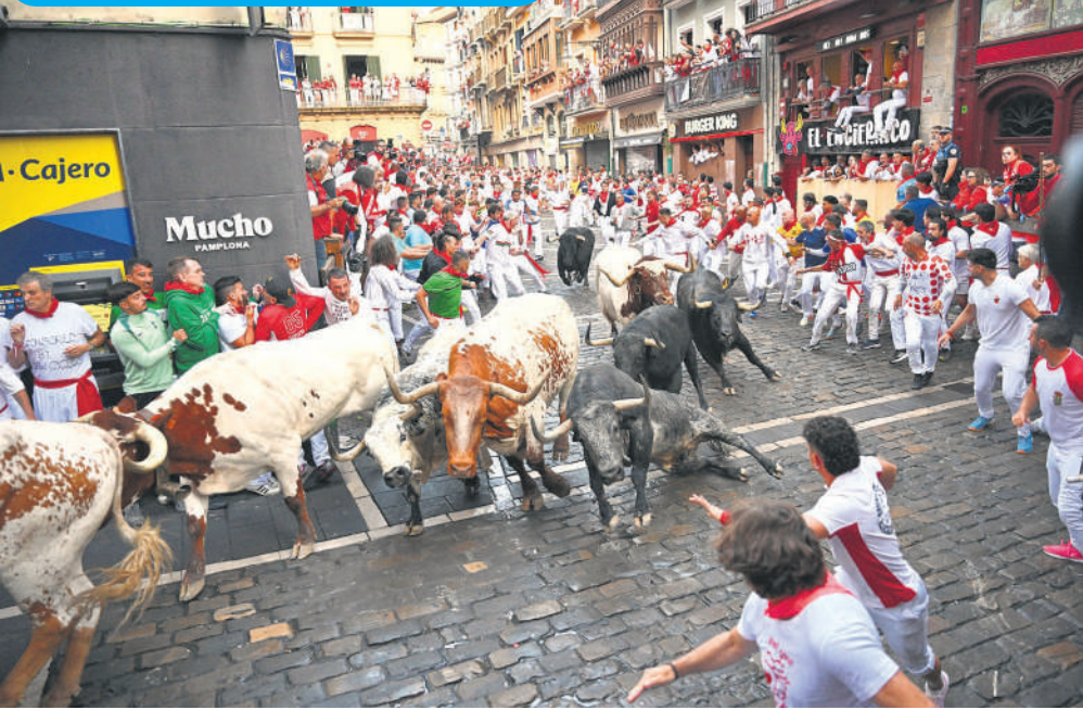
स्पेन के पैम्पलोना में सैन फर्माना उत्सव में बैल दौड़ के दूसरे दिन सेबाडा गागो खेत से बैलों के साथ दौड़ते लोग। स्पेन में यह एक लोकप्रिय उत्सव है जो पैम्पलोना शहर में होता है। इस उत्सव में लोग बैलों के एक समूह के सामने दौड़ते हैं जो उन्हें बुलरिंग तक ले जाने के लिए शहर की संकरी गलियों से होकर गुजरते हैं। इस खतरनाक खेल में हर साल कई लोग घायल हो जाते हैं, कुछ की जान भी चली जाती है।