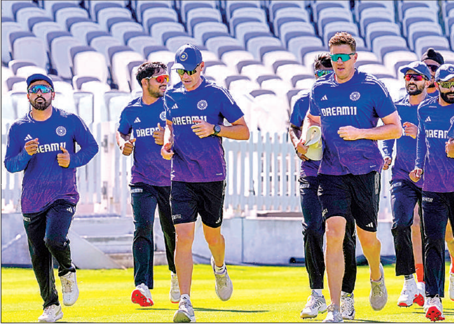
लंदन के लॉर्ड्स क्रिकेट ग्राउंड पर प्रशिक्षण सत्र के दौरान भारतीय खिलाड़ी।

लॉर्ड्स में चेतन शर्मा और कपिल देव की गेंदबाजी से मिली थी