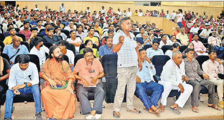
कांवड़ यात्रा के संबंध में बैठक में अपनी बात रखते जत्थेदार ।

समस्त सुविधाएं दी जाएंगी लेकिन कानून और शांति व्यवस्था बनाए रखने में सहयोग करें। परम्परागत रूट से हटकर कोई आयोजन न हो।