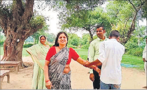
विलाप करती मृतक की मां।