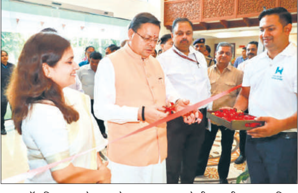
हाउस ऑफ हिमालयाज के आउटलेट का उद्घाटन करते सीएम धामी। ● अमृत विचार