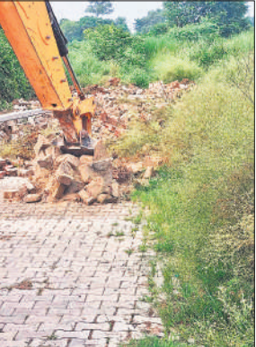
निर्माण को ध्वस्त करता बुलडोजर।