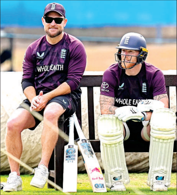
इंग्लैंड के कोच ब्रेंडन मैकुलम व कप्तान बेन स्टोक्स।

इंग्लैंड ने इस सप्ताह लॉर्ड्स में होने वाले तीसरे टेस्ट के लिए तेज और उछाल भरी 'जीवंत पिच' की मांग की है। इस मैच में जॉफ्रा आर्चर और गस एटकिंसन की वापसी हो सकती है। इसके साथ ही वे भारत से एजबस्टन में मिली 336 रन की बुरी हार से भी उबरना चाहते हैं। इंग्लैंड के कोच ब्रेंडन मैकुलम का मानना है कि एजबस्टन में तैयार की गई 'उपमहाद्वीप जैसी' पिच और टॉस पर गेंदबाजी चुनने का इंग्लैंड का फैसला भारत के पक्ष में गया। वे गुरुवार से शुरू हो रहे तीसरे टेस्ट में घरेलू हालात का बेहतर फायदा उठाने की कोशिश करेंगे। वे अपने तेज गेंदबाजी आक्रमण में बदलाव करने पर भी विचार कर रहे हैं क्योंकि इन गेंदबाजों को पिछले दो टेस्ट के दौरान मैदान पर काफी मेहनत करनी पड़ी है। पिछले महीने लॉर्ड्स में हुए विश्व टेस्ट चैंपियनशिप फाइनल के दौरान तेज गेंदबाजों का दबदबा दिखा था, जहां पैट कमिंस और कैगिसो रबाडा को अच्छी सीम मूवमेंट मिली थी। मैकुलम ने भी ऐसी ही पिच की मांग की है, जिसमें थोड़ी रफ्तार, उछाल और मूवमेंट हो। उन्होंने कहा यह मैच शानदार होगा, लेकिन अगर पिच में जान रही तो यह और भी जरूरदस्त होगा। 2018 में लॉर्ड्स की हरियाली भरी पिच पर भारत बुरी तरह फंस गया था, लेकिन चार साल पहले टीम ने यहां पर एक रोमांचक टेस्ट मैच भी जीता था। भारत बर्मिंघम में आराम