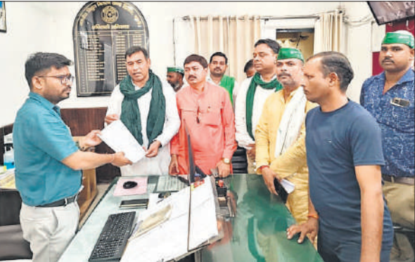
अधिशासी अभियंता को ज्ञापन देते किसान एकता संघ के पदाधिकारी।