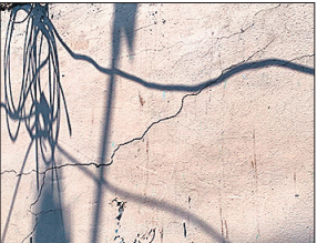
दीवार में दरार।