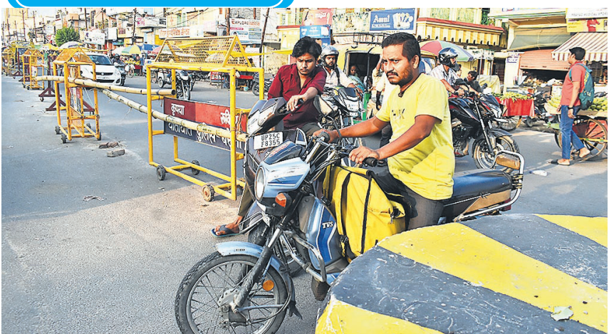
सावन में कांवड़ियों की भीड़ को देखते हुए रोड पर कट डाइवइडरों पर बैरीकेडिंग की गई थी, लेकिन लोगों ने निकलने के लिए बलियां तो कहीं बैरीकेडिंग को हटा दिया। इससे हादसे होने का डर है।