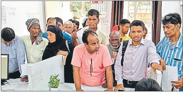
रामपुर गार्डन स्थित हेल्पडेस्क पर शिकायत करने पहुंचे लोग।

अमृत विचार : स्मार्ट मीटर उपभोक्ताओं के साथ अधिकारियों के लिए भी सिरदर्द बन गए हैं। बिल जमा होने के बाद बिजली कटने व पोस्टपेड से मीटर प्रीपेड होने उपभोक्ता परेशान हैं। अफसर स्मार्ट मीटर लगाने वाली कंपनी के कर्मचारियों को उपभोक्ताओं की समस्या का समाधान कराने को कह रहे हैं, लेकिन उनका बात को अनसुना किया जा रहा है। शहरी क्षेत्र में निजी कंपनी स्मार्ट मीटर लगाने का काम कर रही है। अब तक करीब 1 लाख स्मार्ट मीटर लग चुके हैं। समय सीमा से पहले ही स्मार्ट मीटर बांटे हुए उपभोक्ताओं के मकान की बिजली कट जा रही है। शिकायत लेकर रामपुर गार्डन में