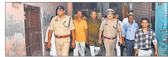
बारादरी थाना क्षेत्र में पैदल गश्त करते एडीजी और एसएसपी।

वनखंडीनाथ मंदिर का भ्रमण कर सुरक्षा व्यवस्था का जायजा लिया गया। वनखंडीनाथ मंदिर से गोसाईं गौटिया तिराहा, अल्वी चौराहा, शाहनूरी, हरी शाह की मजार, कब्रिस्तान तिराहा, मौयं गली होते हुए चक चुंगी तक पैदल भ्रमण किया गया। इस दौरान हिंदू-मुस्लिम