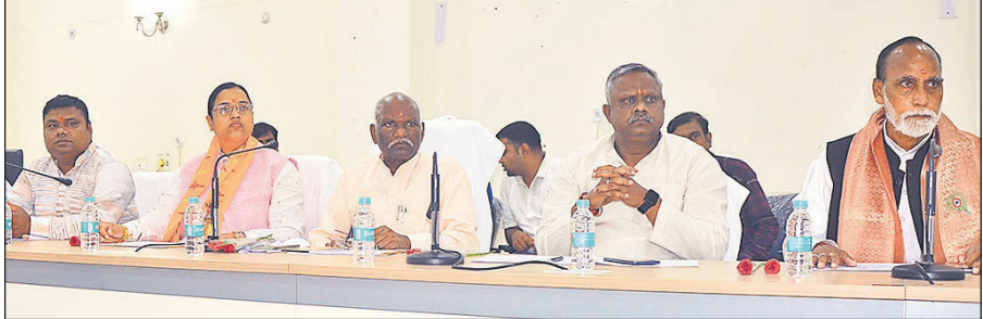
जनप्रतिनिधियों और अफसरों के साथ बैठक करते एससी-एसटी आयोग के अध्यक्ष बैजनाथ रावत।

पानी का सैंपल विभागीय अधिकारियों की ओर से नियमित परीक्षण के तहत जांच के लिए भेजा गया था। रिपोर्ट आने के बाद कॉलोनी में खलबली मच गई है। ई-कोलाई बैक्टीरिया की मौजूदगी से साफ है कि पानी में मल जनित तत्व मिले हुए हैं, जिससे डायरिया,