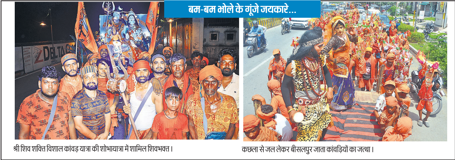
श्री शिव शक्ति विशाल कांवड़ यात्रा की शोभायात्रा में शामिल शिवभक्त।

84 गांव चयनित हैं, जिसमें से 20 गांव में कार्य हो चुका है। जनपद शाहजहांपुर ने बताया उनके यहां से 174 गांव चयनित हैं, जिसमें से 74 का पैसा मिला है, 20 गांवों का कार्य पूरा हो गया है। समिति ने कहा कि 70 साल की उम्र के बुजुर्गों के आयुष्मान कार्ड प्राथमिकता पर बनवाएं। बैठक में राष्ट्रीय पारिवारिक लाभ योजना, अनुसूचित जातियों क बेटियों के विवाह के लिए अनुदान योजना, मुख्यमंत्री सामूहिक विवाह योजना