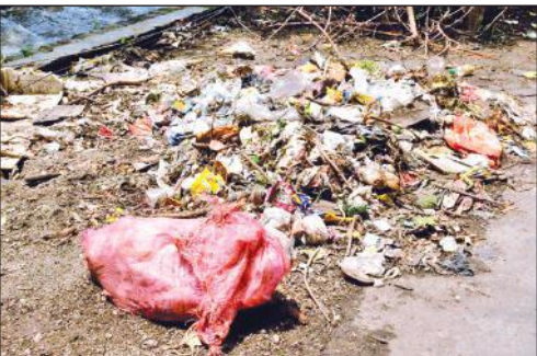
एसटीएच के पीछे वाली नहर के किनारे लगा कूड़े का ढेर ।