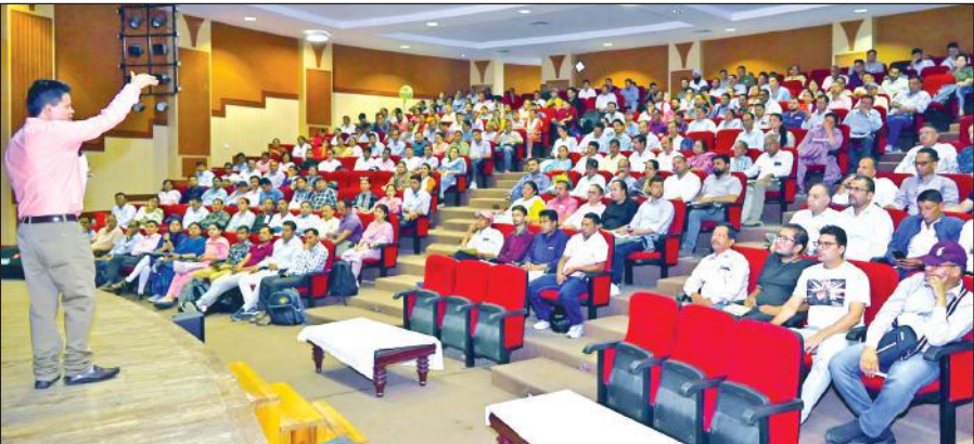
अल्मोड़ा में शुक्रवार को पोलिंग पार्टियों को प्रशिक्षण देते मास्टर ट्रेनर। ● अमृत विचार

प्रशिक्षण के दौरान मतदान कर्मियों को निर्वाचन से संबंधित सभी आवश्यक प्रक्रियाओं जैसे, मतपत्रों की तैयारी, पोलिंग स्टेशन की व्यवस्थाएं, मतदान