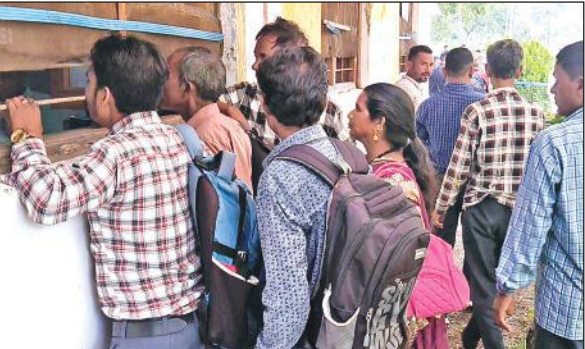
हवालबाग में चुनाव चिह्न लेने के लिए लगी प्रत्याशियों की भीड़।

चुनाव चिह्न लेने के लिए दूर दराज से आए ग्रामीणों और उनके समर्थकों की ब्लाकों में भीड़ जुटी रही। कई लोगों ने पूजा अर्चना के बाद चुनाव चिह्न लिया। चुनाव चिह्न