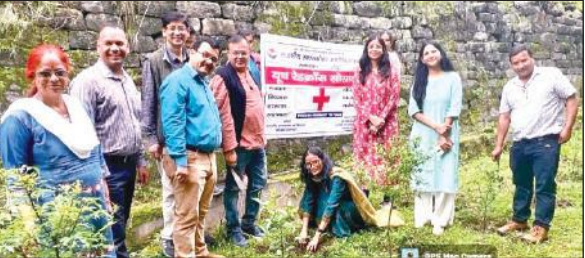
महाविद्यालय में पौधरोपण करते अध्यापक व छात्र।