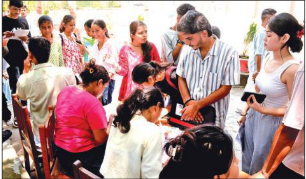
एमबीपीजी कालेज में प्रवेश को लेकर लगे स्टालों से एडमीशन फार्म लेती छात्रएं और छात्र ।

कॉलेज प्रशासन ने प्रवेश को सुगम बनाने के लिए संकायवार प्रवेश काउंटरों की व्यवस्था की है, जिससे विद्यार्थियों को बिना किसी परेशानी के प्रवेश मिल सके । इसके साथ ही, छात्रों और छात्राओं के लिए अलग-अलग प्रवेश काउंटर बनाए गए हैं,