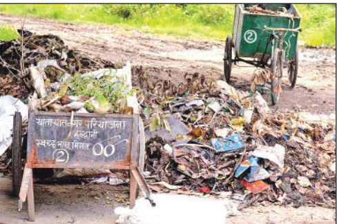
हल्द्वानी के टीपी नगर में पानी की टंकी के सामने डंप किया गया कूड़ा