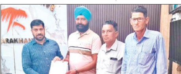
सीटीआर के निदेशक को ज्ञापन देते ग्रामीण।