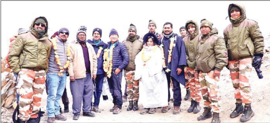
लिपुलेख पहुंचने पर यात्रियों के पहले दल का स्वागत करते आईटीबीपी के जवान।