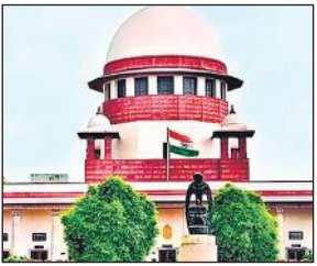
● केंद्र का दावा- एक मानक संचालन प्रक्रिया तैयार, यह रिकॉर्ड में मौजूद

केंद्र ने दावा किया कि इस मुद्दे पर एक मानक संचालन प्रक्रिया (एसओपी) तैयार की जा चुकी है