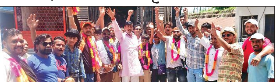
बाजपुर में ब्रह्मदेव-शनिदेव मंदिर के सामने कांवड़ यात्रा पर रवाना होने से पहले जयकारा लगाते शिवभक्त।