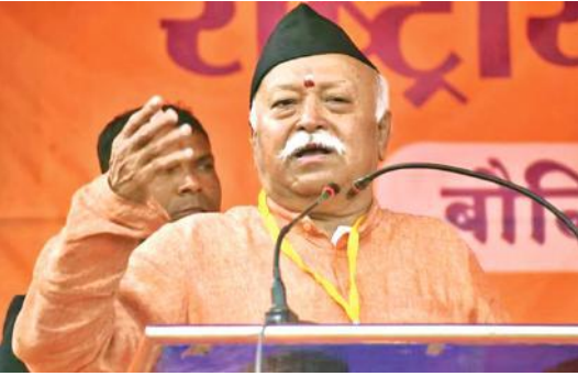
● सोलापुर में गैर-लाभकारी संगठन उद्योगवर्धनी के कार्यक्रम को किया संबोधित

उन्होंने कहा कि एक पुरुष अपनी मृत्यु तक काम करता है। एक महिला भी अंत तक काम करती है, लेकिन उससे भी आगे वह आने वाली पीढ़ियों को प्रेरित करती है। एक महिला के प्यार और स्नेह के तले बच्चे बढ़ते और परिपक्व होते हैं। आरएसएस प्रमुख ने कहा कि राष्ट्रीय विकास के लिए महिलाओं का सशक्तिकरण बेहद महत्वपूर्ण है। उन्होंने कहा कि ईश्वर ने