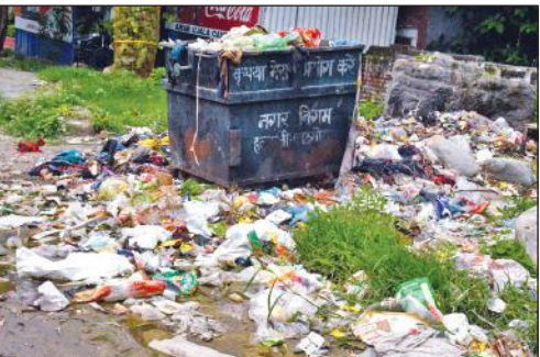
रामपुर रोड में एक कार शौ रूम के पास सड़क के किनारे लगा कूड़े का ढेर ।