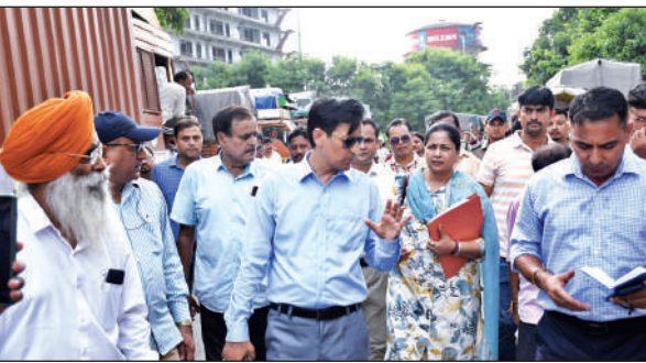
ट्रान्सपोर्ट नगर में निरीक्षण करते कुमाऊं कमिश्नर दीपक रावत ।

आयुक्त रावत ने सर्वप्रथम ट्रान्सपोर्ट नगर में आवंटित प्लॉट की समीक्षा की। उन्होंने कहा कि शिकायतें मिल रही हैं कि वर्कशॉप के लिए प्लॉट आवंटित किए गए हैं लेकिन फिर भी शहर में वर्कशॉप संचालित की जा रही हैं जिस वजह से शहर में ट्रैफिक का दबाव बना हुआ है। ऐसे वर्कशॉप संचालकों को चिह्नित किया जाए जिन्हें ट्रान्सपोर्ट नगर में प्लॉट आवंटित हैं लेकिन शहर में काम कर रहे हैं। उन्हें नोटिस जारी किए जाएं और यदि शिफ्टिंग नहीं करें तो सीलिंग की जाए। उन्होंने कहा कि यदि फिर भी