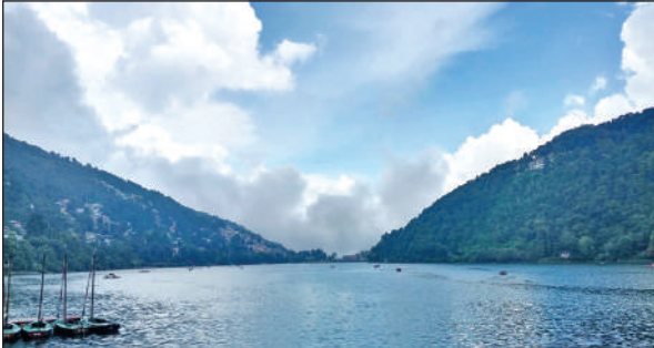
सरोवर नगरी में शुक्रवार सुबह चटख धूप तो दोपहर होते-होते बादल छाने शुरू हो गए थे।

अमृत विचार: जुलाई माह में अभी तक हुई सामान्य से काफी कम बारिश की वजह से उमस भरी गर्मी पड़ रही है। बारिश रुकने के साथ ही तापमान में काफी उछाल आया है। शुक्रवार को दोपहर के समय लोगों को मई-जून की गर्मी याद आ गई। हालांकि रात को झमाझम बारिश से मौसम सुहावना हो गया। शुक्रवार को धूप काफी तेज थी। दिन के समय उमस भरी गर्मी पड़ रही थी। धूप में रहना मुश्किल हो गया। अधिकतम तापमान 37.6 डिग्री सेल्सियस पहुंच गया जो सामान्य से पांच डिग्री ज्यादा है। न्यूनतम तापमान 26.4 डिग्री सेल्सियस रहा। दोपहर के समय लोग पसीने से तरबंद हो गए। शाम होने के बाद लोगों को गर्मी से राहत मिली। पहाड़ों में भी यही हाल है। मुक्तेश्वर में 25.1 डिग्री