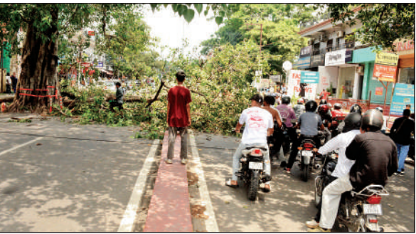
जजी कोर्ट के पास सड़क के बीच पीपल के पेड़ की लॉपिंग के बाद लगा जाम ।

पीपल के इस पेड़ की डालें सड़क की तरफ झुक गई थीं, जिस वजह से राहगीरों का निकलने में परेशानी हो रही थी। यहां एक बार हादसा भी हो चुका है। आगे हादसे न हों इसलिए पेड़ की लॉपिंग की गई। पेड़ की लॉपिंग किए जाने की वजह से सड़क पर जाम लग गया। जिसके बाद में