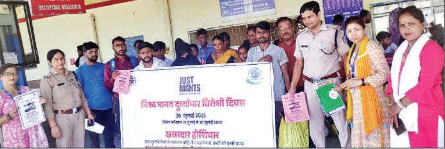
बाजपुर रेलवे स्टेशन पर यात्रियों को जागरूक करती संयुक्त टीम। ● अमृत विचार