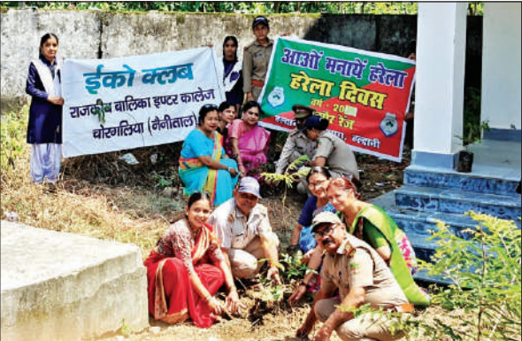
राजकीय बालिका इंटर कॉलेज चोरगालिया में पीधुरोण करते वन विभाग के कर्मचारी।