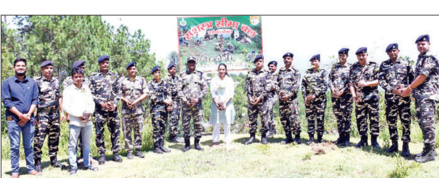
पौधरोपण कार्यक्रम के दौरान मौजूद सीमांत मुख्यालय के जवान व अधिकारी।