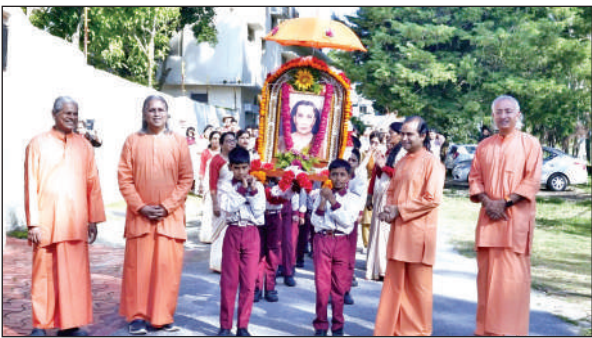
द्वाराहाट में स्मृति दिवस पर महावतार बाबा की शोभायात्रा निकालते भक्त।