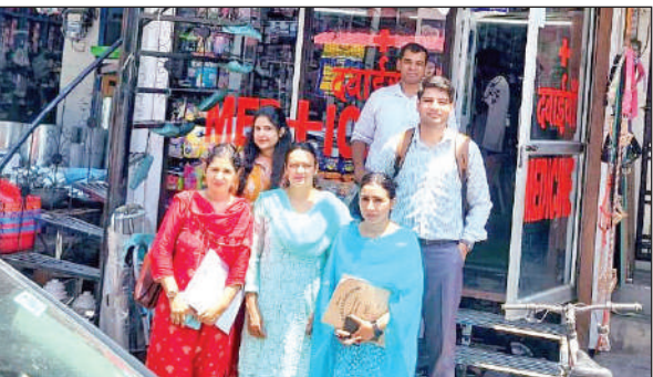
टनकपुर मेडिकल स्टोर में निरीक्षण के दौरान औषधि निरीक्षकों की टीम।

इसके तहत बनबसा के 13 और टनकपुर के 6 मेडिकल स्टोरों की जांच की गई। निरीक्षण के दौरान औषधि एवं प्रसाधन सामग्री अधिनियम, 1940 एवं नियम, 1945 के अंतर्गत अनुपालन की स्थिति पर विशेष ध्यान दिया गया। गुणवत्ता परीक्षण के लिए अंतरराष्ट्रीय ब्रांड की 7 दवाओं के