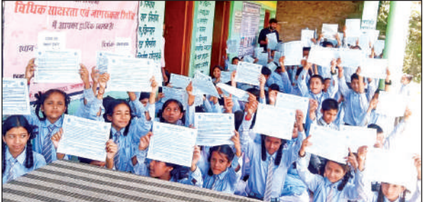
गोपेश्वर बाल निकेतन दौलाघट में जागरुकता शिविर में मौजूद छात्र-छात्राएं।

इस मौके पर छायादार और फलदार पौधों का रोपण भी किया गया। सचिव द्वारा दौलाघट में संचालित लीगल एड क्लिनिक का भ्रमण कर अधिकार मित्र को आवश्यक दिशा-निर्देश दिए गए।