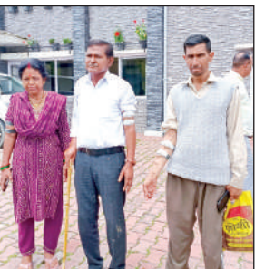
डीएम कार्यालय पहुंचे फरियादी।

मरीजों के परिजनों ने कलेक्ट्रेट पहुंचकर जिलाधिकारी से सड़क जल्द दुरुस्त करने की मांग की। तीमारदारों ने बताया कि एंजुलेंस चालक खराब सड़क के कारण मरीज को जिला अस्पताल में ही उतार दे रहे हैं, जिससे मरीज की जान पर बन आती है। कुछ माह पूर्व यह सड़क जीजीआईसी के पास से टूट गई थी, जिसे दीवार