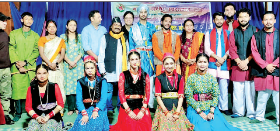
हरू हीत नाटक के कलाकार।