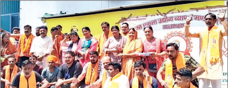
सशक्त एकता उद्योग व्यापार मंडल ने कांवड़ियों का स्वागत किया। | ● अमृत विचार