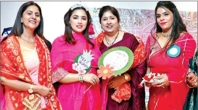
काशीपुर में तीज के दौरान हुई प्रतियोगिता में विजेता महिलाएं । ● अमृत विचार

रॉयल पंजाबी ग्रुप और महानगर महिला कांग्रेस ने आयोजित किये तीज महोत्सव, महिलाओं में रहा उत्साह