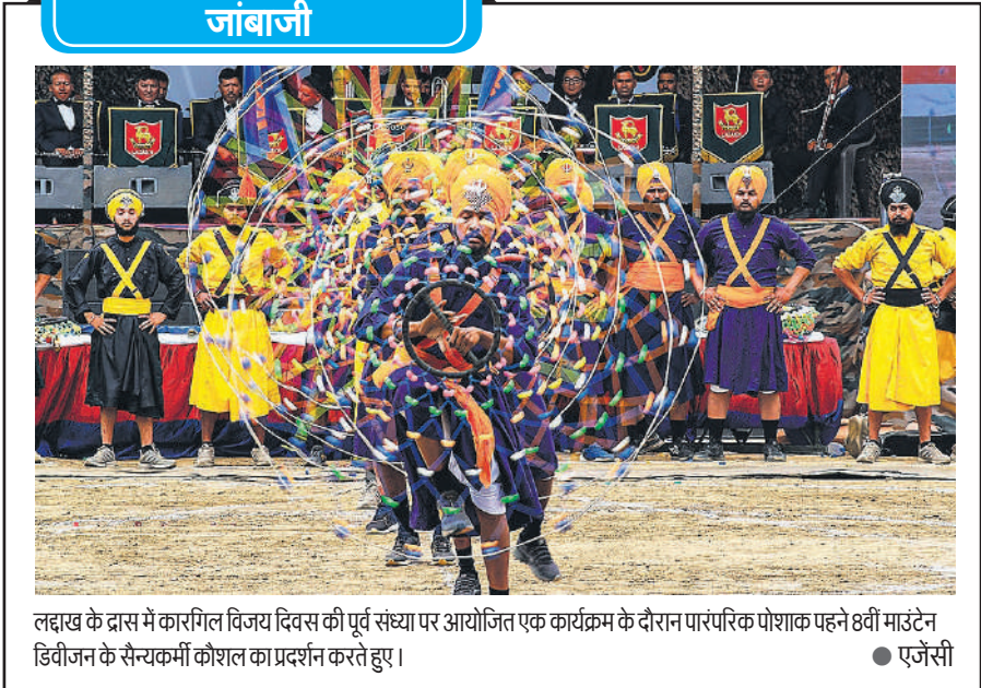
लहख के द्रास में कारगिल विजय दिवस की पूर्व संस्था पर आयोजित एक कार्यक्रम के दौरान पारंपरिक पोशाक पहने 8वीं माउंटन डिवीजन के सैन्यकर्मों कोशल का प्रदर्शन करते हुए ।

चर्चा होगी। राज्यसभा की बीएसपी बैठक में पहले ही यह तय हो चुका है कि अगले सप्ताह उच्च सदन में पहलगाम आतंकी हमले और ऑपरेशन सिंदूर पर चर्चा होगी। लोकसभा में आज पूर्वाह्न 11 बजे जैसे ही अध्यक्ष ओम बिरला ने प्रश्नकाल शुरू कराया, विपक्षी दलों