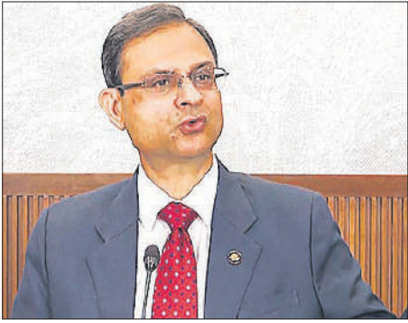
● एफई मॉडर्न बीएफएसआई शिखर सम्मेलन में कहा बहुपक्षवाद अब बीते दिनों की बात

मल्होत्रा ने कहा, उम्मीद है कि ब्रिटेन के साथ एफटीए से हमें मदद मिलेगी... अब आगे बढ़ने का यही रास्ता है, क्योंकि दुर्भाग्य से बहुपक्षवाद पीछे छूट गया है। उन्होंने साथ ही कहा कि अमेरिका के साथ बातचीत काफी आगे बढ़ चुकी है। आरबीआई के गवर्नर ने कहा कि वर्तमान वास्तविकताओं को