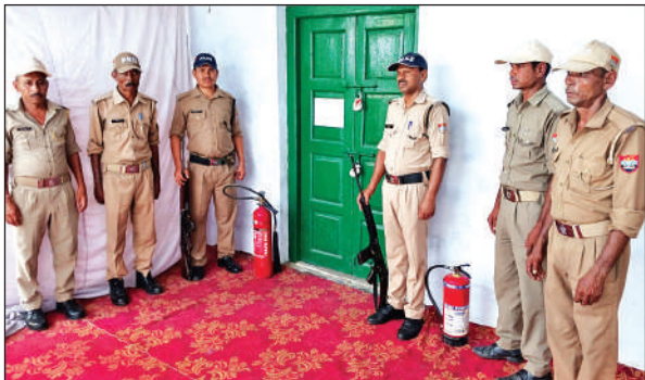
इंटरमीडिएट कॉलेज बाजपुर में बने स्ट्रांग रूम के बाहर तैनात आईआरबी, पुलिस।