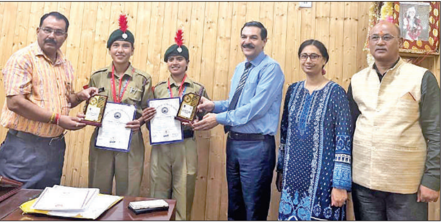
अल्मोड़ा में एनसीसी कैडेट्स को सम्मानित करते कुलपति। ● अमृत विचार