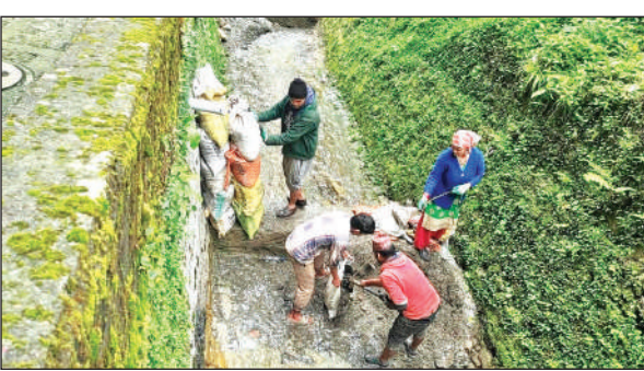
मल्लीताल नाला नंबर 20 से मलबा हटाने सिंचाई विभाग के कर्मचारी। (फाइल)

नालों के जरिए नैनी झील में गंदगी पहुंचने का क्रम लगभग चार दशकों से जारी है। झील में समाने वाला तमाम तरह का कूड़ा कचरा झील को दूषित तो कर ही रहा है, साथ ही झील के ईको सिस्टम को भी प्रभावित कर रहा है। नगर के ऊपरी क्षेत्रों में भवन निर्माण के दौरान चोरी छिपे मलबा बरसात आते ही नालों में डाल दिया जाता