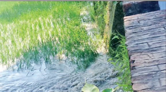
खटीमा के नदना में सिंचाई नहर टूटने से खेतों में भरा पानी। ● अमृत विचार