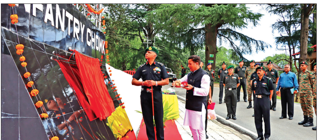
रानीखेत में इन्फैंट्री चौक का उद्घाटन करते ब्रिगेडियर एसके यादव ।