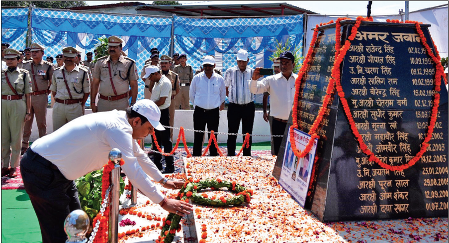
शहीद स्मारक पर पुष्पचक्र अर्पित करते डीएम। ● अमृत विचार