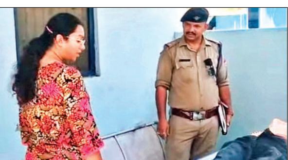
किच्छ के सरकारी अस्पताल में चिकित्सक से जानकारी लेते पुलिस अधिकारी।