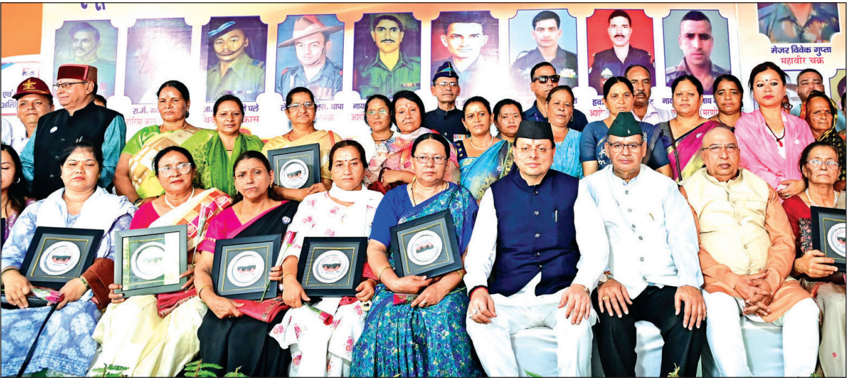
कारगिल विजय दिवस पर देहरादून में आयोजित समारोह में सम्मानित वीरांगनाओं के साथ मुख्यमंत्री पुष्कर सिंह धामी और सैनिक कल्याण मंत्री गणेश जोशी ।