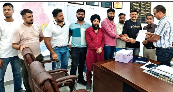
एमएनए को ज्ञापन सौंपते व्यापारी। ● अमृत विचार

उन्होंने एमएनए से कार्रवाई किए जाने की मांग की। वहीं दूसरी ओर शहरी इलाकों में हो रही लगातार अघोषित विद्युत कटौती के कारण व्यापारी हो या फिर आम जनमानस परेशान हो चुका है। मुख्य बाजार में