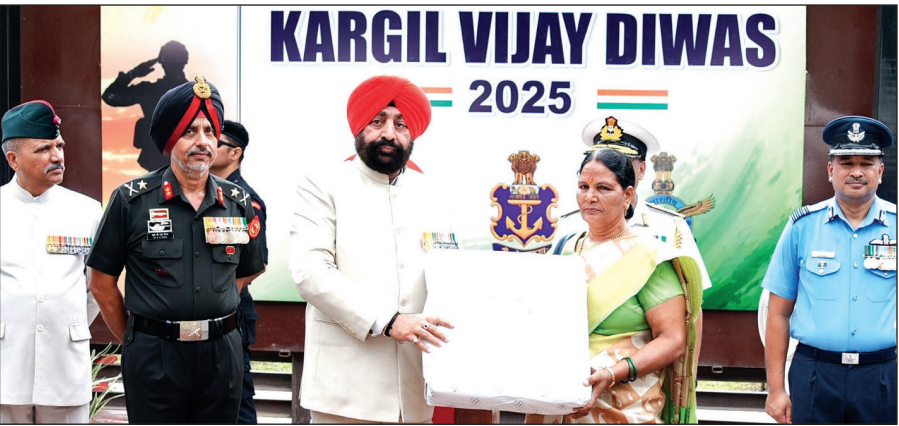
कारगिल विजय दिवस पर वीर नारी को सम्मानित करते राज्यपाल गुरमीत सिंह ।

यह विजय प्रत्येक भारतीय के लिए गौरव का विषय है । राज्यपाल सिंह ने कहा कि यह दिवस न केवल शौर्य और बलिदान की गाथा को याद करने का अवसर है, बल्कि यह हमें यह भी प्रेरणा देता है कि हम प्रत्येक परिस्थिति