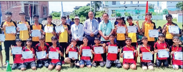
खटीमा के हिंद पब्लिक स्कूल में खो-खो विजेताओं के साथ प्रबंधन।