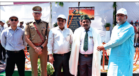
घायल सैनिक को अंग वस्त्र देकर सम्मानित करते महापौर, डीएम, एसएसपी।