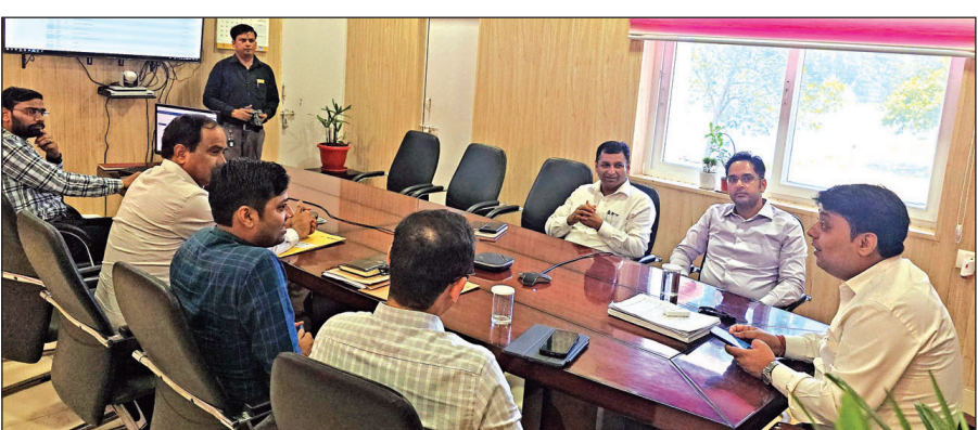
मतदान-मतगणना कार्मिकों का रेंडमाइजेशन करते डीएम। ● अमृत विचार

अमृत विचार: त्रिस्तरीय पंचायत चुनाव मतदान के पहले चरण की समाप्ति के बाद अब पुलिस प्रशासन ने दूसरे चरण की तैयारी भी पूरी कर ली है। साथ ही मतदान केंद्रों की कड़ी सुरक्षा का खाका भी बना लिया है। जिसके चलते भयमुक्त होकर मतदाता मताधिकार का प्रयोग करेगा। वहीं दूसरे चरण के पंचायती