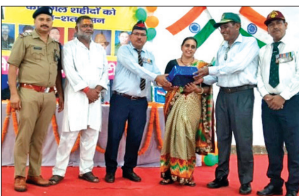
खटीमा में आयोजित कार्यक्रम में वीरंगना को सम्मानित करते संगठन के पदाधिकारी।