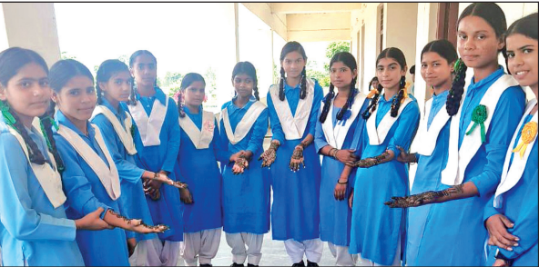
बाजपुर के विद्यालय में हाथों पर रचाई गई मेहंदी दिखाती छात्राएं।