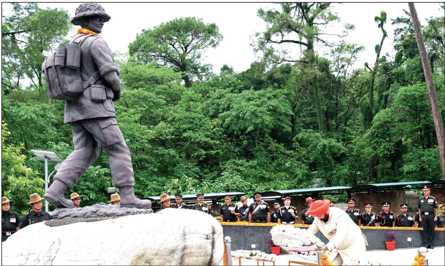
चीड़बाग, देहरादून स्थित शौर्य स्थल में शहीद स्मारक पर पुष्पचक्र अर्पित करते राज्यपाल गुरमीत सिंह ।

उत्तराखंड में यूसीसी लागू होने से पहले, उत्तराखंड विवाह पंजीकरण अधिनियम-2010 के तहत शादियों का पंजीकरण होता था लेकिन तब बहुत कम लोग पंजीकरण कराते थे। वर्ष 2010 से लागू इस एक्ट के तहत, 26 जनवरी 2025 तक 3,30,064 विवाह पंजीकरण हुए, पुराने एक्ट के अनुसार प्रतिदिन औसत विवाह पंजीकरण की संख्या