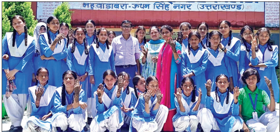
जसपुर के महुआडाबरा में मेहंदी प्रतियोगिता में प्रतिभा दिखाती छात्राएं।