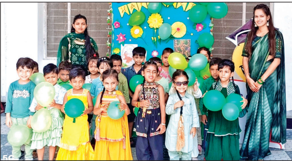
किच्छ ने सुंदर वेशभूषा में सजे नरहे मुन्ने बच्चे।