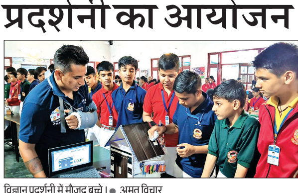
विज्ञान प्रदर्शनी में मौजूद बच्चे । ● अमृत विचार