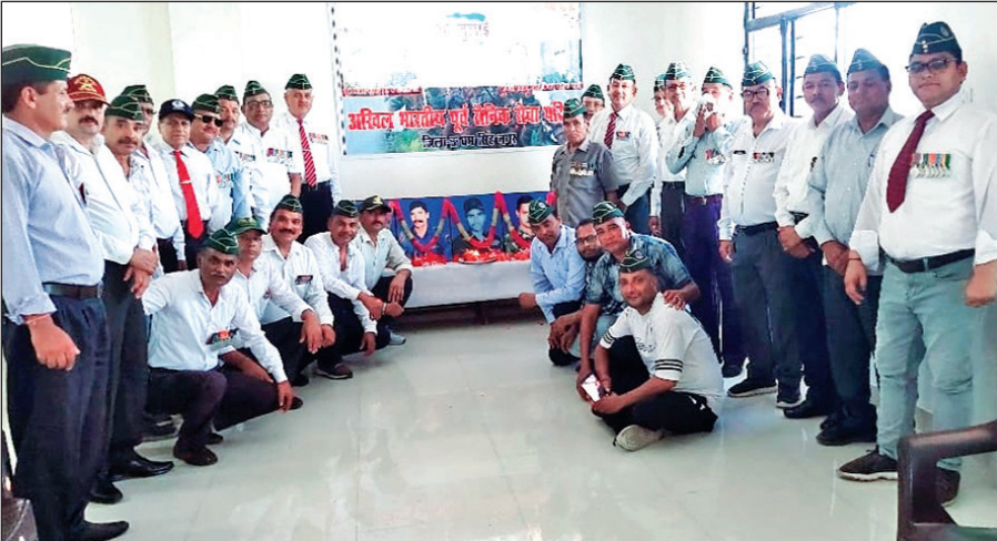
दिनेशपुर के सैनिक भवन चक्कीमोड़ में कारगिल विजय दिवस पर आयोजित कार्यक्रम में शामिल पूर्व सैनिक।