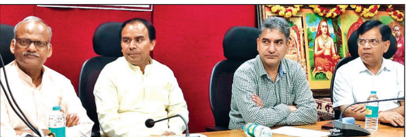
कैंपस में आयोजित बैठक में प्रतिभाग करते संस्कृत शिक्षा मंत्री डॉ. धन सिंह रावत ।

देहरादून : मुख्यमंत्री के नेतृत्व में बीते चार वर्षों में प्रदेश सरकार ने सैनिकों, पूर्व सैनिकों और उनके परिवारों के सम्मान और कल्याण के लिए कई अहम फैसले लिए हैं । अमर बलिदानियों की स्मृति में देहरादून में भव्य शौर्य स्थल (सैन्य धाम) का निर्माण कार्य अंतिम चरण है । इस सैन्य धाम में प्रदेश भर की 28 नदियों का जल और शहीद सैनिकों के घरों से लाई गई मिट्टी को समाहित किया गया है । शहीद सैनिक के एक परिजन को सरकारी नौकरी दी जा रही है । अग्निवीरों को सरकारी नौकरियों में 10 फीसदी क्षैतिज आरक्षण की तैयारी है ।