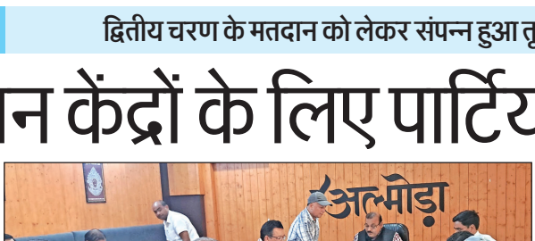
अल्मोड़ा कलक्ट्रेट में पंचायत चुनाव को लेकर कर्मिकों का रेंडमाइजेशन करते डीएम ।

जनपद के 5 विकासखंडों के लिए कुल 632 मतदान केंद्रों के लिए मतदान पार्टियों का गठन किया गया, जिनमें अतिरिक्त रूप से 65 पार्टियां रिजर्व रखी गई हैं। इस प्रकार कुल 697 मतदान पार्टियों के गठन के लिए तृतीय