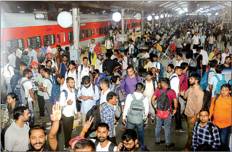
शनिवार रात सेंट्रल स्टेशन पर हजारों परीक्षार्थी पहुंच गए।