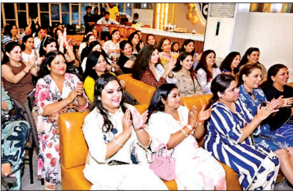
जेसीआई के कार्यक्रम में मौजूद अतिथि।

कानपुर। कंधी मोहाल का बुरा हाल है, जरा सी बारिश में मदरसा इखानुल मुसलमीन के आसपास भीषण गंदगी होने के कारण लोग परेशान रहते हैं। कागजी मोहाल का भी यही हाल है, मछली तिराहा, हीरामनुपुरवा में भी गंदगी फैली है।