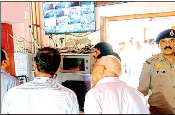
अकबरपुर इंटर कालेज में सीसीटीवी कंट्रोल रूम का निरीक्षण करते डीएम, एसपी।