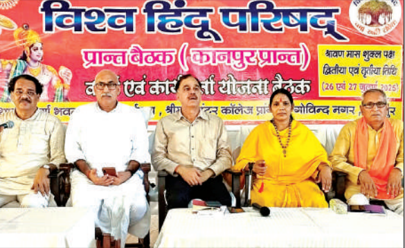
विहिप की बैठक में मंच पर मौजूद अतिथि।

■ दादानगर से विजयनगर जाने वाली सड़क बदहाल होने से आवागमन में आ रही समस्या के समाधान के लिए संयुक्त निरीक्षण किया जाएगा। उद्यमियों के साथ जिला उद्योग केंद्र के अधिकारी तथा जल निगम के अधिकारी के साथ मेट्रो के अधिकारियों को संयुक्त निरीक्षण करके रिपोर्ट देने के लिए कहा गया। बैठक में बताया गया कि दादानगर से विजयनगर जाने वाली सड़क पाइप लाइन डालने के बाद बर्बाद हो गई है। सड़क गायब हो चुकी है सिर्फ मिट्टी ही मिट्टी पड़ी है जिस पर बारिश से इतना ऊबड़-खाबड़ हो गया है कि पैदल चलना भी दुश्वारा है।