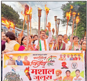
मशाल जुलूस में शामिल लोग।