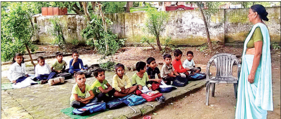
पैलावर प्राथमिक विद्यालय में खुले मैदान में पढ़ते बच्चे।

कि उनके पास शैक्षणिक चार्ज है। विद्यालय के तीन मूल भवन के अलावा दो अतिरिक्त कक्ष हैं। दो कक्षों की दीवारों में चटकन की