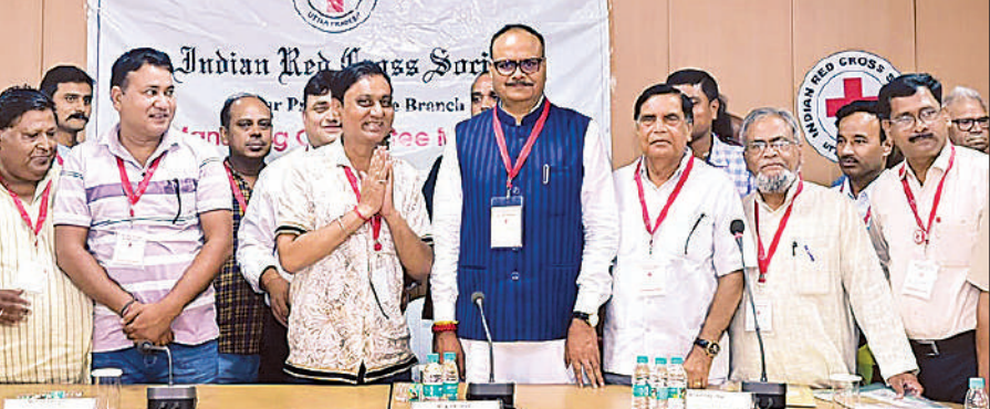
लखनऊ में आयोजित कार्यक्रम में शामिल उप मुख्यमंत्री ब्रजेश पाठक व रेडक्रॉस सोसाइटी के पदाधिकारी।

अमृत विचार, लखनऊ : सपा ने शनिवार को पूरे प्रदेश में आरक्षण दिवस को संविधान मानस्तंभ दिवस के रूप में मनाया। सपा प्रमुख अखिलेश यादव ने कहा है कि भारत के संविधान की प्रति के सान्निध्य में संविधान मानस्तंभ स्थापना दिवस आयोजित करके हम ‘सामाजिक न्याय’ व समता-समानता’ और आरक्षण को बचाए-बनाए रखने का अपना संकल्प दोहरा रहे हैं। इसके पीछे यही मूल भावना है कि संविधान मानस्तंभ वस्तुतः पीडीए प्रकाशस्तंभ के रूप में हमारे सामाजिक न्याय के राज की स्थापना के संकल्प का मार्ग सदैव प्रकाशित और प्रशस्त करता रहे। जब संविधान बचेगा तभी आरक्षण बचेगा। संविधान ही ढाल है, संविधान ही कवच है।