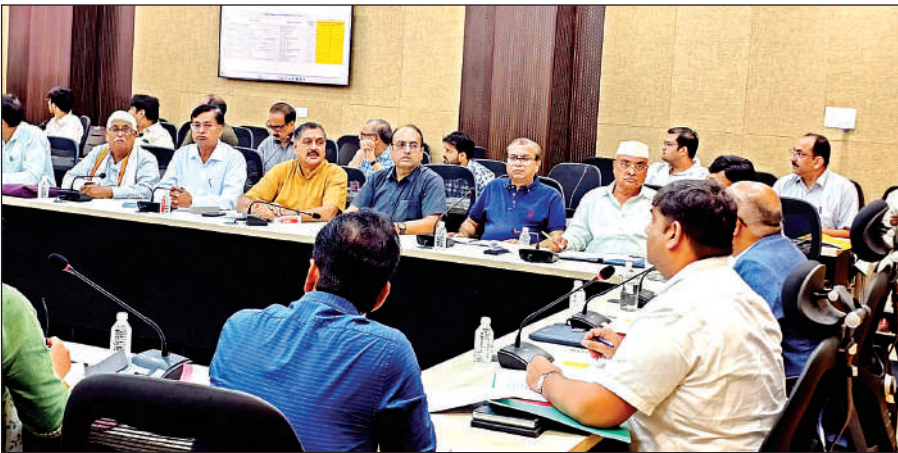
जिला उद्योग बंधु की बैठक में मौजूद अधिकारी और उद्यमी।