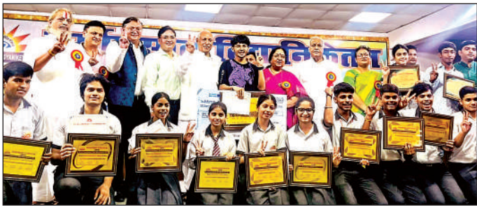
मेधावियों के साथ मौजूद अतिथि और स्कूल स्टाफ।