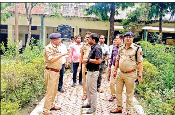
पुखरायां में परीक्षा केंद्र का निरीक्षण करते एसपी व अन्य अधिकारी।