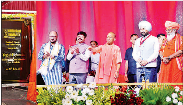
रिमोट का बटन दबाकर यूनिवर्सिटी का उद्घाटन करते सीएम योगी आदित्यनाथ।

सीएम ने कहा कि यह यूनिवर्सिटी प्रदेश की पहली ऐसी संस्था है जिसमें युवाओं को एआई तकनीक से शिक्षा पाने का अवसर मिलेगा। यहां से पढ़कर निकलने वाले छात्र-छात्राएं जिले के अलावा प्रदेश व देशभर में अपना नाम रोशन करते हुए विभिन्न क्षेत्रों में अपनी छाप छोड़ेंगे। सीएम ने उन्नाव को कलम और तलवार की धरती बताते हुए यहां के वीर सपूतों, साहित्यकारों व राजनीतिक