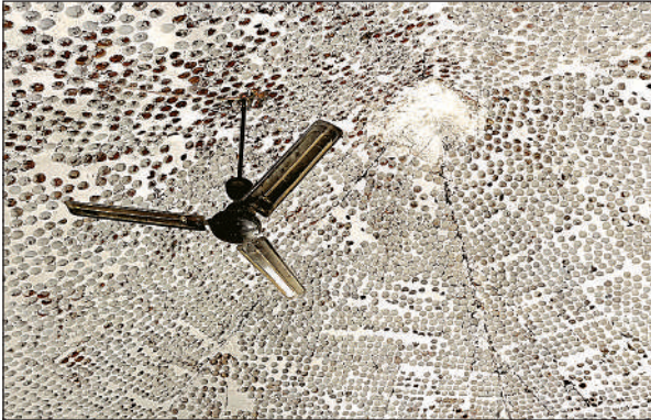
पैलावर स्कूल की जर्जर छत।

राजपुर ब्लॉक क्षेत्र के कई उच्च व प्राथमिक विद्यालयों के भवन जीर्ण शोर्ण होने से सुचारू तरीके से कक्षाएं संचालित नहीं हो पा रही हैं। ऐसे में बच्चों को खुले मैदान में बैठना पड़ रहा है। क्षेत्र के पैलावर प्राथमिक विद्यालय की छत पर बारिश में सीलिंग हो जाती है। इसके अलावा कक्षों की दीवारें चटकने से हादसे का डर बना है। जिसके