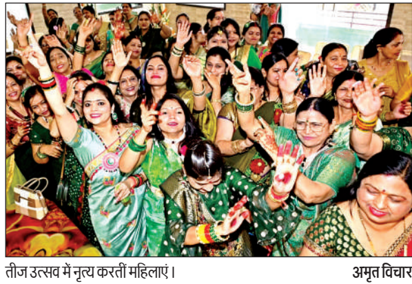
तीज उत्सव में नृत्य करती महिलाएं।