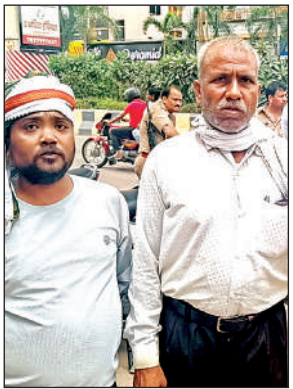
घटना की जानकारी देते बच्चे के बाबा।