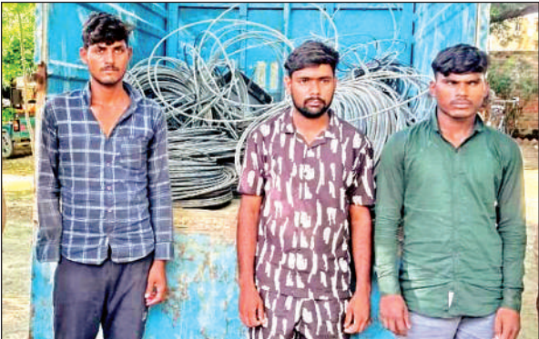
लोडर में चोरी हुए विद्युत तार व आरोपी।

बता दें कि रूरा थाना क्षेत्र के सिटमरा गांव में 26 विद्युत पोलों से चोरों ने तार चोरी कर लिए थे। उसी एक लोडर में लादकर मैथा से कानपुर बेचने के लिए जा रहे हैं। जिसपर पुलिस ने अलियापुर अंडरपास पर जाल बिछाया और लोडर वाहन को घेरकर पकड़ लिया। पकड़े गए लोडर में 17