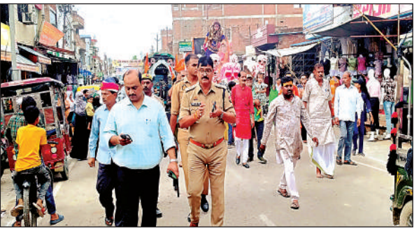
पुखरायां में भोलेनाथ की यात्रा में एसडीएम और सीओ मुस्तैद रहे।

अमृत विचार। कस्बा के नेतरामगली स्थित आनंदेश्वर धाम से महिलाओं व भक्तों ने सावन माह के पहले दिन विभिन्न सजीव झाकियों के साथ भोलेनाथ की यात्रा नगर भ्रमण के लिए निकाली। इस दौरान भक्त देव गीतों पर झूमते रहे। आनंदेश्वर धाम से सावन माह के प्रथम दिवस पर भक्तों ने पूजा-अर्चना के बाद भोलेनाथ के जयकारे लगाए। इसके बाद जागरण पार्टी के कलाकारों ने भगवान भोलेनाथ, माता पार्वती, अर्द्धनारी, बजरंगबली की सजीव झाकियों सहित यात्रा निकाली, जो मुख्य मार्ग से होकर बड़े महादेवन मंदिर, मोहर माता मंदिर, रेलवे स्टेशन तिराहा, टॉकीज व मंडी मोड़, बस स्टैंड, मोरपुर के आनंदेश्वर धाम से वापस सराफा