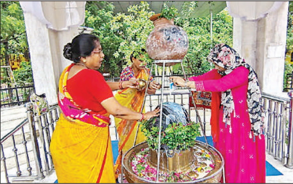
बालूघाट स्थित मंदिर में महाकाल की पूजा-अर्चना करती महिलाएं।

नगर के प्रसिद्ध गायत्री शक्तिपीठ महाकाल शिव मंदिर, पोनी रोड स्थित झंडेश्वर मंदिर, कंचन नगर स्थित कंचनामाई मंदिर, राजधानी मार्ग का प्राचीन दुर्गा मंदिर, सीताराम कॉलोनी, सुभाष नगर, ऋषि आश्रम, चंपापुरवा, गोपीनाथपुरम स्थित भाग्येश्वर मंदिर, देवारा क्षेत्र के वीर भद्रेश्वर मंदिर, तथा बालूघाट के आनंदेश्वर मंदिर समेत विभिन्न शिवालयों में भगवान भोलेनाथ का शाही श्रृंगार कर श्रद्धालुओं ने विशेष पूजन किया। सावन के पहले दिन को लेकर श्रद्धालु दूर-दराज से गंगा स्नान के लिए शुक्लागंज पहुंचे। मिश्रा कॉलोनी से लेकर जाजमऊ चंदन घाट तक बड़ी संख्या में श्रद्धालु गंगा में आस्था की डुबकी