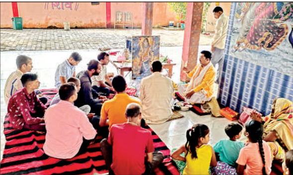
जागेश्वर मंदिर में ओम नमः शिवाय का जाप शुरू।

● सावन के पहले दिन मंदिर में दिन भर गूंजते रहे जयकारे