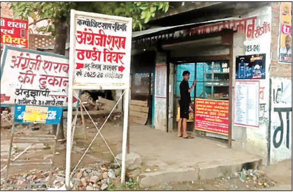
अंग्रेजी शराब की दुकान।

सावन मास के प्रथम दिन अंग्रेजी शराब ठेके की दुकान के पास स्थित शिव मंदिर में जब गांव की महिलाएं सुबह पूजा अर्चना करने के लिए मंदिर पहुंची तो सुबह 7 -8 बजे शराबियों का जमावड़ा लगा देखा। गांव के कुछ शराबी वहां शराब पी रहे थे। शराब पी रहे लोगों ने महिलाओं के साथ अश्लीलता कर दी। इसके