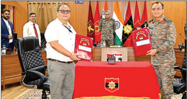
एमओयू करते आईआईटी और सेना के अधिकारी।