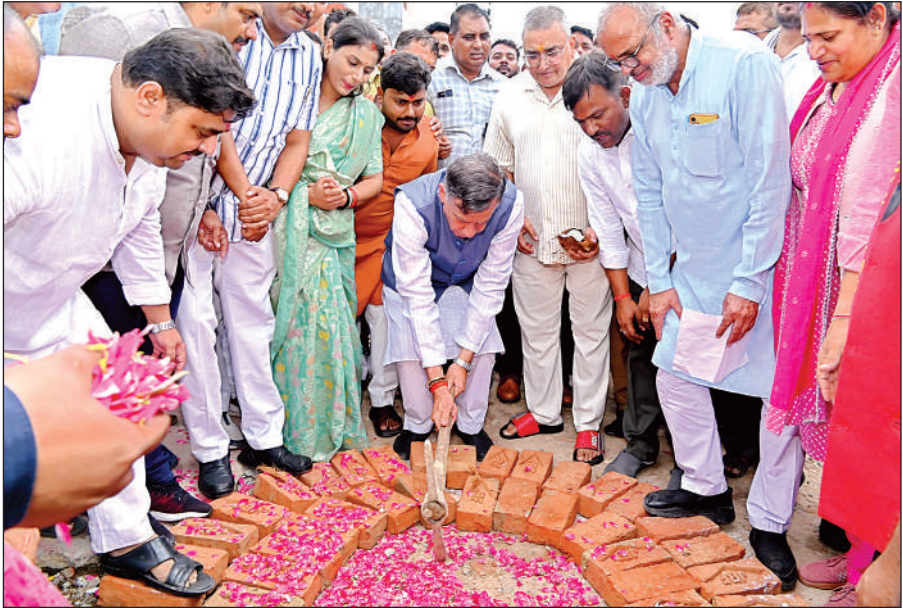
विधानसभा अध्यक्ष सतीश महाना ने कार्य का किया शिलान्यास।