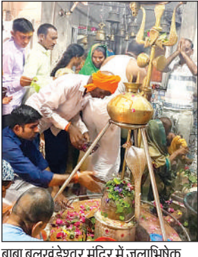
बाबा बलखंडेश्वर मंदिर में जलाभिषेक करते श्रद्धालु।