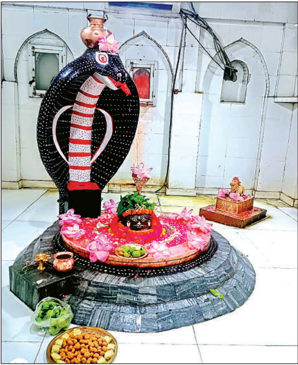
शिवली के जागेश्वर मंदिर में शिवलिंग का श्रृंगार किया गया।