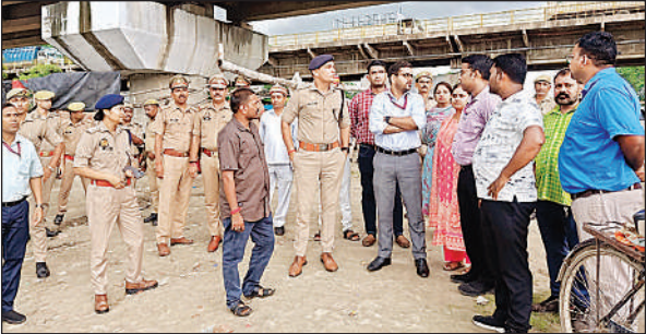
चंदन घाट का निरीक्षण करते डीएम, एसपी व अन्य।

निरीक्षण के दौरान अधिकारियों ने घाट क्षेत्र में सुरक्षा, साफ-सफाई, यातायात और पेयजल