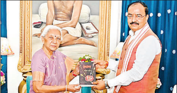
राज्यपाल आनंदीबेन से मुलाकात के दौरान पुस्तक भेंट करते उप मुख्यमंत्री केशव मोर्य।

अमृत विचार : योगी सरकार और भाजपा संगठन में फेरबदल की उलटी गिनती शुरू हो गई है। उप मुख्यमंत्री केशव प्रसाद मोर्य जल्द की सरकार से बड़ा संगठन के अपने बयान को साकार करते हुए प्रदेश अध्यक्ष की कुर्सी दूसरी बार संभाल सकते हैं। हालांकि वे राष्ट्रीय अध्यक्ष बनने की जुगत लगा रहे थे, लेकिन प्रधानमंत्री मोदी के निर्देश पर गृह मंत्री अमित शाह ने उन्हें यूपी संगठन के मुखिया बनने के लिए लगभग मना लिया है। राज्यपाल से शुक्रवार को मुलाकात के पीछे भी बदलाव के निहितार्थ निकाले जा रहे हैं।