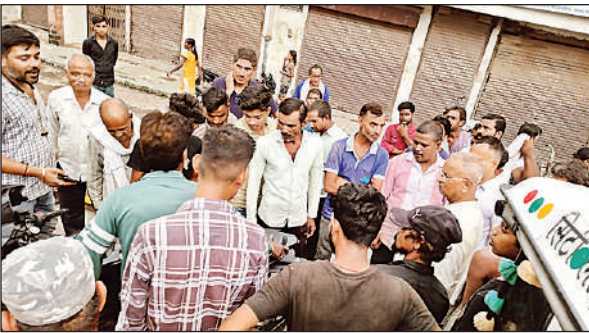
वारदात के बाद मौके पर लगी लोगों की भीड़।