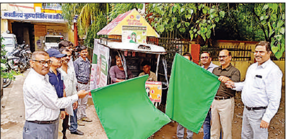
वाहन को झंडी दिखाते सीएमओ व एसपीएमओ।

विश्व जनसंख्या दिवस पर रवाना किया गया जागरूकता वाहन