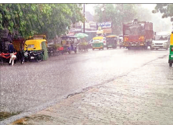
शुक्रवार को दिन की शुरुआत जोरदार बारिश के साथ हुई।

अमृत विचार। पिछले कई दिनों की बारिश से जहां लोगों को गर्मी से राहत मिली है। वहीं बीच-बीच में निकल रही चटक धूप के चलते लोग उमस से परेशान हो रहे हैं। हालांकि मौसम विभाग ने 16 जुलाई तक तेज हवाओं के साथ बारिश की संभावना जताई है। जिले में 19 जून से शुरू हुई मानसूनी बारिश काफी राहत लेकर आई। कई दिनों से रुक-रुककर जोरदार बारिश ने गर्मी से बेहाल लोगों को राहत दी है और अधिकतम तापमान 30 से 35 डिग्री के बीच चल रहा है। शुक्रवार को दिन की शुरुआत जोरदार बारिश से हुई। यह क्रम पूरे दिन चलता रहा। हालांकि बीच-बीच में निकली धूप से कुछ देर के लिए उमस भरी गर्मी भी बेहाल करती रही। शुक्रवार को अधिकतम