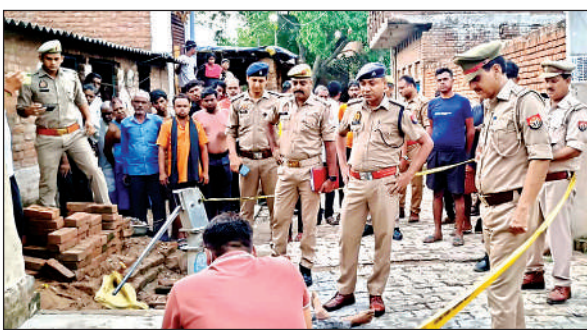
इमिलिहाबाड़ा में घटनास्थल पर जांच-पड़ताल करती पुलिस।