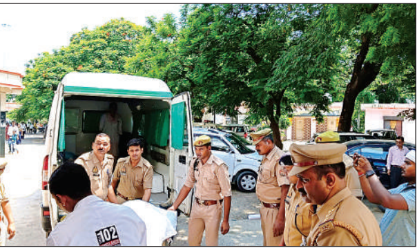
जिला अस्पताल में एंबुलेंस से शव उतारने के दौरान मौजूद सीओ सिटी व अन्य पुलिस।

गले में फंदा लगा लिया। इसकी जानकारी अन्य महिला सिपाहियों को तब हुई जब वह बाथरूम में गई। घटना की जानकारी पर एसपी