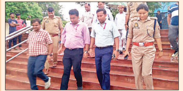
नमामि गंगे घाट पर मौजूद एडीएम, एसडीएम, सीओ व अन्य।