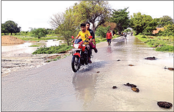
दमनपुर रोड और आसपास के खेतों पर भरा रजबहे का पानी।

दमनपुर मार्ग पर आबादी के समीप ही भोगनीपुर प्रखंड का राजपुर रजबहा है। रजबहे के आसपास कई लोगों के मकान व खेत-खलिहान हैं। मंगलवार सुबह रजबहे की पटरी कट गई, जिससे आसपास के कई किसानों की फसलें जलमग्न हो गई हैं। करीब एक माह पहले तक नहरों से सिंचाई के पानी के लिए तरस रहे किसान अब खेत