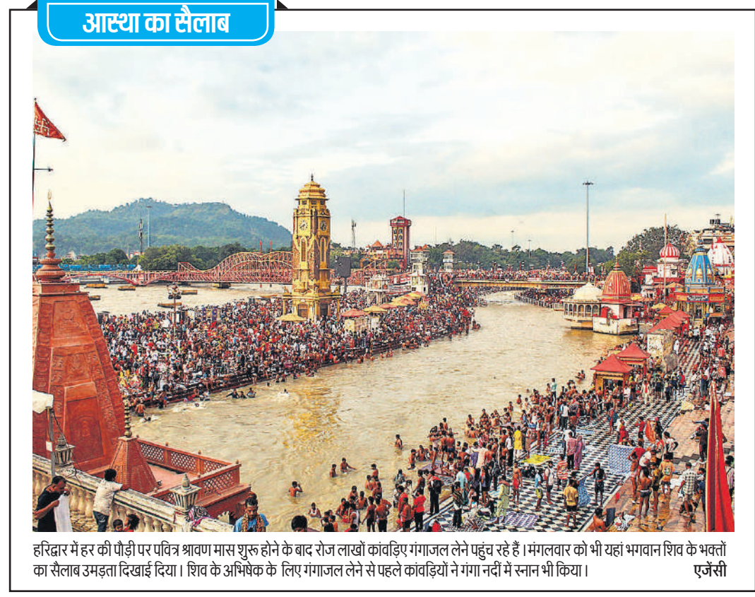
हरिद्वार में हर की पौड़ी पर पवित्र श्रा्णग मास शुरू होने के बाद रोज लाखों कांविड़ए गंगाजल लेने पहुंच रहे हैं। मंगलवार को भी यहां भगवान शिव के भक्तों का सैलाब उमड़ता दिखाई दिया। शिव के अभिषेक के लिए गंगाजल लेने से पहले कांविड़यों ने गंग नदी में स्नान भी किया।