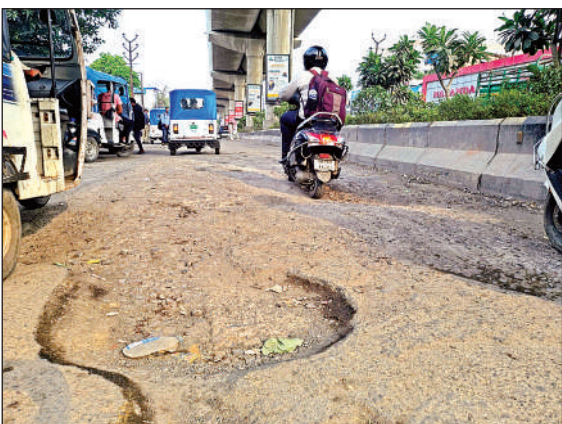
जीटी रोड पर खतरनाक गड्ढे हैं।