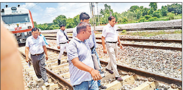
रेलवे स्टेशन का निरीक्षण करते डीआरएम।