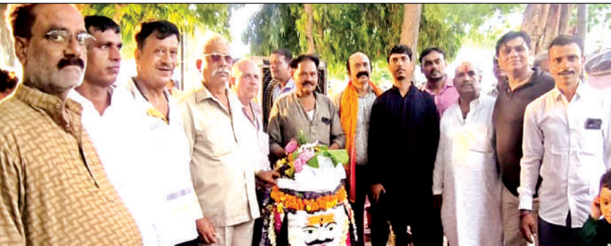
बैराज तट पर रुद्राभिषेक किया गया ।