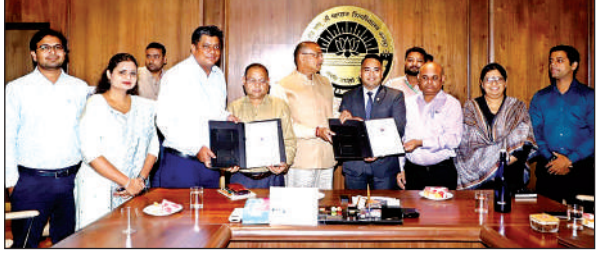
सीएसजेएमयू ने एमओयू साइन किया