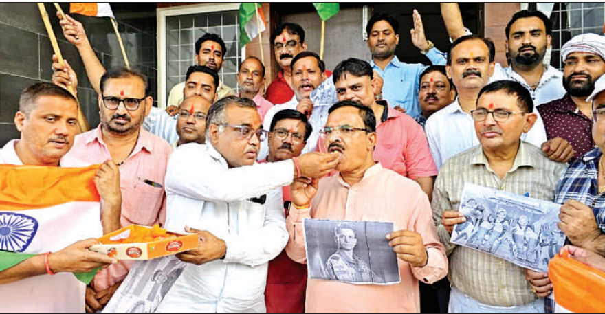
दक्षिण कार्यालय में पार्टी कार्यकर्ताओं को मिष्ठान वितरण कर बधाई दी गई ।