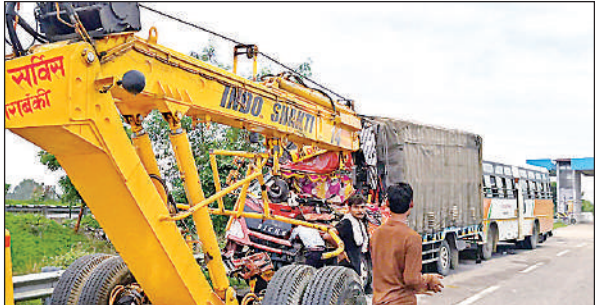
हादसे के बाद डीसीएम को हटाती क्रेन।