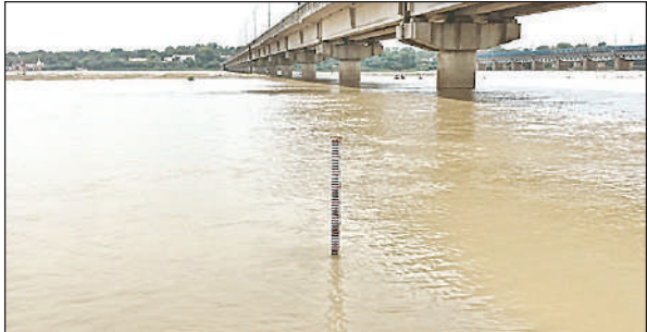
गंगा का जलस्तर दर्शाता केन्द्रीय जल आयोग का मीटरगेज।

अमृत विचार: पश्चिमी के बांधों से लगातार छोड़े जा रहे पानी के चलते गंगा का जलस्तर धीरे-धीरे बढ़ता जा रहा है। मंगलवार को भी पूरे दिन जलस्तर में बढ़ोतरी दर्ज की गई। केन्द्रीय जल आयोग के अनुसार बीते 24 घंटों में गंगा का जलस्तर 12 सेंटीमीटर बढ़ा है। यह अब चेतावनी बिंदु 112 मीटर से महज 1 मीटर 3 सेंटीमीटर दूर है। सोमवार से मंगलवार के बीच प्रति घंटे आधा सेंटीमीटर की दर से जलस्तर में बढ़ोत्तरी दर्ज की गई है। सोमवार शाम 6 बजे गंगा का जलस्तर 110.890 मीटर दर्ज किया गया था, जो मंगलवार सुबह 8 बजे बढ़कर 110.950 मीटर, दोपहर 1 बजे 110.960 मीटर और शाम 6 बजे 110.970 मीटर पहुंच गया। यह स्तर अब 111 मीटर से केवल 3