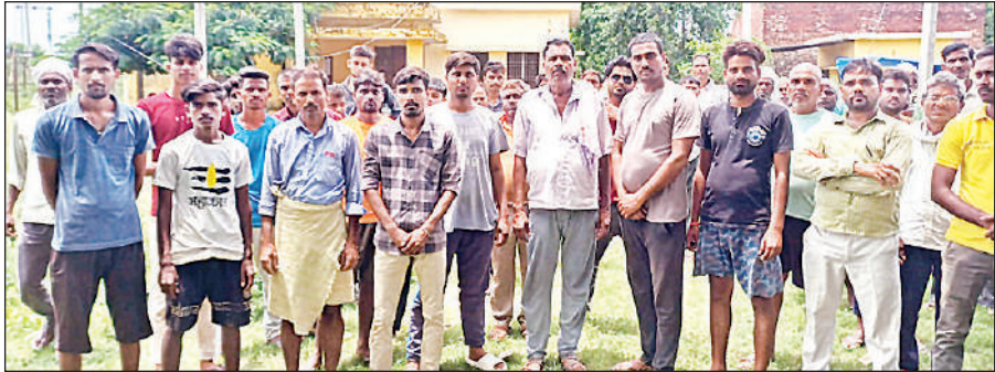
बदहाल विद्युत आपूर्ति को लेकर प्रदर्शन करते ग्रामीण।