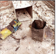
धमाके के बाद मौके पर पड़े बैटरी के अवशेष।