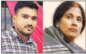
मां-बेटे की फाइल फोटो।

फॉलोअप फिरोजाबाद में हुए हादसे में गई थी मां-बेटे की जान