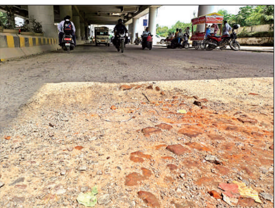
कई जगह उखड़ी सड़क पर बजरी फैली है।