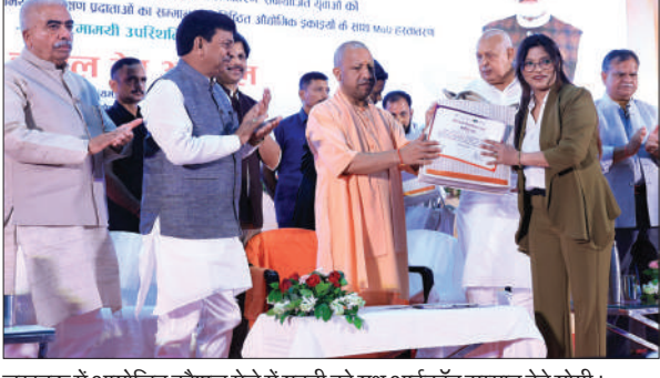
लखनऊ में आयोजित कौशल मेले में युवती को यूथ आईकॉन सम्मान देते योगी।

वह मंगलवार को विश्व युवा कौशल दिवस के अवसर पर लखनऊ के इंदिरा गांधी प्रतिष्ठान में आयोजित दो दिवसीय कौशल मेले और प्रदर्शनी का उद्घाटन करने के बाद बोल रहे थे। योगी ने युवाओं को विश्व युवा कौशल दिवस की बधाई देते हुए कहा कि उनकी प्रतिभा के अनुरूप रोजगार उपलब्ध कराने के लिए सरकार निरंतर प्रयासरत है। इस वर्ष की