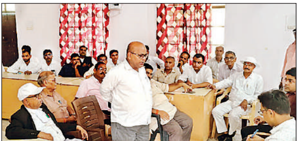
एसडीएम से वार्ता करते बार एसोसिएशन अध्यक्ष व अन्य अधिवक्ता।

संवाददाता शुक्लागंज (उन्नाव), अमृत विचार : उपभोक्ताओं को बिजली बिल संबंधी समस्याओं के त्वरित समाधान हेतु विद्युत विभाग द्वारा 17, 18 एवं 19 जुलाई को वाणिज्यिक मेगा कैप का आयोजन किया जा रहा है। 30५0 पावर कॉरपोरेशन लि0 के निर्देश पर यह कैप उपभोक्ताओं के व्यापक हित में लगाया जाएगा। इस विशेष कैप में उपभोक्ता गलत बिलों से संबंधित अपनी शिकायतें दर्ज कराकर तत्काल समाधान प्राप्त कर सकेंगे। कैप का आयोजन विभिन्न उपखंडों में निर्धारित तिथियों पर होगा। 17 जुलाई को ऋषि नगर, सरस्वती टाकीज में, 18 जुलाई को रविदास पार्क, अखलौंक नगर में तथा 19 जुलाई को मिश्रा लॉन पौनी रोड, मंगावारा उपखंड कार्यालय, देवाराखुर्द में कैप लगाए जाएंगे। यह जानकारी अधिशासी अभियंता, विद्युत वितरण खण्ड–मारगवारा, द्वारा दी गई। उपभोक्ताओं से कैप का लाभ लेने की अपील की गई है।