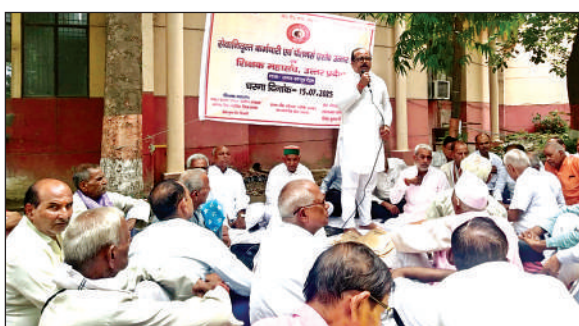
कलेक्ट्रेट में प्रदर्शन करते पेंशनर्स एसोसिएशन व शैक्षिक महासंघ के पदाधिकारी।

तत्काल निरस्त कर सेवानिवृत्त हसोने की तिथि के आधार पर पेंशनरों में भेद न पैदा किया जाए। साथ ही पेंशनरों को पेंशन राहत का शासनादेश कर्मचारियों व शिक्षकों के महंगाई भत्ते के शासनादेश की तिथि को ही जारी किया जाए। महंगाई राहत को महंगाई भत्ते से डी-लिंक न किया जाए। उन्होंने