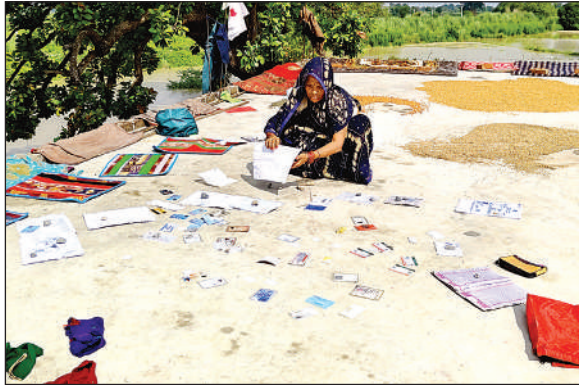
पानी में डूबे अनाज और कागजात छत पर सुखाती महिला।