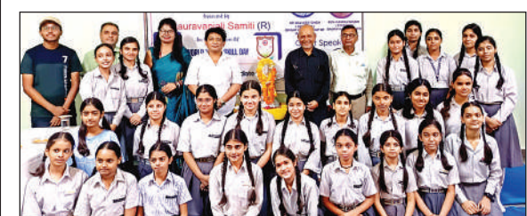
स्कूल में मौजूद बच्चे और स्टाफ।