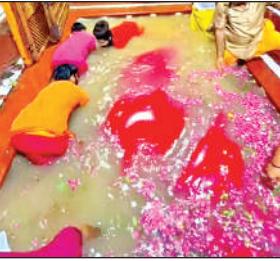
बड़े हनुमान जी तक पहुंचा त्रिवेणी का जल।

प्रयागराज में मां गंगा, यमुना और सरस्वती ने अपने पवित्र जल से मंगलवार को दोपहर में बड़े