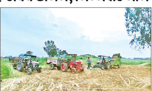
माफिया द्वारा किया जाता बालू और मिट्टी का अवैध खनन।