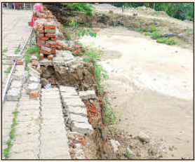
बारिश के पानी से स्टेशन के प्लेटफार्म को इस तरह पहुंचा नुकसान।

संवाददाता शुक्लागंज (उन्नाव), अमृत विचार : गंगाघाट रेलवे स्टेशन के पीछे अमृत भारत स्टेशन योजना के तहत निर्माण कार्य तेजी से चल रहा है, लेकिन निर्माणस्थल पर की गई खोदाई और हालिया बारिश ने स्टेशन को नुकसान पहुंचाया है। जुलाई माह में हुई झमाझम बारिश के चलते स्टेशन के प्लेटफार्म का हिस्सा धीरे-धीरे धंसने लगा है, जिससे इंटरलॉकिंग ईंटें भी उखड़ गई हैं। गंगाघाट स्टेशन के प्लेटफार्म में साफ देखा जा सकता है कि प्लेटफार्म के किनारे की मिट्टी कटने से जमीन धंस गई है और इंटरलॉकिंग ईंट जगह–जगह से टूटकर नीचे गिर गए हैं। कुछ जगहों पर दीवारें भी दरक चुकी हैं। इससे न केवल निर्माण कार्य बाधित हो रहा है, बल्कि यात्रियों की सुरक्षा को लेकर भी खतरा उत्पन्न हो गया है। यात्रियों का कहना है कि निर्माण एजेंसी द्वारा ड्रेनेज और वर्षा जल निकासी की समुचित व्यवस्था नहीं की गई, जिससे पानी का बहाव सीधे प्लेटफार्म की नींव को नुकसान पहुंचा रहा है। यदि समय रहते मरम्मत कार्य नहीं कराया गया तो आने वाले दिनों में और बड़ा नुकसान हो सकता है। रेलवे प्रशासन से जल्द स्थिति सुधारने और स्थायी समाधान करना चाहिये।