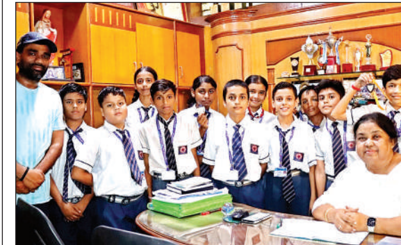
विजयी खिलाड़ियों के साथ प्रधानाचार्य ।