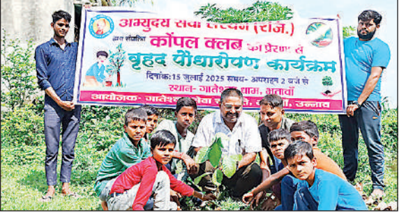
बच्चों के साथ पौधरोपण करते संस्था के अध्यक्ष।

पौधरोपण कर पौधों को संरक्षित कराने का दिलाया संकल्प