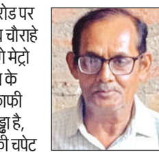
जीटी रोड पर गुरुदेव चौराहे के आगे मेट्रो स्टेशन के नीचे काफी बड़ा गड्ढा है, जिसकी चपेट में बाइक व स्कूटी सवार गिरकर चूटहिल हुए। कंपनी बाग की तरफ एक गड्ढे में जलभराव होने से उसमें गिरकर वह घायल हो गए थे।