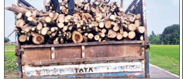
पकड़ा गया लकड़ी लदा ट्रक।