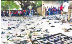
● कर्नाटक मंत्रिमंडल ने किया पहले रिपोर्ट के और अध्ययन का फैसला