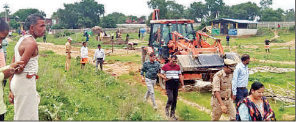
जीएस की जमीन पर हुए कब्जे को हटाती जेसीबी।