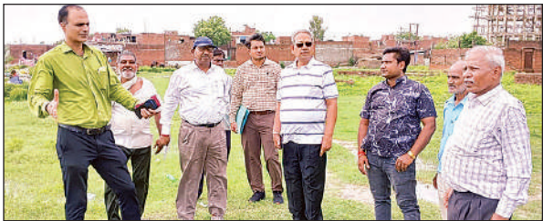
कटान स्थल का निरीक्षण करती सिंचाई विभाग की टीम साथ में पूर्व विधायक।