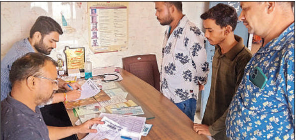
पीएचसी में ओपीडी करते डॉक्टर।

अमृत विचार। बरसात के मौसम में तेज धूप और बदलते तापमान के कारण बीमारियों ने जोर पकड़ लिया है। नगर के सरकारी और निजी अस्पतालों में मरीजों की संख्या में लगातार इजाफा हो रहा है। खासकर आंखों में कंजैक्टिवाइटिस, वायरल बुखार, चर्म रोग, सर्दी-जुकाम और पेट संबंधी बीमारियों के मरीज तेजी से बढ़े हैं। नगर स्थित न्यू प्राथमिक स्वास्थ्य केंद्र में इन दिनों मरीजों की भारी भीड़ देखने को मिल रही है। शुक्रवार को ओपीडी में कुल 182 मरीजों ने इलाज के लिए पंजीकरण कराया। इन मरीजों में अधिकांश कंजैक्टिवाइटिस, बुखार, खांसी, चर्म रोग व पेट संबंधी शिकायतों से