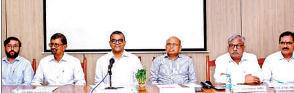
कार्यशाला में मौजूद वक्ता।