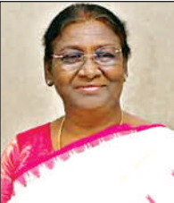
राष्ट्रपति द्रौपदी मुर्मू

लखनऊ। राष्ट्रपति द्रौपदी मुर्मू ने कहा कि प्रशासनिक अधिकारियों की पत्नियां समाज के लिए विकास की वाहक बन सकती हैं, यदि वे अपने पद को केवल व्यक्तिगत सुविधा का साधन न मानकर समाज के वंचित वर्गों के लिए सेवा और सहयोग का माध्यम बनाएं। यह बात राष्ट्रपति ने राष्ट्रपति भवन में मुलाकात करने पहुंची आकांक्षा समिति उग्र के अंतर्गत कार्यरत लखनऊ स्थित ‘मसाला मटरी कैद’ की दीवियों से कही। इस अवसर पर उन्होंने मसाला मटरी कैद में कार्यरत महिलाओं की आय, स्वास्थ्य, बच्चों की शिक्षा और सामाजिक