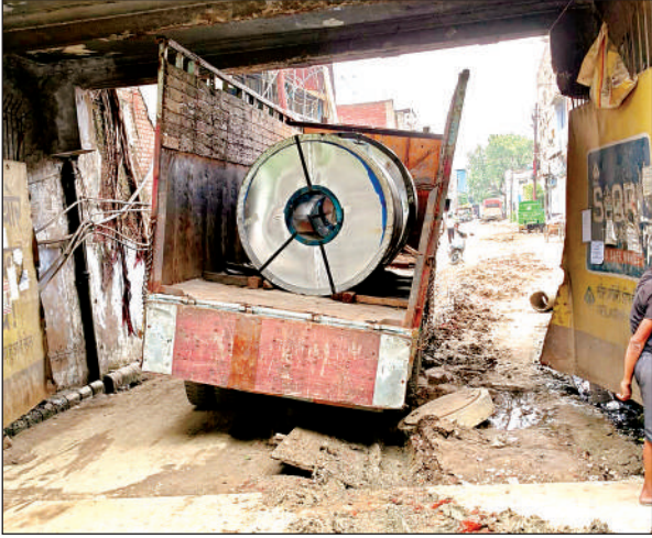
फजलगंज औद्योगिक क्षेत्र में टूटी सड़क पर फंसा लोडर । अमृत विचार