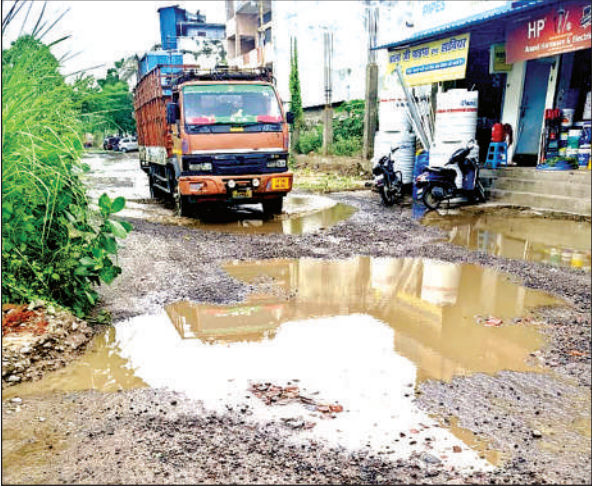
इस्पात नगर, पनकी में सड़क गायब हो चुकी है । अमृत विचार