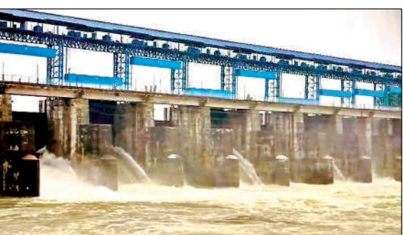
स्वामी ब्रह्मानंद बांध से पानी छोड़ा गया। अमृत विचार

विकास खंड के गुंदेला गांव के पास स्वामी ब्रह्मानंद बांध स्थित है। महोबा जिले में लगातार हो रही बारिश से स्वामी ब्रह्मानंद बांध लबाब है। पिछले दो दिनों से लगातार हो रही झमाझम बारिश से बांध का जलस्तर बढ़ता जा रहा है। जिसको लेकर शुक्रवार को बांध के 11 में 6 गेट खोले गए हैं। इससे विरमा नदी का जलस्तर बढ़ गया है। जिससे नदी किनारे बसे बिहूनी, बंडवा, बिलगांव, शिवनी, भटरा, बांधुखुर्द, कुपारा, बेरी, उपरहंका जैसे करीब एक दर्जन से अधिक गांवों में जल स्तर से प्रभावित होंगे। बिहूनी गांव में नदी का पानी गांव तक पहुंच गया है। स्वामी