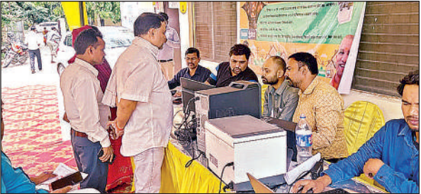
मेगा कैप में उपभोक्ताओं की समस्याओं का निस्तारण करते अधिकारी।