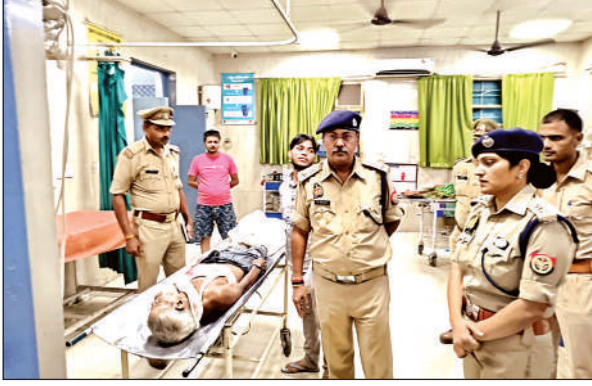
घायल अवस्था में पुलिस बदमाश के लेकर जिला अस्पताल लाई थी।