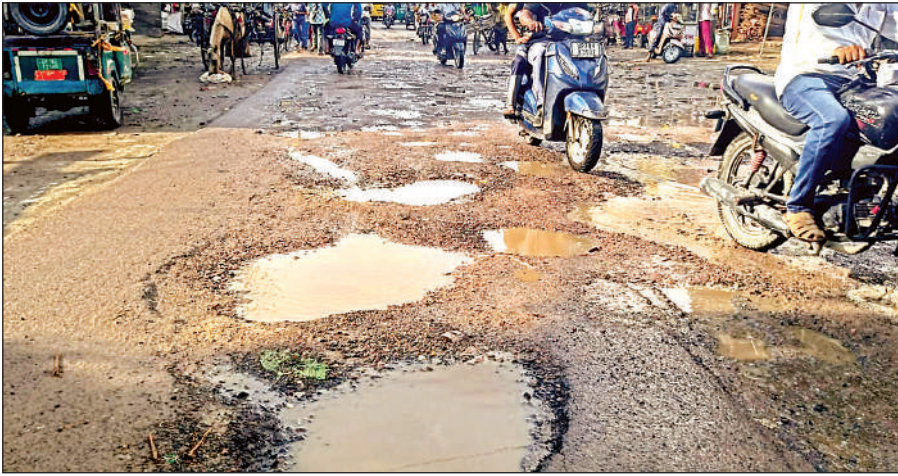
कर्‍हरी मार्केट रोड गायब हो चुकी है। सिर्फ गड्ढे और उनमें भरा पानी ही है।

सात माह बीत गए हैं और सड़क और बर्‍याहाल हो गई है। सड़क पर बेशुमार गड्ढे हैं। कई जगहों पर सड़कों पर गिट्टी तक दिखने लगी है और बजरी के साथ ईट फैली हुई है। ठाकुर चौराहा के आगे तो सड़क ही लापता है। पूरे मार्ग पर जलभराव है। बाइक व स्कूटी सवार कई बार गड्ढों की चपेट में आकर गिरकर चुटहिल हो जाते हैं।