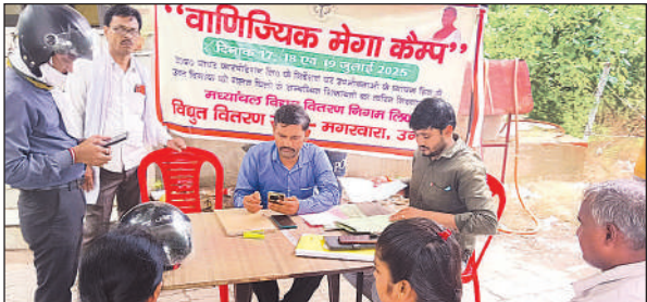
कैप में शिकायत सुनते एसडीओ।

अमृत विचार। पुराने यातायात पुल से लेकर जाजमऊ हाईवे तक लगभग पांच किलोमीटर लंबे प्रस्तावित मार्जिनल बांध की योजना वर्ष 2017 में शासन द्वारा स्वीकृत की गई थी। लेकिन निर्माण खंड इकाई की एक अंतरिम रिपोर्ट के बाद यह महत्वाकांक्षी परियोजना ठंडे बस्ते में चली गई। इस मामले में पूर्व विधायक रामकुमार द्वारा उठाए गए छह बिंदुओं की याचिका को आर्य नगर कानपुर के विधायक अमिताभ बाजपेयी ने 19 फरवरी 2025 को विधानसभा में पटल पर रखा था। अब जब अगस्त में विधानसभा का सत्र पुनः शुरू होने वाला है, तो जवाबदेही से बचने के लिए सिंचाई विभाग हरकत में आया है। शुक्रवार