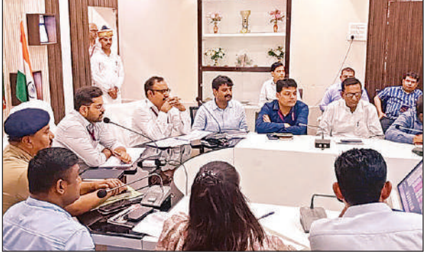
बैठक में अधिकारियों को संबोधित करते जिलाधिकारी गौरांग राठी। अमृत विचार

अमृत विचार। जिलाधिकारी गौरांग राठी की अध्यक्षता में कलक्ट्रेट के पन्नालाल सभागार में सड़क सुरक्षा समिति की बैठक आयोजित हुई। इसमें जिलाधिकारी ने कहा कि अवैध व अपंजीकृत ई-रिक्षा के विरुद्ध अभियान चलाकर कार्यवाही करने के निर्देश पूर्व ही बैठकों में दिए गए थे। इसके बावजूद सहायक संभागीय परिवहन अधिकारी प्रशासन द्वारा 43 ई-रिक्षा ऑनर्स पर कार्यवाही करने के सापेक्ष सिर्फ 7 पर कार्यवाही करने की जानकारी होने पर नाराजगी जताते हुए कड़ी फटकार लगाई। जिस पर अधिकारी