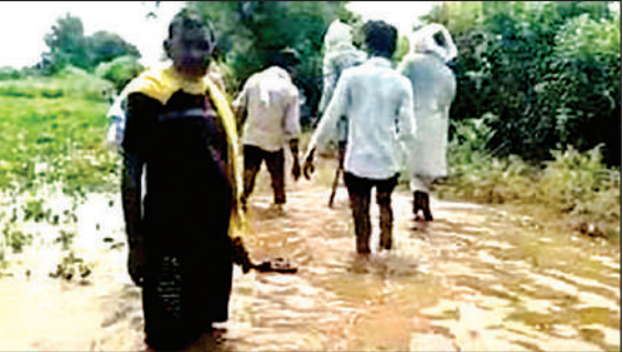
बांध से छोड़े गए पानी से बिहूनी के खेत डूब गए।