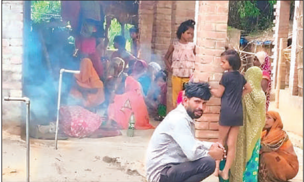
प्रसूता व उसके नवजात शिशु की मौत के बाद गमगीन लोग।

अमृत विचार। बांगरमऊ स्थित सीएचसी में सामान्य प्रसव से जन्मे नवजात शिशु की दूसरे दिन अचानक मौत हो गई। डॉक्टर द्वारा जांच के बाद शिशु को मृत घोषित करने का सदमा प्रसूता बर्दाश्त नहीं कर सकी और वहीं अचेत होकर गिर गई। इसके कुछ ही देर में उसकी भी मौत हो गई। शिशु और प्रसूता की मौत होते ही जहां अस्पताल कर्मियों में हड़कंप मच गया वहीं परिजनों में चीखपुकार मच गई। हालांकि बाद में परिजन शव लेकर घर लौट गए। बता दें कि बहेटा मुजावर