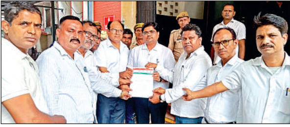
ज्ञापन सौंपते राष्ट्रवादी स्वच्छकार परिषद के पदाधिकारी । अमृत विचार

औद्योगिक क्षेत्रों में जलभराव व टूटी सड़कों की वजह से वहां ट्रक नहीं भेजते। इनेज सिस्टम बेहतर न होने से बरसात तक यह स्थिति बनी रहेगी। भारी ट्रक औद्योगिक क्षेत्र में फंसा तो नुकसान की भरपाई करना मुश्किल है। इसलिए ट्रांसपोर्टर औद्योगिक इलाकों में ट्रक भेजने से मना कर देते हैं।