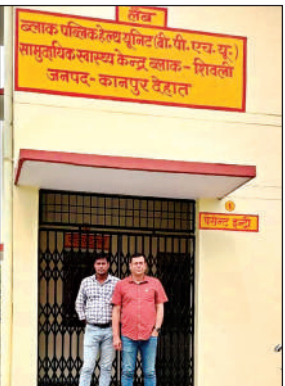
नई बिल्डिंग में मौजूद चिकित्सा प्रभारी।

शिवली में कल्याणपुर रोड पर स्थापित सामुदायिक स्वास्थ्य केंद्र पर अभी कुछ ही बीमारियों से संबंधित मरीजों को जांच की जाती है, लेकिन अधिकांश जांचों की सुविधा न होने के कारण लोगों को कानपुर नगर समेत अन्य जगहों की भाग-दौड़ करना पड़ती थी। यहां