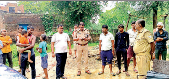
घटनास्थल पर छानबीन करती शिवली कोतवाली की पुलिस। अमृत विचार

● शिवली पुलिस ने की छानबीन फॉरेंसिक टीम ने जुटाए साक्ष्य