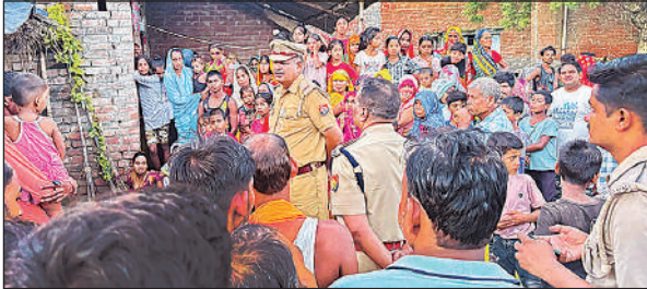
घटना के बाद घर के बाहर मौजूद पुलिस व ग्रामीण।

अमृत विचार। गुरुवार रात आई तेज आंधी और बारिश ने नगर और आसपास के ग्रामीण इलाकों की बिजली व्यवस्था को पूरी तरह अस्त-व्यस्त कर दिया। पेड़ों की डालियों के गिरने और तकनीकी फाल्ट के चलते कई क्षेत्रों में पूरी रात बिजली आपूर्ति ठप रही। लोग अंधेरे में रात गुजारने को मजबूर हो गए। फीडर एक की रात करीब 9:30 बजे लाइन ट्रिप कर गए। इसके कारण फीडर एक की बिजली आपूर्ति रातभर बंद रही। शुक्रवार सुबह करीब 8:30 बजे आपूर्ति बहाल हो सकी। बिजली विभाग की