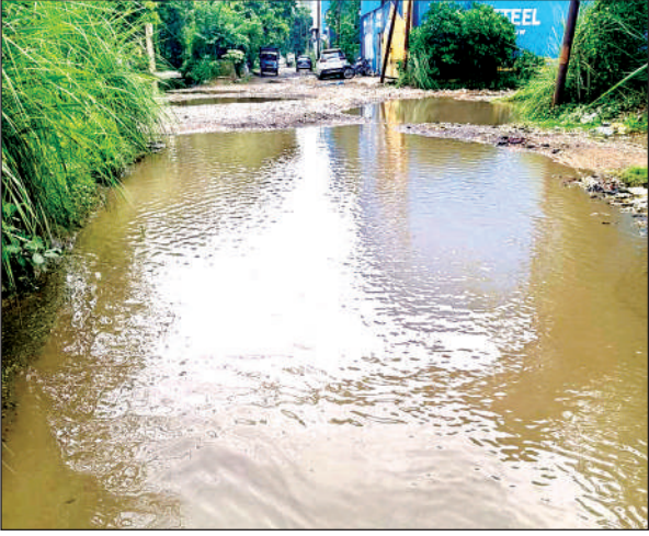
इस्पातनगर ग्रीन बेल्ट का यह हाल है । अमृत विचार