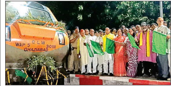
गोविंदपुरी स्टेशन पर अमृत भारत को हरी झंडी दिखाते जनप्रतिनिधि ।

गोविंदपुरी स्टेशन पर अमृत भारत एक्सप्रेस को ठहराव