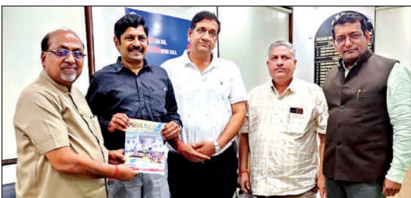
आईआईएफ के प्रतिनिधियों ने ज्ञापन दिया।