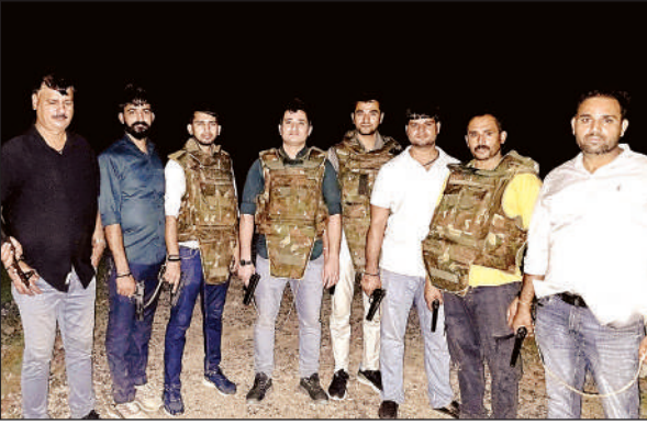
इनामी बदमाश को मारने वाली पुलिस टीम।