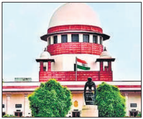
● केंद्र का दावा- एक मानक संचालन प्रक्रिया तैयार, यह रिकॉर्ड में मौजूद

केंद्र ने दावा किया कि इस मुद्दे पर एक मानक संचालन प्रक्रिया (एसओपी) तैयार की जा चुकी है