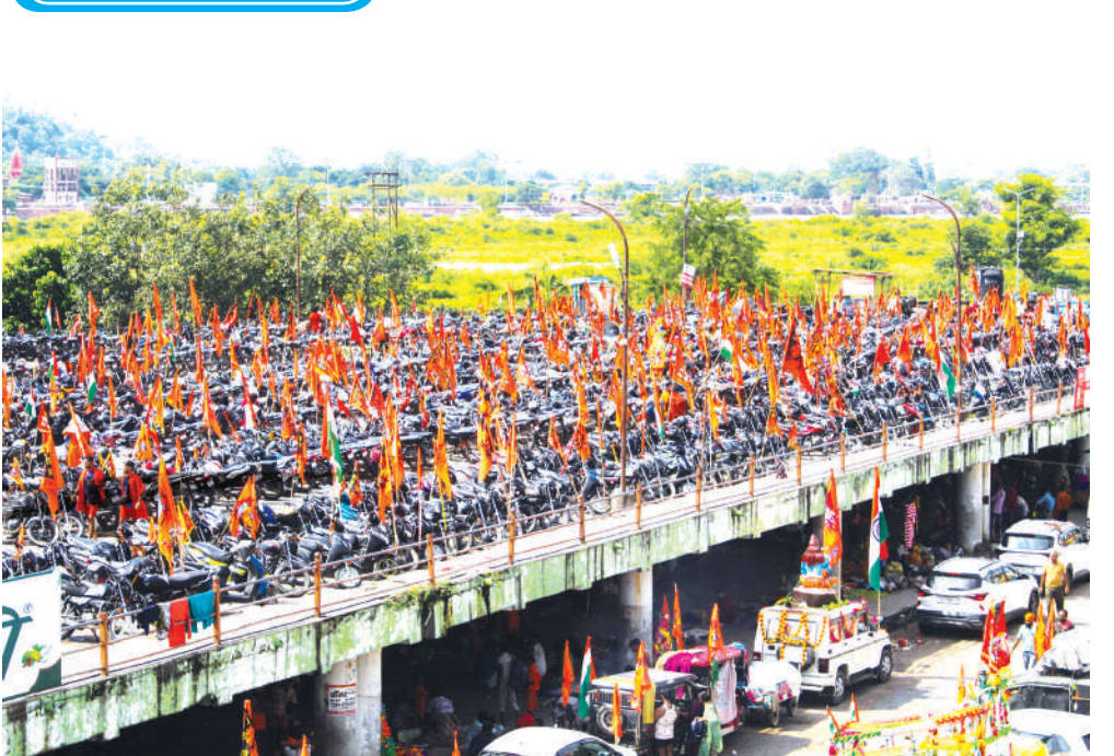
हरिद्वार में कांवड़ यात्रा चरम पर है। लाखों शिवभक्त गंगाजल लेने के लिए पैदल यात्रा कर हरिद्वार पहुंच रहे हैं। सड़कों पर जगह-जगह उनके वाहन खड़े हैं। हरिद्वार की गलियां हर-हर महादेव के जयकारों से गूंज रही हैं। प्रशासन ने व्यवस्था बनाए रखने को विशेष इंतजाम किए हैं।