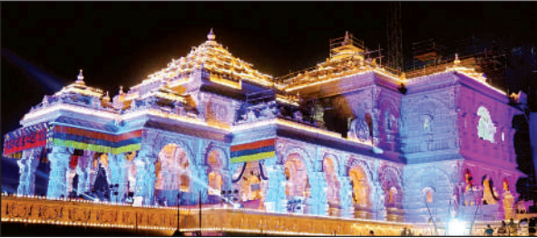
रंग बिरंगी लाइटों से सजा राम मंदिर परिसर।