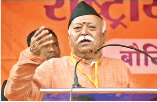
● सोलापुर में गैर-लाभकारी संगठन उद्योगवर्धनी के कार्यक्रम को किया संबोधित

उन्होंने कहा कि एक पुरुष अपनी मृत्यु तक काम करता है। एक महिला भी अंत तक काम करती है, लेकिन उससे भी आगे वह आने वाली पीढ़ियों को प्रेरित करती है। एक महिला के प्यार और स्नेह के तले बच्चे बढ़ते और परिपक्व होते हैं। आरएसएस प्रमुख ने कहा कि राष्ट्रीय विकास के लिए महिलाओं का सशक्तिकरण बेहद महत्वपूर्ण है। उन्होंने कहा कि ईश्वर ने