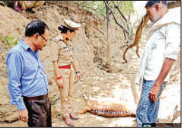
जांच करती टीम।