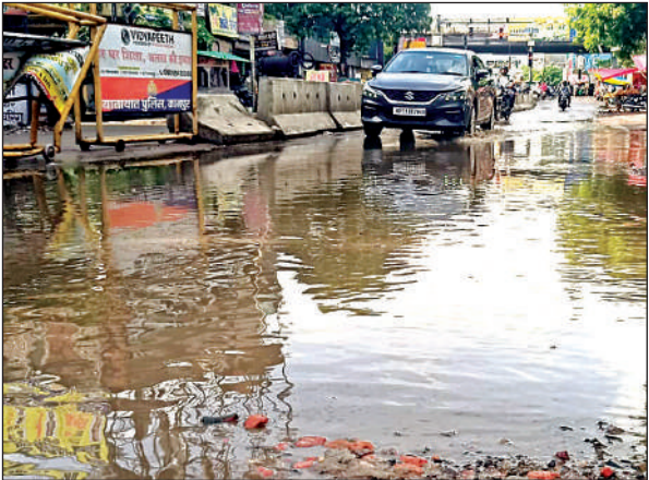
बर्‍या बाईपास से कर्‍हरी रोड पर जलभराव वाले हिस्से में तीन से चार फुट का गड्ढा है, जिसमें वाहन सवार गिरते हैं।