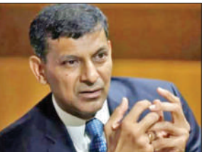
● भारत ने अब तक कृषि और डेरी क्षेत्र में अपने किसी व्यापारिक साझेदार को नहीं दी है रियायतें

राजन ने एक बातचीत में कहा कि विकसित देश कृषि क्षेत्र को काफी सब्सिडी देते हैं और यह हमें ध्यान रखने की जरूरत है। उन्होंने कहा कि भारत की आर्थिक वृद्धि दर फिलहाल छह-सात प्रतिशत के दायरे में स्थिर हो गई है। हालांकि वैश्विक व्यापारिक अनिश्चितताओं के चलते इसमें थोड़ी गिरावट हो सकती है। राजन