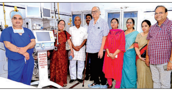
कार्डियोलॉजी में संस्था ने उपकरण दान दिए।