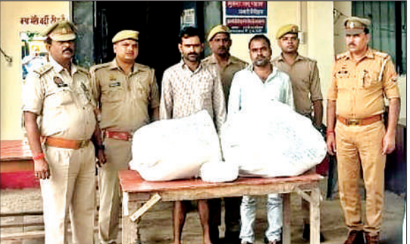
पुलिस की गिरफ्त में गांजा तस्करी के आरोपी।

गुरुवार को बिधूना पुलिस और स्वाट टीम बिधूना अछलदा मार्ग पर सराय प्रथम के पास वाहन चेकिंग कर रही थी। चेकिंग के दौरान