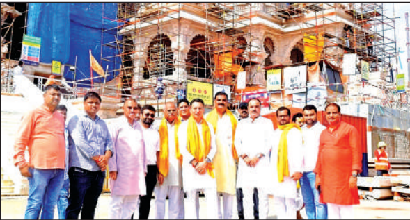
राम मंदिर में दर्शन -पूजन के बाद केंद्रीय वाणिज्य एवं उद्योग राज्य मंत्री जितिन प्रसाद।

ये बातें शुक्रवार को केंद्रीय वाणिज्य एवं उद्योग राज्य मंत्री जितिन प्रसाद ने कहीं। वह राममंदिर और हनुमानगढ़ी में पूजा-अर्चना करने के बाद पत्रकारों से वार्ता कर रहे थे। इसके साथ ही वे भी पहुंचे और आशीर्वाद प्राप्त किया। उन्होंने कहा, प्रधानमंत्री नरेंद्र मोदी के मार्गदर्शन और मुख्यमंत्री योगी आदित्यनाथ की दूरदर्शी सोच के