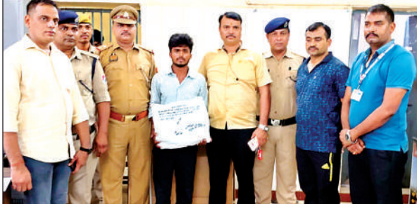
पुलिस की गिरफ्त में चरस के साथ तस्कर।