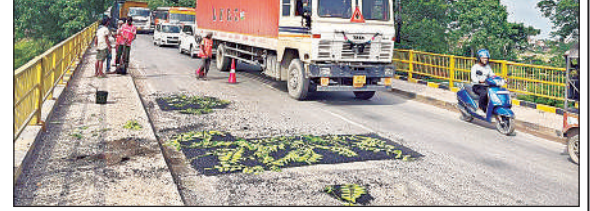
हाईवे स्थित पुराने पुल पर कराया गया पैचवर्क।

पैचवर्क से दिन भर हाईवे पर रेंगते रहे वाहन