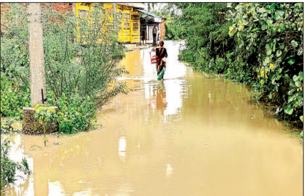
पानी से डूब गई दिसरापुर गांव की सड़क।

खतरे के निशान से ऊपर पानी बढ़ता देख सिंचाई विभाग ने उर्मिल बांध और लहचूरा बांध के फाटक खोल दिए हैं। वहीं बेलाताल सरोवर के उफना जाने से तालाब का पानी निकाल दिया गया है। इसके अलावा प्राथमिक विद्यालय सुभाष नगर सिजहरी में ढाई ढाई फिट पानी भर जाने से स्कूल में बच्चे नहीं पहुंच सके। वहीं शहर की सड़कें और गलियां पानी से लबाब हो गईं। दो दिन से हो रही जोरदार बारिश के चलते शहर के जलकुश नगर तिराहा से गैस एंजेन्सी रोड की