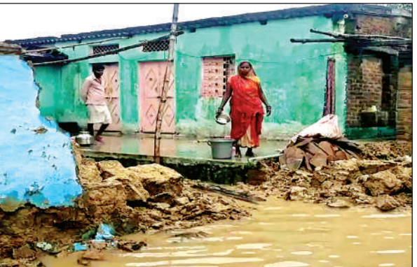
दिसरापुर गांव में पानी भरने से गिर गया कच्चा घर। अमृत विचार

नगर और हवेली दरवाजा पहुंचना पड़ा। चार पहिया वाहन और बाइक पानी कम होने के बाद किसी तरह निकलते समय फस गई, जिससे