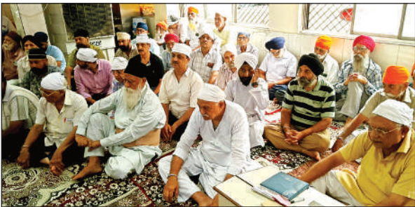
गोविंदनगर गुरुद्वारा में शबद कीर्तन हुआ