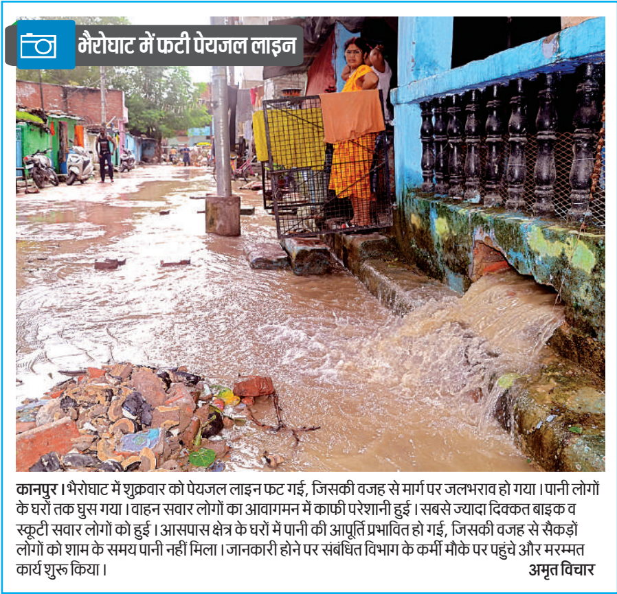
मैरौघाट में फटी पेयजल लाइन

Admission Cell, Administrative Block, Bareilly International University, Rohilkhand Medical College Campus, Bareilly PIN Code : 243006 (U.P.) Website : www.biu.edu.in, E-mail : admission@biu.edu.in