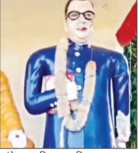
आंबेडकर प्रतिमा का क्षतिग्रस्त हाथ।

» कटका क्षेत्र स्थित ग्राम पंचायत करीमनगर कोरझा का मामला