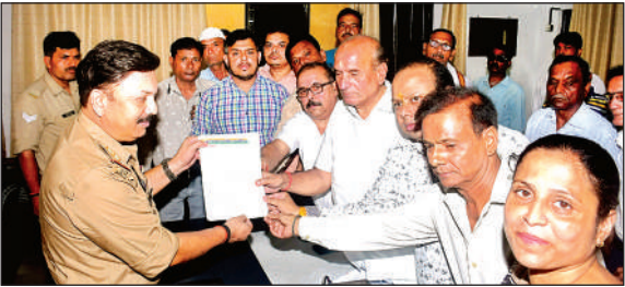
कोतवाली में पुलिस अधिकारी को तहरीर देते कांग्रेसी।