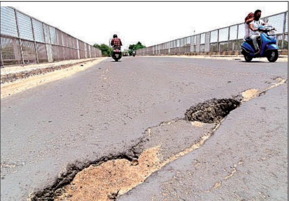
पनकी रेलवे पुल पर गड्ढे।

विजय नगर, अर्मापुर व पनकी भाटिया तिराहे से भौती व सचेंडी की ओर आने व जाने के लिए पनकी रेलवे पुल है, जहां से प्रतिदिन करीब 50 हजार वाहन गुजरते हैं। करीब 35 साल पुराने इस पुल पर गड्ढे हो गए हैं और रेलवे ट्रैक के पास का एक्सपेंशन ज्वाइंट टूट गया है।