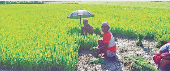
धूप से बचने के लिए छाता लगाकर रोपाई करते हुए किसान।