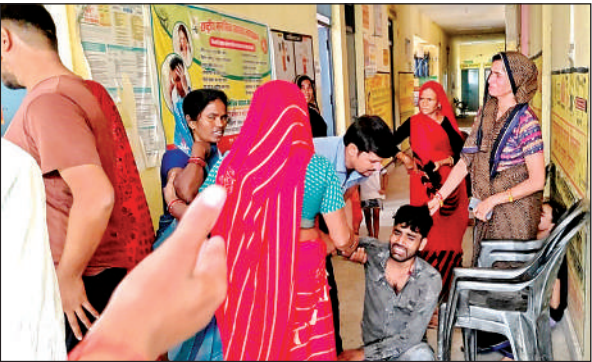
हादसे के बाद अस्पताल में रोते-बिलखते परिजन ।