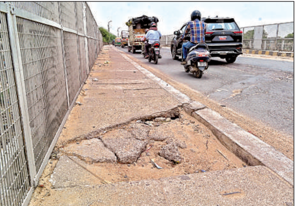
पुल का फुटपाथ भी क्षतिग्रस्त।