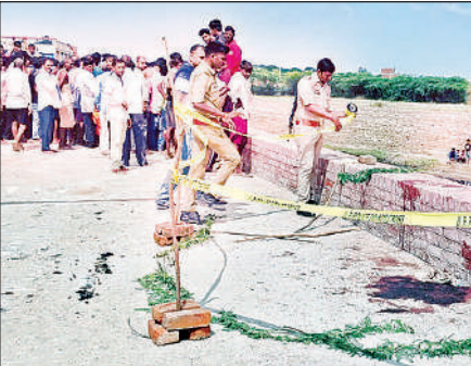
मौके पर जांच करती पुलिस टीम।

पहुंचे और एसओ को बताया। पुलिस ने पोकलैंड की मदद से शव को बाहर निकलवाया। जामा तलाशी में उसके पास कोई परिचय पत्र या ऐसा कुछ नहीं मिला जिससे उसकी पहचान हो सके। वहां मौजूद लोगों में भी कोई उसे नहीं पहचान सका। युवक की उम्र 30 वर्ष के आसपास थी और वह चेकदार शर्ट व जींस पहने था। प्रथम