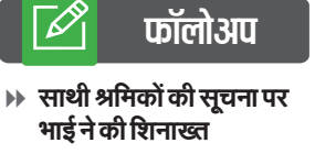
» साथी श्रमिकों की सूचना पर भाई ने की शिनाख्त

टॉवर वैगन से टकरा गया और उसकी मौके पर ही मौत हो गई। गेटमैन की रेलवे व दही पुलिस शव ट्रैक से हटवाकर उसकी पहचान कराने का प्रयास किया था, लेकिन सफलता नहीं मिली थी। रविवार को पुलिस ने सोशल मीडिया का सहारा लेने के साथ आसपास की फैक्ट्रियों के श्रमिकों को फोटो दिखा के पहचान का प्रयास किया। तभी किसी साथी श्रमिक से मिली जानकारी पर बहराइच जिला के दरगाह शरीफ थाना क्षेत्र के मसूर