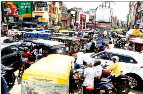
परेड पर दोपहर में लगा भीषण जाम।