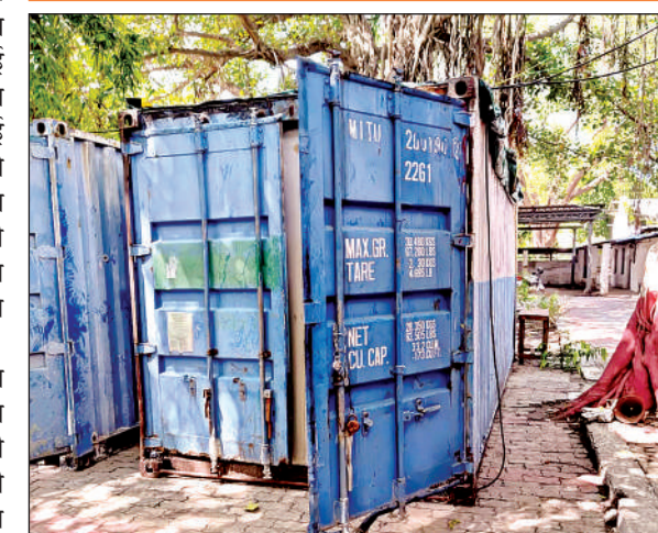
इस कंटेनर में चल रहा है विभाग।