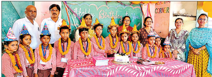
स्कूल में केक काटकर बच्चों का जन्मदिन मनाते आयोजक ।