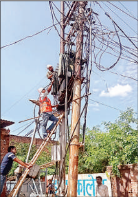
ट्रांसफार्मर बदलते विद्युत कर्मों।

बिजनेस प्लान के तहत मई माह से नगर के अलग-अलग हिस्सों में एक दर्जन से अधिक स्थानों पर अतिरिक्त ट्रांसफार्मर लगाने की प्रक्रिया जारी है। गर्मी के मौसम में बढ़ते बिजली उपभोग और ट्रांसफार्मर के बार-बार फूंकने की समस्या को देखते हुए सोमवार को ब्रह्मनगर और श्रीनगर में यह कार्य कराया गया। शाम लगभग पांच बजे