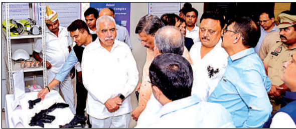
डिफेंस कॉरिडोर में जानकारी लेते मंत्री राकेश सचाज ।