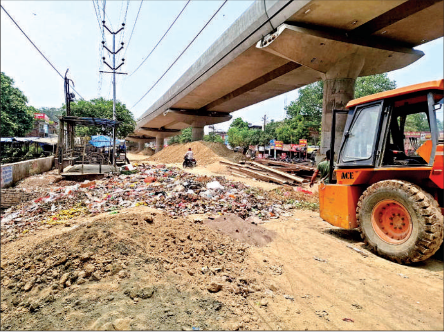
विजय नगर के आगे सड़क खुदी होने के चलते बंद हो गई है।

मौजूदा समय में रावतपुर से डबलपुलिया होते हुए शास्त्री चौक जाना खतरे की घंटी है। मेट्रो के कार्य और पेयजल लाइन डालने का कार्य एक साथ चल रहा है। इससे सड़क बर्बाद हो गई है। रावतपुर से शास्त्रीचौक तक 41.60 करोड़ से गंगा इंफ्राबिल्ड पाइप