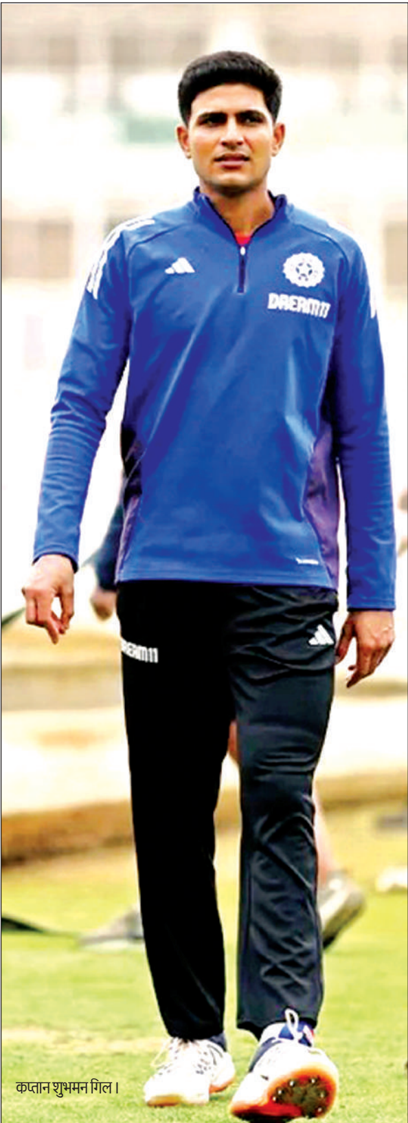
कप्तान शुभमन गिल।

हैं, जिन्हें मैं याद कर सकता हूं। जब से मैंने इंग्लैंड की क्रिकेट को करीब से देखा है तब से वह सबसे भाग्यशाली खिलाड़ी हैं जिसे लगातार असफलताओं के बावजूद इतने अधिक टेस्ट मैच खेलने को मिले। उन्होंने कहा उन्हें खुद को भाग्यशाली मानना ​​चाहिए कि उन्होंने 56 मैच खेले हैं, जिनमें उन्होंने सिर्फ पांच शतक बनाए हैं और उनका औसत 31 का है। टेस्ट इतिहास में 2,500 से अधिक रन बनाने वाले सभी सलामी बल्लेबाजों में उनका औसत सबसे कम 30.3 है। क्रिकेटर से कमेंटेटर बने इस खिलाड़ी ने गिल का उदाहरण देते हुए कहा बदलाव संभव है। शुभमन गिल को ही देख लीजिए। इस श्रृंखला से पहले उनका औसत 35 था और अब उनका औसत 42 है।