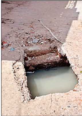
गली का टूटा क्रास का पत्थर।

100 केवीए और 250 केवीए क्षमता के ट्रांसफार्मर लाए गए और स्थापना कार्य के दौरान बिजली आपूर्ति रोक दी गई। लगभग सात बजे तक चले कार्य के दौरान दोनों मोहल्लों की आपूर्ति पूरी तरह बंद रही, जिससे आमजन को काफी दिक्कतों का सामना करना पड़ा। इसी दिन सुबह फीडर-4 में ब्रेकडाउन के चलते करीब दो घंटे तक बिजली गुल रही, जिससे हजारों लोग प्रभावित हुए। बिजली विभाग के अधिकारियों ने