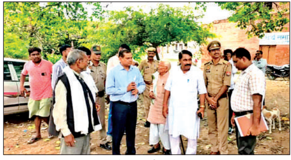
घटनास्थल पर जांच –पड़ताल करते अधिकारी ।