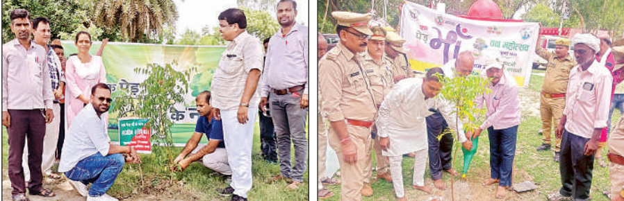
जूनियर स्कूल प्रांगण में होता पौधारोपण।