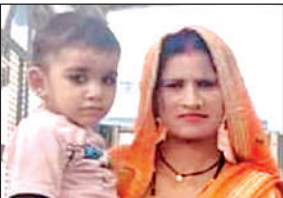
हादसे का शिकार मां- बेटे ।