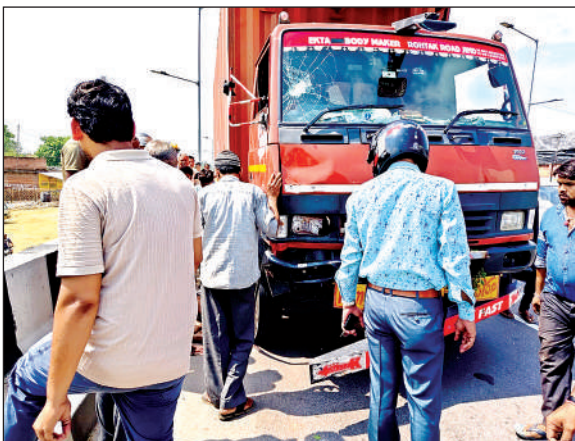
इसी कंटेनर से किया हादसा।