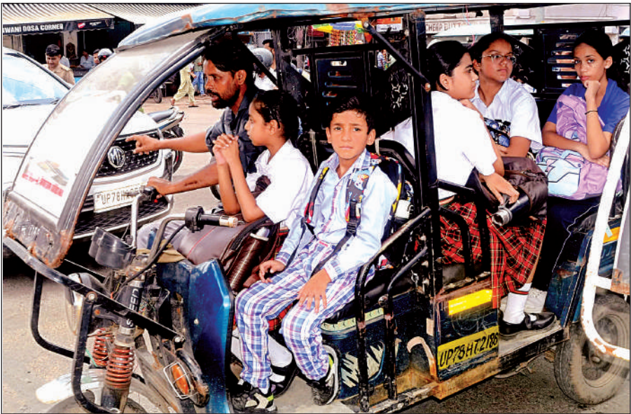
ई रिक्शों में क्षमता से अधिक स्कूली बच्चे भरे जा रहे।