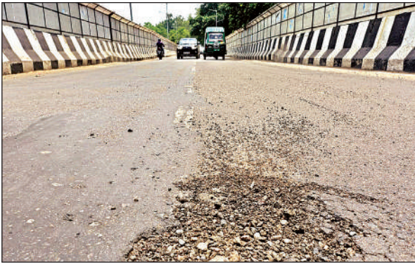
पनकी पाँवर हाउस पुल के बीच में गड्ढा और आसपास फैली सड़क की बजरी।