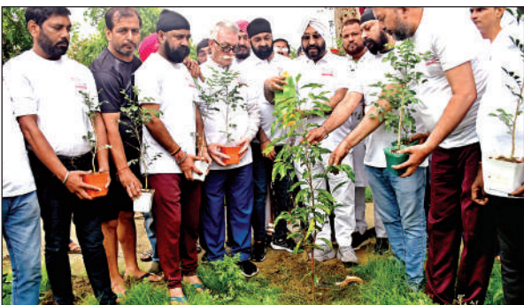
रामलीला पार्क में पौधरोपण के दौरान संस्था के पदाधिकारी ।

का शव अस्त-व्यस्त अवस्था में बेड बिखरा था। करीब तीन लाख रुपये और पांच लाख के जेवर बदमाश ले गए हैं।