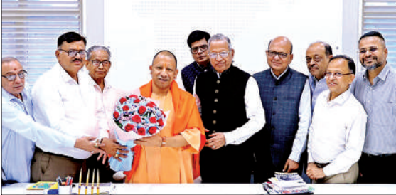
मुख्यमंत्री को आमंत्रण देने पहुंचे एसोसिएशन के पदाधिकारी।