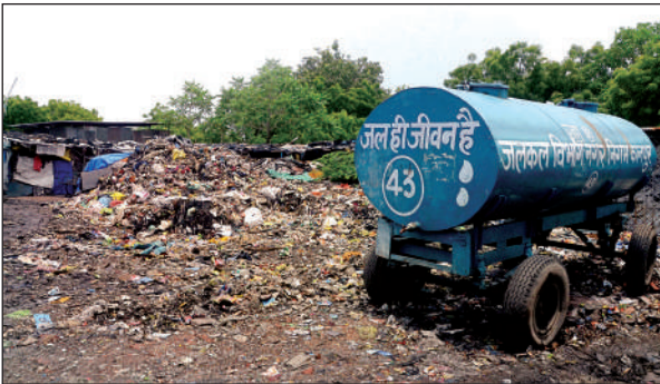
गंदगी के बीच खड़े किए जाते हैं पानी के टैंकर ।