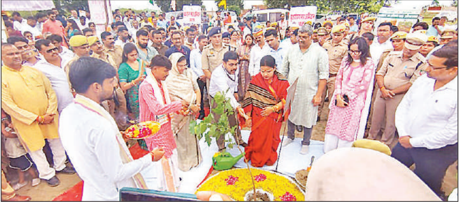
कटरी पीपर खेड़ा में पौधरोपण करती मुख्य अतिथि व अन्य लोग ।