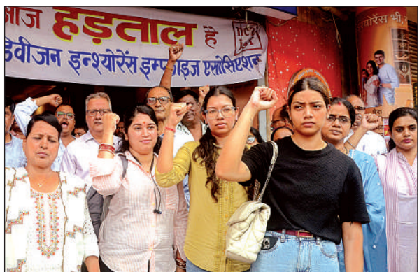
विरोध प्रदर्शन करती युवतियां।

कार्यालय संवाददाता, कानपुर अन्य प्रतिष्ठानों में मांगों को लेकर प्रदर्शन किया। इस दौरान न्यूनतम वेतन 26 हजार करने, ठेकेदारी प्रथा बंद करने, 8 घंटे काम, लेबर कोड रद किए जाने की आवाज बुलंद की गई। प्रदर्शन के दौरान रास्ता जाम किए जाने का भी प्रयास हुआ। इसे लेकर प्रदर्शनकारियों की पुलिस से नोकझोंक हुई। कर्मचारी नेताओं ने कहा कि असंगठित क्षेत्रों के मजदूरों को न्यूनतम वेतन से भी कम देकर