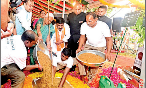
पौधरोपण करती राज्यपालआनंदीबेन पटेल।

● टीबी मरीजों को 101 पोषण पोटलियाँ वितरित की गई