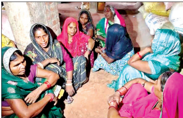
बच्चे की मौत के बाद गम में डूबी परिवार की महिलाएं।