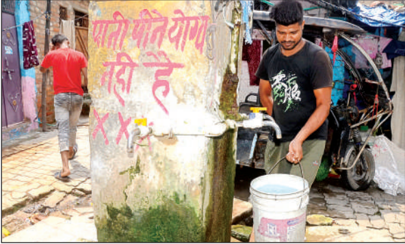
नलों के पास साफ लिखा है 'पानी पीने योग्य नहीं है' ।