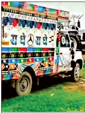
इसी पिकअप ने बच्चे की जान ली।