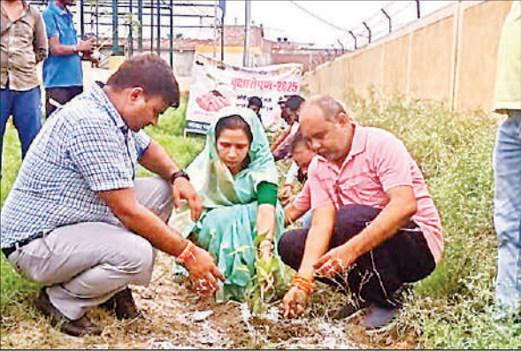
एमआरएफ सेंटर में पौधरोपण करती पालिकाध्यक्ष और ईओ ।