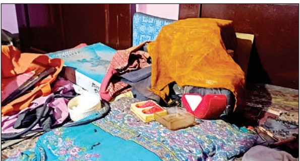
घटना के बाद घर का बिखरा हुआ सामान ।

से कमजोर हो गई थीं। दोपहर करीब साढ़े बारह बजे वह बाजार से आम खरीदने गए थे। करीब 2.30 बजे लौटते तो नीचे से पत्नी को आवाज दी, लेकिन कोई जवाब नहीं मिला। वह पहली मंजिल पर पहुंचे तो पत्नी