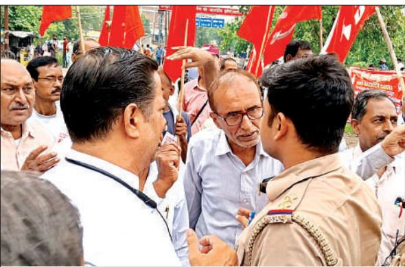
प्रदर्शन के दौरान पुलिस से झड़प करते वामपंथी नेता।