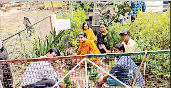
सैनिक कार्यालय में पौधरोपण करती स्ववाइन लीडर व अन्य ।