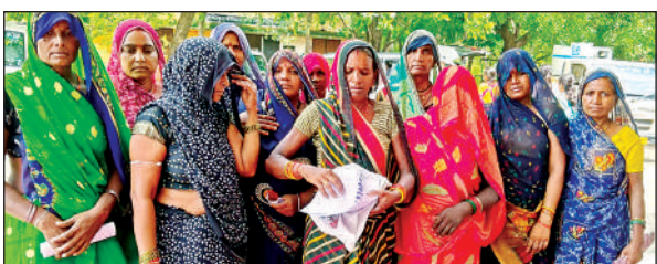
कलेक्ट्रेट के बाहर खड़ी पीड़ित महिलाएं।