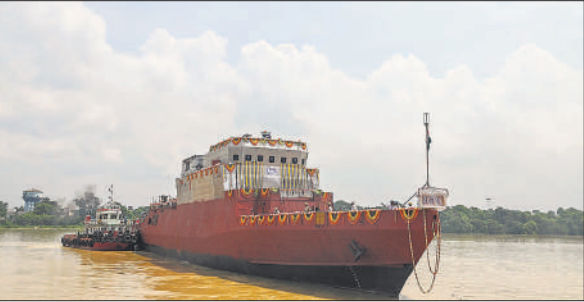
समुद्र की लहरों पर भारतीय नौसेना का युद्धक जहाज अजय।