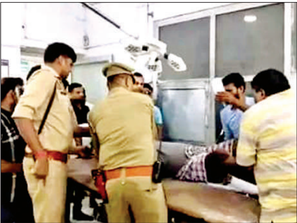
घायल चक्की संचालक को अस्पताल में भर्ती कराती पुलिस।