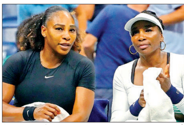
सेरेना विलियम्स व वीनस विलियम्स (दाएं)।

हमने शुरू से काफी कुछ साथ में किया है और इसलिए कुछ निश्चित तौर पर उसकी कमी खलती है। उन्होंने मुस्कराते हुए कहा लेकिन अगर वह वापसी करती है तो मुझे पूरा विश्वास है कि वह इस बारे में आप सबकी अवागत कर देगी। सेरेना 43 वर्ष की है और उन्होंने