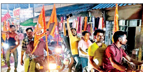
गुरसहायगंज में बाइक से गंगा तट जाते कांवड़िया।

वही सुबह से शाम तक लोग जलेश्वर, चियासर, सहपुर गंगा घाटों पर आस्था की डुबकी लगाते रहे। गंगा स्नान के बाद शिव भक्तों