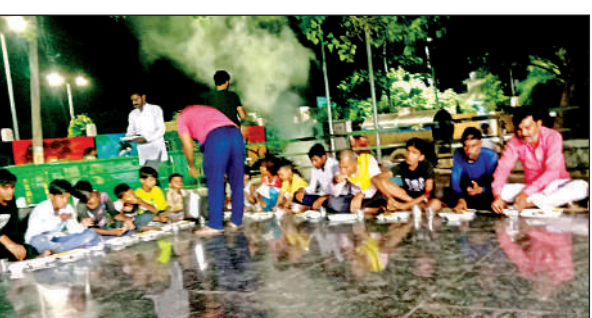
भंडारे में प्रसाद ग्रहण करते श्रद्धालु।

स्वास्थ्य केंद्र की स्थापना की सख्त आवश्यकता है। बताया कि सामुदायिक स्वास्थ्य केंद्र के निर्माण के लिए नगर पंचायत की ओर से कस्बे के अंदर ही गाटा संख्या 1026 और 1027 में 3 एकड़ 57 डिसिमिल भूमि भी चिन्हित कर दी है। अस्पताल स्थापित होने से पूरे नगर और आसपास के सैकड़ों गांव के लोगों को इलाज के लिए खासी सुविधा उपलब्ध हो सकेगी। स्वास्थ्य महानिदेशक ने फफूंद में बहुत जल्द ही सीएचसी का निर्माण कराने का चेयरमैन को भरोसा दिया है।