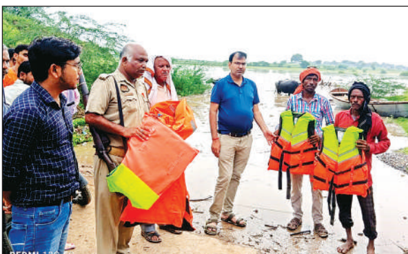
यमुना नदी के किनारे खड़े अधिकारी।

कालपी में यमुना नदी पर खतरा का निशान 108 मीटर पर है। जबकि चेतावनी प्वाइंट 107 मीटर पर दर्ज है। 20 जुलाई को जलस्तर तेजी से बढ़ने का सिलसिला शुरू हुआ। 21 जुलाई को जलस्तर 105.24 मीटर पर पहुंच गया। विभागीय सूत्रों के मुताबिक सोमवार को 7 घंटे तक जलस्तर थमा रहा। दोपहर को 3 बजे से यमुना नदी के जल स्तर में मामूली सी गिरावट शुरू हुई। शाम को जल स्तर 105.21 मीटर पर दर्ज किया गया है। केन्द्रीय जल