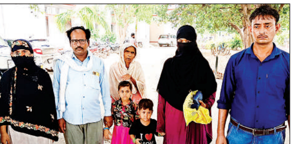
रिपोर्ट दर्ज कराने के लिये एसपी से गुहार लगाने पहुंचा परिवार।