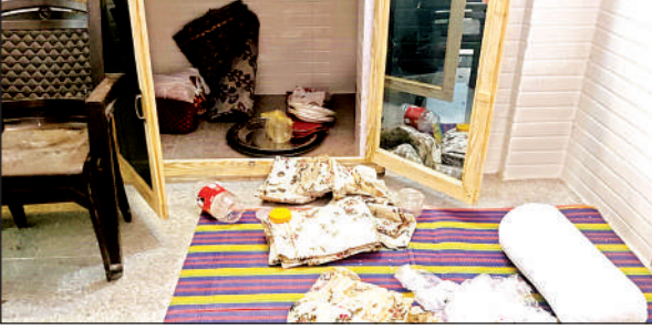
चोरी के बाद बिखरा पड़ा सामान।