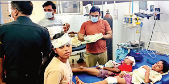
अस्पताल में घायल स्कूली बच्चों को देखते डॉक्टर।