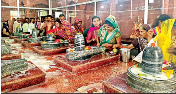
भगवान शिव की आराधना करते श्रद्धालु।

अमृत विचार। तहसील क्षेत्र में देवघट बाबा मंदिर मऊ गूरा, भयानक नाथ मंदिर कुदरकोट, वनखंडेश्वर मंदिर बिधूना, बूढ़े बाबा मंदिर ऐरवाकटरा समेत क्षेत्र के सभी शिवालयों में सावन के दूसरे सोमवार को हर-हर महादेव की गूंज रही। कांवड़ियों और शिवभक्तों ने भगवान भोलेनाथ का जलाभिषेक किया। कोतवाली पुलिस द्वारा सुरक्षा व्यवस्था के पुख्ता इंतजाम रहे। सावन के दूसरे सोमवार को क्षेत्र के सभी शिवालयों में जलाभिषेक के लिए ब्रह्म मुहूर्त से ही शिवभक्तों के पहुंचने का सिलसिला शुरू हो गया। तहसील क्षेत्र के शिवालयों में सुबह से ही शिव भक्तों की भारी भीड़ देखने को मिली। सभी जगह भक्तों ने जलाभिषेक कर भोलेनाथ की आराधना की एवं भयानक नाथ मंदिर कुदरकोट में हरिद्वार से 535 किमी की पैदल यात्रा कर गंगाजल