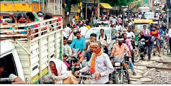
क्रौंसिंग पर लगा जाम।