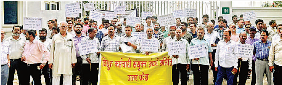
नियामक आयोग कार्यालय के सामने मौन प्रदर्शन करते बिजली विभाग के कर्मचारी।