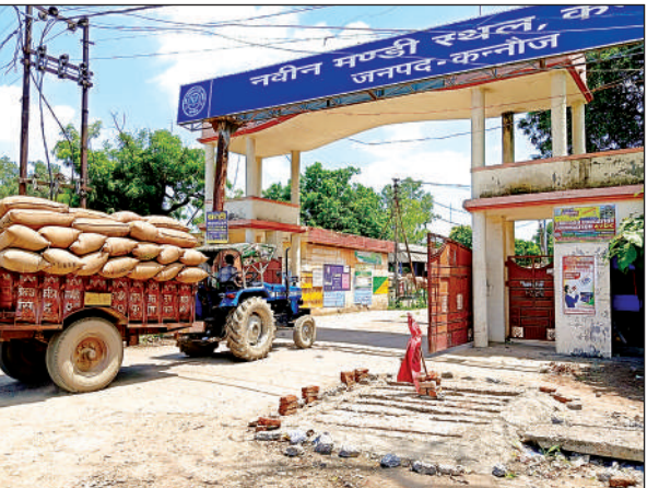
मण्डी गेट पर खुले नाले में डाली गई पटिया।

इसके बाद भी वाहन इसी नाले के निकट से गुजरते रहते थे। इससे