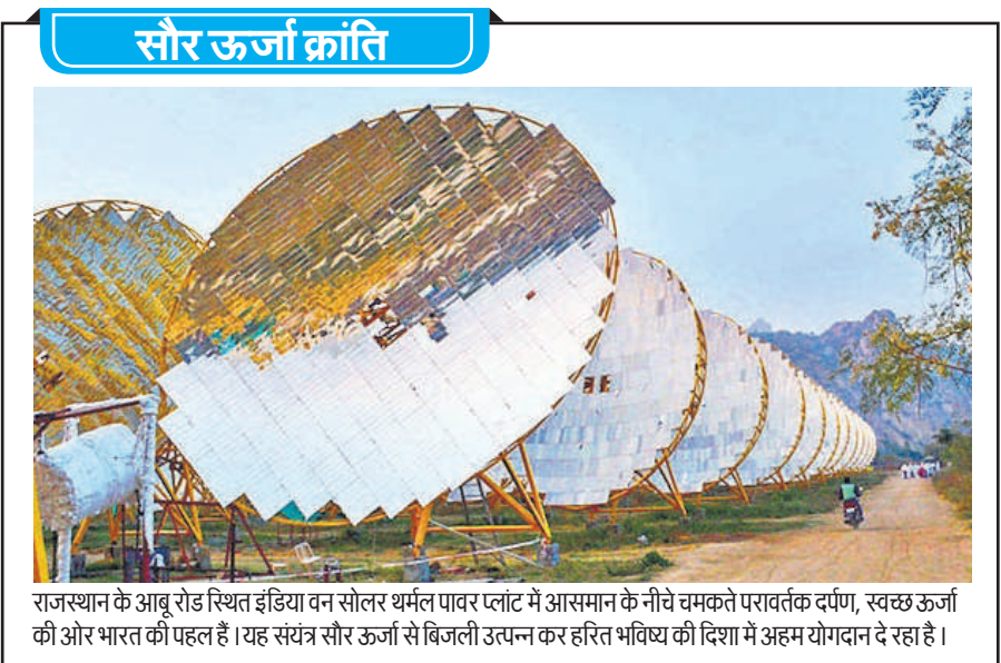
राजस्थान के आबू रोड स्थित इंडिया वन सोलर थर्मल पावर प्लांट में आसमान के नीचे चमकते परावर्तक दर्पण, स्वच्छ ऊर्जा की ओर भारत की पहल है। यह संयंत्र सौर ऊर्जा से बिजली उत्पन्न कर हरित भविष्य की दिशा में अहम योगदान दे रहा है।

अधिकारी ने कहा, 28 राज्यों/केंद्र शासित प्रदेशों में राज्य निर्यात रणनीति तैयार की गई है। इनमें उत्तर प्रदेश, महाराष्ट्र और कर्नाटक शामिल हैं। विदेश व्यापार नीति (एफटीपी) 2023 में, डीजीएफटी ने 'जिला निर्यात केंद्र' पहल को शामिल किया है। इसका उद्देश्य देश के प्रत्येक जिले की क्षमता और विविधता को दिशा प्रदान करके उन्हें निर्यात केंद्र बनाना है। इस लक्ष्य की प्राप्ति के लिए, देश के सभी जिलों में निर्यात क्षमता वाले उत्पादों और सेवाओं की पहचान की गई है। निर्यात संवर्धन के लिए सहायता देने और निर्यात वृद्धि की बाधाओं को दूर करने के लिए प्रदेश स्तर पर एसईपीसी और जिला स्तर पर डीईपीसी बनाई गई है।