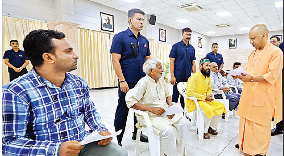
जनता दरबार में बुजुर्ग की समस्या सुनते मुख्यमंत्री योगी आदित्यनाथ।

योगी ने ‘‘जनता दर्शन’’ में आए एक दिव्यांग की बात सुनने के बाद उसे मोटराइज्ड ट्राई साइकिल दिलाने के निर्देश दिए। पुलिस, राजस्व, चिकित्सा सहायता, रोजगार, शिक्षा, आवास, कब्जा, परिवार आदि से जुड़े मामलों पर मुख्यमंत्री ने संबंधित अधिकारियों को त्वरित और संतुष्टिपरक निस्तारण का निर्देश दिया। लोगों को भरोसा दिलाया कि सरकार हर पीड़ित की समस्या का समाधान करने के लिए दृढ़ संकल्पित है। सबको न्याय मिलेगा। मुख्यमंत्री योगी आदित्यनाथ ने ‘‘जनता दर्शन’’ में अभिभावकों के साथ आए बच्चों की बातचीत की। उनका हालचाल जाना, दुलार किया। बच्चों की पढ़ाई के बारे में भी जानकारी ली। सीएम योगी ने चॉकलेट-टॉफी देकर बच्चों को उज्ज्वल भविष्य का आशीर्वाद दिया।