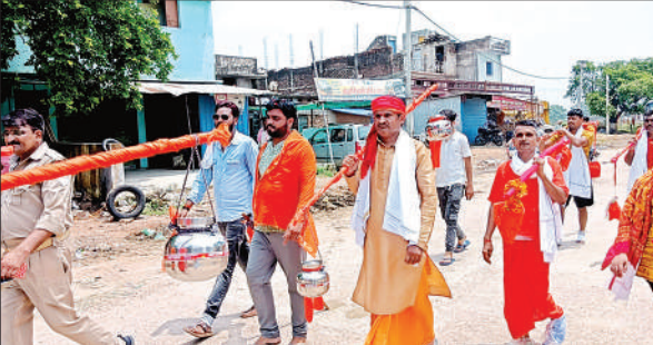
स्वागत के बाद जाता कांवड़ियों का जत्था।