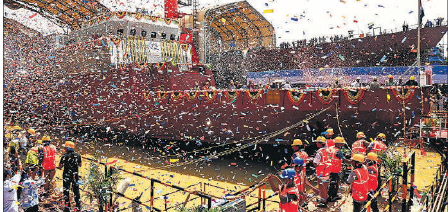
पनडुब्बी रोधी युद्धक जलयान अजय को एक समारोह में भारतीय नौसेना के हस्तारित किया गया।

नक्षत्र-मृगशिरा 07.24 तक तत्पश्चात आर्द्रा।