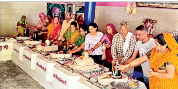
राम कथा मार्ग शिव मंदिर में पूजा-अर्चना करते श्रद्धालु।