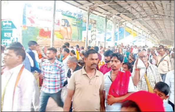
परिक्रमा मार्ग पर उमड़ी श्रद्धालुओं की भीड़।