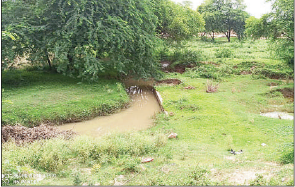
कछुआ नाला, जहां से मिले थे बोरे में मासूम बच्चों के शव।