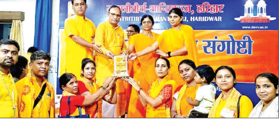
नारी उत्कर्ष समारोह में मौजूद गायत्री परिवार के लोग।