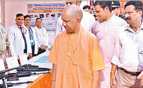
गोरखपुर के 26वीं वाहिनी पीएसपी परिसर में लगाई गई प्रदर्शनी देखते मुख्यमंत्री योगी।

विधानसभा के शीतकालीन सत्र में कई विधायी कार्यों को निपटाने की तैयारी अमृत विचार, लखनऊ : उग्र . विधानसभा के शीतकालीन सत्र की तैयारियां तेज हैं। कई विधायी कार्यों को निपटाने की कार्यसूची लाभगम तय है। इन कार्यों को निपटाने के लिए तारीख व संबधित एजेंडे को कार्यमंत्रणा समिति में रखकर अंतिम फैसला लिया जाएगा। दरअसल, व्यवस्था यह है कि विधान सभा सत्र के लिए नियत तिथि की सूचना सदस्यों को अमतौर पर सात दिन पहले प्रमुख सचिव, विधान सभा स्तर से दी जाएगी। इस शीतकालीन सत्र में कई विधायी कार्य निपटाए जाएंगे वहीं, सत्र के दौरान राज्य सरकार कई अध्यादेशों को भी मंजूरी के लिए सदन में पेश कर सकती है। वहीं दूसरी ओर कैबिनेट ने विधानमंडल में सीएजी की रिपोर्ट पेश करने के लिए राज्यपाल की अनुमति लेने का वित्त विभाग का प्रस्ताव भी स्वीकृत किया है। मानसून सत्र में सीएजी की रिपोर्ट भी सदन के पटल पर रखा जाना संभव है। मौजूदा विधानसभा अध्यक्ष सतीश महाना के रहते विधानभवन ही नहीं सदन की कार्यवाहियों में भी बदलावों का दौर है। इस शीतकालीन सत्र में भी विधानभवन की व्यवस्था और अंदरूनी साजसज्जा में और आकर्षक परिवर्तन दिखेंगे। इस बार सदस्यों को आर्टिंफिशियल इंटेलिजेंस की भी ट्रेनिंग दिए जाने की तैयारी है।