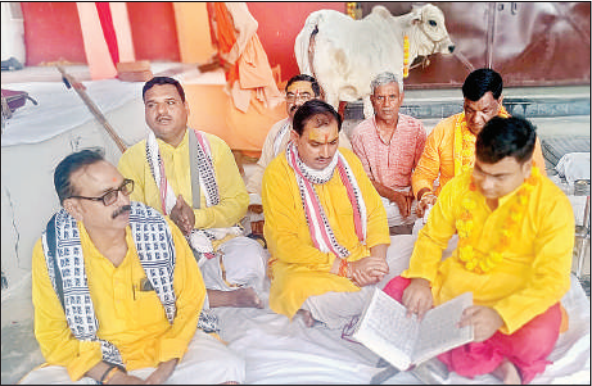
श्रीरामचरित मानस का पाठ करते श्रद्धालु।