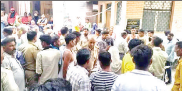
अस्पताल के बाहर लगी लोगों की भीड़।