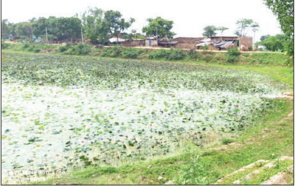
अमान गांव का वह तालाब जहां से मिला था महिला का शव।