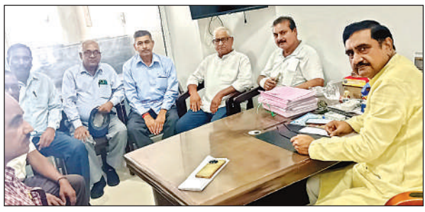
सैनिक प्रकोष्ठ संयोजक ने की बैठक।

अमृत विचार। कारगिल युद्ध के दौरान जनपद सहित अन्य शहीद हुए सैनिकों को जिला सैनिक कल्याण कार्यालय परिषद में शहीद स्थल पर पहुंचकर कारगिल शहीदों को कैंडल जलाकर श्रद्धांजलि दी जाएगी। भारतीय जनता पार्टी के सैनिक प्रकोष्ठ के जिला संयोजक