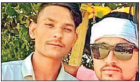
मृतकों की फाइल फोटो।