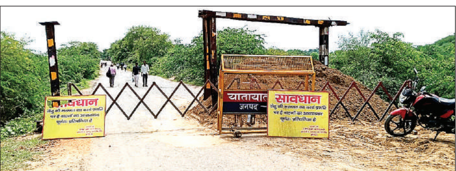
प्रशासन की ओर से पुल के पहले लगाई गई बैरिकेडिंग।