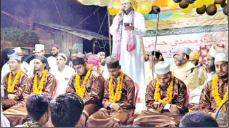
दस्तारबंदी में शामिल हाफिज।