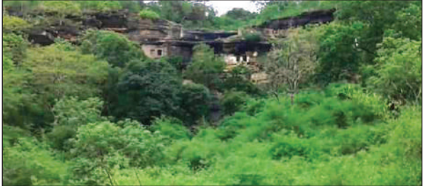
पहाड़ के बीच स्थित है बांकेसिद्ध आश्रम।