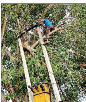
बिजली ठीक करता लाइनमैन।

अछल्दा। गुरुवार सुबह करीब 5 बजे गुनौली फीडर पर शिव मंदिर के पास एक विशाल बरगद का पेड़ 11 हजार वोल्ट की हाईटेशन लाइन पर गिर गया, जिससे करीब 20 गांवों की बिजली आपूर्ति ठप हो गई। बिजली गुल होने से इन्वर्टर, मोबाइल चार्जिंग और पानी की भारी समस्या खड़ी हो गई। बिजली विभाग की टीम शाम को मरम्मत कार्य में जुटी रही। करीब शाम 6 बजे लाइन दुरुस्त कर आपूर्ति बहाल की गई। इस दौरान भीषण गर्मी और उमस में ग्रामीण बेहाल रहे। बिजली बाधित होने से प्रभावित गांवों में महाराजपुर, वंशी, जखा,