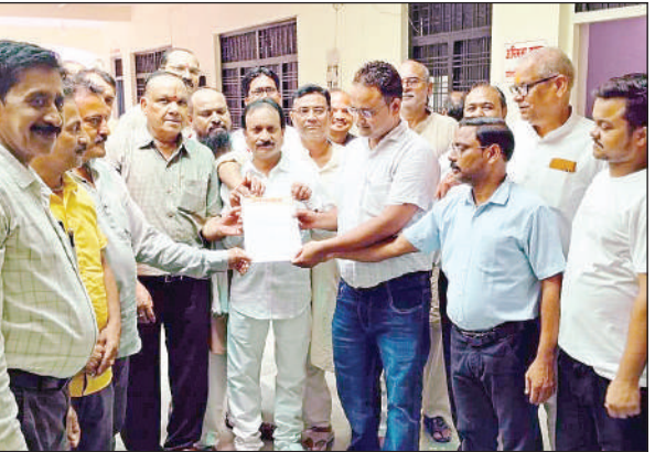
एसडीएम को ज्ञापन सौंपते व्यापारी।

से व्यापारियों के लिए दमनकारी नीति अपनाने हुए उनके बैंक खातों को सीज किया जा रहा है। खातों से बिना व्यापारी की सहमति से धन निकासी भी की जा रही है। बताया कि जीएसटी विभाग के द्वारा इंमेल से नोटिस दी जाती है। जिसे व्यापारी देख नहीं पाते हैं। व्यापारियों के खाते सीज कर दिए जाते हैं तथा