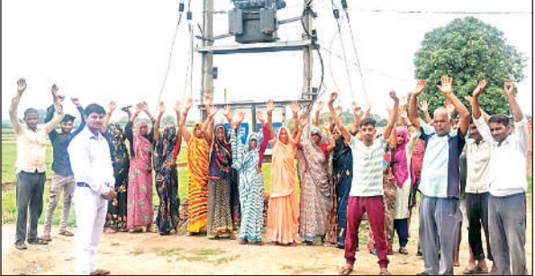
विरोध प्रदर्शन करते ग्रामीण।