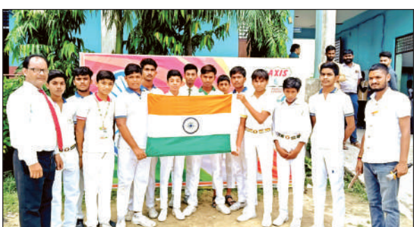
ध्वजारोहण लिए खड़े बच्चे।