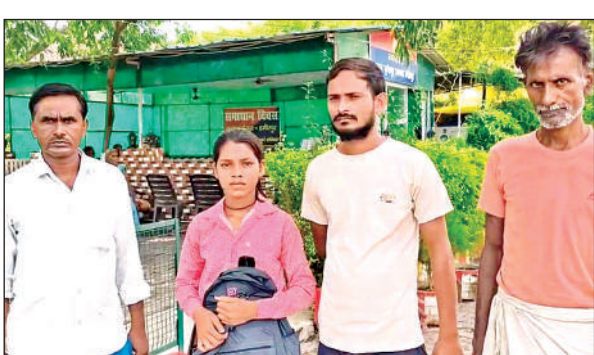
घटना की जानकारी देती छात्रा व परिजन।

अमृत विचार। शनिवार को सुबह घर से स्कूल जा रही कक्षा 6 की छात्रा का अज्ञात साधु वेशधारी दो बदमाशों ने पुरानी गोश्त मंडी के पास अपहरण करने का प्रयास किया। छात्रा के शोर मचाने पर दोनों मौके से भाग निकले। छात्रा ने घर वापस जाकर घटना से परिजनों को अवगत कराया। परिजनों ने पुलिस को सूचित किया। पुलिस ने घटनास्थल के आसपास लगे सीसीटीवी फुटेज खंगाले हैं। पुलिस में घटनास्थल के आसपास लगे सीसीटीवी फुटेज खंगाले हैं। पुलिस में घटनास्थल के आसपास लगे सीसीटीवी फुटेज खंगाले हैं। पुलिस में घटनास्थल के आसपास लगे सीसीटीवी फुटेज खंगाले हैं।