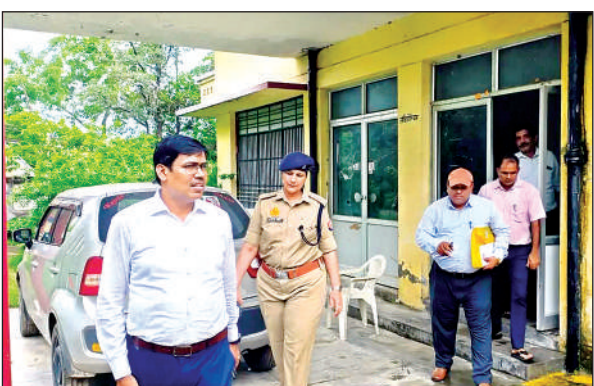
परीक्षा केन्द्र का जायजा लेते अधिकारी।

अमृत विचार। जिले में आरओ और एआरओ की 27 जुलाई को होने वाली परीक्षा की तैयारी को लेकर प्रशासन अलर्ट है। परीक्षा सकुशल सम्पन्न कराने के लिए जिला प्रशासन ने सारी तैयारियां पूरी कर ली है। शनिवार को अपर जिलाधिकारी रामप्रकाश और अपर पुलिस अधीक्षक वंदना सिंह ने संयुक्त रूप से शहर के विभिन्न परीक्षा केंद्रों का निरीक्षण किया। दोनों अधिकारियों ने केंद्रों पर पहुंचकर व्यवस्थाओं का जायजा लिया। उन्होंने परीक्षा से जुड़ी मूलभूत सुविधाओं और सुरक्षा प्रबंधों की गहन समीक्षा की। केंद्र प्रभारियों से व्यवस्थाओं की जानकारी लेकर आवश्यक निर्देश भी दिए गए।