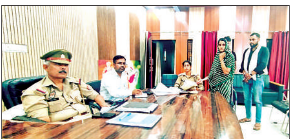
फरियादियों की समस्याओं को सुनते अधिकारी।

जाग कर काट रहे हैं। इससे ग्रामीणों में खासा गुस्सा है। दो दिन से बिजली व्यवस्था ठप होने के कारण इन्वर्टर भी काम नहीं कर रहे हैं।