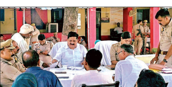
समाधान दिवस में शिकायतें सुनते अधिकारी।

कर व्यवस्थाओं को देखा। जहां अधिकारियों ने केंद्र व्यवस्थापकों को परीक्षा शक्तिपूर्ण व सुचिंतितपूर्ण ढंग से कराने के निर्देश दिए। रविवार सुबह साढ़े नौ बजे से साढ़े 12 बजे तक गांधी इंटर कॉलेज, नेशनल इंटर कॉलेज और रहमानिया इंटर कॉलेज तीनों परीक्षा केंद्रों पर कुल 1440 परीक्षार्थी परीक्षा देंगे।