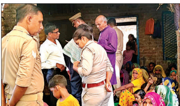
शव गांव में आते ही परिजन बिफर उठे।

अचनपुर फीडर से जुड़ी 11000 वोल्टेज की मुख्य बिजली लाइन टूटने से क्षेत्र के आठ गांवों में पिछले 12 घंटे से बिजली आपूर्ति ठप है। इन प्रभावित गांवों में कमारा मौजा में स्थित वह गांव भी शामिल है, जो अछल्दा ब्लॉक के अंतर्गत आते हैं। स्थानीय प्रशासन और बिजली विभाग की टीमों मौके पर पहुंच गई हैं, लेकिन कई खंभों के टूटने होने के कारण मरम्मत कार्य में काफी समय लगने की आशंका है। वीडियो में गांव तक टूटे हुए बिजली के खंभों को स्पष्ट रूप से देखा जा सकता है, जो क्षति की भयावहता को दर्शाता है। अधिकारियों का अनुमान है कि बिजली आपूर्ति आज शाम तक भी बहाल नहीं हो पाएगी, जिससे ग्रामीणों को और अधिक परेशानी का सामना करना पड़ सकता है। काटमऊ फीडर की बिजली आपूर्ति ठप हो जाने से अछल्दा विकासखंड क्षेत्र के धमसिया, भूलईपुर, खेरा, खुमानपुर, बघईपुर सहित कई गांव प्रभावित हैं।