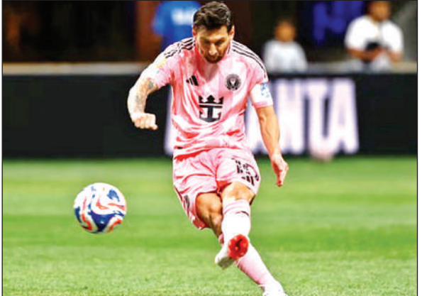
क्लब इंटर मियामी के एक मैच के दौरान किंग लगाते लियोनेल मेसी।

लियोनेल मेसी और जोर्डॉ अल्बा को ऑल स्टार मैच में भाग नहीं लेने के कारण मेजर लीग सॉकर (एमएलएस) ने एक मैच के लिए निलंबित कर दिया है जिसका उनके क्लब इंटर मियामी ने विरोध किया है। इंटर मियामी के मालिक जॉर्ज मास ने शुक्रवार को एक मैच के निलंबन के बारे में कहा यह उनकी समझ से परे है कि प्रदर्शनी मैच में भाग न लेने पर सीधे निलंबन क्यों हो जाता है। मेसी और अल्बा ने एमएलएस और मैक्सिको के लीगा एमएक्स के बीच मैच के लिए टीम में चुने जाने के बावजूद हिस्सा नहीं लिया था। मेसी व्यक्ति कार्यक्रम के बीच आराम करने के लिए नहीं खेलें और अल्बा अपनी पिछली चोट से जूझ रहे हैं। मास ने कहा कि क्लब ने मेसी और अल्बा को ऑल-स्टार मैच से बाहर रखने का फैसला किया। एमएलएस के नियमों के अनुसार, कोई भी