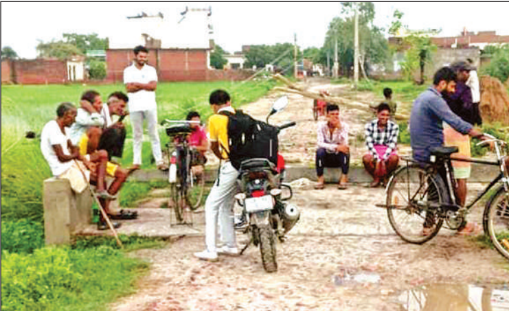
मौके पर लगी लोगों की भीड़।