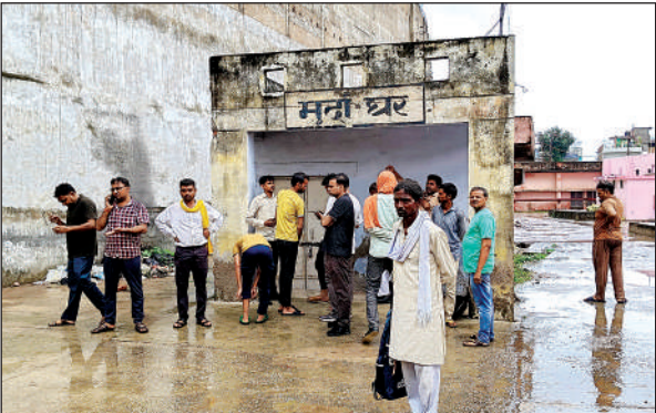
अस्पताल परिसर में जुटी युवकों के परिजनों की भीड़।