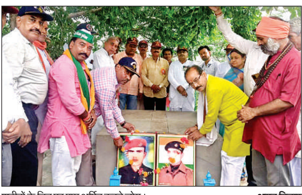
शहीदों के चित्र पर पुष्प अर्पित करते लोग।