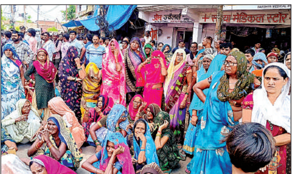
हमीरपुर- कालपी हाईवे में जाम लगाए परिजन व मोहल्ले के लोग।