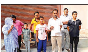
अपनी बात रखें लोग।

वाहन को अंदर न जाने को लेकर शिकायत की थी। तब वाहन को अंदर आने से बंद कर दिया गया था। अब पुनः अंदर वाहन आना शुरू हो गए हैं। विद्युत पोल गड़े होने से स्कूली बस सड़क के किनारे बनी