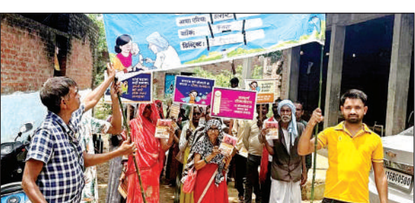
डामर गांव में जागरूकता रैली निकालते लोग।