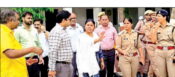
मौदहा में परीक्षा केंद्र का निरीक्षण करते डीएम व एसपी।