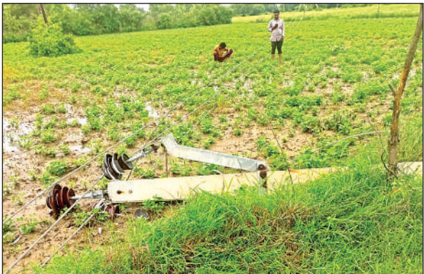
खेत पर टूटा पड़ा बिजली का खंभा।

शुक्रवार की देर शाम को अचानक तेज आंधी आने से क्षेत्र के आधा दर्जन बिजली के खंभे टूट कर गिर गए हैं। इससे जैतपुर, अजनर, धवरी फीडर से जुड़े एक सैकड़ गांव धवरी, अजनर, जैतपुर, कुड़ई, हसला, गुडा, थुरट, मगरिया, जैलवारा, बगवहा, कैथौरा, लमौरा, महुआबांध छितरवारा, सहारनपुरा, अमानपुरा, महानपुरा, महेंवा की बिजली आपूर्ति ठप हो गई। इससे ग्रामीणों को दो दिनों से अंधेरे में रहना पड़ रहा है। सबसे ज्यादा दिक्कत बिजली न आने से मोबाइल चार्ज करने की में और रोजमर्रा के काम करने में हो रही है।