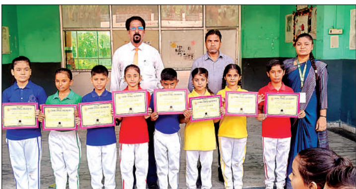
कारगिल विजय दिवस पर कार्यक्रम करते बच्चे।