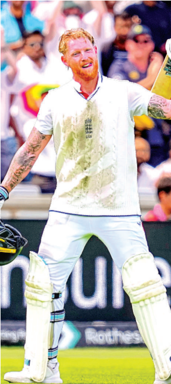
शतक लगाने के बाद जश्न मनाते इंग्लैंड के कप्तान बेन स्टोक्स।

कराची : एशियाई क्रिकेट परिषद (एसीसी) के अध्यक्ष मोहसिन नकवी ने शनिवार को घोषणा की कि पुरुषों का एशिया कप नौ से 28 सितंबर तक संयुक्त अरब अमीरात (यूएई) में आयोजित किया जाएगा। पाकिस्तान क्रिकेट बोर्ड (पीसीबी) के अध्यक्ष नकवी ने एक्स पर एक ओपनपब्लिक घोषणा में बताया मुझे यूएई में एसीसी पुरुष एशिया कप 2025 की तारीखों की पुष्टि करते हुए खुशी हो रही है। यह प्रतिष्ठित टूर्नामेंट नौ से 28 सितंबर तक होगा। इसका विस्तृत कार्यक्रम जल्द ही जारी किया जाएगा। एशिया कप के आयोजन स्थल का निर्णय 24 जुलाई को एसीसी की बैठक में किया गया।