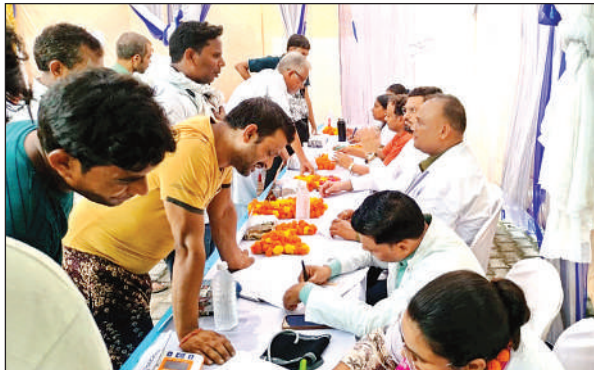
शिविर में मरीजों को देखते चिकित्सक मौजूद चेयर।