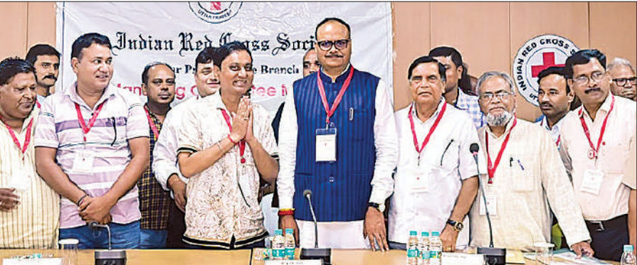
लखनऊ में आयोजित कार्यक्रम में शामिल उप मुख्यमंत्री ब्रजेश पाठक व रेडक्रॉस सोसाइटी के पदाधिकारी।

अमृत विचार, लखनऊ : सपा ने शनिवार को पूरे प्रदेश में आरक्षण दिवस को संविधान मानस्तंभ दिवस के रूप में मनाया। सपा प्रमुख अखिलेश यादव ने कहा है कि भारत के संविधान की प्रति के सान्निध्य में संविधान मानस्तंभ स्थापना दिवस आयोजित करके हम ‘सामाजिक न्याय’ व समता-समानता’ और आरक्षण को बचाए-बनाए रखने का अपना संकल्प दोहरा रहे हैं। इसके पीछे यही मूल भावना है कि संविधान मानस्तंभ वस्तुतः पीडीए प्रकाशस्तंभ के रूप में हमारे सामाजिक न्याय के राज की स्थापना के संकल्प का मार्ग सदैव प्रकाशित और प्रशस्त करता रहे। जब संविधान बचेगा तभी आरक्षण बचेगा। संविधान ही ढाल है, संविधान ही कवच है।