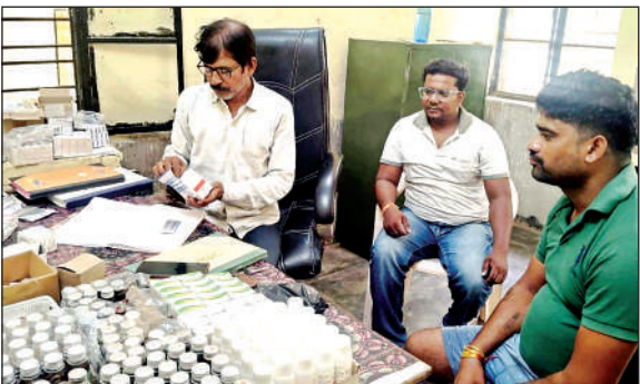
आरोग्य मेले में मरीजों का उपचार करते फार्मासिस्ट।