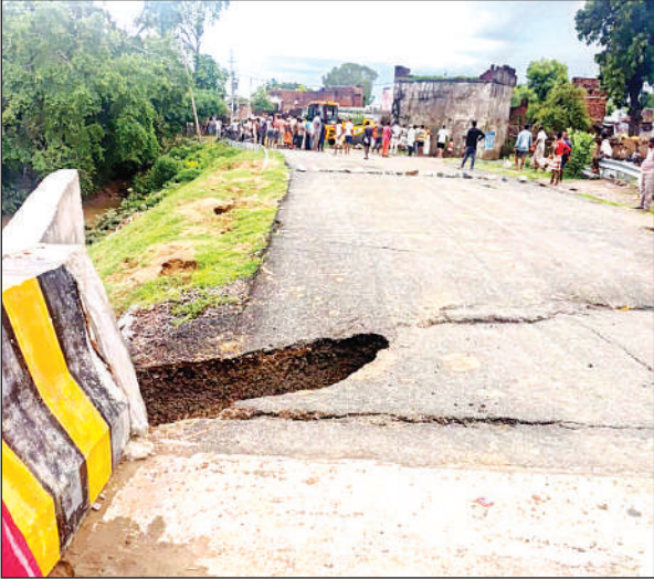
भौरी के देहरुछ माफी, बधवारा के बीच बना वाल्मीकी नदी पर पुल की हालत, इससे लोग डरकर कर रहे हैं आवागमन ।