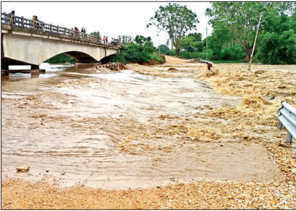
मोहरवां के जर्जर पुल से आतेजाते वाहन, बगल में अप्रोच रोड की स्थिति ।