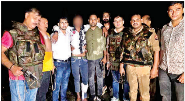
पुलिस गिरफ्तार में मौजूद गोतस्कर।