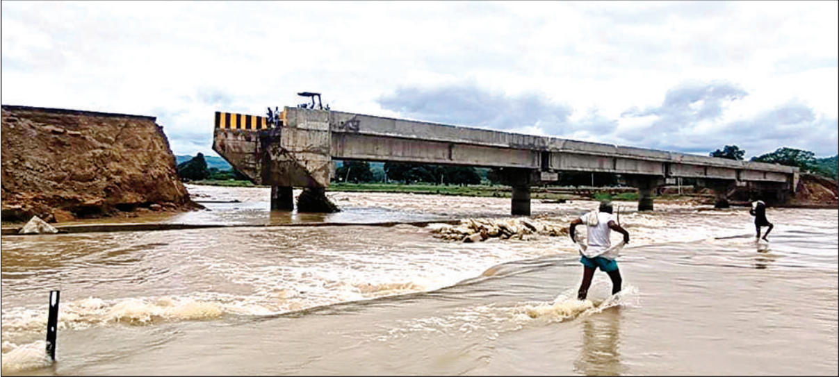
कल्याणपुर के पास बने पुल की टूटी एप्रोच रोड ।