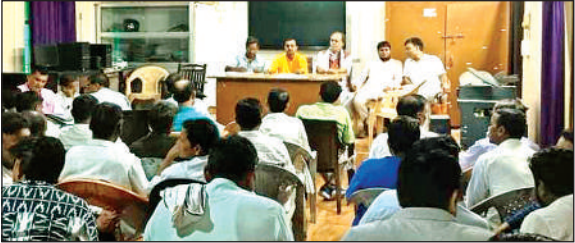
प्राथमिक शिक्षक संघ की बैठक में मौजूद शिक्षक।