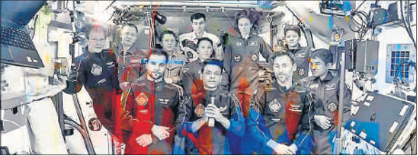
आईएसएस में विदाई समारोह के दौरान शुभांशु शुक्ला व अन्य अंतरिक्ष यात्री।

अंतरिक्ष यात्री शुभांशु शुक्ला ने रविवार को कहा कि भारत अंतरिक्ष से महत्वाकांक्षा, निडरता, आत्मविश्वास और गर्व से भरा नजर आता है। शुक्ला ने भारत के प्रथम अंतरिक्ष यात्री राकेश शर्मा के 1984 में कहे शब्दों को दोहराते हुए कहा, आज भी भारत ऊपर से सारे जहां से अच्छा दिखता है। उन्होंने आईएसएस पर एक्सओम-4 मिशन के अंतरिक्ष यात्रियों के लिए आयोजित विदाई समारोह में यह कहा। शुक्ला ने आईएसएस में अपने प्रवास