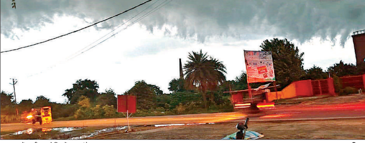
आसमान में काली घटा से दिन में छाया अंधेरा।

एसपी व डीआईजी के समक्ष जाकर अपनी समस्या बतायेगा। 16 जुलाई को किसान दिवस में शामिल होकर समस्या को डीएम के सामने रखेंगे। 17 से 20 जुलाई तक प्रतिनिधि मंडल द्वारा मौके पर जाकर मीटिंग की जाएगी। 21 जुलाई से छिबरामऊ से कन्नौज तक कोतवाल से पीड़ित परिवारों के साथ पदयात्रा कर एसपी के समक्ष समस्याओं को रखा जाएगा और निस्तारण कराने हेतु अनिश्चितकालीन धरना प्रदर्शन किया जाएगा। पदयात्रा में कानपुर मंडल में आने वाले 6 जिलों के पदाधिकारी भी शामिल हो सकते हैं।