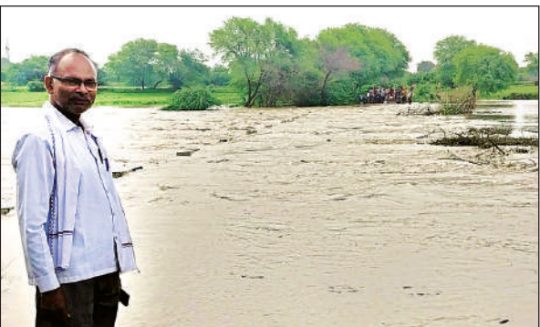
चंद्रावल नदी के रपटे के ऊपर बहता पानी, निकलने को खड़ा ग्रामीण।

मौदहा कस्बे सहित क्षेत्र में तीन दिन से लगातार हो रही बारिश से चंद्रावल नदी उफान पर आ गई है