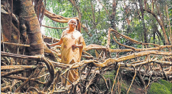
मेघालय के सीज गांव में जीवित जड़ों से बने पुल का दौरा करती निर्मला सीतारमण।

केंद्रीय वित्त मंत्री निर्मला सीतारमण ने मेघालय के ईस्ट खासी हिल्स जिले के ‘लिविंग रूट ब्रिज’ को यूनेस्को विश्व धरोहर का दर्जा दिलाने के प्रयासों के प्रति पुरजोर समर्थन व्यक्त किया है। सीतारमण ने मान्यता के लिए नामांकन को बहाल करने और सामुदायिक सहभागिता एवं अंतर्राष्ट्रीय साझेदारी के माध्यम से प्रस्ताव को मजबूत करने के लिए हाल में जमीनी स्तर पर हुई प्रगति की सराहना की। ‘लिविंग रूट ब्रिज’ ऐसा पुल होता है, जो पेड़ों की जड़ों से तैयार किया गया जाता है। सीतारमण ने कहा कि वैश्विक मान्यता न केवल पारंपरिक ज्ञान का सम्मान करेगी, बल्कि दूसरों को स्थानीय ज्ञान पर आधारित स्थायी प्रथाओं को अपनाने के लिए भी प्रेरित