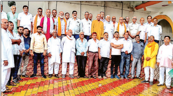
बैठक कर चर्चा करते संगठन के पदाधिकारी।