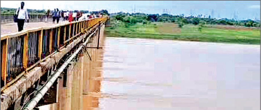
यमुना नदी का बढ़ा जल स्तर।

मुख्यालय यमुना और बेतवा नदी के बीचों बीच बसा है। बरसात के मौसम में प्रत्येक वर्ष यहां बाढ़ के चलते सैकड़ों परिवारों को परेशानियों का सामना करना पड़ता है। जनपद सहित अन्य जनपदों में हो रही लगातार बारिश के चलते बांधों से पानी छोड़े जाने और लगातार हो रही बारिश से यमुना व बेतवा नदी के जलस्तर में बढ़ोत्तरी