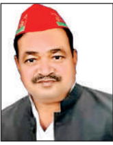
सांसद अजेंद्र सिंह लोधी

अमृत विचार। हमीरपुर, महोबा, तिंदवारी संसदीय क्षेत्र से पहली बार सांसद चुने गए अजेंद्र सिंह लोधी चुनाव जीतने के बाद से जनता से दूर हो गए हैं। स्थिति यह है कि एक साल तीन माह पहले सांसद बने सपा के अजेंद्र लोधी सवा साल के कार्यकाल में मात्र एक बार तिंदवारी गए। कमोवेश यही स्थिति महोबा, हमीरपुर