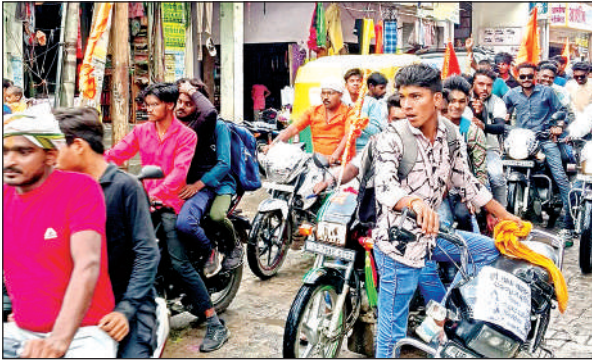
सिंगिरामपुर के लिए रवाना होता श्रद्धालुओं का जत्था।

फफूंद के मोहल्ला मोतीपुर, बाबा का पुरवा, तिवारीयन, कटरा मनेपुर आदि मोहल्ला एवं अछल्दा नेविलगंज, बिधूना, दिबियापुर, मुरादगंज, बाबरपुर, सहार, अटसू, औरैया एवं आसपास जिला के कांवड़िया अपनी कांवड़ महाकालेश्वर पर चढ़ाएंगे।