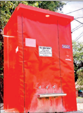
खराब पड़ा वाटर कूलर।