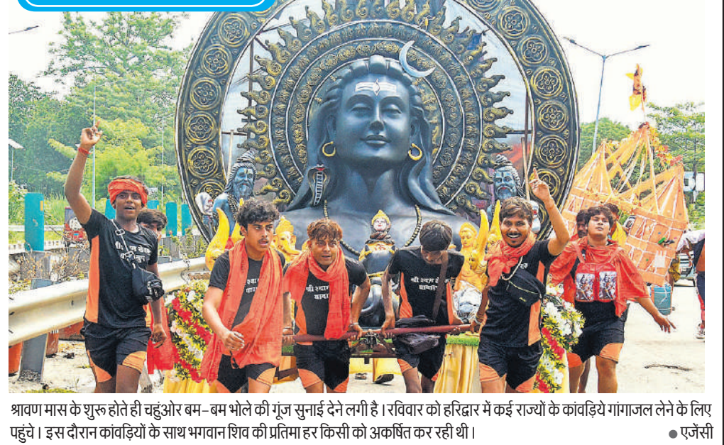
श्रावण मास के शुरू होते ही चहुँओर बम-बम भोले की गूँज सुनाई देने लगी है। रविवार को हरिद्वार में कई राज्यों के कांवड़िये गंगाजल लेने के लिए पहुंचे। इस दौरान कांवड़ियों के साथ भगवान शिव की प्रतिमा हर किसी को अकषित कर रही थी।