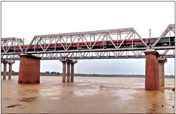
यमुना का बढ़ा जल स्तर।

● रविवार को यमुना नदी का जलस्तर 98.77 मीटर पर रहा