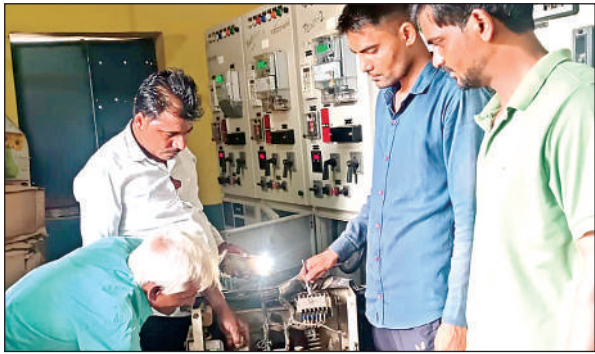
मशीन ठीक करते कर्मचारी।