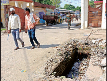
मंडी गेट पर नाले की टूटी पटिया।