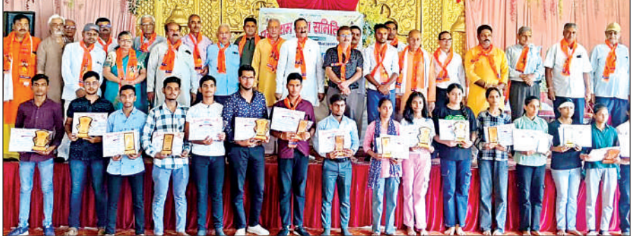
पदाधिकारियों के साथ सम्मानित बच्चे ।