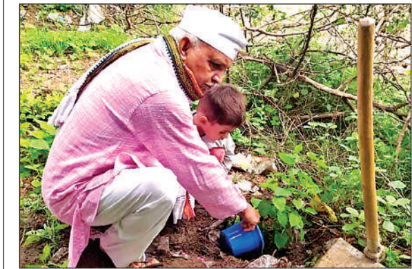
पौधरोपण करते समाजसेवी।