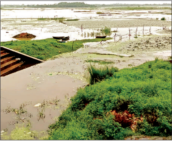
धवल नाले से बेलासागर में जाता पानी।

इस साल ग्रामीणों और जनप्रतिनिधियों के आगे आने से सिंचाई विभाग के अधिकारियों ने धवल नाले की सफाई करा दी, जिससे सरोवर में न जाने वाला पानी इस साल सफाई हो जाने के बाद तेजी से बेलासागर में जा रहा है। यही वजह है कि बारिश के शुरुआती