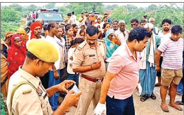
घटनास्थल पर लगी भीड़।