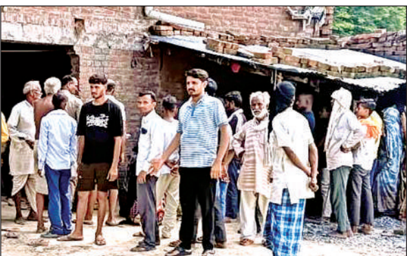
मृतक के घर के बाहर लगी भीड़।