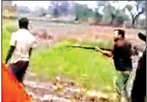
असलहा दिखाता आरोपी।