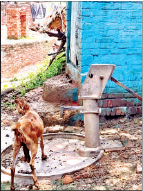
हैंडपंप में बंधी बकरी।