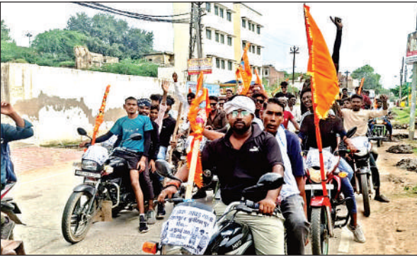
गंगाजल लेकर जाते श्रद्धालु।

अमृत विचार। सावन माह का पहला सोमवार आज होने से रविवार को दिन भर शिवालयों में साफ-सफाई तैयारियां चलीं। जिले भर में शिव भक्त अपने अराध्य को जल चढ़ाने के लिए कांवड़ लेकर निकले। इससे सारा दिन बाबा के जयकारे गूंजते रहे। जिला प्रशासन की तरफ से सुरक्षा व्यवस्था के पुख्ता इंतजाम किए जा रहे हैं। अलग-अलग अधिकारी भी सुरक्षा व्यवस्था के लिए लगाए गए हैं। कई मंदिर परिसरों के बाहर पाकिंग, साफ-सफाई, स्वास्थ्य विभाग की ओर से स्वास्थ्य शिविर की सुविधा की गई। पीने की जल की व्यवस्था एवं महिला व पुरुष की अलग-अलग लाइन निर्धारित की गई हैं। फफूंद नगर एवं ग्रामीण श्रद्धालु अपने-अपने बाइक से बिटूर से गंगाजल लाकर देवकली के महाकालेश्वर मंदिर पर जला