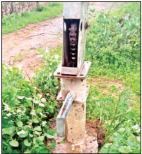
खराब पड़ा हैंडपंप