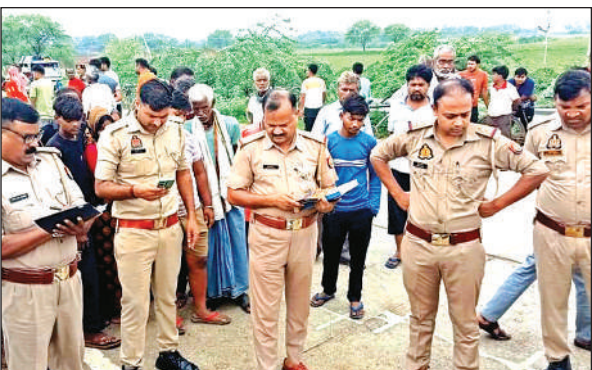
घटना की जांच करती पुलिस।