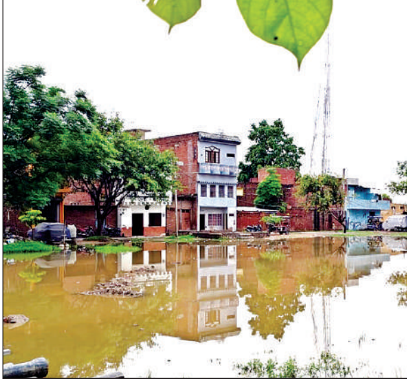
गुरसहायगंज नगर के रामलीला मैदान में हुआ जलभराव।

मौसम विभाग ने पहले ही भारी बारिश और आंधी की चेतावनी जारी की थी। रविवार की दोपहर बाद कुछ ही देर में झमाझम बारिश शुरू हो गई जिससे शहर की गलियां और सड़कें पानी से लबालब हो गईं। जल निकासी व्यवस्था की पोल खुल गई। नालियां और सड़कें जलमग्न हो गईं। करीब दो घंटे तक हुई झमाझम वारिश के कारण नगर की चकोरे गली, किदबई नगर, अशोक नगर, आजाद नगर आदि में जलभराव की स्थिति उत्पन्न हो गई। थोड़ी देर की बारिश ने गलियों को जलमग्न कर दिया। जिससे बरसात का पानी गंदगी लेकर लोगों के घरों में जा घुसा। मुख्य मार्ग, बस