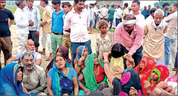
रोते-बिलखते मृतक के परिजन।