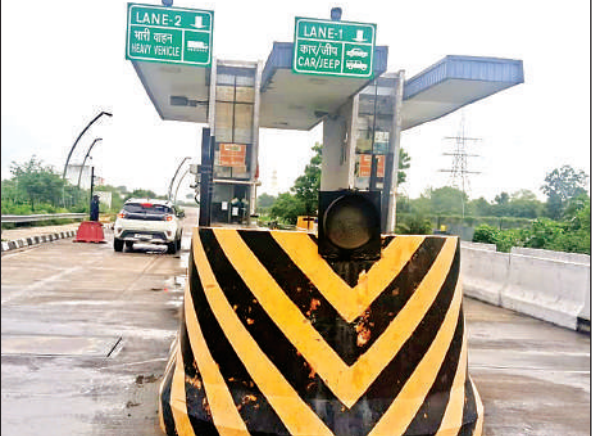
बंद पड़ा टोल प्लाजा।

टोल प्रबंधन के अनुसार, वाहन चालकों को पर्वी दी जा रही है, जिसमें वाहन की श्रेणी, नंबर और समय अंकित किया जाता है। यह पर्वी वाहन चालक को अगले टोल पर दिखानी होती है, जहां वह शुल्क