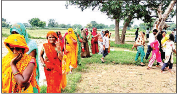
घटनास्थल पर मौजूद लोगों की भीड़।

● कभी-कभी दिल्ली जाता था पति, अधिकतर रहता था गांव में