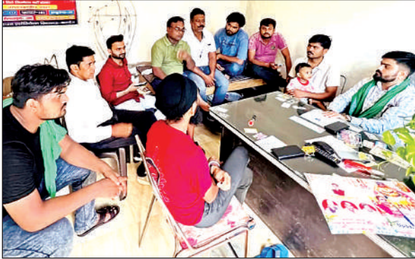
बैठक में मौजूद संगठन के लोग।