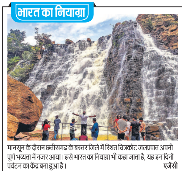
मानसून के दौरान छत्तीसगढ़ के बस्तर जिले में स्थित चित्रकोट जलप्रपात अपनी पूर्ण भव्यता में नजर आया। इसे भारत का नियाग्रा भी कहा जाता है, यह इन दिनों पर्यटन का केंद्र बना हुआ है।

निर्वाचन आयोग का कहना है कि 22 वर्षों के बाद हो रहे इस पुनरीक्षण से मतदाता सूची से अपात्र लोगों,