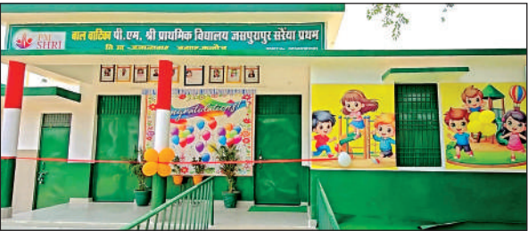
प्राथमिक स्कूल जसपुरापुर सरैया प्रथम में बना बाल वाटिका कक्ष।