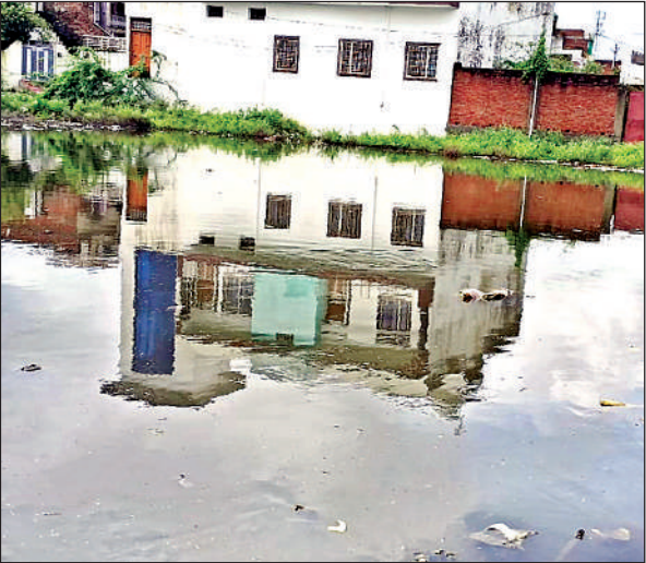
नई बस्ती में भरा पानी।

शहर की नई बस्ती रजा नगर और मुहल्ला मकनियापुरा में परेड मैदान में बनी नई बस्ती के मकान तेज बारिश होने पर चारों तरफ से पानी से घिर कर टापू बन जाते हैं। फिर पानी कम होने के लिए लोगों को घंटों इंतजार करना पड़ता है। इसके बाद लोग अपने अपने घरों में जा पाते हैं। कमोवेश यही स्थिति शहर की अन्य नई