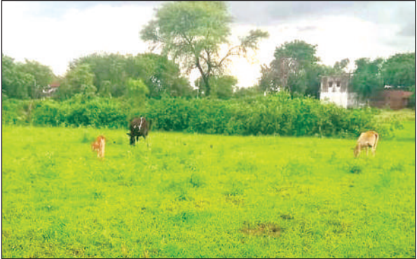
खाली पड़े खेत पर चरते मवेशी।