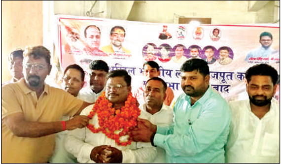
बैठक में मौजूद पदाधिकारी।