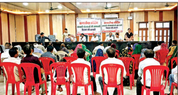
बैठक में बोलते वक्ता।