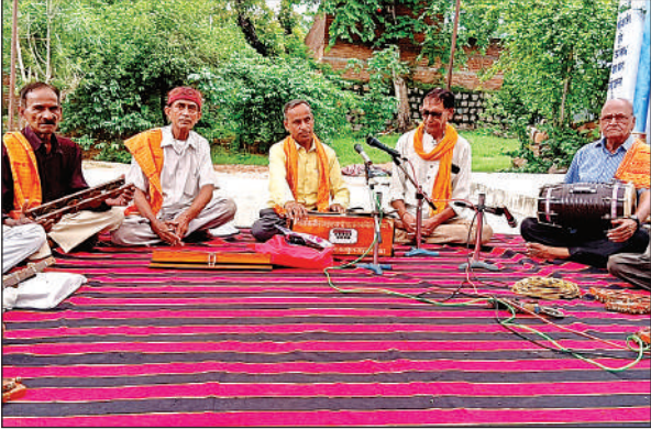
प्रस्तुति देते कलाकर।