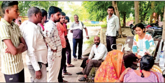
अस्पताल में मृतक के रोते बिलखते परिजन ।