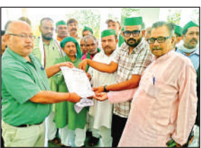
एसडीएम को ज्ञापन सौंपते भाकियू के पदाधिकारी।