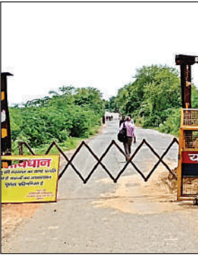
यमुना पुल के पहले लगी बैरीकेडिंग।

पड़ा। इन दोनों वाहनों के बीच उन्हें डेढ़ किमी पैदल चलने की जहमत उठानी पड़ी। खास तौर पर लोग उमस के बीच यह सफर पूरा करते नजर