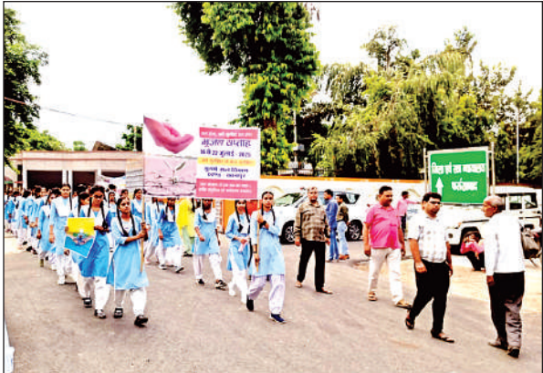
जागरूकता रैली निकालती छात्र-छात्राएं।