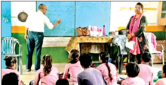
छात्र-छात्राओं को जागरूक करते शिक्षक।