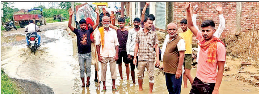
नगला दिलू स्थित सौ शैय्या अस्पताल रोड पर जलभराव होने से प्रदर्शन करते ग्रामीण ।

अमृत विचार । नगर के नगला दिलू स्थित सौ शैय्या अस्पताल रोड की जर्जर स्थिति ने मरीजों और स्थानीय लोगों के लिए गंभीर समस्या खड़ी कर दी है। इसका विरोध करते हुए ग्रामीणों ने सड़क के जर्जर हिस्से को तत्काल ठीक कराने की मांग की है। प्रदर्शन करते हुए ग्रामीणों ने बताया कि सड़क पर गड़ों की वजह से मरीजों को अस्पताल आने-जाने में भारी कठिनाई होती है। इससे उनकी हालत और बिगड़ सकती है। बारिश के दौरान जलभराव की स्थिति और खराब हो जाती है। सड़क तालाब जैसी प्रतीत होती है। यह सड़क सैकड़ों मरीजों और एम्बुलेंस के लिए रोजाना आवागमन का मुख्य मार्ग है। खासकर रात