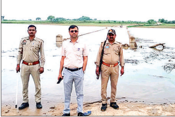
यमुना नदी के किनारे निरीक्षण करते एसडीएम, सीओ व कोतवाल।

● एसडीएम, सीओ, कोतवाल ने मौका देख सावधानी बरतने को कहा