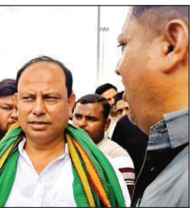
टोल पर वार्ता करते किसान नेता ।

तो टोल के मैनेजर ने बताया कि एक बार पैसा माइनस में जाएगा। लेकिन टोल का पैसा नहीं लिया जाएगा। उन्होंने यह भी बताया कि कई गाड़ियों में किसान नेताओं के स्टीकर लगे रहते हैं। वह लोग गाड़ी का प्रयोग सवारी या बुकिंग के तौर पर करते हैं। इस पर किसान नेताओं ने कहा कि किसान नेताओं की गाड़िया इस प्रकार के काम में प्रयोग नहीं की जाती है। इस मौके पर कई लोगल मौजूद रहे।