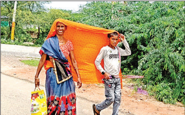
धूप के बीच यमुना पुल से पैदल आते मुसाफिर।

पड़ा। इन दोनों वाहनों के बीच उन्हें डेढ़ किमी पैदल चलने की जहमत उठानी पड़ी। खास तौर पर लोग उमस के बीच यह सफर पूरा करते नजर