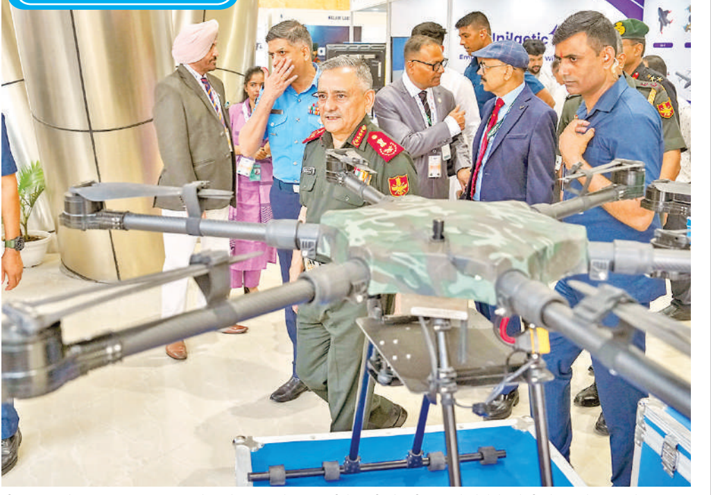
चीफ ऑफ डिफेंस स्टाफ जनरल अनिल चौहान ने बुधवार को नई दिल्ली में यूएपी और सीयूपएस के क्षेत्रों में विदेशी ओईएम से वर्तमान में आयात किए जा रहे महत्वपूर्ण घटकों के स्वदेशीकरण पर आयोजित कार्यशाला व प्रदर्शनी का निरीक्षण किया।