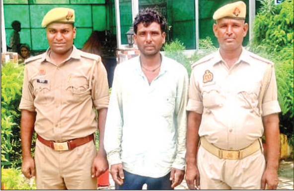
पुलिस की गिरफ्त में हत्यारोपी।