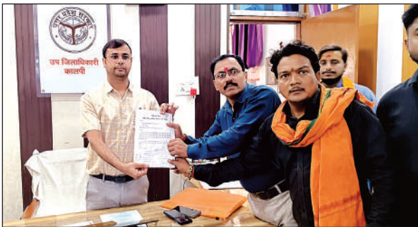
एसडीएम को ज्ञापन सौंपते संगठनों के कार्यकर्ता तथा पदाधिकारी। अमृत विचार

● उप जिलाधिकारी ने जांच कर कार्रवाई के लिए निर्देश