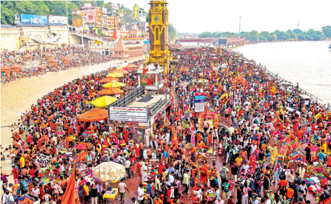
हरिद्वार : पवित्र श्रावण मास के दौरान हरि की पैड़ी पर गंगा जल लेने के लिए पहुंची कांवड़ियों की भीड़। यहां विभिन्न राज्यों से कांवड़िये गंगा जल लेने पहुंचते हैं और अपने मूल स्थानों में शिव मंदिरों में जलाभिषेक करते हैं। सरकारी अधिकारियों के अनुसार, इस साल लगभग छह से सात करोड़ कांवड़ियों के आने की उम्मीद है।