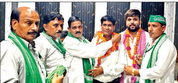
नए पदाधिकारियों का स्वागत करते भाकियू नेता।

हाइट गेज लगाकर रोक जा चुका है। अब छोटे और दोपहिया वाहन भी इस पुल से नहीं गुजर सकेंगे। उन्होंने बताया कि मरम्मत कार्य में 450.67 लाख रुपये खर्च होंगे।