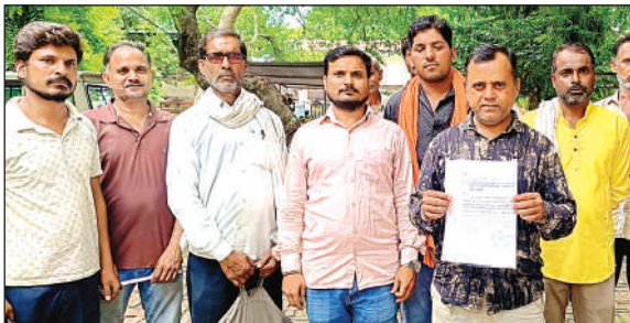
डीएम को ज्ञापन देने जाते गिमुहा के ग्रामीण।