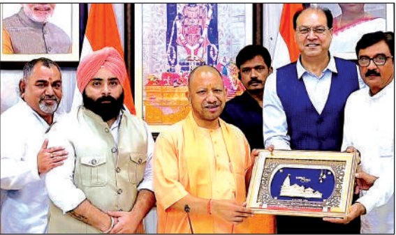
मुख्यमंत्री से मिलते फर्रुखाबाद के आतिशबाजी व्यवसायी।

जिला अध्यक्ष ने कहा कि जनपद के आदर्श थाना मऊदरवाजा में भ्रष्टाचार चरमसीमा पर है। पुलिस की प्रताड़ना से नवयुवक ने आत्महत्या कर ली है उसके बावजूद भी पुलिस के उच्च अधिकारियों द्वारा थाना मऊदरवाजा के थाना