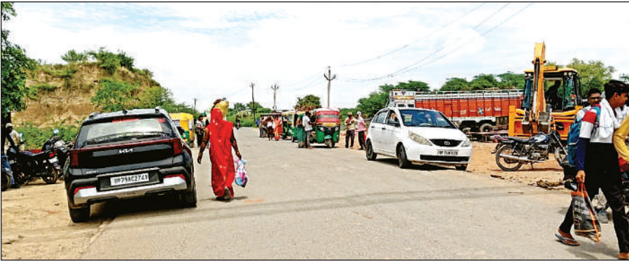
यमुना नदी के पुल के पहले लगाई बैरीकेडिंग के पास खड़े ई-रिक्शा और ऑटो।

अमृत विचार। यमुना नदी पुल की मरम्मत के लिए मंगलवार रात से सभी वाहनों का आवागमन बंद कर दिया गया। औरैया और जालौन जिला प्रशासन ने यह निर्णय लिया है। पुल की मरम्मत का काम 14 अगस्त तक पूरा किया जाएगा। यमुना नदी के शेरगढ़ घाट पुल पर बुधवार को दोनों छोर पर बैरियर लगा दिए गए। ऐसे में लोग पैदल ही आवागमन कर सके। जालौन और औरैया के बीच सफर करने वाले लोगों को दोनों बैरियर के बीच डेढ़ किलोमीटर का सफर पैदल पार करना पड़ा। बैरियर के पास खड़े आटो और ई-रिक्शा से राहगीरों ने बाद का सफर पूरा किया। यह सिलसिला पूरे दिन चलता रहा। यमुना पुल की बेरियर में आई खामी को दूर करने के लिए मरम्मत कार्य किया जाना है। इसके लिए एक माह तक यमुना पुल पर वाहनों का आवागमन रोक दिया है। बुधवार को पुल के दोनों छोर पर बैरियर लगाकर पूरी तरह से वाहनों का आवागमन रोक दिया गया, लेकिन पैदल आना जाना जारी रहा। सफर पर निकले लोगों को एक छोर का सफर एक वाहन से तो दूसरे छोर का सफर दूसरे वाहन से करना