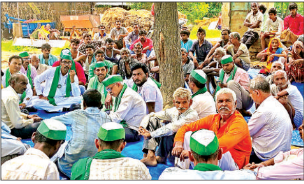
पीड़ित परिवार के दरवाजे पर बैठे किसान यूनियन के पदाधिकारी व अन्य।