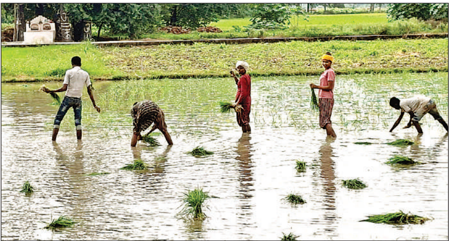
बनारपुर गांव में धान की रोपाई करते किसान।

से पौधे की दूरी 8 इंच और लाइन से लाइन की दूरी भी 8 इंच रखनी चाहिए। तीन गहराई पौधे को इतनी गहराई पर रिपीट करना चाहिए कि उसकी जड़ मिट्टी में ढक जाए। पानी भरने पर पौधा तैरने न पाए। चार खरपतवार नियंत्रण रुपये के दो-तीन दिनों के भीतर खरपतवार नाशक का प्रयोग करें पांच खाद का प्रयोग उड़िया विप पोटाश और जिंक सल्फेट का उचित मात्रा में प्रयोग करें नियमित रूप से पानी दे और यदि पानी गर्म हो जाय तो उसे बदल दें और साथ खरपतवार नियंत्रण के 15-20 दिन तक खेत में पानी जमा रखें, इससे खरपतवार आने की संभावना कम हो जाती है।