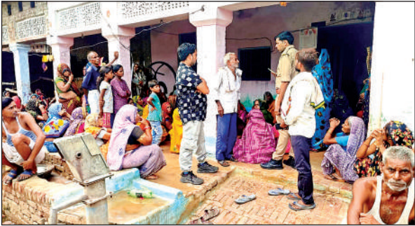
घटनास्थल पर पड़ताल करती पुलिस।