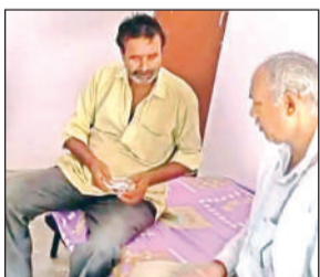
किसान से रिश्वत लेते कानूनगो।