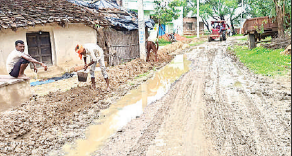
पाइप लाइन डालने के लिए सड़क की खोदाई करते श्रमिक।

प्रशासन द्वारा हर समीक्षा बैठक में गांवों में पेयजल की उपलब्धता और सड़कों को दुरुस्त कराने के निर्देश दिए जाते हैं पर जिम्मेदारों पर इसका असर नहीं होता। बीते माह हुई समीक्षा बैठक में जिलाधिकारी शिवशरणप्पा जीएन ने 30 जून तक