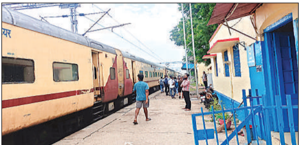
स्टेशन पर खड़ी ट्रेन।

फीडर में बिजली आपूर्ति होती है। ऐसे में इन फीडरों से करीब 30 गांवों की बिजली आपूर्ति होती है। बारिश के बाद 33 केवी मेन लाइन में फाल्ट होने से जमौली, बिहारीपुर, कंचौसी गांव, विनपुरापुर, सहायपुर, चंद्रपुर, प्रसाद नगर, महिपाल पुरवा, नौगवा, अमरपुर, सुंदरपुर,