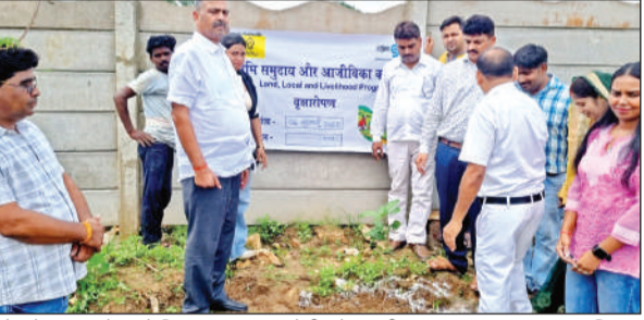
पौधरोपण करने पहुंचे विधायक, समाजसेवी और ग्रामीण।

लेकर उसमें कक्षा छह, सात और आठ को एक साथ बैठाकर पढ़ाई कराई जा रही है। यहां शौचालय तक नहीं है।