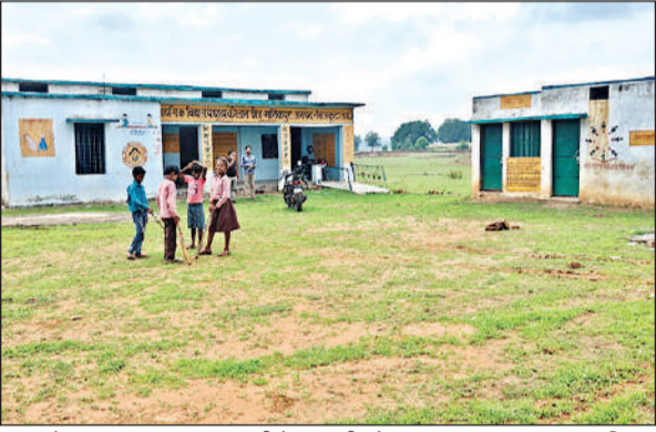
घाटा कोलान का स्कूल, जहां न पानी है न बाउंड्री और लाइट।