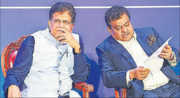
बेंगलुरु में कर्नाटक के मंत्री एमबी पाटिल के साथ केंद्रीय मंत्री पीयूष गोयल ।

कांग्रेस नेता राहुल गांधी ने भारत-अमेरिका व्यापार सौदे पर प्रधानमंत्री मोदी पर दावा किया कि प्रधानमंत्री ट्रंप प्रशासन द्वारा निर्धारित शुल्क समयसीमा के आगे विनम्रतापूर्वक झुकेंगे। गोयल ने शुक्रवार को कहा था कि भारत-अमेरिका के साथ प्रस्तावित व्यापार समझौते को तभी