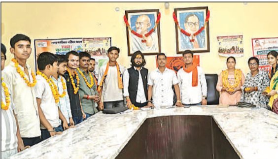
मौजूद एबीवीपी के पदाधिकारी ।

फर्रुखाबाद। शनिवार को पांचाल घाट पर पहुंच कर जिलाधिकारी आशुतोष कुमार द्विवेदी ने गंगा के जलस्तर को देखा साथ ही पर्यटन विभाग द्वारा किये जा रहे निर्माण कार्यों का निरीक्षण किया। इस दौरान जिलाधिकारी द्वारा पर्यटन विभाग द्वारा घाट के समीप बनाये जा रहे शौचालय के स्थान पर नाराजगी जताई और निर्देशित किया कि शौचालय को गंगा तट से दूर पीछे की तरफ बनाया जाये,जिससे उससे निकलने वाला पानी गंगा में ना गिरे। उन्होंने कहा कि चल रहे समस्त निर्माण कार्यों को जल्द पूर्ण करने के लिये कार्यदाई संस्था को निर्देशित किया।इस मौके पर मुख्य विकास अधिकारी, जिला विकास अधिकारी,क्षेत्रीय पर्यटन अधिकारी व संबंधित विभाग के अधिकारी मौजूद रहे।