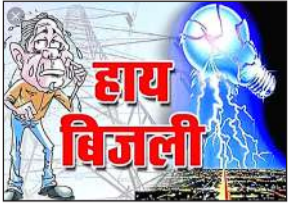
● कई गांवों की बिजली आपूर्ति रही ठप, उपभोक्ता परेशान

असेनी पावर हाउस से जुड़े बिहारीपुर उपकेंद्र और नौगवा