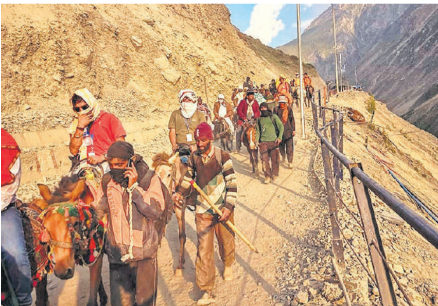
जम्मू एवं कश्मीर के अनंतनाग जिले में शनिवार को अमरनाथ की पवित्र गुफा की वार्षिक तीर्थयात्रा के दौरान दुर्गम रास्तों से गुजरते हुए तीर्थयात्री ।