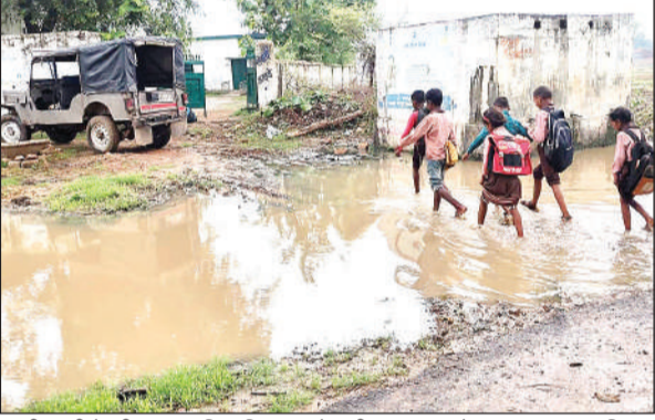
ददरी माफ़ी के छीतपुर प्राथमिक विद्यालय में पानी पार कर जाते छात्र।

चित्रकूट जिले में भी कायाकल्प योजना से परिषदीय स्कूलों की दशा सुधारने के लिए बड़े प्रयास किए गए लेकिन हकीकत में तमाम में ऐसा सुधार नहीं हो सका, जिसे उल्लेखनीय कहा जाए। मानिकपुर ब्लॉक के अधिकांश विद्यालयों की