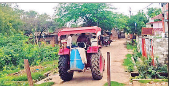
नलकूप से टैक्टर में इम बांधकर पानी भरकर लाते ग्रामीण।