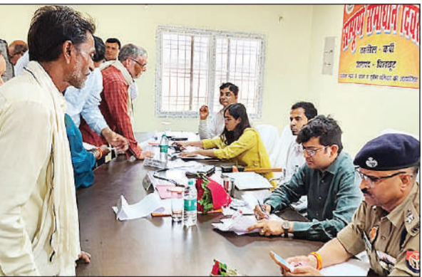
संपूर्ण समाधान दिवस में लोगों की समस्याएं सुनते डीएम, एसपी व अन्य।