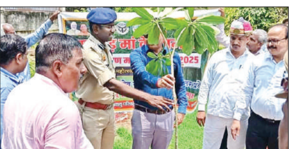
तहसील परिसर में पौधारोपण करते मंडलायुक्त व डीआईजी।