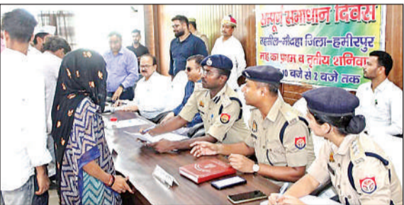
मौदहा में आयोजित संपूर्ण समाधान में शिकायत सुनते कमिश्नर।