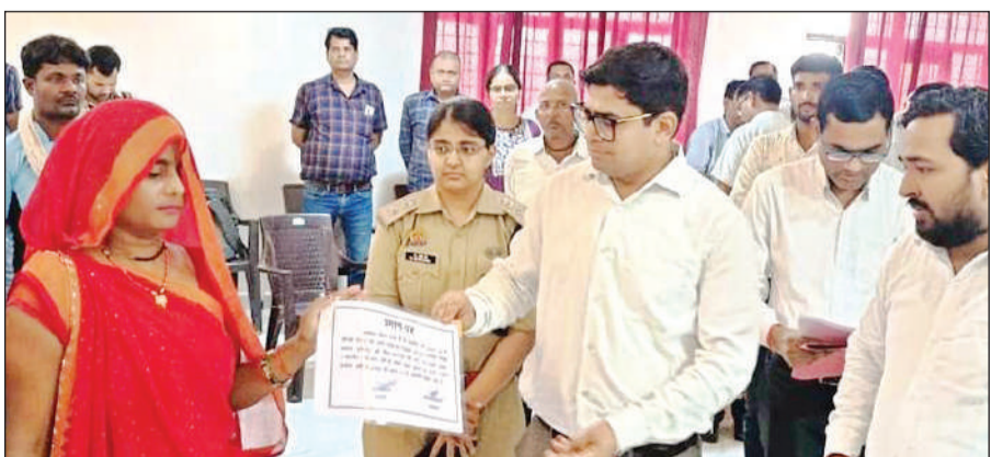
सरीला में संपूर्ण समाधान दिवस के दौरान महिला की शिकायत सुनते डीएम और एसपी।