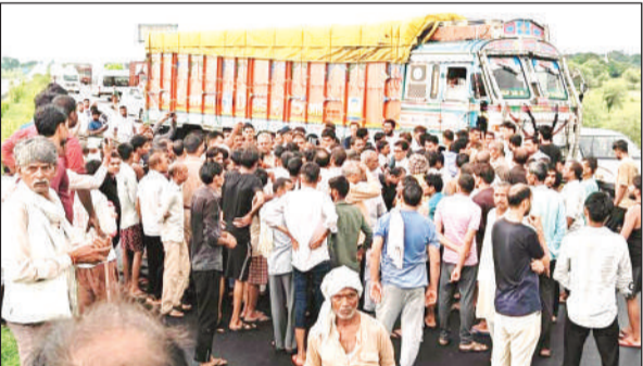
बुंदेलखंड एक्सप्रेस-वे पर जाम लगाए ग्रामीण।