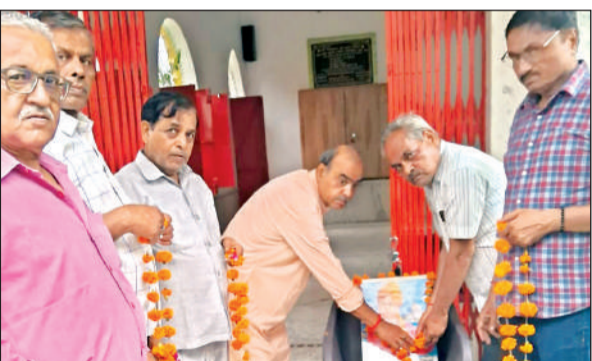
स्वामी विवेकानंद के चित्र पर पुष्प अर्पित करते लोग।