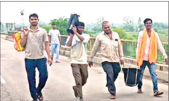
शनिवार को यमुना पुल से पैदल गुजरते लोग।

अमृत विचार। कानपुर सागर हाईवे पर जिले की सीमा में बने यमुना नदी के पुल की मियाद खत्म होने के बावजूद पीएनसी की निगरानी के चलते जर्जर हो चुके पुल की चौथे सप्ताह के शनिवार की सुबह से बेयरिंग बदलने का काम शुरू हो गया। जो लगातार 48 घंटे तक चलेगा। जिसके चलते शनिवार की सुबह छह बजे से बेरीकेटिंग लगाकर पुल बंद कर दिया गया है। छोटे बड़े वाहनों सहित बाइक तक की निकासी बंद कर दी गई है। सिर्फ पैदल निकलने वालों को आने जाने की छूट दी गई है। बीते 14 जून से लेकर 21 जुलाई तक प्रत्येक सप्ताह के शनिवार और रविवार को 48 घंटे के लिए पुल