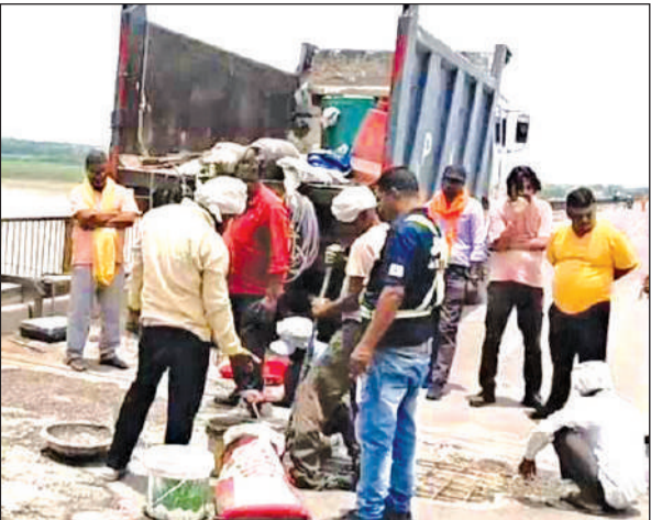
धंसी स्लैब की मरम्मत करते पीएनसी के कर्मचारी।

शनिवार को दुर्गा मोड़ से की गई बेरीकेडिंग के चलते लोगों को तेज धूप में दो किमी अतिरिक्त पैदल चलकर जाना पड़ा। यात्रियों ने प्रशासन से उसे पुल के नजदीक से बेरीकेडिंग करने की मांग की है।