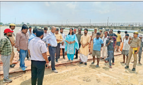
पर्यटन कार्य का पांचाल घाट पर निरीक्षण करते जिलाधिकारी व अन्य ।