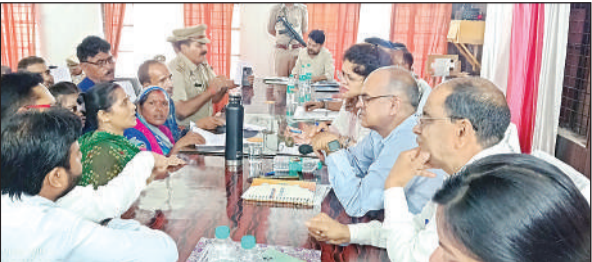
फरियादियों की समस्याएं सुनते अधिकारी।