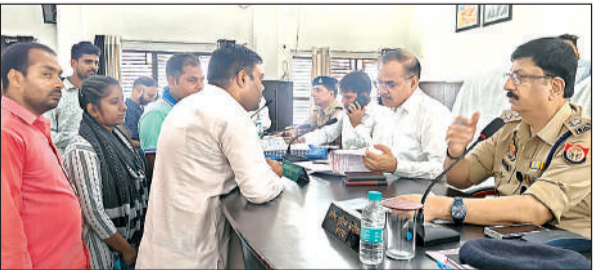
समाधान दिवस में फरियादियों की समस्याएं सुनते डीएम व एसएसपी ।

डीएम ने कहा कि अधिकारी सम्बंधित कर्मचारियों के साथ मौके पर जाकर शिकायतकर्ता का पक्ष सुनते हुए उसका निस्तारण करना निश्चित करें। सम्पूर्ण समाधान दिवस में उन्होंने अधिकारियों को निर्देश दिये कि प्रकरणों की गंभीरता से जांच की जाये साथ ही जब भी अधिकारीगण गांवों के भ्रमण पर जाये अपने विभाग से संबंधित योजनाओं का मौके पर सत्यापन