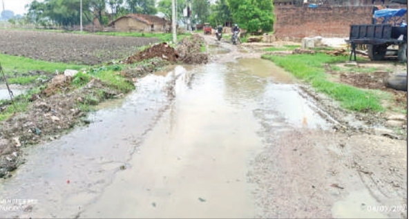
यह है गांव की सड़क का हाल।

परियोजना की तस्वीर ऐसी नहीं मिली, जिससे संतोष किया जा सके कि काम ठीक से हो रहा है। चौरहा में सड़क पर जगह जगह जलभराव है। इसके बाद नमामि गंगे के द्वारा सड़क किनारे पाइप लाइन डालने के लिए मजदूर खुदाई में व्यस्त दिखे।