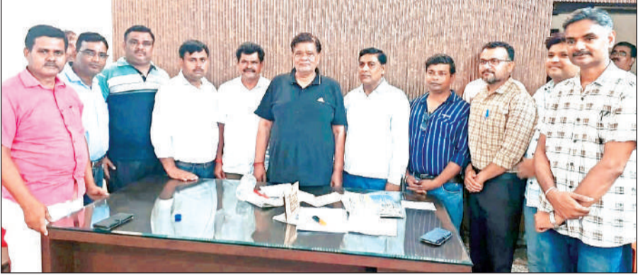
स्कूल मर्जर के विरोध में विधायक को ज्ञापन देने पहुंचे शिक्षक।