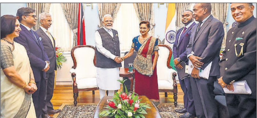
प्रधानमंत्री नरेन्द्र मोदी त्रिनिदाद एवं टोबैगो की अपनी समकक्ष कमला प्रसाद से मुलाकात करते हुए ।

शनिवार को जारी संयुक्त बयान में कहा गया कि त्रिनिदाद और टोबैगो ने विस्तारित संयुक्त राष्ट्र सुरक्षा परिषद में स्थायी सदस्यता के लिए भारत को अपना पूर्ण समर्थन देने की पुष्टि की है। वैश्विक मुद्दों पर गहन विचार-विमर्श करते हुए मोदी और बिसेसर ने संयुक्त राष्ट्र में व्यापक सुधारों की आवश्यकता पर बल दिया, जिसमें संयुक्त राष्ट्र सुरक्षा परिषद का विस्तार भी शामिल है ताकि वर्तमान वास्तविकताओं को बेहतर ढंग से प्रतिबिंबित किया जा सके।