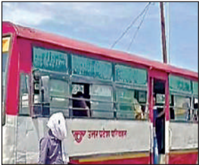
● एआरएम ने चालक और परिचालक पर की कार्रवाई