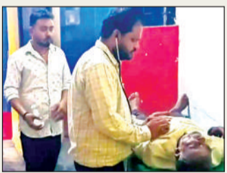
वृद्ध की जांच करते चिकित्सक।