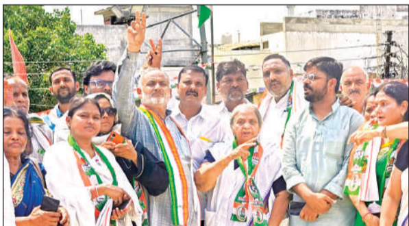
शपथ ग्रहण में उपस्थित कांग्रेस नेता ।