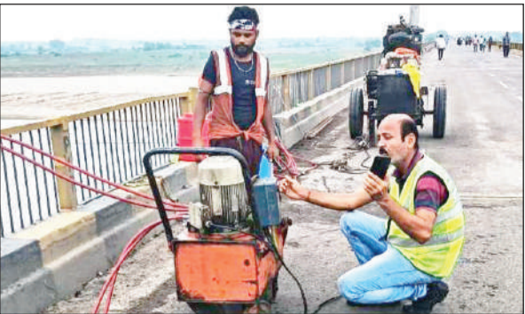
पुल की मरम्मत में जुटे पीएनसी के कर्मचारी।

रखी गई। इसके बाद जैक से पुल उठाने पर उखड़ी स्लैब बारिश और ओवरलोड के चलते पूरी तरह से क्षतिग्रस्त हो जाने पर पीएनसी के कर्मियों ने उखड़ी स्लैब को ठीक किया। दोपहर बाद नेशनल हाईवे का रखरखाव करने वाली कार्यदायी