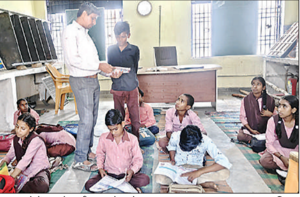
एक कमरे में पढ़ रहे ददरी स्कूल के बच्चे।