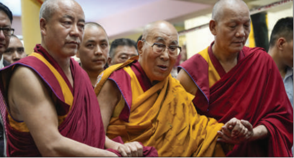
मैकलोडगंज में अपने जन्मदिवस के अवसर पर दलाई लाला ।

तिब्बत के आध्यात्मिक गुरु ने कहा कि आपकी प्रार्थनाएं अल्पकालीन फलदायी रही हैं। बचपन से ही उन्हें लगता था