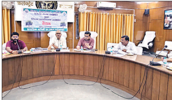
पौधरोपण की समीक्षा करते जिलाधिकारी ।

बैठक में जिलाधिकारी ने निर्देशित किया कि सभी विभाग समय से पौधों का उठान सुनिश्चित करें,।सभी कार्यालयाध्यक्ष अपने विभाग को मिले लक्ष्य के लिए व्यक्तिगत रूप से जिम्मेदार होंगे। वृक्षारोपण सभी का नैतिक व सामाजिक दायित्व है, इसका पालन