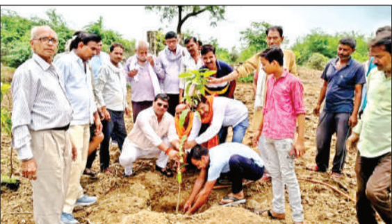
पौधरोपण कार्यक्रम में शामिल भवत तथा कार्यकर्ता ।