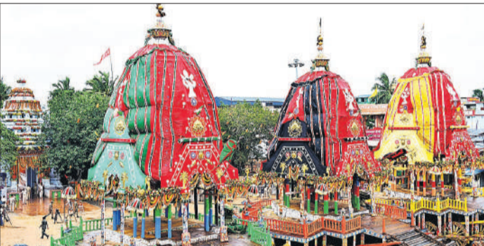
बहुदा यात्रा से पहले भगवान जगन्नाथ, बलभद्र और देवी सुभद्रा के रथ।

रथ खींचने की शुरुआत शाम चार बजे होनी थी, लेकिन यह तय समय से पहले अपराह्न 2.45 बजे जय जगन्नाथ, हरिबोल के जयघोष और झांझ-मंजीरों के बीच शुरू हुई। सुभद्रा और जगन्नाथ के रथ बलभद्र के तालध्वज के पीछे चलेंगे। इससे पहले, बलभद्र, सुभद्रा और भगवान जगन्नाथ के