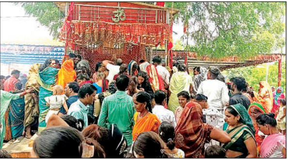
मंदिर में पूजा-अर्चना करती महिलाएं।