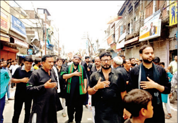
शिया समुदाय के लोग मातम मनाते हुए।