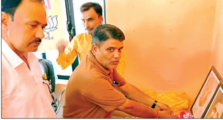
श्यामा प्रसाद मुखर्जी के चित्र पर माल्यार्पण करते भाजपा नेता।