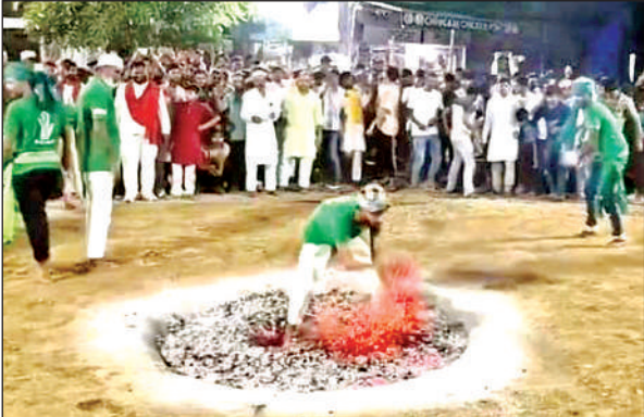
अकिल तिराहे में अलाव खेलता अकीदतमंद।

10वीं पर मातमी धुनों के बीच निकला ताजियों का जुलूस, करतब देखने उमड़ी मीड़