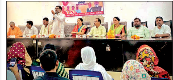
जनसंघ के संस्थापक की जयंती कार्यक्रम में मौजूद भाजपा पदाधिकारी व कार्यकर्ता।