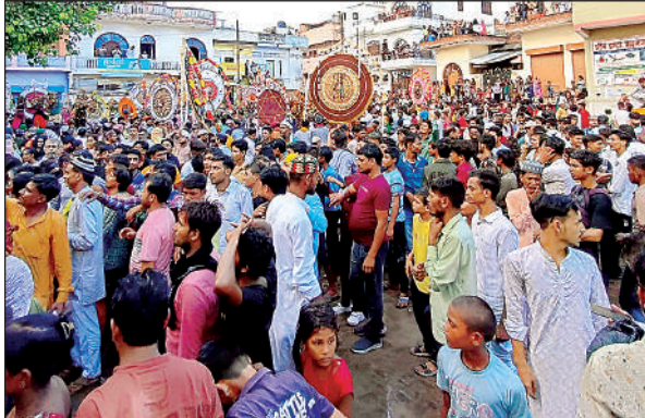
जुलूस में शामिल लोग।

बातिल की जंग में शहीद हुए हजरत इमाम हुसैन और उनके 72 साथियों के गम में मनाए जाने वाले मोहर्रम का रविवार को समापन हो गया। इससे पहले मोहर्रम की नौमी तारीख को शहर के अकिल तिराहा, अमन शहीद व कुछेछा के इमामबाड़ों के सामने अलाव जलाया गया। जिसमें मान्यता के अनुसार अकीदतमंदों ने जलते आग के अंगारों में खेल कर इमाम हुसैन पर हुए जुल्म और ज्यादतियों को याद किया। देर रात अलाव का खेल समाप्त होते ही मातमी धुनों के बीच शहर के