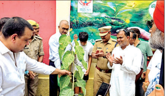
पौधरोपण करते डीएम व अन्य।