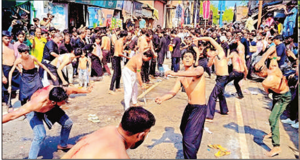
छुरियों का मातम व ताजिया निकालते शिया समाज के लोग ।

पन्नी पर अभ्रक पर मक्का मदीना व कर्बला के तुंगरे महीन कारीगरी से तैयार किए गए थे। रामगंज इमामबारगाह से उठा चांदी का शीशे की छतरी वाला ताजिया दबगरान, पथवरिया गाड़ीपुरा, नई बस्ती साबितगंज के ताजिया थर्माकोल और रंग बिरंगी पन्नी के