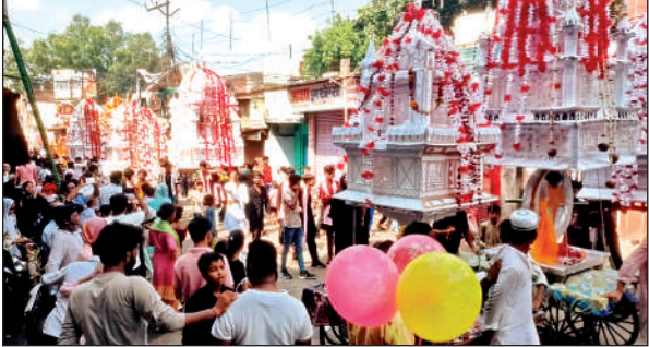
शहर में ताजिये निकालते सुन्नी समाज के लोग ।