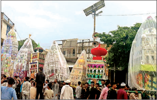
मौदहा में ताजियों का जुलूस निकालते अकीदतमंद।