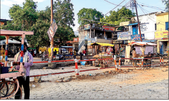
एक माह से बंद पड़ा शहर के अंदर के बस अड्डा ।