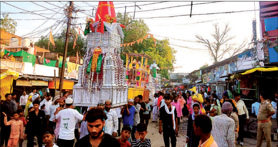
मऊ में ताजिया जुलूस निकालते मुस्लिम समुदाय के लोग ।

बताया जाता है कि प्रशासन द्वारा राष्ट्रीय राजमार्ग पर बैरिकेडिंग लगाकर ट्रैफिक संचालित रखने के फैसले को लेकर कमेटी विरोध पर उतर आई थी और ताजिया न उठाने का फैसला किया था। हालांकि बाद में बात बिगड़ी नहीं और मोहर्रम कमेटी ने ताजिये निकाला। साथ ही पुलिस प्रशासन ने यातायात को बाधित नहीं होने दिया। एक तरफ से ताजिये का जुलूस निकल रहा था तो दूसरी तरफ से यातायात भी