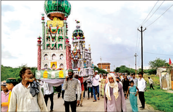
ताजिया जुलूस निकालते लोग, इमामबाड़ों से निकाली गई डाल सवारी।

मोहर्रम की नौमी को रात में शहर के मुहल्ला मकनियापुरा में हवेली दरवाजा, भटीपुरा, शाहपहाड़ी सहित कई मुहल्लों के ताजिये एकत्र हुए। इसके बाद रात में करीब 11 बजे ताजिया जुलूस निकाला, जो कसौरा चौराहे में पहुंचा। इसके बाद सारे