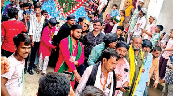
बिधूना में ताजिया निकालते लोग।

के नारो की सदायें गुंज रही थीं और लोग हाथों में हुसैनी परचम लिए चल रहे थे। रविवार सुबह ताजियों का जुलूस अपने अपने गन्तव्य के लिए रवाना हो गया। जुलूस के दौरान लोग लंगर तकसीम कर रहे थे। रात लगभग दो बजे तक ताजियों का मेला चलता रहा। रविवार तड़के वहाब अंसारी आदि मौजूद रहे। जुलूस में साथ रहकर व्यवस्थाएं देखते रहे। नगर पंचायत की ओर से त्योहार के मौके पर साफ सफाई की