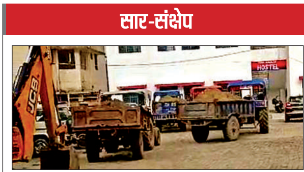
थाने में खड़ी जेसीबी व ट्रैक्टर व