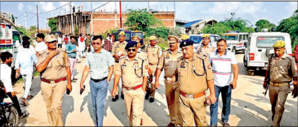
मोहर्रम मेले में भ्रमण करते एसपी, एसडीएम, सीओ तथा थानेदार।