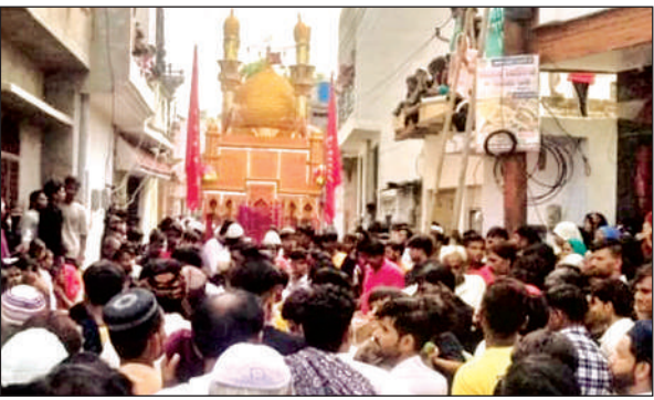
कालपी में ताजिया जुलूस निकालते अकीदतमंद।

अमृत विचार। रविवार को ताजियेदारों एवं हजारों अकीदतमंदों ने मातमी माहौल में नगर की सड़कों में ताजियों का जुलूस निकाल कर करबला के शहीदों को याद किया। मोहर्रम की दसवीं की भोर सुबह 4 बजे इमाम चौकों से ताजियेदार तथा अकीदतमंद अपने-अपने ताजियों को लेकर सदर बाजार स्थित श्री दरवाजे गेट पर पहुंच गए। वहां पर मातम तथा गम के साथ ताजियों का जुलूस शुरू हुआ। जुलूस बड़ा बाजार, अदल सराय होते हुए दीवान औलिया के ग्राउंड में पहुंचा जहां अकीदतमंदों ने फातिहा पढ़ी जिसके बाद जुलूस का समापन किया गया। इस मौके