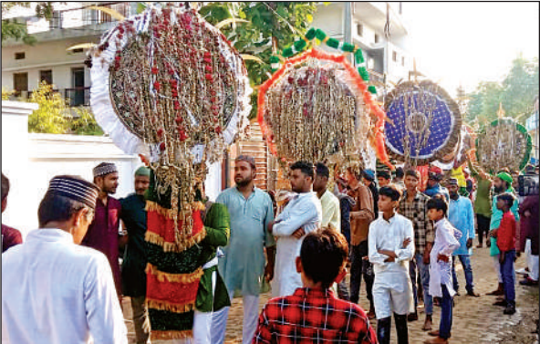
मानिकपुर में जुलूस में शामिल मुस्लिम अकीदतमंद ।