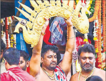
भगवान जगन्नाथ, बलभद्र और सुभद्रा को पहनाने के लिए सोने के आभूषण ले जाते सेवकजन।