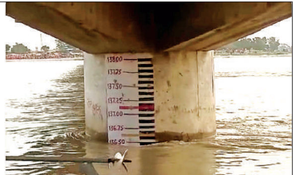
गंगा का बढ़ता जलस्तर।

गंगा के जलस्तर बढ़ने से जनपद के कई गांवों में बाढ़ ने दस्तक दे दी है, जिससे ग्रामीणों की एक बार फिर से धड़कने बढ़ गई हैं। वहीं जिला प्रशासन की मांनें तो कल तक जल स्तर कम होने की संभावना है। गत दिन शुक्रवार को पांचालघाट पर गंगा का जलस्तर 136.25 था और शाम को भी करीब यही जलस्तर रहा। रविवार को सुबह 08 बजे जिला प्रशासन के रिपोर्ट के अनुसार गंगा का जलस्तर थोड़ा