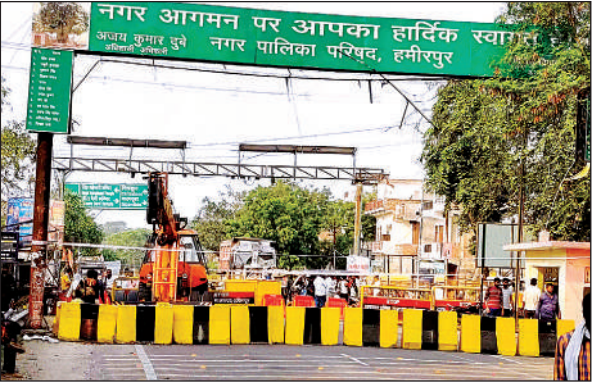
पुल की मरम्मत के चलते ब्लॉक रख बंद किया गया मार्ग।

बीते 14 जून को से लेकर 21 जुलाई तक लगभग डेढ़ माह की अवधि में शनिवार रविवार को पुल की कुल छह कोठियों की बेयरिंग बदलने का कार्य लगातार जारी है। शनिवार को नेशनल हाईवे का रखरखाव करने वाली कार्यदायी संस्था पीएनसी के चार इंजीनियर और करीब 15 के आसपास एक्सपर्ट वर्कर्स ने कोठी नंबर सात की बेयरिंग बदलने का काम किया। साइड