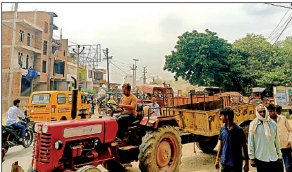
मंडी गेट के सामने लगा मक्का लदे ट्रैक्टर व अन्य वाहनों का जाम। अमृत विचार

जबसे मक्का तैयार होकर पहुंचने लगी है जबसे मंडी समिति के गेट पर ट्राली व अन्य वाहनों के कारण रोड ही घंटों जाम लग रहा है। इससे पुलिस व यातायात गार्ड निजात नहीं दिला पा रहे हैं। जाम के चलते कानपुर या अन्य स्थान के लिये निश्चित लोग घंटों फंसे रहते हैं। मंडी समिति के सामने गेट के निकट लगने वाले जाम से निजात दिलाने के लिये यातायात प्रभारी आफाक