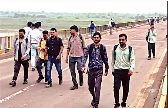
पुल से पैदल निकलते लोग।

भरी गर्मी में लगभग 5 किमी पैदल आने जाने वाले लोगों को परेशानियों का सामना करना पड़ा। वाहनों को डायवर्ट रूट के अनुसार भेजा जा रहा है। सोमवार को एक बार फिर से सुबह छह बजे से पुल से आवागमन शुरू हो जाएगा।