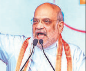
गुजरात के आणंद में आयोजित कार्यक्रम को संबोधित करते अमित शाह।

उन्होंने कहा, पारदर्शिता, प्रौद्योगिकी और सदस्यों (सहकारी क्षेत्र के किसानों और समितियों) को साथ रखना महत्वपूर्ण है। प्रौद्योगिकी के बिना सहकारी समितियां समृद्ध नहीं हो सकती। उन्होंने कहा, हमारे कार्यक्षेत्र में लोगों के हितों को केंद्र