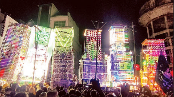
कर्बला में निकाला गया ताजिया जुलूस।

नगर में मोहर्रम का त्योहार गमगीन माहौल में बहुत ही सार्दगी व अकीदत के साथ शांतिपूर्ण तरीके से मनाया गया। शनिवार की रात लगभग 12 बजे से ताजिये उठना शुरू हुए। सबसे पहले मोहल्ला केसरवानी का ताजिया उठा। उसके बाद सैयद वाड़ा भराव, जोगियांन, चमनगंज, मेवातियांन के ताजिये उठे। ताजियों का जुलूस अपने तय रास्तों से गुजरता हुआ नगर के