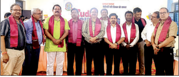
सहोदय काम्पलेष की बैठक में शामिल प्रधानाचार्य ।