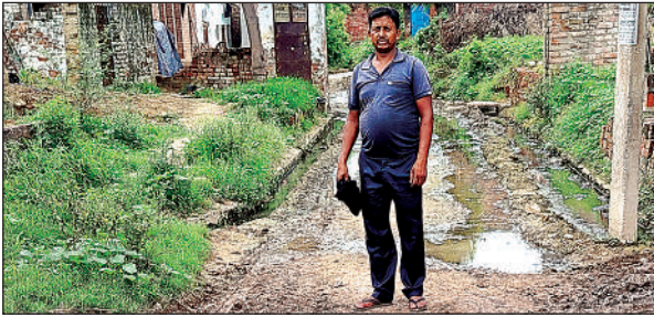
साहसपुर गांव के मार्ग में भरा पानी।