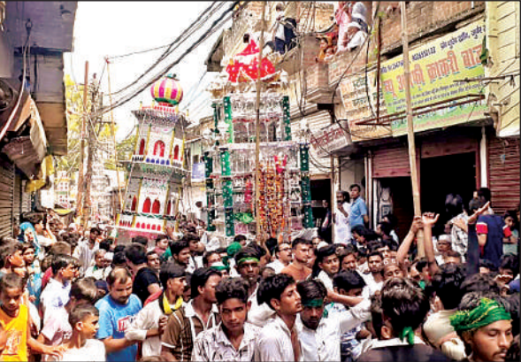
कब्रला में दफन हुए ताजिये।

अलम लेकर कब्रला जाते हैं, वहां रीति रिवाज से दफन करते हैं, मोहल्ला,गढ़ी अब्दुर मजीद खान, मनिहारी नखासा, छावनी, लिजीगंज खटकपुरा ,भाऊटोला,शामिल हुए। सुरक्षा व्यवस्था के लिए पुलिस फोर्स मौजूद रहा। करबला मैदान पर सभी ताजिये और अलम नम आंखों से दफन किये गये।