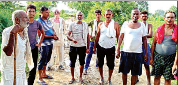
समस्या बताते ग्रामीण।