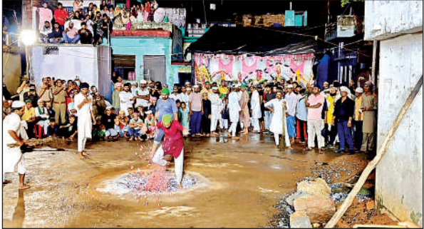
धकते अंगारों में किया मातम।

ढाल सवारियां देखने के लिए जुटी भीड़ : मोहर्रम की नौमी को शहर के कई मुहल्लों से ढाल सवारियां निकाली गईं। ढाल सवारियां देखने के लिए लोगों ने बढ़-चढ़ कर हिस्सा लिया। मुस्लिमों के अलावा हिन्दू भाई भी ताजिया और ढाल सवारी देखने पहुंचे। ढाल सवारी और ताजिया जुलूस के दौरान मार्गों में जगह-जगह लोगों ने गरी के गोले, लड्डू और कोल्ड ड्रिंक्स की बोतले भी लुटाईं। शहर के हवेली दरवाजा, चैसियापुरा, बंधानवाड़ सहित तमाम मुहल्लों से ढाल सवारियां निकालीं गईं, जो मुख्य मार्गों से हाते हुए पुनः इमाम बाड़ों में पहुंचीं।