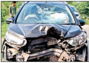
घटना स्थल पर खड़ी क्षतिग्रस्त कार।