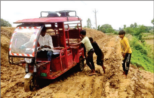
चंदई से कोटरा खांभा संपर्क मार्ग पर फंसाई –रिक्शा ।