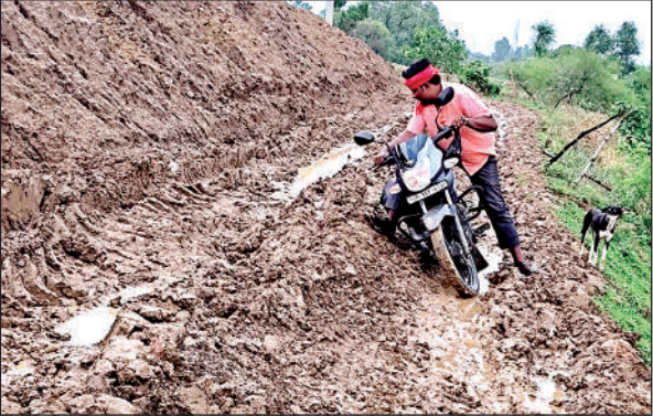
जंग लड़ने की तरह है इस रोड से निकलना ।