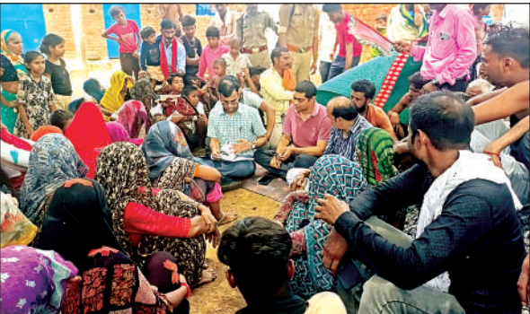
ग्रामीणों के साथ एसडीएम, सीओ, पुलिस तथा प्रशासनिक अधिकारी।