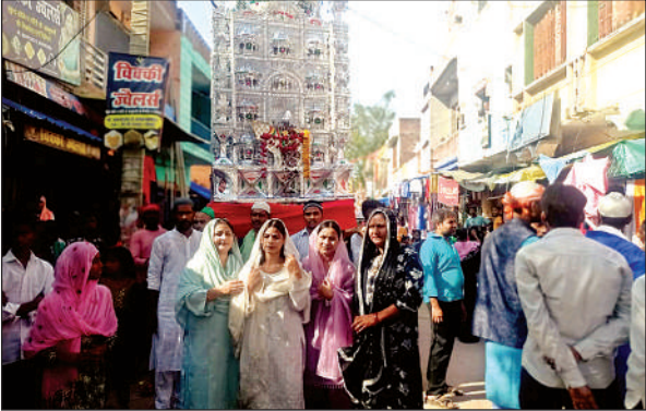
राजापुर में ताजिया जुलूस में शामिल मुस्लिम समुदाय की महिलाएं ।