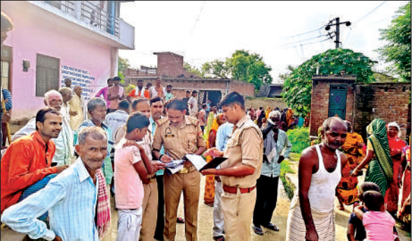
घटनास्थल पर जांच-पड़ताल करती पुलिस।