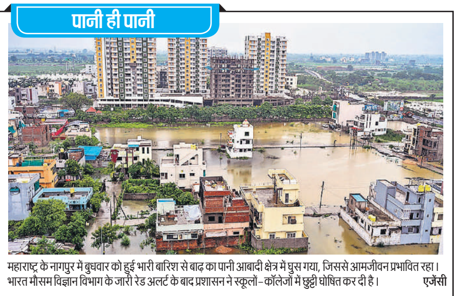
महाराष्ट्र के नागपुर में बुधवार को हुई भारी बारिश से बाढ़ का पानी आबादी क्षेत्र में घुस गया, जिससे आमजीवन प्रभावित रहा। भारत मौसम विज्ञान विभाग के जारी रेड अलर्ट के बाद प्रशासन ने स्कूलों-कॉलेजों में छुट्टी घोषित कर दी है।