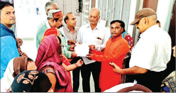
कलेक्ट्रेट में ज्ञापन देते सफाई कर्मचारी संघ के पदाधिकारी।