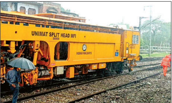
मरम्मत कार्य करते कर्मचारी।