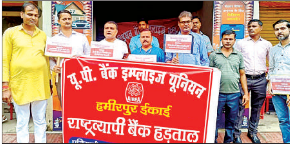
बुधवार को हड़ताल कर विरोध जताते बैंक कर्मी।

केंद्र सरकार की लगातार श्रमिक विरोधी अभियान के कारण ही देश के लगभग 10 बड़े ट्रेड यूनियन के लगभग 25 करोड़ कर्मचारी बुधवार को हड़ताल पर रहे। जिसमें बैंक, वित्तीय संस्थान, बीमा क्षेत्र, कोल माइंस के दप्तर आदि बंद रहे। मुख्यालय में बैंक कर्मचारी यूनियन ने समस्त बैंकों में तालाबंदी कर अपने आक्रोश को प्रकट किया। उनकी मुख्य मांगों में नई भर्ती किए जाने, पुरानी पेंशन स्कीम लागू करने, आउटसोर्सिंग बंद करने,