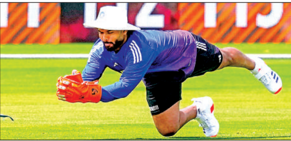
लॉर्ड्स क्रिकेट ग्राउंड पर अभ्यास सत्र के दौरान ऋषभ पंत।

उन्होंने शास्त्री के साथ अपने रिश्ते के बारे में भी बात की जो उस समय मुख्य कोच थे जब कोहली टेस्ट टीम को नयी ऊंचाइयों पर ले गए थे। कोहली ने कहा सच कहूं तो अगर मैं तब उनके साथ नहीं होता तो टेस्ट क्रिकेट में जो हुआ वो मुमकिन नहीं हो पाता। हमारे बीच जो स्पष्टता थी वो दृढ़ पाना बहुत मुश्किल है। क्रिकेटर्स के करियर में आगे बढ़ने के लिए यही सब कुछ होता है। कोहली ने कहा उन्होंने प्रेस कॉन्फ्रेंस में जिस तरह सवालों का डटकर सामना किया, वह अहम था। वर्ना चीजें अलग हो सकती थीं। मेरे मन में हमेशा उनके लिए सम्मान और आदर है क्योंकि वह मेरी क्रिकेट यात्रा का महत्वपूर्ण हिस्सा रहे। शास्त्री ने भी कोहली की तारीफ का जवाब देते हुए कहा कि वह गिलले 15 साल के सबसे प्रभावशाली क्रिकेटर हैं।