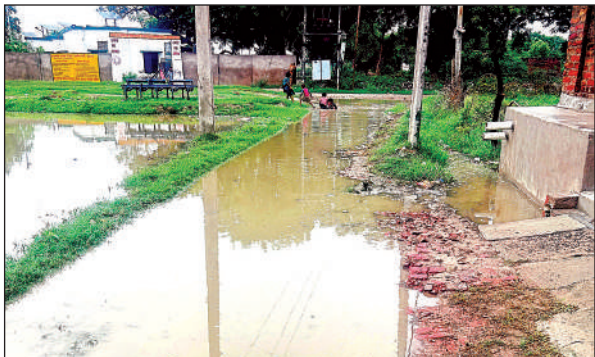
सड़क पर भरा पानी, फिसल कर गिरे बच्चे।