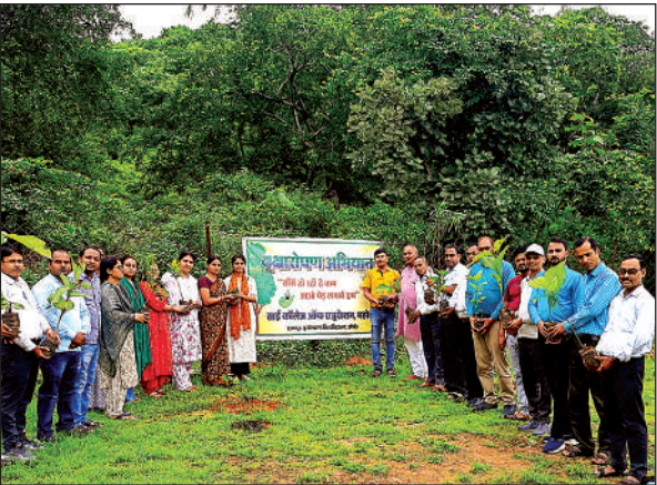
साईं कॉलेज में पेड़ लगाने के लिए खड़े लोग।

वार्मिंग से बचने के लिए पौधरोपण बहुत ही आवश्यक है। वृक्ष हमें आक्सीजन, ईंधन, औषधि, फल, चारा इत्यादि बहुत सी चीजें देते हैं और बदले में कुछ भी नहीं लेते हैं। इसलिए हमारा कर्तव्य बनता है कि प्रत्येक व्यक्ति पौधारोपण अवश्य करे। कार्यक्रम के दौरान