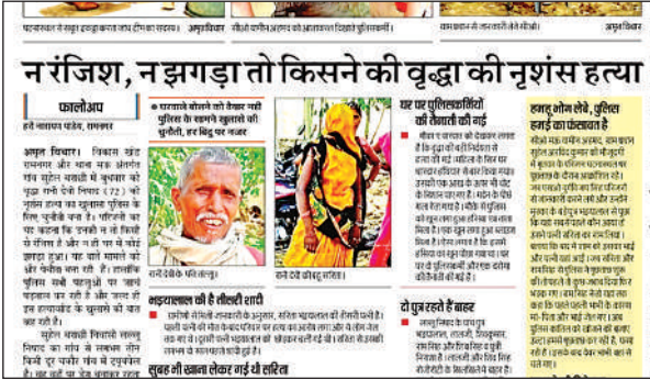
सुरेश बराछी में वृद्धा की हत्या का 'अमृत विचार' में प्रकाशित समाचार।

■ मऊ थानांतर्गत एक गांव का मामला है। एक विवाहिता, जिसका मायका रैपुरा थानांतर्गत एक गांव में है, ससुराल से 26 फरवरी 2024 को गायब हो गई। ससुरालीजनों ने उसकी खोजबीन की और जब न मिली तो 29 फरवरी को थाने में गुमशुदगी की रिपोर्ट दर्ज करा दी। इधर छह मांच को पहाड़ी थानांतर्गत बाबूपुर गांव के तालाब के पास एक विवाहिता का शव मिला। गुमशुदा के मायके वालों ने इसकी शिनाख्त अपनी बेटी के रूप में की। आठ मांच को पति, सास- ससुर समेत कुल नौ लोग पर बिटिया की दहेज प्रताड़ना और हत्या की धाराओं में रिपोर्ट दर्ज करा दी। उधर, पति और अन्य ससुरालीजनों ने इसे बहू का शव होने से इंकार कर दिया। पुलिस इनकी गिरफ्तारी के लिए तत्पर हो गई। ससुरालीजनों ने पुलिस अधीक्षक से डीएनए टेस्ट के लिए गुहार लगाई। बेहद ही नाटकीय ढंग से महिला का पता परिजनों को घटना के लगभग नौ महीने बाद लगा। पुलिस ने गुमशुदा महिला को दिसंबर 2024 में कोशाबी जिले से जिंदा बरामद कर लिया। यह अभी तक रहस्य है कि फिर बाबूपुर तालाब के पास मिला शव आखिरकार किसका था।