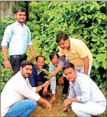
पौधा लगाते भाजपा के पदाधिकारी।