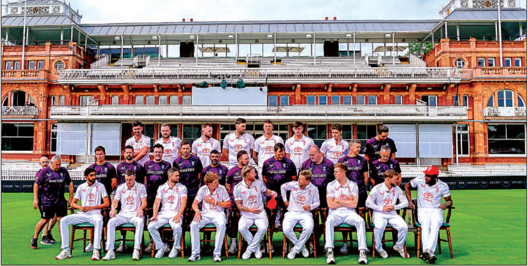
लंदन के खूबसूरत लॉर्ड्स क्रिकेट ग्राउंड पर इंग्लैंड की टीम।

बुमराह और जोफ़ा आर्चर की वापसी से बल्लेबाजों का काम और कठिन हो जाएगा। बल्लेबाजी विभाग में भारतीय टीम के लिए ज़्यादा चिंता की कोई बात नहीं है, सिवाय करुण नायर के फॉर्म के, जो लेथ से उछलती गेंदों के सामने थोड़े असहज दिखे हैं। इंग्लैंड यशस्वी जायसवाल की शॉर्ट पिच गेंदों से परीक्षा लेने की कोशिश करेगा लेकिन पूरी संभावना है कि भारतीय सलामी बल्लेबाज रन बनाने का कोई न कोई तरीका निकाल ही लेगा।