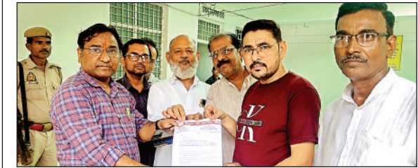
एसडीएम को ज्ञापन देते व्यापार मंडल के पदाधिकारी।