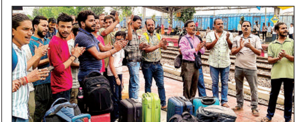
बुधवार को बाबा बर्फानी के दर्शन के लिए जाते श्रद्धालु।