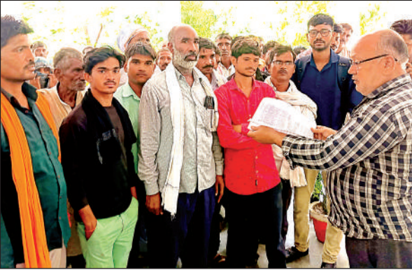
कलेक्ट्रेट में प्रशासनिक अधिकारी को ज्ञापन देते अतरैयाडैरा के ग्रामीण। अमृत विचार

दूसरे गांव के विद्यालय जाने के लिए बच्चों को कीचड़ भरे रास्ते से गुजरना पड़ेगा