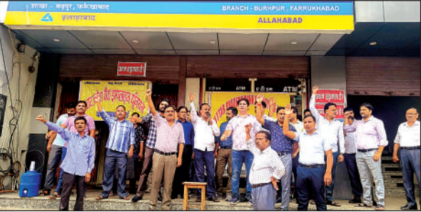
इंडियन बैंक में हड़ताल करते बैंक कर्मचारीगण।