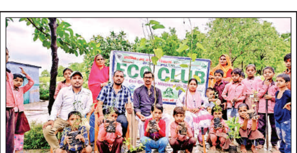
प्राथमिक विद्यालय मुस्लिमपुरवा में पौधरोपण कार्यक्रम में शिक्षक और बच्चे।