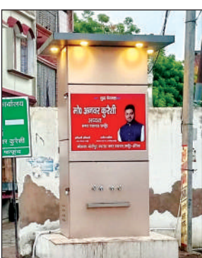
लगाया गया वाटर कूलर।

कस्बे में लगभग पांच साल पहले कई वाटर कूलर लगाए गए थे। देखरेख के अभाव में वाटर कूलर दम तोड़ चुके थे और शो पीस बन गए थे। हाल में नगर पंचायत ने उनकी मरम्मत की कराई लेकिन वो कामयाब नहीं हुए और लोगों को भीषण गर्मी में ठंडा पेयजल भी नहीं उपलब्ध हो पा रहा था। राहगीरों और कस्बे के लोगों की दिक्कत को देखते हुए नगर पंचायत