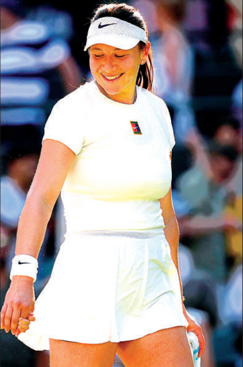
अमेरिका की अमांडा अनिसिमोवा महिला एकल क्वार्टर फाइनल मैच जीतने का जश्न मनाती हुई।

लंदन : इंग्लैंड के पूर्व बल्लेबाज माइक रामप्रकाश ने भारत के नये कप्तान शुभमन गिल की उनके दमखम, कौशल और जब्बे के लिए प्रशंसा करते हुए कहा कि इस युवा बल्लेबाज ने दिखा दिया है कि वह अवसान पर चल रहे 'फैब फोर' (पिछले एक दशक में दुनिया के चार सर्वश्रेष्ठ बल्लेबाज) से जिम्मेदारी संभालने में सक्षम हैं। गिल ने बर्मिंघम टेस्ट की दोनों पारियों में 269 और 161 रन बनाए। इससे पहले उन्होंने लीड्स में श्रृंखला के पहले मैच की पहली पारी में 147 रन भी बनाए थे। रामप्रकाश ने 'द गार्डियन' में लिखा हमें न केवल एक बल्लेबाज के रूप में बल्कि एक युवा टीम के नए कप्तान के रूप में उदाहरण स्थापित करने के लिए उनकी सहनशक्ति, उनके कौशल और उनके जब्बे की दाद देनी होगी। उन्होंने कहा कप्तानी किसी खिलाड़ी की फॉर्म पर प्रतिकूल प्रभाव डाल सकती है, लेकिन ऐसा लगता है कि इसने उन्हें एकाग्र किया है।