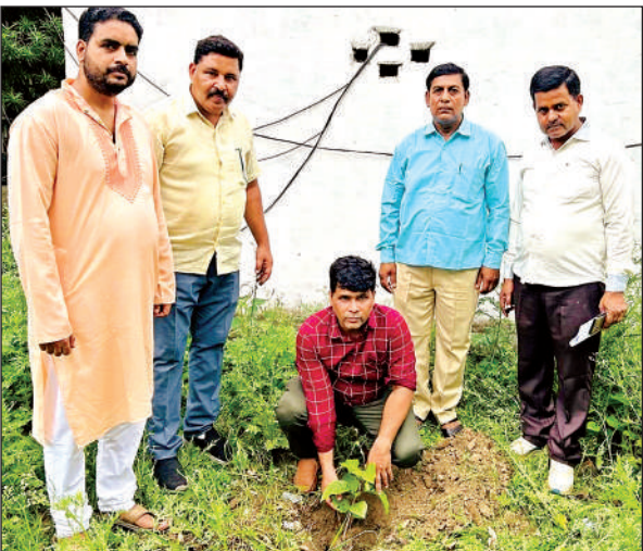
सौरिख में पौधरोपण करते शिक्षक।