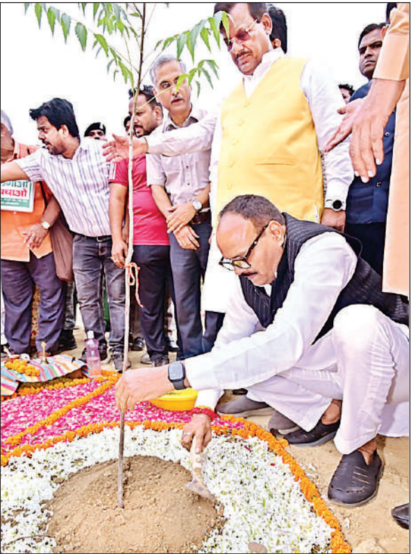
लखनऊ के कुकरेल वन क्षेत्र में पौधा रोपित करते उप मुख्यमंत्री ब्रजेश पाठक।

कि महिला परिचालकों को संविदा चालकों-परिचालकों के समान दर से ही भुगतान किया जायेगा। महिला अभ्यर्थियों को उनके गृह जनपद के तहत आने वाले डिपो में नियुक्त किया जायेगा।