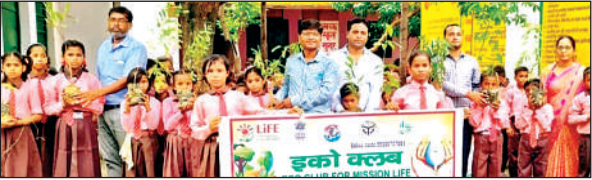
जलालाबाद में पीएस अली नगर में छात्र-छात्रा पौधों को हाथों में लिए हुए।