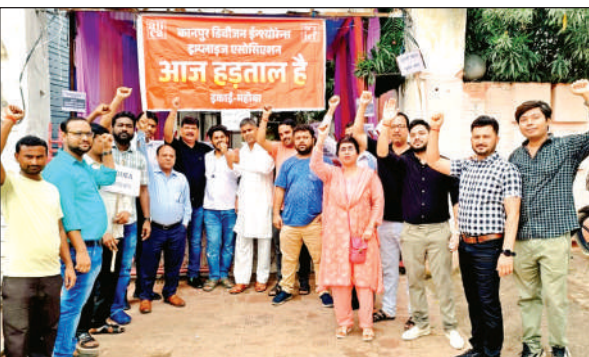
एलआईसी गेट पर प्रदर्शन करते कर्मवारी।

केन्द्रीय ट्रेड यूनियनों एवं सहयोगी फेडरेशन द्वारा ऑल इंडिया इंश्योरेंस एम्प्लॉई एसोसिएशन के आह्वान पर कानपुर डिविजन इंश्योरेंस एम्प्लॉई एसो. के बैनर तले भारतीय जीवन बीमा निगम शाखा कार्यालय महोबा के संवर्ग तृतीय और चतुर्थ श्रेणी कर्मचारियों ने एक दिवसीय हड़ताल करते हुए मांग रखी कि पुरानी पेंशन