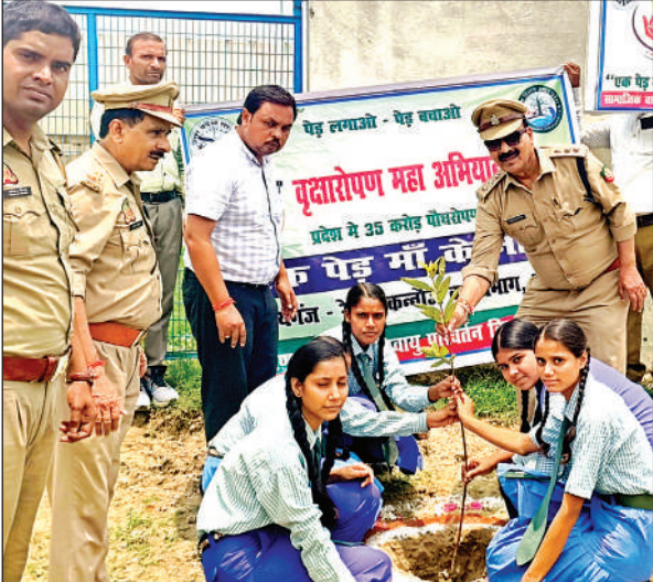
तेराजाकेट में पौधरोपण करती छात्राएं व मौजूद वन विभाग की टीम।