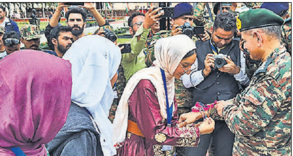
कारगिल के द्रास में कारगिल युद्ध स्मारक पर एक सरकारी स्कूल की छात्राओं ने सेना प्रमुख जनरल उपेंद्र द्विवेदी को राखी बांधी।

इस बार भारत ने न केवल शोक व्यक्त किया बल्कि यह भी दिखाया कि जवाब निर्णायक होगा। सेना प्रमुख ने विजय दिवस पर एक सभा को संबोधित करते हुए कहा कि दुश्मन को कड़ा जवाब देना भारत के लिए अब सामान्य बात है। उन्होंने कहा, देशवासियों द्वारा दिखाए गए विश्वास और सरकार