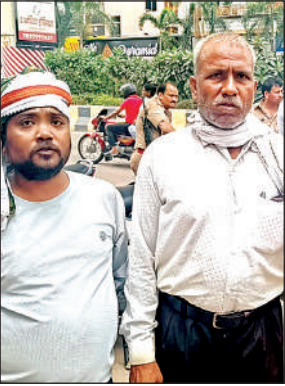
घटना की जानकारी देते बच्चे के बाबा।