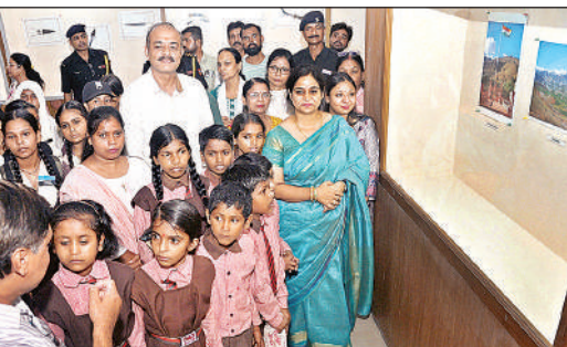
राज्य संग्रहालय में लगी प्रदर्शनी में चित्र देखते बच्चे, साथ में अन्य।