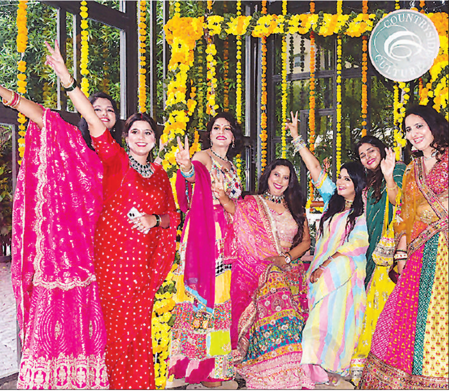
भोपाल में शनिवार को सावन की हरियाली तीज उत्सव के दौरान सेल्फी लेती महिलाएं