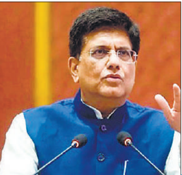
● कहा- 22 से 23 वर्ष की कशमकश के बाद संभव हुआ यह समझौता

उन्होंने भारतीय जनता पार्टी मुख्यालय में आयोजित एक विशेष संवाददाता सम्मेलन में इसी सप्ताह प्रधानमंत्री मोदी की ब्रिटेन यात्रा में हुए भारत-ब्रिटेन सेट के महत्वपूर्ण पहलुओं की व्याख्या की। उन्होंने कहा कि भारत ने दुनिया