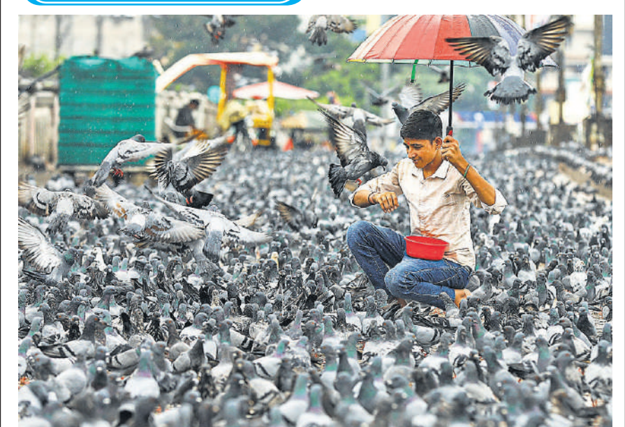
हैदराबाद के मुसल्लम जंग पुल पर शनिवार को कबूतरों के झुंड को दाना खिलाता व्यक्ति। कबूतर अपनी शान, बुद्धिमता और सैन्य कौशल के लिए भी जाने जाते हैं, कई संस्कृतियों में इनका सम्मान किया जाता है।