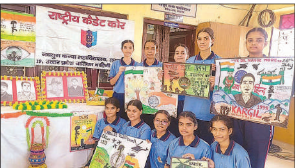
नवयुग कन्या महाविद्यालय में शहीदों के चित्रों के साथ एनसीसी कैडेटों ने दी श्रद्धांजलि