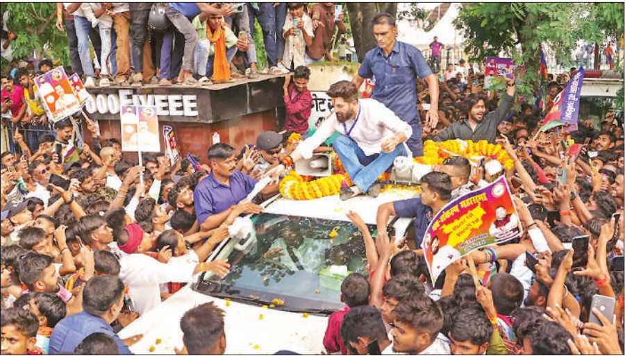
गया में शनिवार को केंद्रीय मंत्री और लोक जनशक्ति पार्टी के प्रमुख विराग पासवान का स्वागत करते कार्यकर्ता।

बरेली । बरेली-सीबीगंज रूट पर शुक्रवार देर रात मालगाड़ी के पहिए जाम हो गए। इससे कई ट्रेनों की आवाजाही प्रभावित हुई। यह तकनीकी खामी उस समय सामने आई जब मालगाड़ी स्टेशन से कुछ ही दूरी पर थी। अचानक उसके एक बोगी के पहियों में रुकावट आ गई। मालगाड़ी रुकते ही रूट पर चल रही अन्य ट्रेनों का संचालन प्रभावित हुआ। रेल अधिकारियों के अनुसार रात करीब 1:30 बजे यह खामी सामने आई थी।