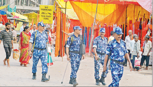
सरयू घाट के पास गश्त करते आरएएफ के जवान।

मेला क्षेत्र को पांच जोन व 30 सेक्टर में बांटेकर जोन व सेक्टर का प्रभारी