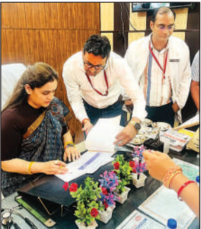
सीएचसी को चेक करती अपर्णा यादव।

को बेहतर सेवाएं मुहैया कराने का निर्देश दिया। शुक्रवार को राज्य महिला आयोग की उपाध्यक्ष अपर्णा यादव के निरीक्षण के दौरान एक बार फिर से भोजन की गुणवत्ता पर सवाल खड़े हो गए हैं। दरअसल अपर्णा जब कस्तूरबा स्कूल पहुंचीं तो बेटियों को भोजन परोसा जा रहा था। वह सीधे कैटिन की तरफ