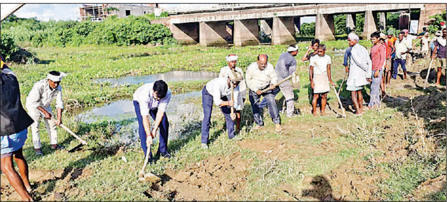
श्रावस्ती में फावड़ा चलाकर कार्य की शुरुआत करते अधिकारी, साथ में अन्य।

अमृत विचार : श्रावस्ती में बूढ़ी राप्ती नदी के पुनर्जीवित करने की प्रक्रिया शुरू हो गई है। इससे न सिर्फ पर्यावरणीय संतुलन बनाए रखने में मदद मिलेगी, बल्कि आसपास के किसानों के लिए जीवनदायिनी बनेगी। बूढ़ी राप्ती नदी की कुल लंबाई 67.03 किमी है, और इसका कैचमेंट एरिया 18356.64 हेक्टेयर है। नदी का 16.91 किमी हिस्सा अवरोधित है, जबकि शेष 51.12 किमी का हिस्सा स्वाभाविक रूप में मौजूद है। नदी के पुनर्जीवित होने से आसपास के किसानों को जल आपूर्ति में मदद मिलेगी, जिससे उनकी कृषि गतिविधियों में बढ़ोतरी होगी। बूढ़ी