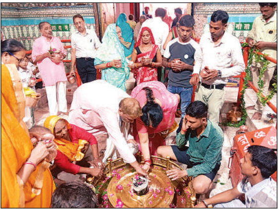
लोधेश्वर महादेवा में जलाभिषेक व दर्शन पूजन करते श्रद्धालु।