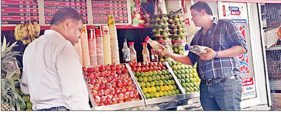
लखनऊ-अयोध्या मार्ग पर जूस सेंटर में जांच करती खाद्य सुरक्षा एवं औषधि प्रशासन की टीम।

टीम ने शुक्रवार को सीतापुर रोड और लखनऊ-अयोध्या मार्ग पर जांच अभियान चलाया। इस दौरान गोयल टावर, त्रिवारिगंज व उत्तरधौना के बीच करीब 30 चाय की दुकान, फल-जूस सेंटर, फास्ट-