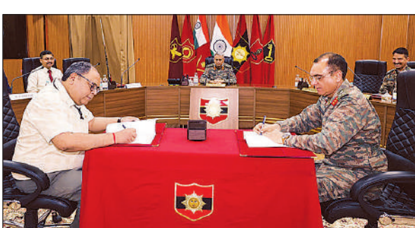
छावनी स्थित मध्यकमान में एमओयू करते अफसर।