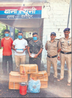
थाना त्यूनी पुलिस की गिरफ्त में आरोपी और बरामद विस्फोटक पदार्थ।