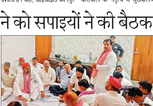
सरोजनीनगर के हिंद नगर में बैठक करते सपाईं।