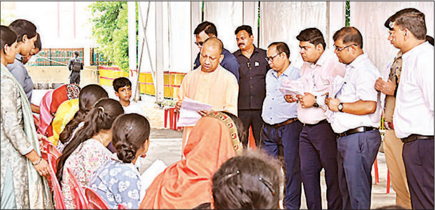
गोरखपुर के गोरखनाथ मंदिर में आयोजित जनता दर्शन में लोगों की समस्याएं सुनते मुख्यमंत्री योगी, साथ में मौजूद अधिकारी।

अमृत विचार : मुख्यमंत्री योगी आदित्यनाथ ने लगातार दूसरे दिन शुक्रवार को गोरखनाथ मंदिर परिसर में ‘जनता दर्शन’ के तहत करीब 200 लोगों की समस्याएं सुनीं। सभी को आश्वस्त किया कि समस्याओं का समाधान सुनिश्चित किया जाएगा। सरकार हर जरूरतमंद के साथ खड़ी है। मुख्यमंत्री ने अधिकारियों को संबंधित मामलों के निस्तारण के निर्देश दिए। मुख्यमंत्री शुक्रवार सुबह जनता दर्शन में गोरखनाथ मंदिर परिसर में कुर्सियों पर बैठए गए लोगों तक पहुंचे और एक-एक करके सबकी समस्याएं सुनीं। अधिकारियों से कहा कि जनता की हर पीड़ा का निवारण सुनिश्चित किया जाए। इसमें किसी भी तरह की शिथिलता नहीं होनी चाहिए। मुख्यमंत्री के