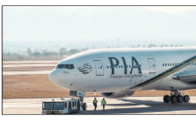
● जेहा में उतरने के बाद आग्रजन अधिकारियों ने वापस लौटाया