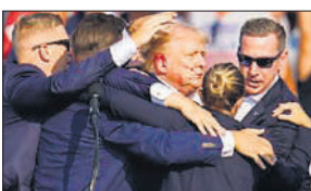
● 45 मिनट पहले मिली थी संदिग्ध शख्स की सूचना, नहीं की कार्रवाई

पिछले वर्ष ट्रंप पर राष्ट्रपति चुनाव के प्रचार के दौरान पेंसिलवेनिया के बटलर में आठ गोलीयां चलाई गई थीं। एक कमांडो ने तत्काल बंदूकधारी को मार गिराया था लेकिन गोलीबारी में एक व्यक्ति की मौत और दो लोगों के घायल होने की घटना ने खुफिया सेवा पर गंभीर सवाल खड़े कर दिए थे। सीनेट की होमलैंड सिक्योरिटी एंड गवर्नमेंटल अफेयर्स कमेटी की रिपोर्ट में कहा गया है जो हुआ वह माफ करने