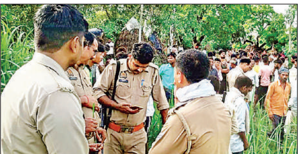
घटना के बाद मौके पर जांच-पड़ताल करती पुलिस।

सोमवार सुबह बाघ ने जंगल से करीब 10 किमी दूर खेत की रखवाली कर रहे किसान को मार