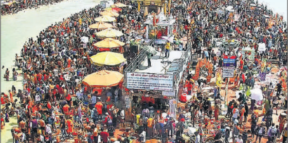
हरिद्वार में गंगाघाट पर उमड़ी कांवड़ियों की भीड़।