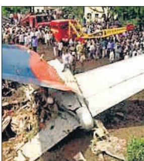
गई थी तथा विमान के एक इमारत से टकराने के कारण 19 अन्य लोगों की जान चली गई थी।

सीईओ कैम्पबेल विल्सन ने कहा कि अहमदाबाद में 12 जून को हुई विमान की दुर्घटना की जांच अभी पूरी नहीं हुई है, लिहाजा लोगों को जल्दबाजी में कोई निष्कर्ष नहीं निकालने चाहिए। इस हादसे में विमान में सवार 242 लोगों में से एक को छोड़कर सभी की मौत हो