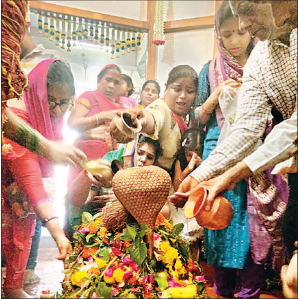
सदर बाजार के शिवा ज्योति शिवलिंग मंदिर में जलाभिषेक करते भक्त।