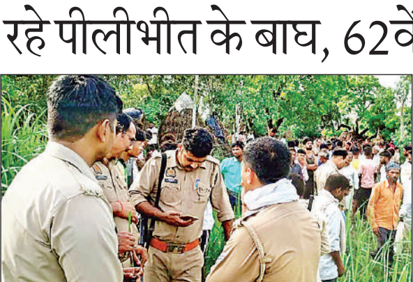
घटना के बाद मौके पर जांच-पड़ताल करती पुलिस।