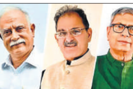
अशोक राजू, कविंद्र गुप्ता व अशीम घोष।

पश्चिम बंगाल से भाजपा के वरिष्ठ नेता अशीम कुमार घोष हरियाणा के नए राज्यपाल होंगे। इसमें कहा गया कि उन की नियुक्तियां उनके कार्यभार संभालने की तिथि से प्रभावी होंगी। आंध्र प्रदेश से तेलुगु देशम पार्टी (तेदेपा) के नेता राजू गोवा के राज्यपाल के