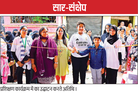
प्रशिक्षण कार्यक्रम में का उद्घाटन करते अतिथि।