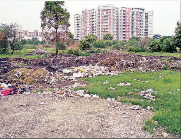
वृंदावन योजना के सेक्टर 12 में खाली भूखंड पर लगे कूड़े के ढेर।

» कंपनी की लापरवाही से वृंदावन योजना के खाली भूखंड बन गए कूड़ा घर