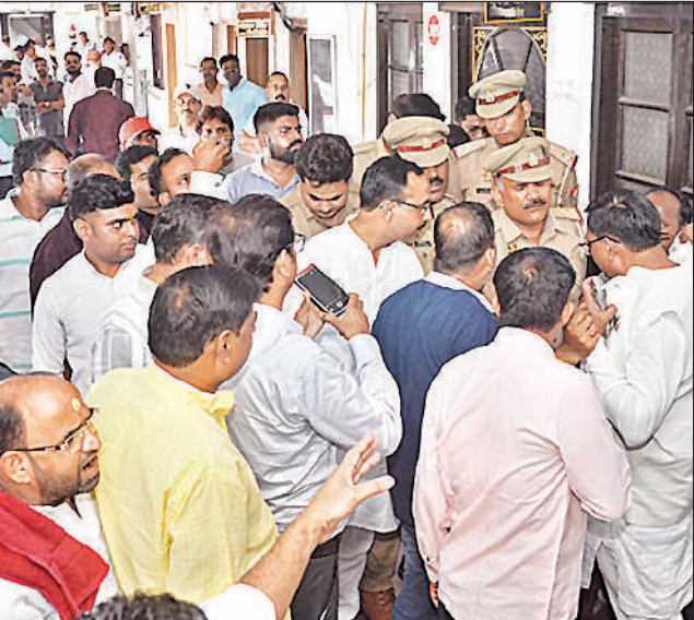
नगर निगम मुख्यालय पहुंचे पुलिसकर्मियों से बहस करते पार्षद।