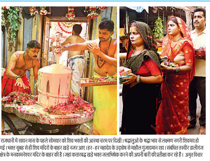
राजधानी में सावन मास के पहले सोमवार को शिव भक्तों की आस्था चरम पर दिखी। श्रद्धालुओं के श्रद्धा भाव से लक्ष्मण नगरी शिवमय हो गई। भक्त सुबह से ही शिव मंदिरों के बाहर खड़े नजर आए। हर-हर महादेव के उद्घोष से माहौल गुंजायमान रहा। संबंधित तस्वीर डालीगंज क्षेत्र के मनकागमनेश्वर मंदिर के बाहर की है। जहां कतारबद्ध खड़े भक्त जलाभिषेक करने की अपनी बारी की प्रतीक्षा कर रहे हैं। अमृत विचार