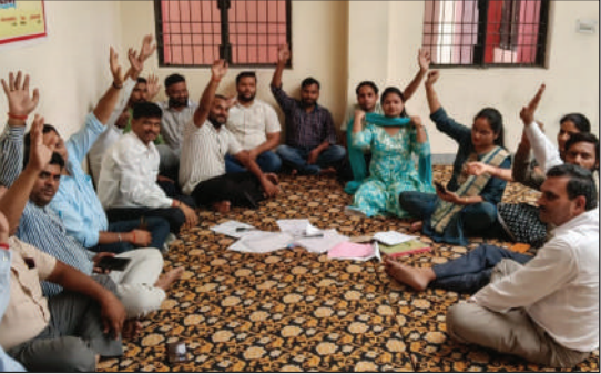
सरोजनीनगर तहसील में धरना-प्रदर्शन करते लेखपाल।