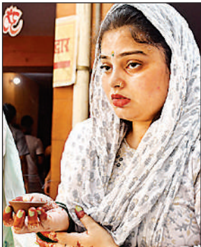
आरती करती महिला।