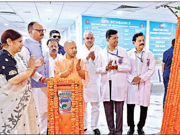
केजीएमयू में विभिन्न परियोजनाओं का लोकार्पण एवं शिलान्यास करते मुख्यमंत्री योगी आदित्यनाथ।

» योगी ने 941 करोड़ रुपये की सात परियोजनाओं का किया लोकार्पण और शिलान्यास