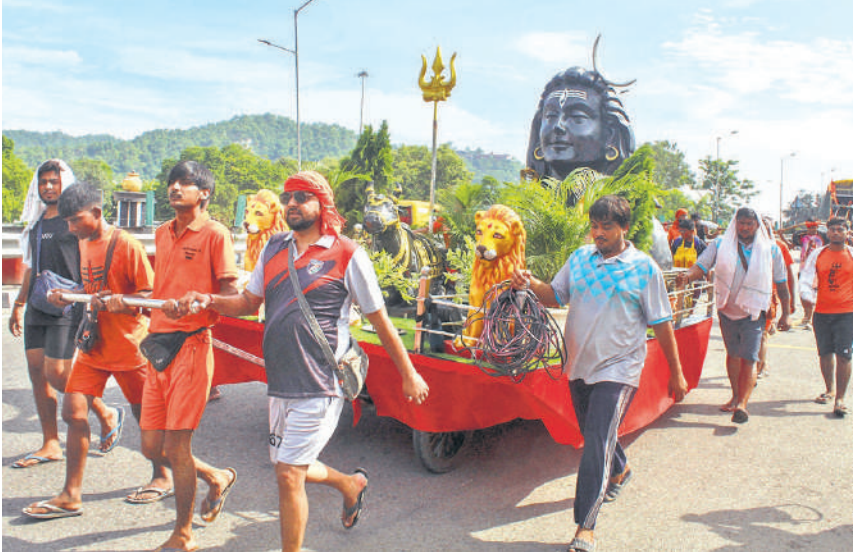
हरिद्वार : श्रावण मास के शुरू होते ही कांवड़ यात्रा जोरों पर है। पहले सोमवार को अलग- अलग जगहों पर भोलै के भक्तों के जत्थे डीजे में झूमते दिखे। दिल्ली-हरिद्वार एक्सप्रेसवे पर भगवान शिव की मूर्ति के साथ कांवड़ खींचते हुए कांवड़िये।