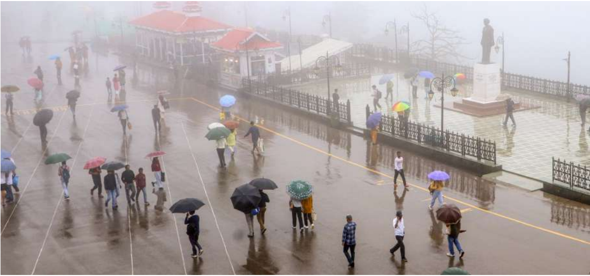
हिल स्टेशन शिमला में मानसून ने दस्तक दे दी है और पहाड़ी इलाकों में रिमझिम बारिश जारी है। बारिश के बीच लोग छते लेकर माल रोड और अन्य पर्यटन स्थलों पर टहलते नजर आए। ठंडी हवा और नमी से मौसम सुहावना हो गया है, जिससे स्थानीय निवासी और पर्यटक दोनों ही आनंदित हैं।