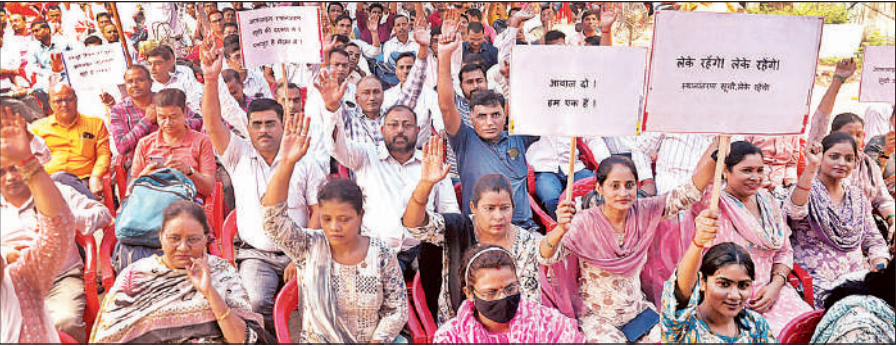
माध्यमिक शिक्षा निदेशालय पर प्रदर्शन करते शिक्षक।