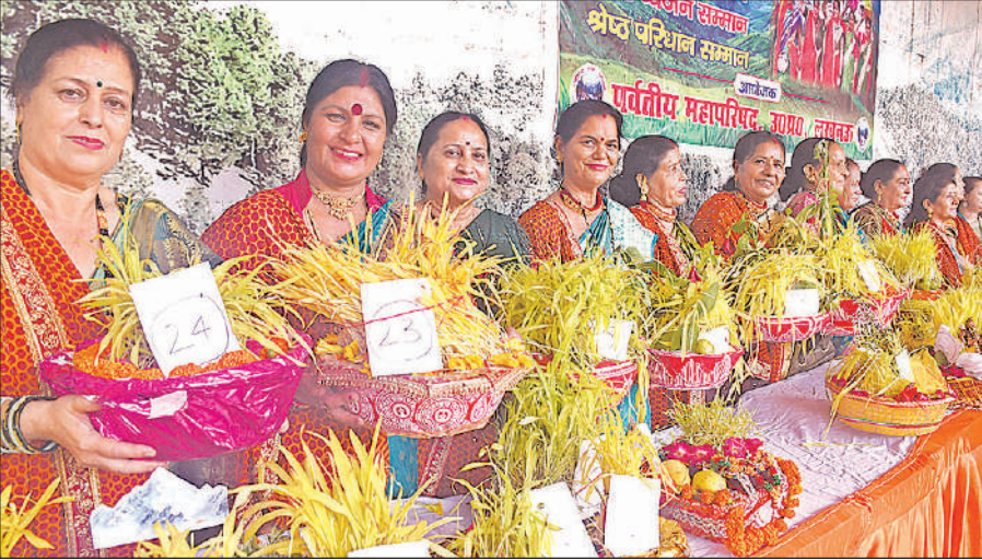
पर्वतीय महापरिषद की ओर से आयोजित हरेला प्रतियोगिता में टोकरियों के साथ महिलाएं।