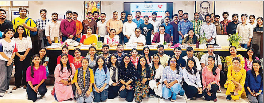
साइबर फ्राइ विषय पर आयोजित कार्यशाला में विशेषज्ञ व विद्यार्थी ।