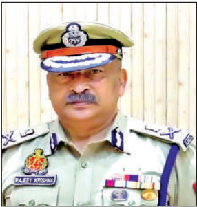
● मेरठ जोन में सबसे अधिक हुई कार्रवाई, अपराधियों में जीरो टॉलरेंस नीति का खोफ