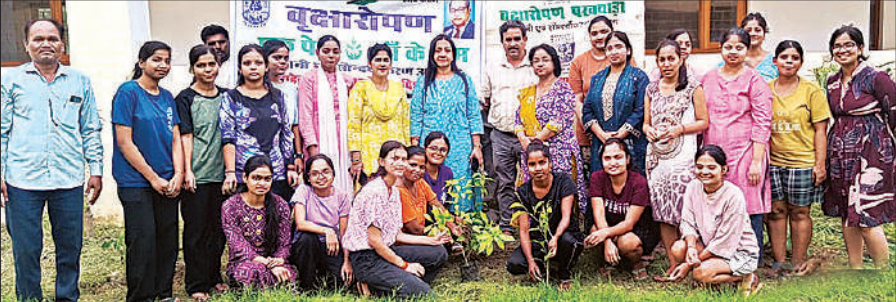
बीबीएयू में पौधारोपण करती छात्राएं।

अमृत विचार: बाबासाहेब भीमराव अम्बेडकर विश्वविद्यालय के सावित्रीबाई फुले महिला छात्रावास में 'वृक्षारोपण पखवाड़ा' के अंतर्गत पौधारोपण अभियान चलाया गया। विश्वविद्यालय के बागवानी व