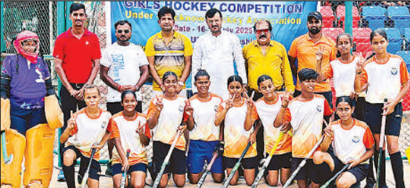
अंडर-19 महिला हॉकी में चैंपियन बने वाली केडी सिंह बाबू सोसाइटी की टीम।

अमृत विचार: जिला स्तरीय महिला हॉकी (अंडर-19) प्रतियोगिता में केडी सिंह बाबू सोसाइटी की टीम चैंपियन बनी। गोमती नगर विजयंत खंड के पंचश्री मो. शाहिद स्टेडियम में गुरुवार को खेले गए फाइनल में केडी सिंह बाबू सोसाइटी ने वीर शिवाजी हॉकी एकेडमी को बेहद रोमांचक मुकाबले में 2-1 से शिकस्त दी। तीसरे स्थान के लिए खेले गए मुकाबले में खेले इंडिया सेंटर केडी सिंह बाबू स्टेडियम में किया। वहीं सेमीफाइनल मुकाबलें में वीर शिवाजी हॉकी एकेडमी ने