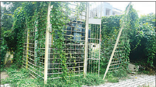
गोमतीनगर के सुभाष पार्क में रखे ट्रांसफार्मर का खुला गेट व आसपास फैली बेतली।

अमृत विचार : राजधानी में 24 घंटे निर्बाध बिजली आपूर्ति कराने के लिए पावर कॉरपोरेशन की ओर से उठाए गए तमाम कदमों को कटे पड़े अंडरग्राउंड केबल तार, पेड़ों की टहनियों से लिपटे ट्रांसफार्मर और जर्जर बिजली के खंभे पानी फेर रहे हैं। जो दुर्घटना को न्यौता देने के साथ घंटों सप्लाई के बाधित होने का कारण भी बन रहे हैं। वहीं बारिश और जमे पानी में इन कटे तारों और बिजली के खंभों में करंट उतरने की आशंका भी बनी हुई है। राजधानी के विभिन्न क्षेत्रों में ट्रांसफार्मरों पर लिपटी पेड़ों की लताएं, झुके और जर्जर बिजली के पोल सहित अंडरग्राउंड केबल