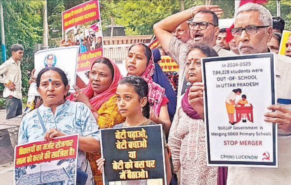
प्रतिरोध मार्च के दौरान नारेबाजी करते एड़वा के कार्यकर्ता।