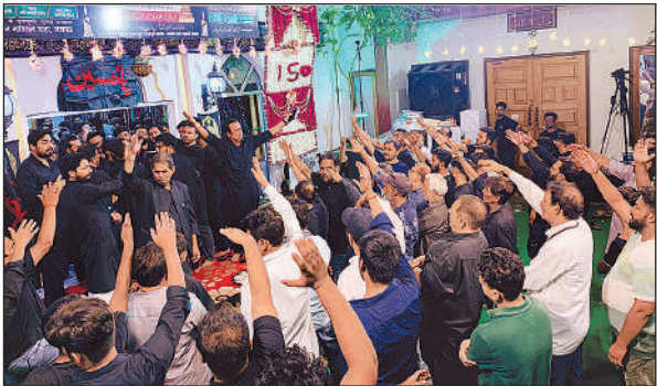
अंजुमन नासिरुल अजा की शब्देदारी में मौजूद लोग।