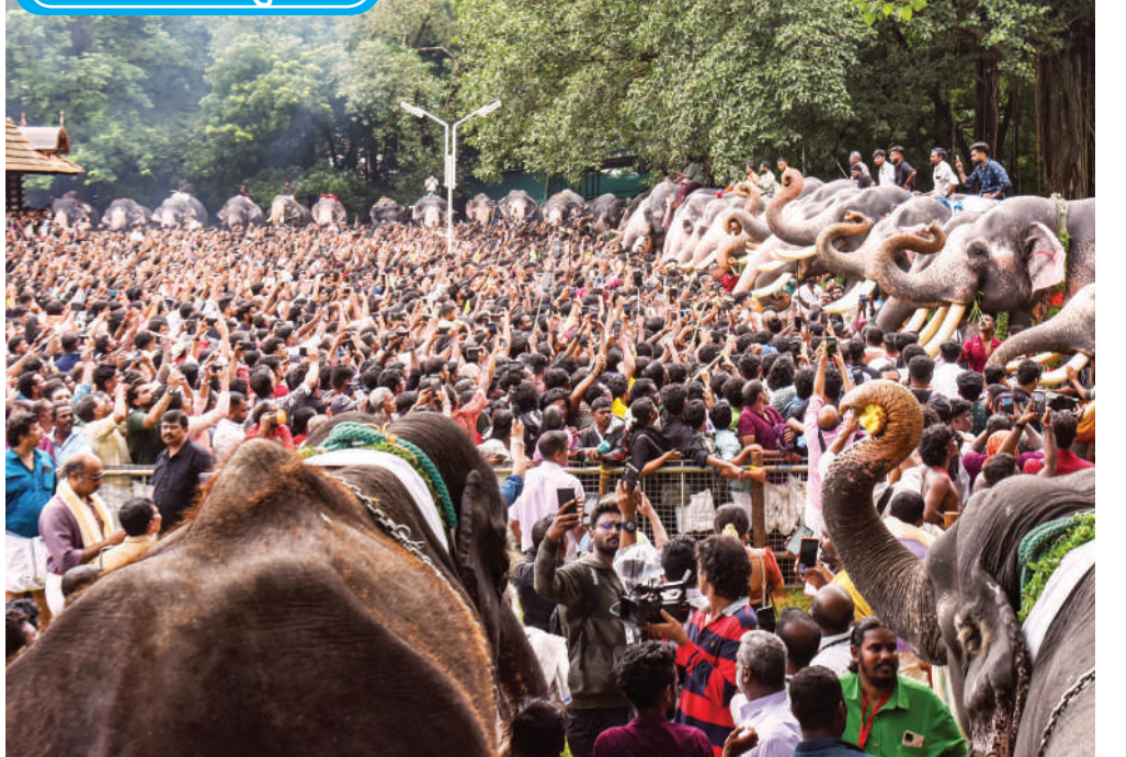
केरल के त्रिशूर स्थित श्री वडक्कुमनाथन मंदिर में गुरुवार को मलयालम महीने कार्किडकम की शुरुआत के उपलक्ष्य में हाथियों को खाना खिलाते लोग, इस रस्म को आनाखूट्टू कहा जाता है। यह भगवान गणेश को समर्पित उत्सव है जिसमें हजारों लोग भाग लेते हैं।