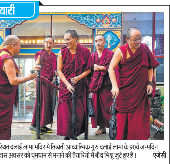
धर्मशाला : कामाड़ा जिले के मैक्लोडगंज स्थित दलाई लामा मंदिर में तिब्बती आध्यात्मिक गुरु दलाई लामा के 90वें जन्मदिन समारोह की तैयारियां जारी पर हैं। इस खास अवसर को धूमधाम से मनाने की तैयारियों में बौद्ध भिक्षु उठे हुए हैं।