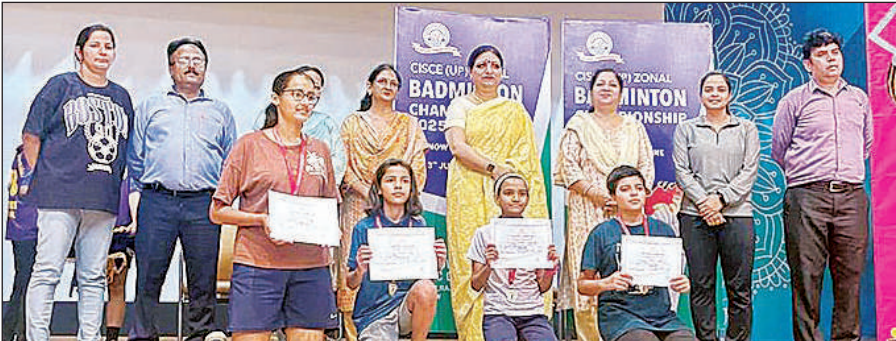
पदक के साथ विजयी खिलाड़ी।