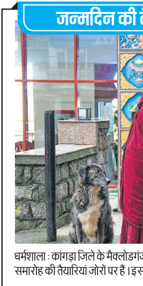
धर्मशाला : कामाड़ा जिले के मैक्लोडगंज स्थित दलाई लामा मंदिर में तिब्बती आध्यात्मिक गुरु दलाई लामा के 90वें जन्मदिन समारोह की तैयारियां जारी पर हैं। इस खास अवसर को धूमधाम से मनाने की तैयारियों में बौद्ध भिक्षु उठे हुए हैं।