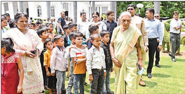
राजभवन में बच्चों के साथ मौजूद राज्यपाल आनंदीबेन पटेल।

अमृत विचार : राज्यपाल आनंदीबेन पटेल ने कहा कि बच्चे आत्मविश्वास के साथ आगे बढ़ें और अपनी प्रतिभा को पहचानें। राज्यपाल गुरुवार को राजभवन उच्च प्राथमिक विद्यालय में नौनिहाल बच्चों के लिए आयोजित प्रवेशोत्सव कार्यक्रम को संबोधित कर रही थीं। राज्यपाल ने कहा कि प्रत्येक बच्चे को विद्यालय में लाने का प्रयास किया जाना चाहिए। 3 साल के बच्चों का आंगनबाड़ी में नामांकन व 6 साल पूर्ण होने पर उन्हें अनिवार्य रूप से प्राथमिक विद्यालय में प्रवेश करवाना चाहिए। उन्होंने राजभवन बैड व 'स्टूडेंट पुलिस कैडेट' (सीपीसी) के बच्चों के प्रशिक्षण को उदाहरण स्वरूप प्रस्तुत