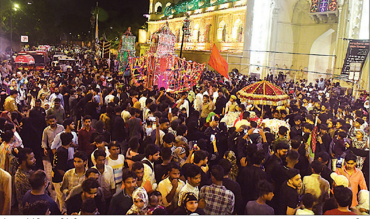
बड़े इमामबाड़े से निकला शाही मेंहदी का जुलूस।

हजरत कासिम की मेंहदी ठीक उसी शान से निकली जैसे कि शादी के वक्त मेंहदी भेजी जाती है। मेंहदी के साथ फल, मेवा और मलीदा भी था। जुलूस में पीएसी के जवान बैंड पर नौहे की धुन बजा रहे थे। बड़े इमामबाड़े से निकलकर रूमी रोड, घंटाघर और रईस मंजिल होता हुआ जुलूस देर रात में छोटे इमामबाड़े पहुंचा। जुलूस के दौरान जुलूस के रास्ते पर बड़ी संख्या में