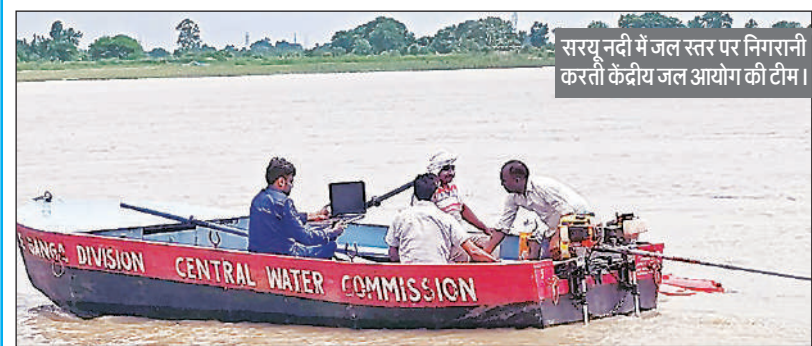
सरयु नदी में जल स्तर पर निगरानी करती केंद्रीय जल आयोग की टीम।