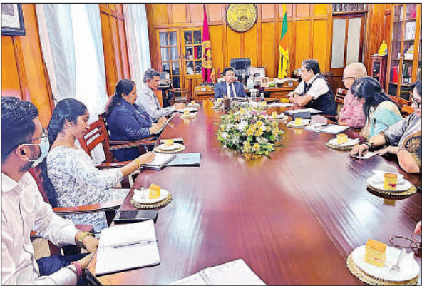
गोलमेज बैठक में लविवि और श्रीलंकाई विश्वविद्यालय का प्रतिनिधि मंडल।

अमृत विचार: लखनऊ विश्वविद्यालय के प्रतिनिधि मंडल और श्रीलंका के केलेनिया और पेरेदोनिया विश्वविद्यालय के कुलपतियों के साथ गोलमेज चर्चा का आयोजन किया गया। लखनऊ विश्वविद्यालय का प्रतिनिधि मंडल कुलपति के नेतृत्व में इन दिनों श्रीलंका यात्रा पर है। दक्षिणापथ: संवाद और समन्वय अभियान के तहत कार्यक्रम का गुरुवार को समापन हो गया। गोलमेज बैठक में लखनऊ विश्वविद्यालय और श्रीलंकाई विश्वविद्यालयों के बीच दोहरी डिग्री, संयुक्त डिग्री, शैक्षिक