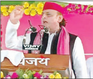
कार्यक्रम को संबोधित करते सपा के राष्ट्रीय अध्यक्ष अखिलेश यादव।

समाजवादी पार्टी के राष्ट्रीय अध्यक्ष अखिलेश यादव ने गुरुवार को शहर से सटे अनवरगंज में अपने नए आवासीय भवन और पार्टी कार्यालय के उद्घाटन किया। उन्होंने इस नवनिर्मित आवासीय भवन और पार्टी कार्यालय को पीडीएफ भवन का नाम दिया। इस दौरान सपा के राष्ट्रीय अध्यक्ष अखिलेश यादव ने भाजपा सरकार पर प्रहार करते हुए कहा कि यदि 2027 में उत्तर प्रदेश में समाजवादी सरकार बनती है तो हर परिवार को 300 यूनिट बिजली मुफ्त दी जाएगी, युवाओं को आईपैड मिलेगा और महिलाओं को 3000 रुपये मासिक समाजवादी पेंशन दी जाएगी। इसके साथ ही आउटसोर्सिंग की