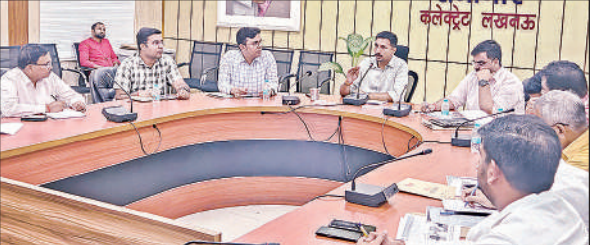
कलेक्ट्रेट सभागार में अधिकारियों के साथ बैठक करते जिलाधिकारी।

करने की शिकायतें मिल रही हैं। उन्होंने कहा कि किसी भी विभाग द्वारा सामान्य निर्माण कार्य के लिए रोड कटिंग नहीं की जाएगी। समीक्षा में संज्ञान में आया कि काकोरी स्थित 2 रोड जिनकी 2 माह पहले कटिंग की गई थी अभी तक नहीं बनायी