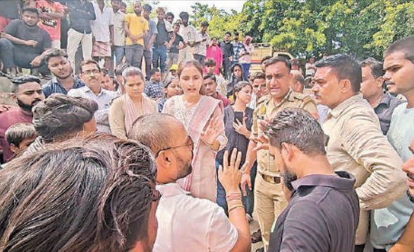
आक्रोशित लोगों को समझाते पुलिस अधिकारी।

» मछलियां खाने से एक कुत्ता भी मरा, लोगों ने किया हंगामा