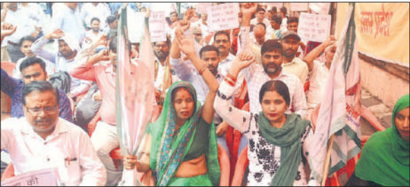
निजीकरण के विरोध में शक्ति भवन पर धरना-प्रदर्शन करते विद्युत कर्मचारी।

अमृत विचार : देश के 10 श्रमिक संगठनों के राष्ट्रव्यापी हड़ताल के आह्वान पर बुधवार को प्रदेश भर में बिजली समेत विभिन्न विभागों के कर्मियों व श्रमिकों ने हड़ताल में शामिल होकर विरोध प्रदर्शन किया। कर्मियों ने अपने विभागों के सामने सभाकर केंद्र के श्रम कानूनों, निजीकरण व अन्य कर्मचारी विरोधी