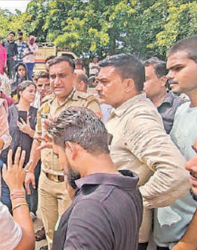
आक्रोशित लोगों को समझाते पुलिस अधिकारी।

» तालाब के पास से मिली तीन शीशी, जांच के लिए भेजा