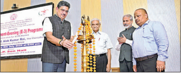
दीप प्रज्ज्वलन कर कार्यक्रम का शुभारंभ करते कुलपति।