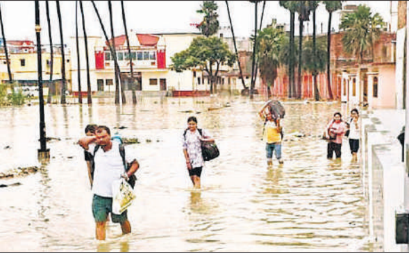
अयोध्या के जलवानपुरा क्षेत्र से सुरक्षित स्थान की ओर जाते लोग।

अमृत विचार : उत्तर प्रदेश और उत्तराखण्ड समेत आसपास के राज्यों में भारी बारिश के चलते प्रदेश के कई जिले बाढ़ की चपेट में आ गए हैं। अयोध्या में सरयू नदी के उफानाने से जहां आसपास के रिहायशी इलाकों में पानी आ गया था, फिलहाल स्थिति नियंत्रित है। वहीं बारिश के बाद प्रयागराज में एक बाढ़ड़े के जलभराव में डूब जाने से 4 बच्चों की मौत हो गई। उधर, चाराणसी में दशरथबेध घाट और अस्सी घाट तक पानी पहुंच चुका है, जिससे परंपरागत गंगा आरती