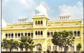
» राजनीति, लोकतंत्र, संविधान और आंदोलनों को समझने का माध्यम बनेगा संग्रहालय

अमृत विचार: लखनऊ विश्वविद्यालय में अपने छात्रों को जिम्मेदार नागरिक बनाने के साथ लोकतंत्र और संविधान की समझ विकसित करने के लिए राजनैतिक संग्रहालय का निर्माण किया जा रहा है। इस संग्रहालय में सिर्फ राजनीति विज्ञान के छात्र ही नहीं, बल्कि विश्वविद्यालय के सभी विषयों के छात्र-छात्राएं सहज ही अपने देश के विधान, प्रधान और निशान से जुड़े जाएंगे। छात्र देश की आजादी के आंदोलन से लेकर लोकतंत्र, संविधान, भारतीय राजव्यवस्था को आसानी से समझेंगे और राष्ट्रीय भावनाओं से ओतप्रोत हो जाएंगे।यह संग्रहालय मानव संसाधन विकास