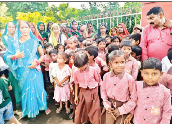
कलेक्ट्रेट परिसर में मौजूद स्कूली बच्चे।