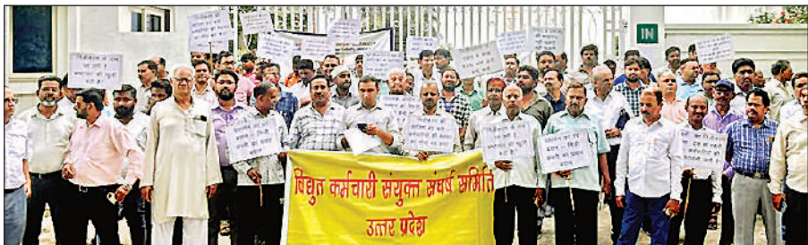
नियामक आयोग कार्यालय के सामने मौन प्रदर्शन करते बिजली विभाग के कर्मचारी।