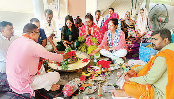
फोटो 8 – सत्य साईं पीजी कॉलेज में रुद्राभिषेक करते प्राध्यापक और छात्र-छात्राएं