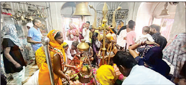
परियर स्थित बाबा बलखंडेश्वर महादेव मंदिर में पूजा-अर्चना करते भक्त।