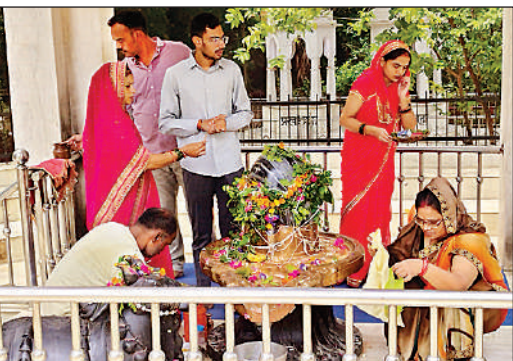
शुक्लागंज स्थित शिव मंदिर में शिवलिंग की पूजा करते भक्त।