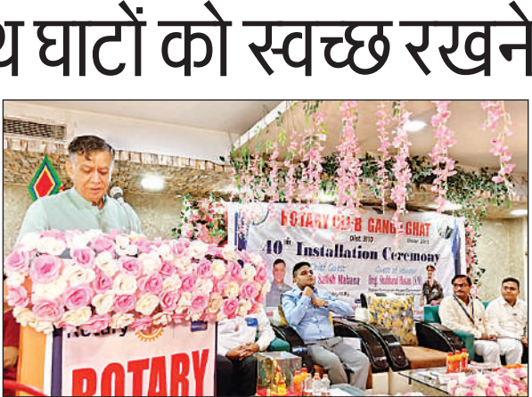
कार्यक्रम को संबोधित करते विधानसभा अध्यक्ष सतीश महाना।