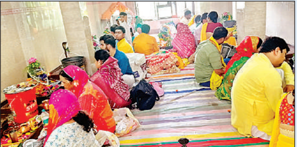
मां कल्याणी देवी मंदिर में स्थित द्वादश ज्योतिर्लिंग मंदिर में रुद्राभिषेक करते भक्त।