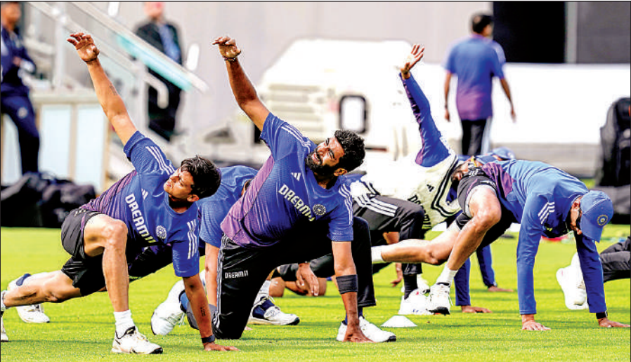
मैनचेस्टर के ओल्ड ट्रैफर्ड क्रिकेट ग्राउंड पर अभ्यास सत्र के दौरान जसप्रीत बुमराह ( मध्य ) व अन्य खिलाड़ी।

बयान में कहा गया है बीसीसीआई की मेडिकल टीम उनकी प्रगति पर नजर रख रही है। हरियाणा के तेज गेंदबाज अंशुल कंबोज को कवर के तौर पर टीम में शामिल किया गया है और वह मैनचेस्टर में टीम से जुड़ चुके हैं। चौथा टेस्ट मैच बुधवार को ओल्ड ट्रैफर्ड में शुरू होगा। इंग्लैंड पांच मैचों की एंडरसन तेंदुलकर ट्रॉफी में 2-1 से आगे चल रहा है।