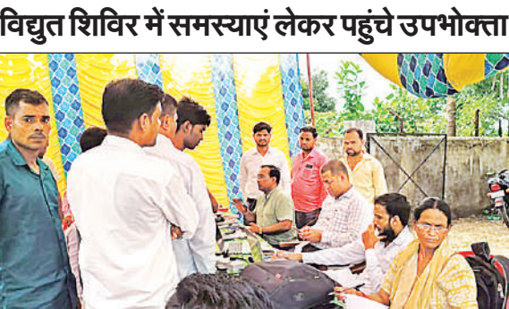
मेगा शिविर में शिकायतों का निस्तारण करते विद्युत अधिकारी।