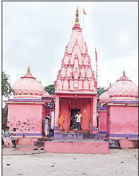
प्राचीन गुमनेश्वर मंदिर।