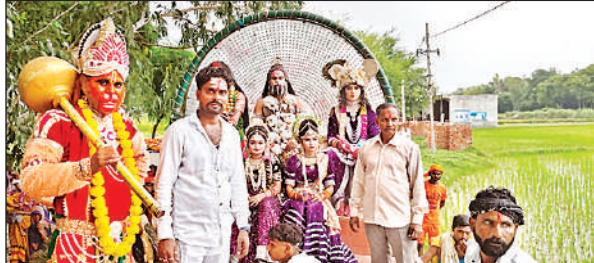
सलोन में कांवड़ यात्रा में शामिल लोग।

स्थित हरदोई सोसाइटी से खाद लेने आये थे। वापस जाते समय बछरावां की तरफ से आ रही तेज़ रफ़्तार अनियंत्रित कैश वैन ने दोनों को सामने से टक्कर मार दी और खुद रोड़ किनारे बने नाले में जाकर फंस गई। दोनों बाइक सवारों को इस टक्कर से गंभीर चोटें आईं। एम्बुलेंस की मदद से दोनों घायलों को बछरावां सीएचसी पहुंचाया गया, जहाँ प्राथमिक उपचार के बाद उन्हें लखनऊ ट्रामा सेंटर रेफर कर दिया गया। इस बाबत थाना प्रभारी सुरेंद्र कुमार ने बताया कि तहरीर मिलने पर आगे की कार्रवाई की जाएगी।