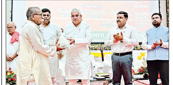
कृषक गोष्ठी में किसान को बीज का कौट देते राज्यमंत्री।