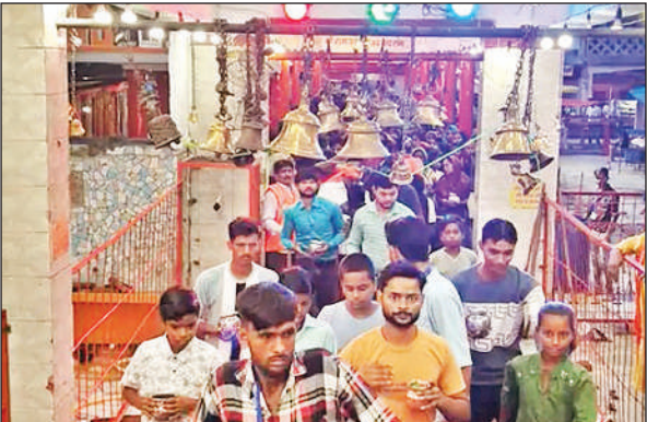
बाबा श्याम नाथ मंदिर में कतार में लगे शिव भक्त।