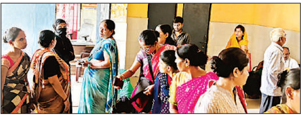
डॉक्टर के न होने पर पीएचसी में लगी मरीजों की भीड़।