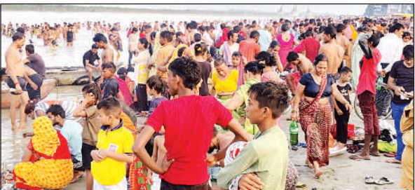
शुक्लागंज स्थित गंगातट पर स्नान करते श्रद्धालु।