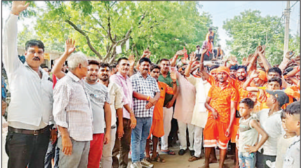
राजा फतेपुर में कांवड़ियों का स्वागत करते श्रद्धालु।