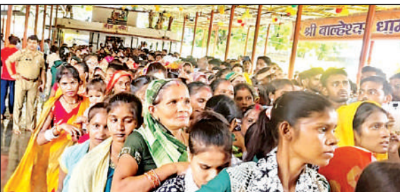
बाबा बाल्देश्वर नाथ मंदिर में भोले बाबा के दर्शन के लिए लाइन में लगे श्रद्धालु।