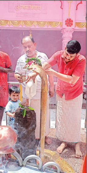
बाबा तपेश्वर नाथ धाम पर भोले का जलाभिषेक करते श्रद्धालु।

गांव-गांव में श्रद्धालुओं ने जगह-जगह पंडाल लगाकर कांवड़ियों का किया स्वागत, चाय-नाश्ता, भोजन तथा विश्राम की उत्तम व्यवस्था