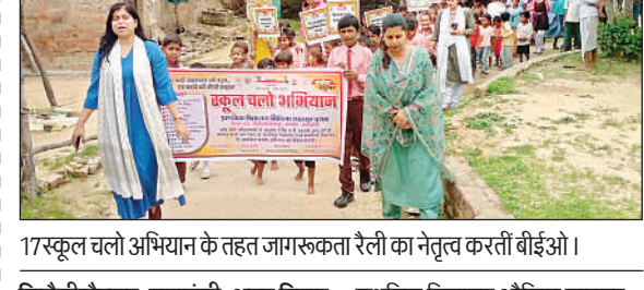
17स्कूल चलो अभियान के तहत जागरूकता रैली का नेतृत्व करतीं बीईओ।