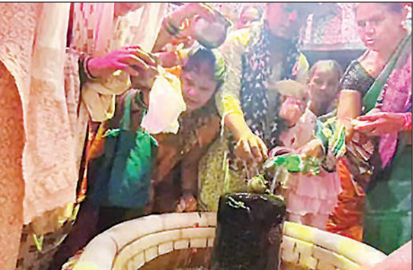
शिवालय में जलाभिषेक करते श्रद्धालु।