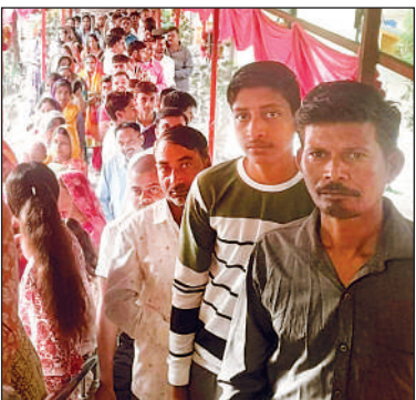
बांगरमऊ में शिव मंदिर के बाहर लगी भक्तों की लाइन।