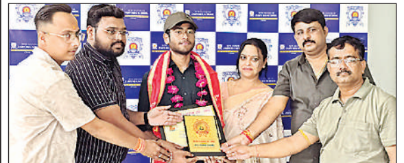
मेधावी छात्र को सम्मानित करते फाउंडेशन के पदाधिकारी।