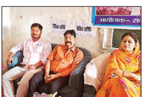
कंपोजिट विद्यालय में आयोजित कार्यक्रम में मौजूद अतिथि।