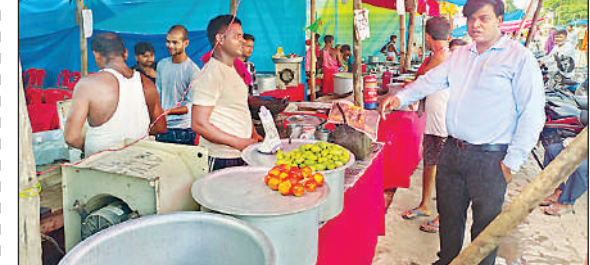
कारवाई करती खाद्य सुरक्षा विभाग की टीम।