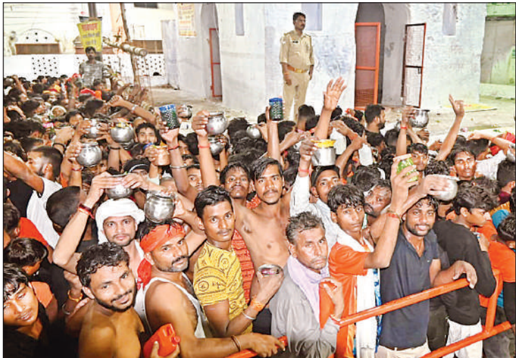
लोधेश्वर महादेवा में जलाभिषेक के लिए उमड़ श्रद्धालु।

ग्राम पंचायत धरौली के मदारपुर स्थित प्राथमिक विद्यालय में 27 छात्र नामांकित हैं। सोमवार को जब शिक्षकों ने छात्रों को पास के पूर्व माध्यमिक विद्यालय मसौली भेजने की तैयारी शुरू की, तो अभिभावकों ने विरोध किया। अभिभावकों ने स्कूल के बाहर प्रदर्शन करते हुए नारेबाजी की और कहा कि वे अपने छोटे बच्चों को 500 मीटर दूर के विद्यालय में