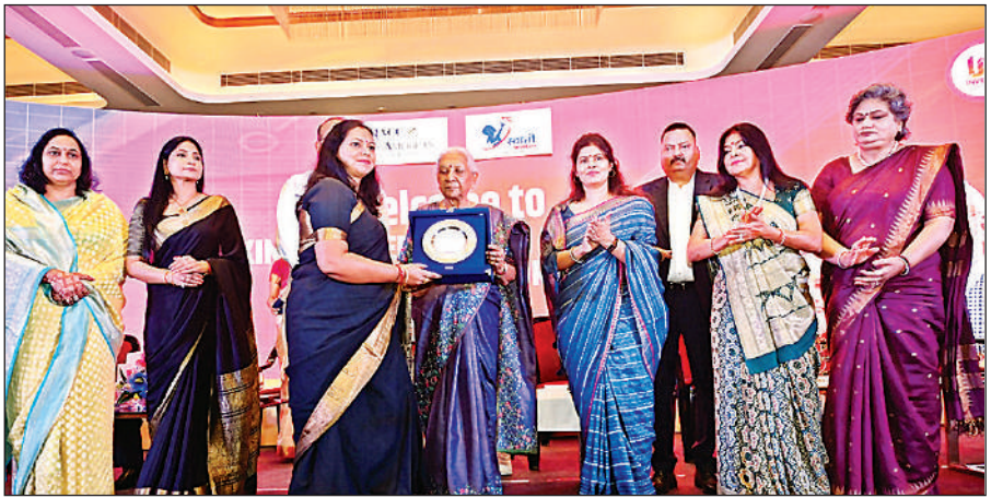
उत्कृष्ट कार्य करने वाली महिला को सम्मानित करती राज्यपाल आनंदी बेन पटेल।

किए जाएं, तो ग्रामीण क्षेत्रों की उन महिलाओं को भी सम्मानित किया जाए जो सीमित संसाधनों के बावजूद अपने परिश्रम, साहस और नवाचार से समाज में परिवर्तन ला