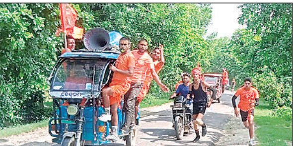
कांवड़ यात्रा निकालते श्रद्धालु।