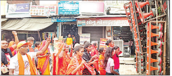
सलोन में निकाली गई पदयात्रा में शामिल शिवभक्त।