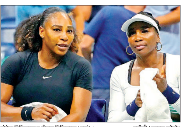
सेरेना विलियम्स व वीनस विलियम्स (दाएं)।

हमने शुरू से काफी कुछ साथ में किया है और इसलिए कुछ निश्चित तौर पर उसकी कमी खलती है। उन्होंने मुस्कुराते हुए कहा लेकिन अगर वह वापसी करती है तो मुझे पूरा विश्वास है कि वह इस बारे में आप सबकी अवागत कर देगी। सेरेना 43 वर्ष की है और उन्होंने