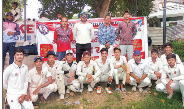
शास्त्री क्लब को हराने के बाद विजयी मुद्रा में बैठी पीकेसी की टीम।