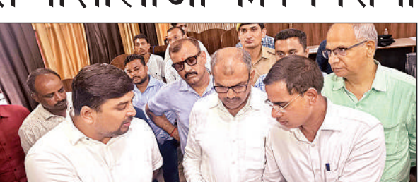
कंट्रोल रूम का अवलोकन करते जिलाधिकारी अभिषेक आनंद।

जगह जाने का डर था, अब अपने स्कूल में ही पढ़ाई कर पाएंगे। शिक्षकों ने भी कोर्ट के फैसले का स्वागत किया। एक शिक्षक ने नाम न छापने के कि शर्त पर कहा