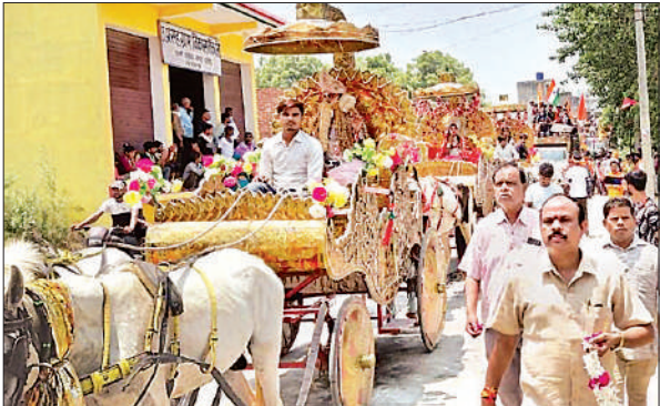
कावड़ यात्रा में रूजी झांकियां। ● अमृत विचार

अमृत विचार । गुरुवार दोपहर नगर में प्रवेश करते वक्त खेड़ा तिराहे पर कांवड़ियों का भव्य स्वागत किया गया। तत्पश्चात कड़ी सुरक्षा व्यवस्था के बीच कावड़ यात्रा नगर के प्रमुख मार्गों से निकाली गई। गाजे-बाजे के साथ निकाली गई इस कावड़ यात्रा में बड़ी संख्या में महिलाएं, पुरुष और बच्चे शामिल हुए। बड़ी संख्या में अलग-अलग जत्थों से आए कांवड़ यात्री खेड़ा तिराहा पर एकत्रित हुए। वहां से संयुक्त रूप से एक कांवड़ यात्रा का आयोजन किया गया। कड़ी सुरक्षा व्यवस्था के बीच झांकियों से