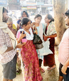
घटना के बाद बिलखते परिजन।

पर पहुंचे परिजन उसे कानपुर के हैलट अस्पताल ले गए। जहां से उसे डॉक्टर ने केजीएमयू के ट्रामा सेंटर रेफर कर दिया। परिजन उसे लखनऊ ले जा रहे थे लेकिन गंगाघाट कोतवाली क्षेत्र के मरहला