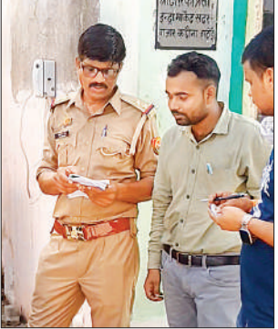
बिजली चोरी के बारे में जानकारी लेती बिजली विभाग की टीम।