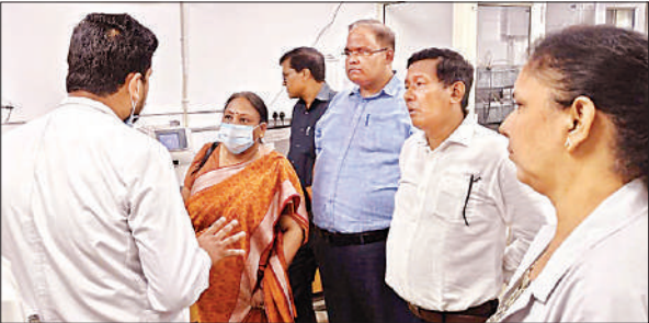
मेडिकल कॉलेज में निरीक्षण करते अधिकारी।