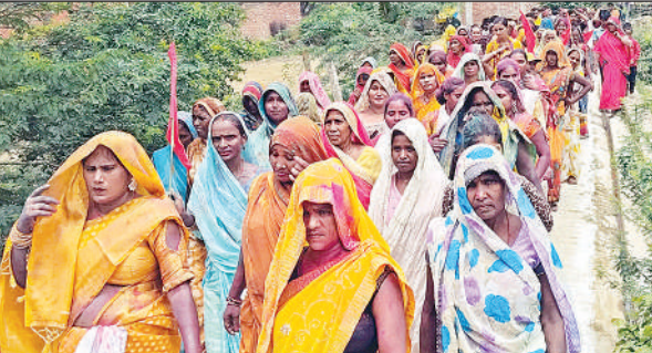
परशदेपुर में निकली शोभायात्रा में शामिल श्रद्धालु।

आपूर्ति का हवाहवाई दावा करती है। धरातल पर किसान व जनता त्राहि-