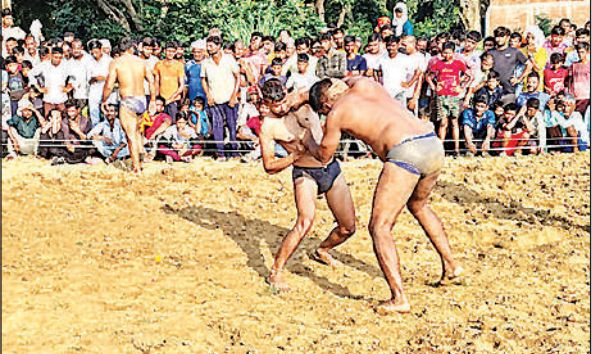
दंगल में दांवपेच दिखाते पहलवान।