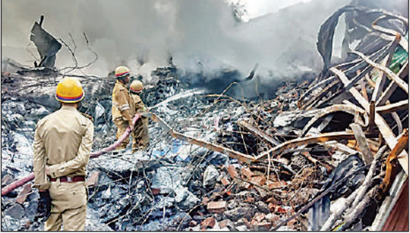
प्लास्टिक फैक्ट्री में लगी आग बुझाते फायरब्रिगेड कर्मचारी।