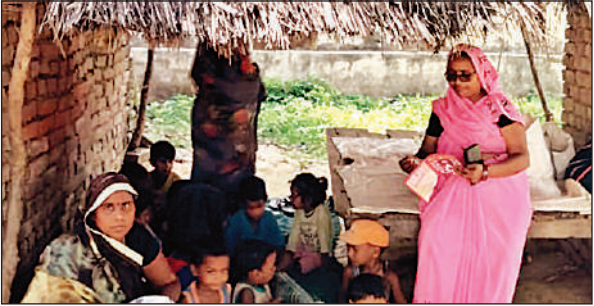
झोपड़ी में संचालित आंगनबाड़ी केंद्र।