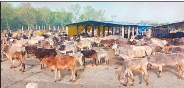
सांडा स्थित गौशाला।

प्रदेश सरकार जहां गौशालाओं को बेहतर चारा, पानी, पोषण युक्त आहार और गर्मियों में पंखों