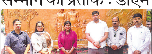
सेल्फी प्वाइंट पर मौजूद जिलाधिकारी, सीडीओ व अन्य।

पूजा-अर्चना के बाद श्रद्धालुओं ने परिसर में आयोजित भंडारे में प्रसाद ग्रहण किया और पूरे वातावरण को भक्ति रस से सराबोर कर दिया।