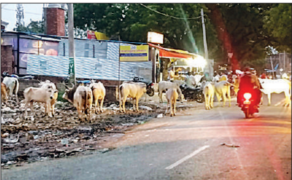
सफीपुर क्षेत्र में सड़क पर घूमता गोवंशियों का झुंड।

स्थानीय लोगों का कहना है कि कस्बे की मुख्य सड़क हो या ग्रामीण क्षेत्र की पगडंडी, हर जगह गोवंशों का जमावड़ा आम हो गया है। इससे आवागमन बाधित होता है और कई बार जाम की स्थिति भी उत्पन्न होती है। वाहन चालकों, खासकर दोपहिया वाहन सवारों के लिए यह