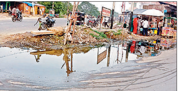
सड़क पर भरा पानी राहगीरों के लिए बन चुका है परेशानी का सबब।