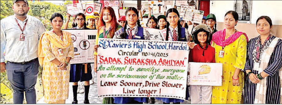
सड़क सुरक्षा अभियान में वाहन चालकों को जागरूक करते छात्र-छात्राएं व शिक्षिकाएं।

इस क्रम में स्कूल के बच्चे भी वाहन चालकों को जागरूक करने के लिए सड़क सुरक्षा अभियान चला रहे हैं। हरदोई के सेंट जेवियर्स हाई स्कूल में बुधवार