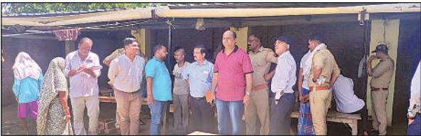
मरीजों से बातचीत करती स्वास्थ्य विभाग की टीम।