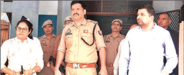
परीक्षा केंद्र का जायजा लेते डीएम-एसपी।

अमृत विचार : आरओ और एआरओ प्रारंभिक परीक्षा (समीक्षा अधिकारी/सहायक समीक्षा अधिकारी) जनपद में 15 केंद्रों पर रविवार को आयोजित होगी। सुबह की पाली में आयोजित होने वाली परीक्षा में 6432 अभ्यर्थी सम्मिलित होंगे। इसको लेकर डीएम-एसपी ने परीक्षा केंद्रों का जायजा लिया। सीसीटीवी का परीक्षा कर स्टेटिक और सेक्टर मजिस्ट्रेट को विशेष निर्देश भी दिए।