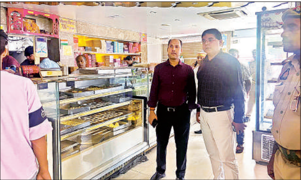
सरस्वती स्वीट्स पर छापेमारी करते एसडीएम व अन्य अधिकारी।