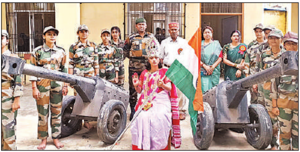
शहीदों की वेशभूषा में स्कूल की छात्रा और विद्यालय परिवार।