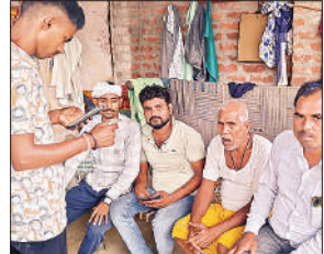
फैमिली आईडी बनाता कर्मचारी।

उन्होंने बताया कि फैमिली आईडी भी आधार कार्ड की तरह 12 अंकों की युनिक होगी, जिससे परिवार की सामाजिक-आर्थिक स्थिति और सरकारी योजनाओं से जुड़ाव की जानकारी सिंगल क्लिक में मिल सकेगी। इस आईडी से पात्रता, लाभ