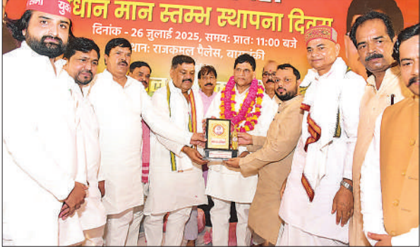
मुख्य अतिथि सांसद लालजी वर्मा का स्वागत करते जिलाध्यक्ष व पूर्व मंत्री।

अमृत विचार : समाजवादी पार्टी के राष्ट्रीय महासचिव व सांसद लालजी वर्मा ने कहा कि अगर लोकतंत्र को जिंदा रखना है तो सामाजिक और आर्थिक असमानता को मिटाकर समतामूलक समाज बनाना होगा। वे नगर के राजकमल पैलेस में शनिवार को आयोजित आरक्षण दिवस एवं संविधान-मानरस्तंभ स्थापना दिवस कार्यक्रम में बोल रहे थे। कार्यक्रम की अध्यक्षता जिलाध्यक्ष हाफिज अयाज अहमद ने की। मुख्य अतिथि के रूप में बोलते हुए लालजी वर्मा ने कहा कि 26 जुलाई 1902 को छत्रपति शाहूजी महाराज ने कोल्हापुर में 50 फीसदी आरक्षण देने केकर पिछड़े वर्ग को मुख्यधारा से जोड़ने की