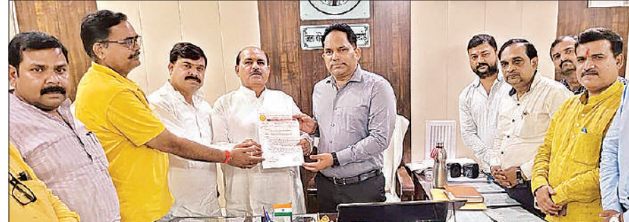
बिजली कटौती व गर्मी के चलते विद्यालयों के समय में परिवर्तन के लिए बीएसए को ज्ञापन देते शिक्षक व संघ पदाधिकारी ।

अमृत विचार । जिला मुख्यालय स्थित गुरुगुज्जा और सांडी रोड पर स्थापित उपकेंद्रों से विद्युत आपूर्ति व्यवस्था सुधर नहीं रही है। क्षेत्र के उपभोक्ताओं को राहत देने के लिए बिजली विभाग द्वारा 33 केवी की नई लाइन बनाई गई है। लेकिन लाइन इतनी घटिया है कि लोड पड़ते ही दग जाती है। 75 लाख रुपये की लागत से बनी इस लाइन के बार-बार खराब होने से गुरुगुज्जा व सांडी उपकेंद्र उपभोक्ताओं को नियमित बिजली नहीं दे पा रहे हैं। शुक्रवार की रात दोनों उपकेंद्रों से विद्युत आपूर्ति बाधित रहने पर गर्मी से परेशान उपभोक्ताओं ने पावर हाउस पर हमला बोल दिया था। आक्रोशित उपभोक्ताओं को देख ड्यूटी कर रहे कर्मचारी भाग खड़े हुए। सूचना मिलने पर पहुंची पुलिस ने जल्द ही व्यवस्था सही कराने की बात कही। लंबे समय तक बिजली न आने से दो दर्जन से अधिक मोहल्लों में पानी व बिजली की गंभीर समस्या उत्पन्न हो गई। लोगों के इनवर्टर भी काम करना बंद कर देते हैं। जिले के जनप्रतिनिधि व उच्चाधिकारी