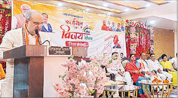
संगोष्ठी को संबोधित करते भाजपा के प्रदेश अध्यक्ष भूपेंद्र सिंह चौधरी।

अमृत विचार : भाजपा के प्रदेश अध्यक्ष भूपेंद्र सिंह चौधरी ने कहा कि कारगिल विजय दिवस भारत के शौर्य, गर्व, स्वाभिमान और बलिदान का पर्व है। शनिवार को कुरौली स्थित एक निजी लॉन में आयोजित संगोष्ठी को संबोधित करते हुए उन्होंने कहा कि यह दिवस 140 करोड़ देशवासियों के गौरव की प्रतीक विरासत है। उन्होंने कहा कि कारगिल में भारतीय सेना ने बेहद कठिन हालात में दुश्मन को पराजित कर विजय हासिल की, जो देश की अस्मिता की रक्षा का