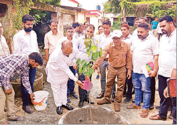
ब्लॉक परिसर में पौधा रोपित करते पिछड़ा वर्ग आयोग के सदस्य। ● अमृत विचार

इस दौरान उन्होंने सरकार की जनकल्याणकारी योजनाओं के क्रियान्वयन की स्थिति का जायजा लिया और स्पष्ट कहा कि शासन की मंशा के अनुरूप प्रत्येक पात्र व्यक्ति को योजनाओं का लाभ मिलना चाहिए, कोई भी वंचित न रह जाए। निरीक्षण के दौरान उन्होंने सीएचसी रामनगर में ओपीडी, एक्स-रे कक्ष, इमरजेंसी,