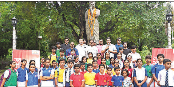
कारगिल युद्ध में शहीद हुए जवानों को श्रद्धांजलि अर्पित करते महापौर, डीएम।

इस अवसर पर उपस्थित छात्र-छात्राओं व बड़ी संख्या में लोगों ने बैण्ड की धुन पर वंदे मातरम की