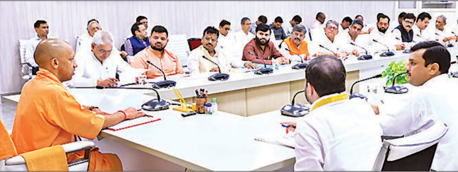
अयोध्या और देवीपाटन मंडल के जनप्रतिनिधियों व अधिकारियों के साथ बैठक करते मुख्यमंत्री योगी।

बल्कि उन योजनाओं को धरातल पर उतारने और जनता तक लाभ पहुंचाने में भी विश्वास करती है। इस लक्ष्य की पूर्ति के लिए शासन और जनप्रतिनिधियों के बीच सशक्त संवाद आवश्यक है। कहा कि सरकार नगर निकायों को अलग से वित्तीय संसाधन उपलब्ध कराती है और सीएम ग्रिड योजना के माध्यम से नगरों के समग्र विकास को नई दिशा दी जा रही है। निर्देश दिए कि नगर निगम एवं नगर निकाय अपने-अपने क्षेत्र में संचालित विकास योजनाओं की समीक्षा करते समय स्थानीय जनप्रतिनिधियों को अवश्य शामिल करें।