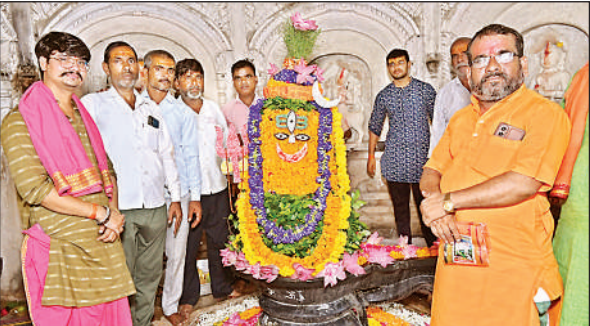
रुद्राभिषेक के दौरान मौजूद भक्त।