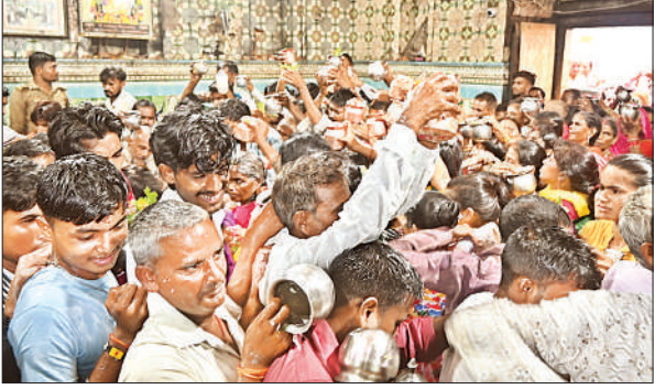
मंदिर के गर्भगृह में जलाभिषेक करते श्रद्धालु।

शहर में नागेश्वर नाथ मंदिर में भोर पहर में ही श्रद्धालु परिवार के साथ आना शुरू हो गए थे। सिद्धेश्वर महादेव, चंदेश्वर महादेव व धनोखर मंदिर और लखपेड़ाबाग शिव मंदिर समेत अन्य शिवालयों में भी शिव भक्तों की लंबी कतार लगी रही