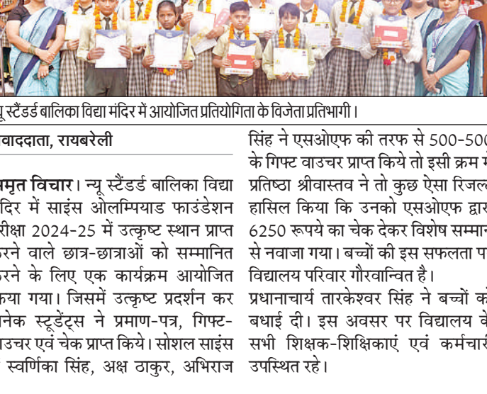
न्यू स्टैंडर्ड बालिका विद्या मंदिर में आयोजित प्रतियोगिता के विजेता प्रतिभागी।