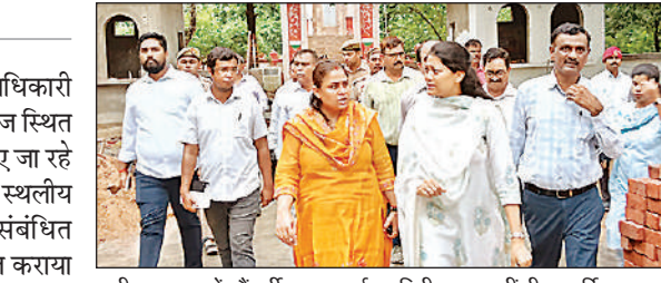
शहीद स्मारक में सौंदर्यीकरण कार्य का निरीक्षण करती डीएम हर्षिता माथुर, साथ में एडीएम अमृता सिंह व अन्य।

अमृत विचार। जिलाधिकारी हर्षिता माथुर ने मुंशीगंज स्थित शहीद स्मारक में कराए जा रहे सौंदर्यीकरण कार्यों का स्थलीय निरीक्षण किया। संबंधित अधिकारियों ने अवगत कराया गया है कि निर्माण कार्य लगभग पूर्ण हो चुका है। कुछ कार्य अवशेष हैं, जिन्हें शीघ्र पूर्ण कर लिया जाएगा। जिलाधिकारी ने निर्देश दिया कि निर्माण कार्यों में गुणवत्ता का विशेष ध्यान रखा जाए। उन्होंने निर्देशित किया कि शहीद स्मारक मुख्य स्थल पर सुरक्षा के दृष्टिगत सीढ़ियों पर रेलिंग अवश्य लगावा ली जाए। रिक्त स्थानों दौरान जा भी पेड़ पौधे पहले निर्देश दिए। नगर पालिका को