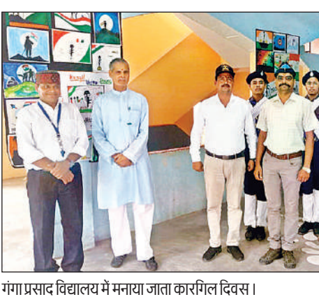
गंगा प्रसाद विद्यालय में मनाया जाता कारगिल दिवस।