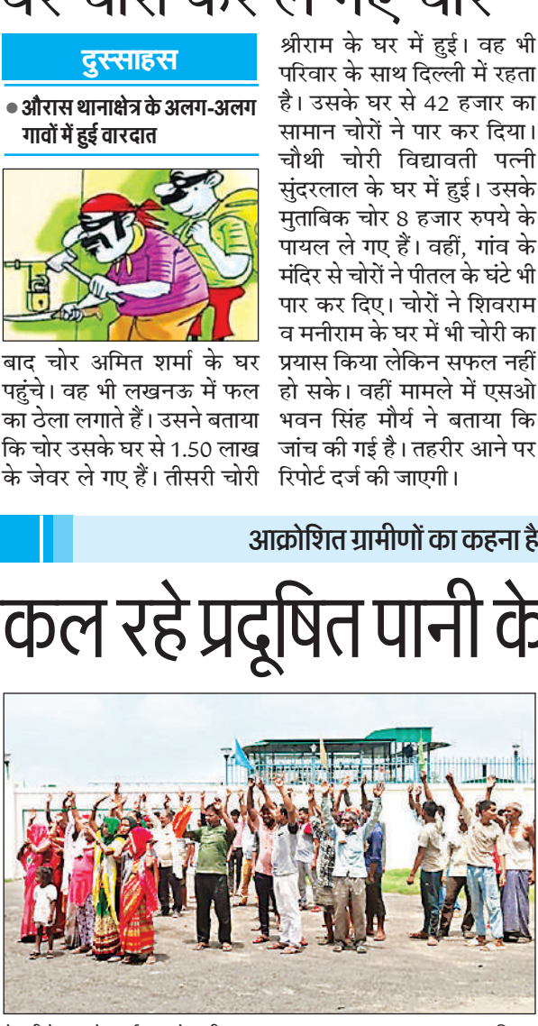
फैक्ट्री के सामने प्रदर्शन करते ग्रामीण।