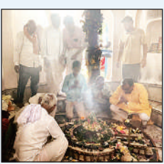
सावन के सोमवार को भगवान शिव की पूजा अर्चना करते भक्त।

सरेनी, रायबरेली, अमृत विचार। श्रावण मास के तीसरे सोमवार को क्षेत्र के शिवालियों में श्रद्धा का सैलाब उमड़ पड़ा। क्षेत्र के प्रमुख श्री सहोलेश्वर, श्री झारखंडेश्वर, श्री मुंडमालेश्वर व श्री कोटेश्वर महादेव मंदिर सहित अन्य शिव मंदिरों में भोलेनाथ के दर्शन के लिए भक्तों का आना भोर पहर से शुरू हो गया था। वहीं मंदिर परिसर में भंडारे का आयोजन भी किया गया। सभी ने भगवान भोलेनाथ की पूजा अर्चना कर मनोितियां मांगी। कहीं भजन संख्या तो किसी देव स्थान पर श्रीरामचरित मानस का अखंड पाठ चलता रहा। भक्तों की भीड़ को देखते हुए पुलिस-प्रशासन अलर्ट मोड़ पर नजर आया। कस्बा सहित ग्रामीण क्षेत्रों में भक्त भगवान भोलेनाथ की भक्ति में सराबोर दिखे।