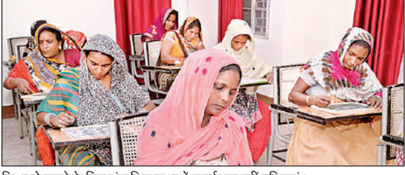
शिक्षा से जुड़ने के लिए संचालित कक्षा में पढ़ाई कर रही महिलाएं।