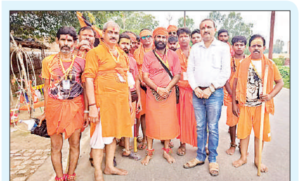
परियर से बुद्धेश्वर महादेव जाती वैदेही सेना के कांवड़ियों की टोली।

से रेलवे क्रासिंग के आसपास लंबा जाम लग गया। राहगीरों और वाहन चालकों को कई घंटे तक जाम में फंसे रहना पड़ा। रेलवे सूत्रों के अनुसार, गेट न बंद होने के कारण अप व डाउन की सात ट्रेनें 10 से 11 मिनट तक खड़ी रही, जिससे रेल संचालन प्रभावित हुआ। वहीं दोपहर तक बार-बार जाम की स्थिति बनी रही।