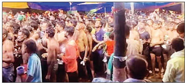
सोमवार को तड़के से लगी आस्तीक देव मंदिर में श्रद्धालुओं की कतारें।

संवाददाता, हरचंदपुर, रायबरेली, अमृत विचार: नागपंचमी से एक दिन पहले सोमवार को आस्तिक देव मंदिर लालपुर खास में तड़के से श्रद्धालुओं का सैलाब उमड़ पड़ा। शाम तक करीब दो लाख लोगों ने सई नदी में स्नान किया। इसके बाद भीगे वस्त्रों में जलाभिषेक व दर्शन पूजन किया। सुरक्षा को लेकर भारी संख्या में पुलिस कर्मी जगह-जगह तैनात रहे। हाईवे से मंदिर जाने वाले मार्ग पर वाहनों का आवागमन रोका गया था। रायबरेली के हरचंदपुर विकासखंड देव मंदिर में एक दिन पहले से ही श्रद्धालुओं के पहुंचने का सिलसिला शुरू हो गया। यहां पर नागपंचमी के एक दिन पहले पूजन अर्चन के लिए आसपास के कई जनपदों से श्रद्धालु आते हैं। भीड़ का अंदाजा इसी से लगाया जा सकता है कि मंदिर से