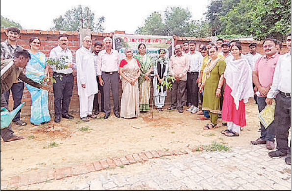
पौधरोपण करते संस्थापक, प्रबंधक व अन्य लोग।

कर्मियों का 18 माह से वेतन भुगतान रुका हुआ है, जिसे शासन स्तर पर अगस्त 2025 से पुनः