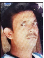
● अमृत विचार