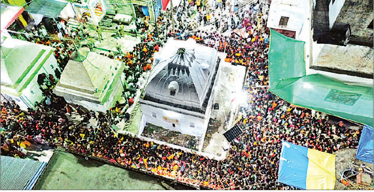
सावन के तीसरे सोमवार के अवसर पर दूरदराज से आये श्रद्धालुओं से पटा लोधेश्वर महादेवा मंदिर परिसर।