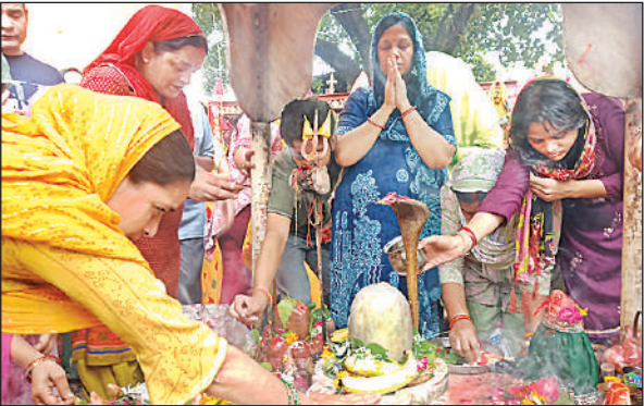
सावन के तीसरे सोमवार पर मढ़ी देवी मंदिर में पूजा-अर्चना करती महिलाएं।

बाबा सोलेलेश्वर धाम: भंडारे में श्रद्धालुओं ने छका प्रसाद : लालगंज, रायबरेली, अमृत विचार। सोहलेश्वर धाम में रघुवीर रोलिंग मिल और