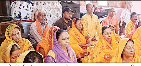
गायत्री शक्तिपीठ में जाप-अनुष्ठान करते साधक।