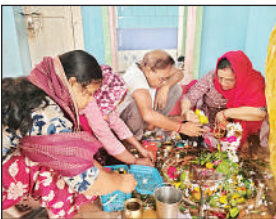
झारखंडेश्वर मंदिर सलोन मटका में जलाभिषेक करते भक्त।

सलोन, रायबरेली, अमृत विचार। क्षेत्र के शिवालियों में भोर पहर से देर रात तक हर-हर महादेव, जय शिव ओमकारा की गूंज रही। किसी ने जलाभिषेक तो किसी ने दुग्धाभिषेक कर भोले बाबा का पूजन किया। भक्तों ने गंगाजल से अभिषेक कर शिव को पुष्प, बेलपत्र, आक, धतूरा, भांग आदि अर्पित किए। बाबा झारखंडेश्वर मंदिर मटका में तड़के वार बजे कपाट खुलते ही श्रद्धालुओं की कतारें लग गईं।