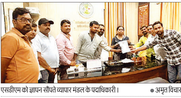
एसडीएम को ज्ञापन सौंपते व्यापार मंडल के पदाधिकारी।