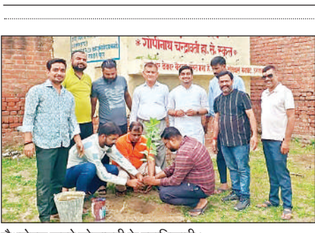
पौधरोपण करते सोसाइटी के पदाधिकारी।