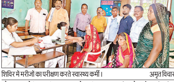
शिविर में मरीजों का परीक्षण करते स्वास्थ्य कर्मी।