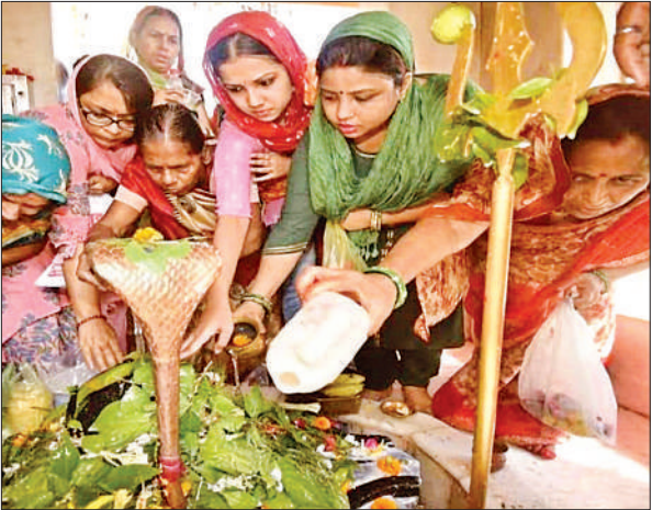
शिव मंदिर में पूजन करती महिलाएं।

अमृत विचार । पूरे जिले में सावन के तीसरे सोमवार पर शिव भक्तों का उत्साह देखने को मिला। सुबह होते ही पूरा वातावरण शिव के जयघोष से गुंजायमान हो गया। श्रद्धालुओं ने शिवालयों में जाकर जलाभिषेक, रुद्राभिषेक, दुग्धाभिषेक कर पूजन अर्चन किए। पूरे दिन कांवड़िये शिव मंदिरों में पहुंच कर कांवड़ चढ़ाते रहे। नगर के आनंद टाकीज स्थित बाबा विश्वनाथ मंदिर, राम जानकी मंदिर, नुमाइश चौराहा स्थित शिव मंदिर, तुरंत नाथ मंदिर, बैटगंज स्थित सर्वेश्वर नाथ मंदिर सहित जिले के सुप्रसिद्ध शिव संकट हरण सकाहा, बिलग्राम स्थित मंशानाथ मंदिर, बिबियापुर स्थित बाबा सिद्धेश्वर नाथ महादेव मंदिर सहित विभिन्न शिव मंदिरों में सुबह से ही भक्तों का पहुंचना शुरू हो गया। शिव के दर्शन के अभिषेक करने के लिए भक्तों को घंटों लाइन में लगना पड़ा। पुलिस प्रशासन को भी मंदिरों में भीड़ नियंत्रण करने के लिए काफी मशकत करनी पड़ी। पूरे दिन कांवड़ियों का जत्था चलता रहा। मंदिरों में देर रात तक श्रद्धालुओं का आना जाना लगा रहा।