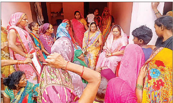
प्रशांत के परिवार को सांत्वनी देती जिला पंचायत अध्यक्ष।

दिनों बाद ही रक्षाबंधन का त्योहार आने वाला है, भाई के न रहने पर अब वह किसे राखी बांधेंगी, यही सोचकर बहनें बेहाल हुई जा रही हैं। दोनों ही परिवार उस घड़ी को कोस रहे हैं, जब उनके प्रिय रात भर जाग कर दर्शन को निकले थे।