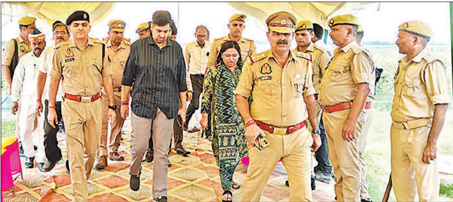
राजघाट पर व्यवस्थाओं का जायजा लेते डीएम-एसपी।