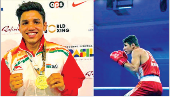
अंतर्राष्ट्रीय मुक्केबाज हितेश गुलिया।