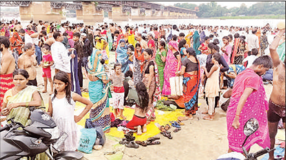
शुक्लागंज गंगातट पर तीसरे सोमवार को गंगा स्नान करते श्रद्धालु।

शुक्लागंज (उन्नाव): सावन के तीसरे सोमवार को श्रद्धालुओं की भारी भीड़ के चलते सोमवार सुबह से ही शुक्लागंज के नवीन पुल मार्ग पर जाम की स्थिति बनी रही। बालूघाट मोड़ से लेकर नवीन पुल तक वाहनों की लंबी कतारें रेंगती नजर आईं। सुबह के समय मौजूद यातायात पुलिस और स्थानीय पुलिस ने काफी प्रयास कर आड़े-तिरछे खड़े वाहनों को हटवाकर यातायात को नियंत्रित रखा। लेकिन दोपहर करीब 12:30 बजे जैसे ही यातायात पुलिस मौके से हटी, पुनः जाम लग गया। कुछ ही देर में मार्ग पूरी तरह अवरुद्ध हो गया। जाम के कारण स्कूली छुट्टी के बाद लौट रहे छात्र और राहगीर घंटों फंसे रहे। राहगीरों को तेज धूप में काफी परेशानी का सामना करना पड़ा। जाम की सूचना मिलते ही पुलिस पुनः मौके पर पहुंची और काफी मशक्कत के बाद यातायात को सामान्य कराया। स्थानीय लोगों का कहना है कि सावन के प्रत्येक सोमवार को भारी भीड़ रहती है, ऐसे में पुलिस की सतत तैनाती जरूरी है।