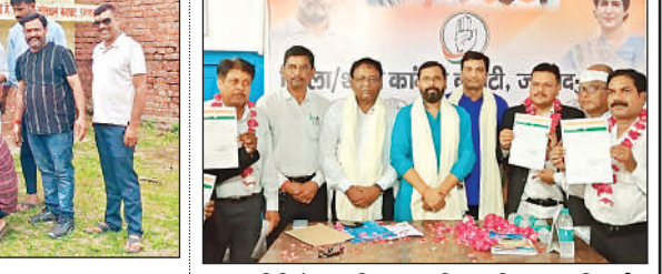
मुख्य अतिथि के साथ नियुक्त पत्र लिए नवनियुक्त पदाधिकारी।