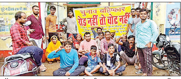
ब्लॉक मुख्यालय पर धरना-प्रदर्शन करते ग्रामीण।

अमृत विचार। सैदपुर मजरे नुवांवा गांव के ग्रामीणों ने मांग निर्माण को लेकर सोमवार को स्थानीय खंड कार्यालय का घेराव कर धरना-प्रदर्शन व नारेबाजी की। बीडीओ द्वारा स्थलीय निरीक्षण कर एक महीने में रास्ता बनवाने के आश्वासन पर ग्रामीणों ने प्रदर्शन समाप्त किया। सैदपुर के ग्रामीण कई माह से रास्ते के निर्माण को लेकर धरना-प्रदर्शन तथा मतदान का बहिष्कार करने की चेतावनी दे रहे थे, लेकिन अधिकारियों के कानों में जूं नहीं रेंग रही थी। सोमवार को मूसलाधार बारिश होने पर रास्ते में जलभराव हो गया। आवागमन में काफी दिक्कत होने पर ग्रामीणों का धैर्य जवाब दे गया। ग्रामीण इकट्ठे होकर ब्लॉक परिसर पहुंचे वहां पर गेट पर बैनर बांधकर धरना प्रदर्शन और