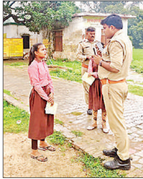
छात्रा से पूछताछ करता पुलिसकर्मी।