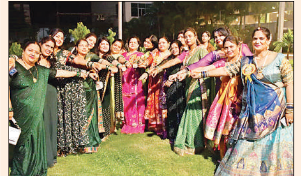
राधा-कृष्ण नृत्य में प्रतिभाग करती महिलाएं।