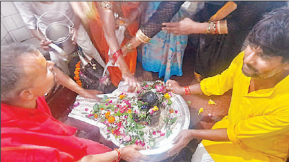
बांगरमऊ में भगवान भोलेनाथ का पूजन करते भक्त।