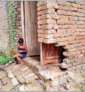
चोरों ने लगाई गई नकब।