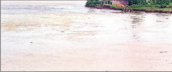
बढ़ा जलस्तर कटान करती घाघरा नदी।

उठी नाव बढ़ाए जाने की मांग स्वामी दयाल और फौजदार का कहना है कि दस हजार से अधिक आबादी वाले इलाकों में चंद नांव है, वो खासी खस्ताहाल। यदि एक छोर से कोई परिवार दूसरे छोर जाता है तो नाव को लौटने में काफी समय बीत