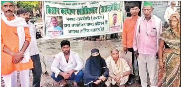
निर्माण के विरोध में धरने पर बैठे परिजन।