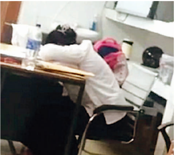
मेडिकल कॉलेज के आईसीयू में ड्यूटी के दौरान सोती कर्मचारी ।