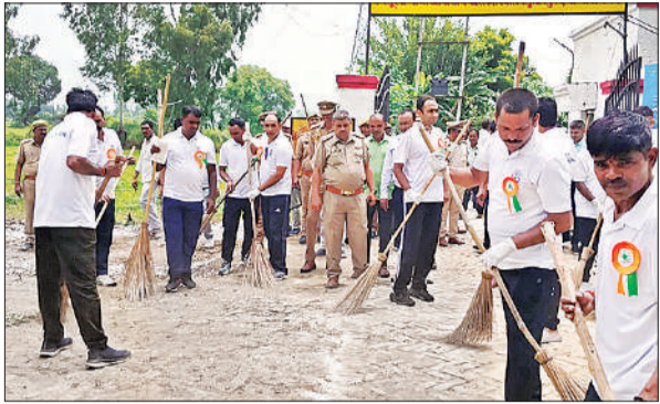
स्वच्छता अभियान चलाते राजभवन कर्मचारी।