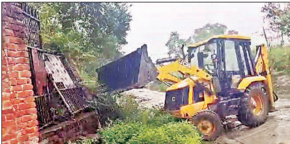
अहमदपुर नजूल राजस्व ग्राम में कब्जा हटता बुलडोजर।