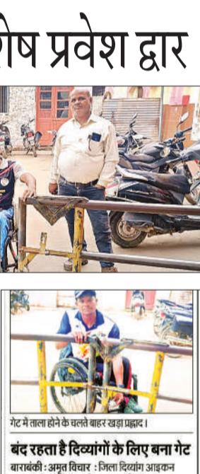
26 जुलाई के अंक में प्रकाशित सामग्य।