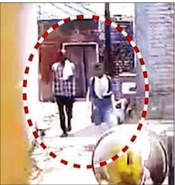
स्कूल जाते समय छात्रा का पीछा करते हुए सीसीटीवी में कैद आरोपी अधेड़ ।

सोशल मीडिया पर वायरल हो रहे वीडियो में अधेड़ स्कूल जाते समय छात्रा का पीछा करते हुए दिखा है। एक अन्य फुटेज में छात्रा से छेड़छाड़ करते हुए देखा गया। फुटेज के मुताबिक अधेड़ लगातार तीन दिनों से छात्रा का पीछा कर रहा था और चौथे दिन उसने छेड़छाड़ की। छात्रा के घर वालों ने फुटेज से