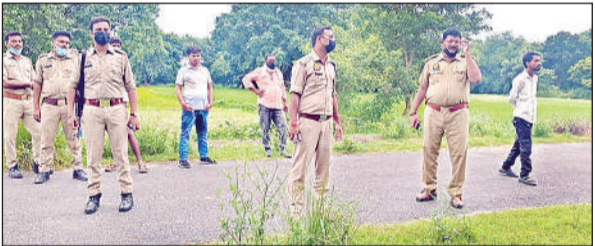
घटनास्थल का निरीक्षण करते सीओ व कोतवाल।