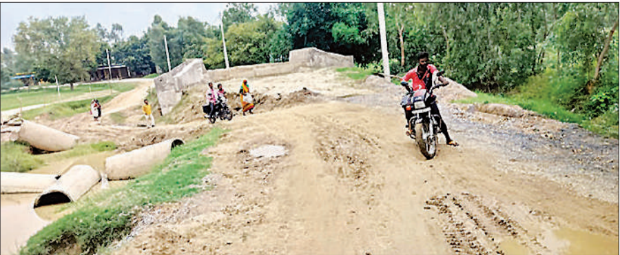
कच्चे मार्ग से निकलते राहगीर ।

बताते हैं कि ब्लॉक के रौरा चौराहे से भानापुर तक बना पीडब्ल्यूडी मार्ग पिछले साल आई