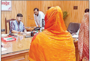
पीड़ितों की शिकायतें सुने डीएम अनुनय झा।

हरदोई, अमृत विचार। कलेक्ट्रेट कक्ष में जन सुनवाई के दौरान जिलाधिकारी अनुनय झा ने बड़ी संख्या में लोगों की शिकायतों को सुना। आज जन सुनवाई में कुल 120 शिकायतें प्राप्त हुईं जिनके त्वरित निस्तारण के निर्देश जिलाधिकारी ने सम्बंधित अधिकारियों को दिए। मौके पर पात्रों का वृद्धावस्था पेंशन, निराश्रित महिला पेंशन व दिव्यांग पेंशन का पंजीकरण कराया गया। 70 वर्ष से अधिक आयु के बुजुर्गों के मौके पर ही आयुष्मान कार्ड बनवाये गए। बुधवार को कुल दो बुजुर्गों के आयुष्मान कार्ड बनवाये गए। इस प्रकार अब तक जिलाधिकारी अनुनय झा की जन