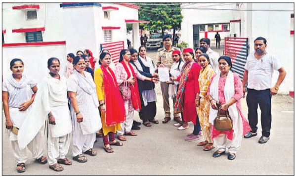
सीओ को ज्ञापन सौंपती सभा महिला सभा की पदाधिकारी।