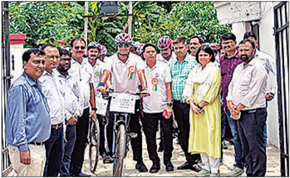
देवा के मुजीबपुर पहुंची राजभवन की साइकिल रैली।