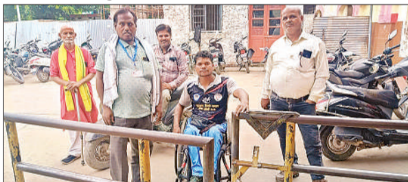
दिव्यांगों के लिये खुला स्टेशन का गेट।