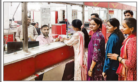
रक्षाबंधन के चलते बुकिंग काउंटर पर लगी महिलाओं की लाइन।