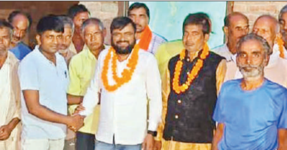
मंडल मंत्री का स्वागत करते समर्थक।