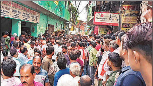
व्यापारी पुत्र की मौत के बाद घर पर जुटी लोगों की भीड़।