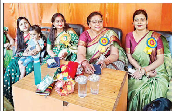
शिशु मंदिर में आयोजित हरियाली तीज के कार्यक्रम में शामिल महिलाएं।