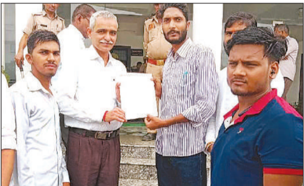
अतिरिक्त मजिस्ट्रेट को ज्ञापन देते पदाधिकारी।