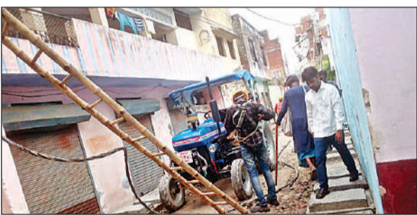
आदर्श नगर में एबीसी लाइन डालते विद्युत विभाग कर्मचारी।