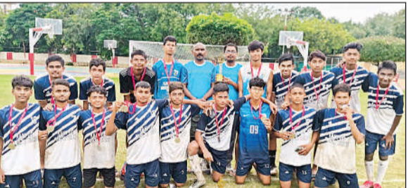
ट्रॉफी के साथ उप विजेता टीम।

लीग मैच सबसे पहले नार्थ जेन के अंतर्गत कानपुर व लखनऊ के बीच हुआ। जिसमें कानपुर की टीम ने लखनऊ को 2-1 से हराया। नार्थ जेन गोरखपुर के साथ खेला जाने वाला मैच 0-0 के बराबर ड्रा रहा। इसके बाद सेमीफाइनल मैच कानपुर