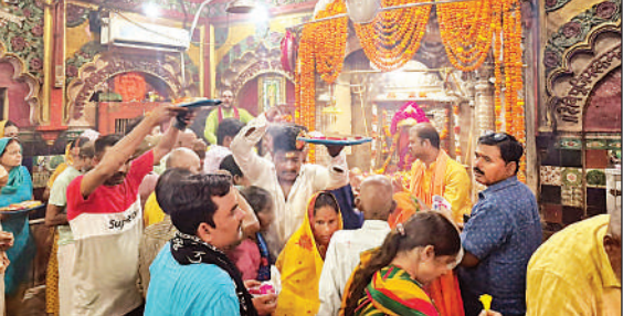
नैमिषारण्य स्थित मंदिर में पूजन-अर्चन करते श्रद्धालु।