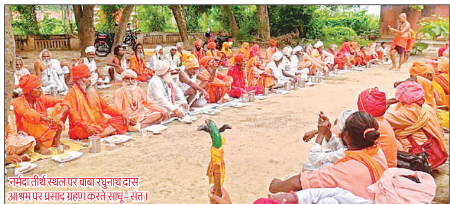
नर्मदा तीर्थ स्थल पर बाबा रघुनाथ दास आश्रम पर प्रसाद ग्रहण करते साधू-संत ।