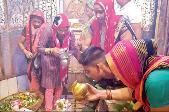
नगर के श्याम नाथ बाबा मंदिर में जलामिषेक कर पूजन-अर्चन करते श्रद्धालु।