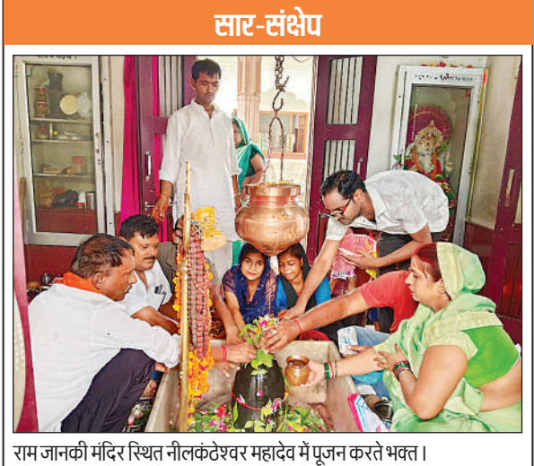
राम जानकी मंदिर स्थित नीलकंठेश्वर महादेव में पूजन करते भक्त ।