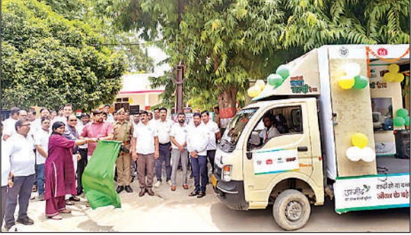
जागरूकता वैन को हरी झण्डी दिखाते डीएम और सीडीओ।