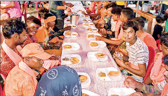
जिले के पिसावां क्षेत्र में कांवड़ियों को भोजन कराते श्रद्धालु।