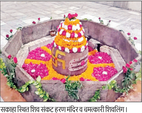
सकाहा स्थित शिव संकट हरण मंदिर व चमत्कारी शिवलिंग ।