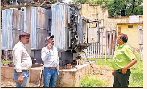
उपकेन्द्र में होता मरम्मत का कार्य।

गई, जिससे हर बार बारिश में यही हाल होता है।