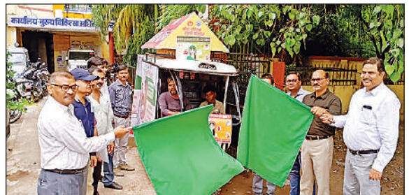
वाहन को झंडी दिखाते सीएमओ व एसीएमओ।

विश्व जनसंख्या दिवस पर रवाना किया गया जागरूकता वाहन