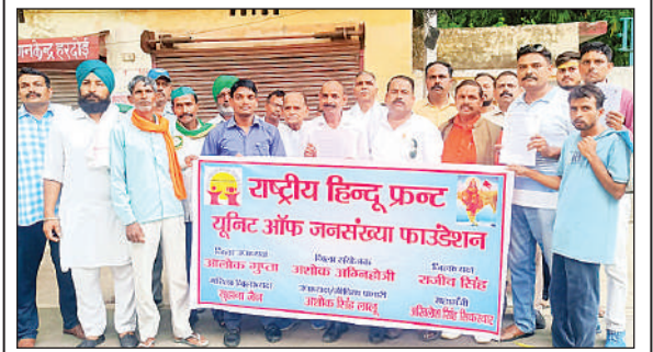
कलेक्ट्रेट में विरोध प्रदर्शन करते राष्ट्रीय हिंदू फ्रंट के पदाधिकारी ।