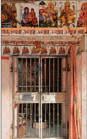
परशदेपुर के इसी शिव मंदिर में मूर्ति स्थापना को लेकर हुआ था दंगा।