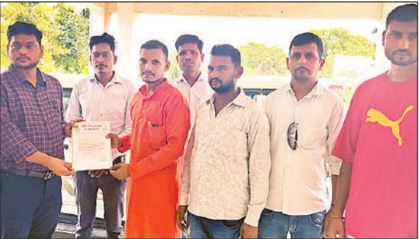
मीट की दुकानों को बंद करने की मांग को लेकर ज्ञापन सौंपते हिंदू शेर सेना के सदस्य।