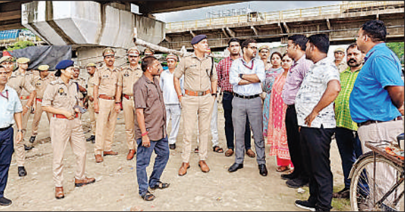
चंदन घाट का निरीक्षण करते डीएम, एसपी व अन्य।

निरीक्षण के दौरान अधिकारियों ने घाट क्षेत्र में सुरक्षा, साफ-सफाई, यातायात और पेयजल