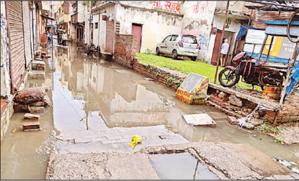
पोनी रोड की गली में बारिश से हुआ जलभराव।

सुबह हल्की बारिश के बाद आठ बजे तेज बारिश हुई, जिससे सड़कों पर पानी भरने लगा। कुछ देर रुकने के बाद फिर दोपहर व शाम को बारिश ने दस्तक दी। बारिश के बीच दोपहिया वाहन सवार लोग भीगते