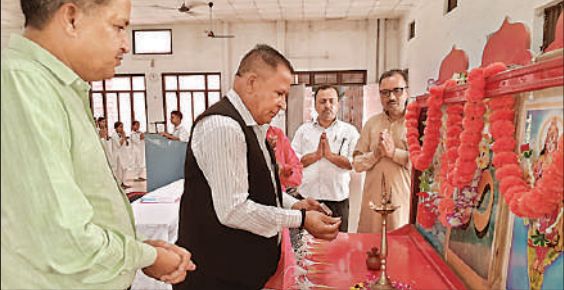
शपथ ग्रहण समारोह के दौरान पुष्पांजलि अर्पित करते अतिथि।