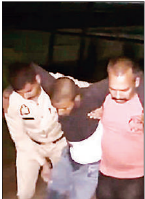
मुठभेड़ में घायल बदमाश को लेकर जाते पुलिस कर्मी।