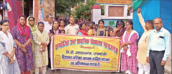
जागरूकता रैली निकालते कम्पोजिट कन्वा उच्च प्राथमिक विद्यालय के बच्चे।