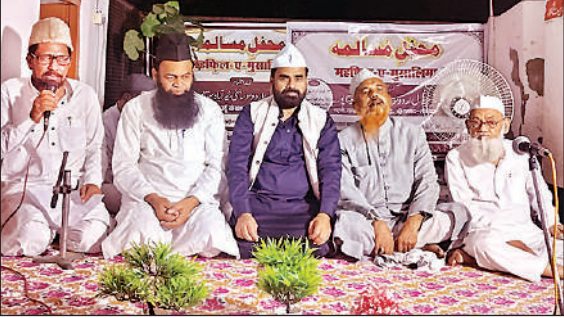
कार्यक्रम के दौरान उपस्थित शायर।