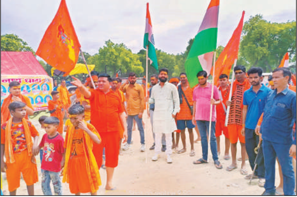
जिले के कमलापुर इलाके से रवाना होते कांवड़िये।