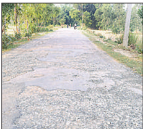
बदहाल भवानीगढ़-सूरजपुर सम्पर्क मार्ग।

अमृत विचार। जिम्मेदारों की लापरवाही का खामियाजा आम जनमानस को भुगतना पड़ रहा है। जिले के शिवगढ़ क्षेत्र अन्तर्गत भवानीगढ़ – सूरजपुर सम्पर्क मार्ग के नवीनीकरण की टेंडर प्रक्रिया पूरी होने के साढ़े पांच महीने बाद भी सड़क की हालत जस की तस बनी हुई। ठेकेदार की मनमानी और ऊंची पहुंच के आगे पीएमजीएसवाई विभाग के अधिकारी नतमस्तक हैं। सड़क का नवीनीकरण कब होगा कब नहीं होगा इस बात को स्पष्ट बताने से जिम्मेदार अधिकारी कतार रहे हैं। इससे लोगों की मुश्किलें बढ़ती जा रही हैं।