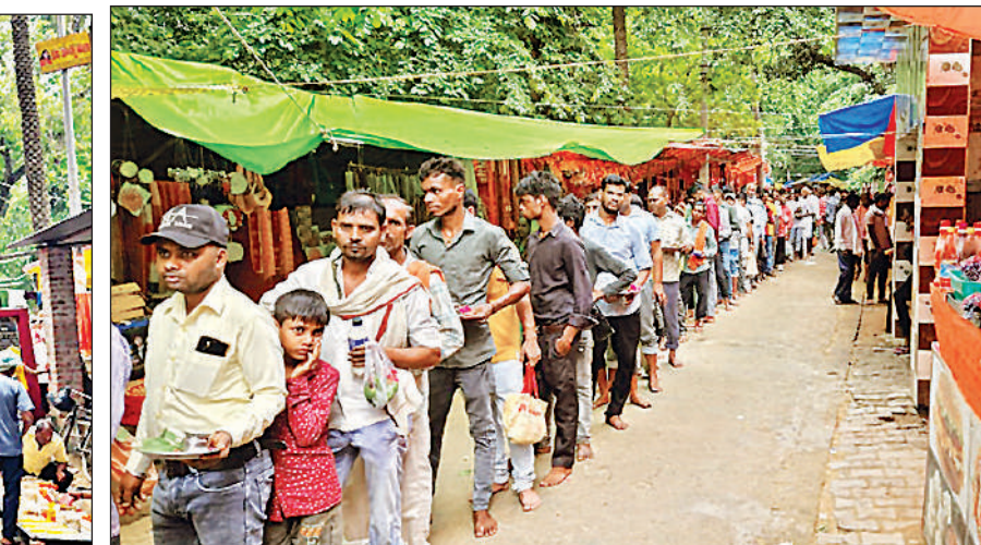
सावन माह के पहले सोमवार को सिद्धपीठ बाबा देव देवेश्वर धाम के बाहर मौजूद मौजूद भक्त।

जलाभिषेक के लिए कतार में लगकर अपनी बारी का इंतजार करते श्रद्धालु।