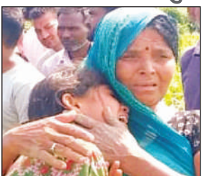
रोतेबिलखते मृतक के परिजन,