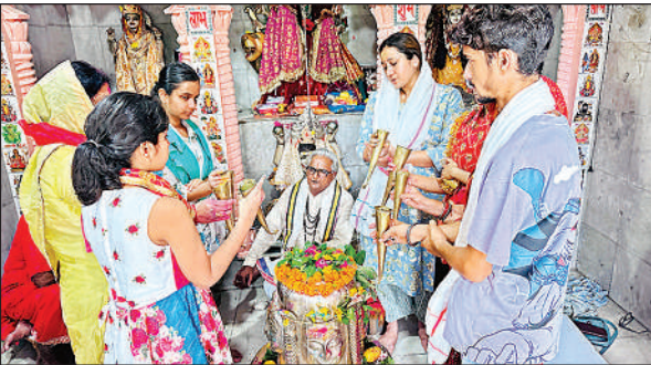
नैमिषारण्य में भगवान शिव का रुद्राभिषेक करते श्रद्धालु।