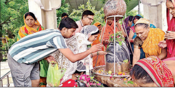
बालूघाट स्थित महाकाल की पूजा–अर्चना करते भक्त।