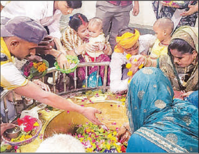
बाल्हेश्वर मंदिर में जलाभिषेक करते श्रद्धालु।