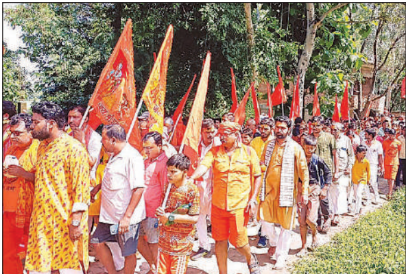
महमूदाबाद कस्बे से निकलती कांवड़ यात्रा।

मछरेहटा में हर- हर महादेव के नाच से गूँजे शिवालय : मछरेहटा। भारासेनी मंदिर परिसर में स्थित शिव दरबार में लोग सुबह से ही जुटे। वीहट बीरम गांव के बाहर बड़े शिवाले पर प्रातःकाल से ही भक्तों का पहुंचना शुरू हुआ। देर शाम तक पूजा -पाठ का क्रम चलता रहा।