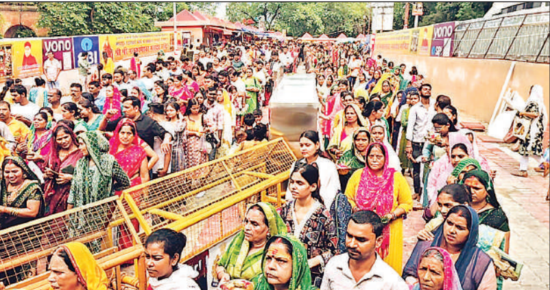
सावन के पहले सोमवार को प्रयागराज के मनकामेश्वर मंदिर में दर्शन पूजन को लगी श्रद्धालुओं की कतार ।