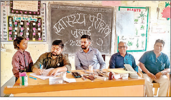
बच्ची का स्वास्थ्य परीक्षण करते चिकित्सक।