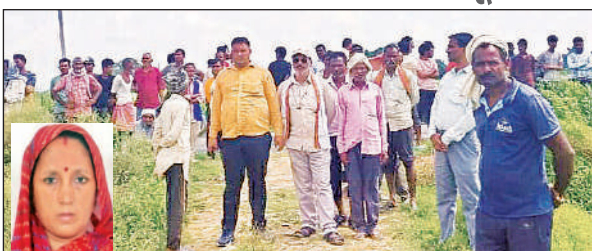
मौके पर लगी ग्रामीणों की भीड़। इनसेट में महिला की फाइल फोटो