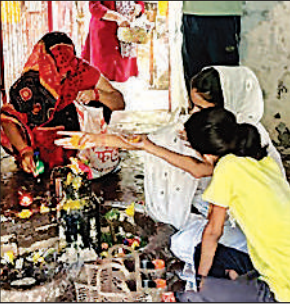
सिद्धेश्वर मंदिर में पूजा अर्चना करते लोग।