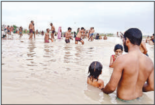
गंगा स्नान करते श्रद्धालु।