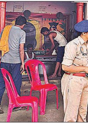
शिव संकट हरण सकाहा मंदिर परिसर में व्यवस्थाओं का निरीक्षण करते डीएम-एसपी।