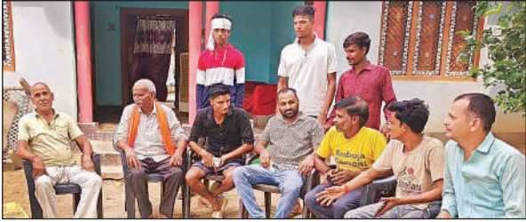
पैतृक गांव कुरौंध में चर्चा करते गांव वासी।

अमृत विचार। 40 वर्ष बाद भारत के लाल शुभांशु शुक्ला ने अंतरिक्ष की भरी उड़ान तो पैतृक गांव अतरौली के कुरौंध में उत्साहित गांव वासी। 25 जून को अंतरिक्ष में कैप्टन शुभांशु शुक्ला अपने कार साथियों के साथ वैज्ञानिक शोध के लिये गए थे। लगभग 15 दिन के प्रशिक्षण उपरांत आज भारतीय समानानुसार लगभग दोपहर 3 बजे कैलिफोर्निया के समंदर में कैप्सूल स्पलेडाउन करेगा। शुभांशु शुक्ला के पैतृक गांव कुरौंध में ग्रामीण वासी दीर्घायु की भोलैनाथ से कर रहे प्रार्थना सकुशल आगमन की प्रतीक्षा। शुभांशु भारतीय वायुसेना के ग्रुप कैप्टन इसलिए यात्रा के पायलट भी है। शुभांशु के पैतृक गांव कुरौंध में पिछले 15 दिनों से चर्चा का विषय बना है शुभांशु की वापसी