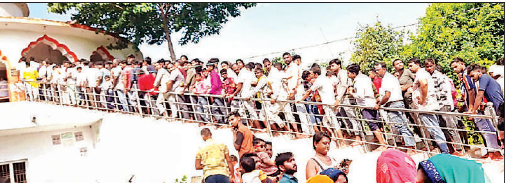
कल्याणी नदी तट पर बुढ़वा बाबा मंदिर तासीपुर में दर्शन-पूजन के लिए लगी भक्तों की लम्बी कतार।