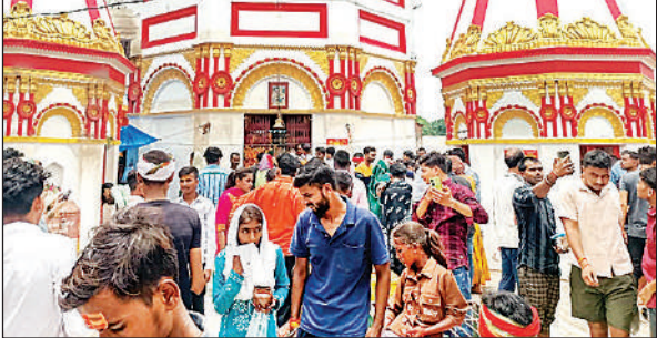
भंवेश्वर मंदिर में जलाभिषेक के लिए उमड़े श्रद्धालु।

शिवलिंग पर बेलपत्र, धतूरा, भांग, गंगाजल, बेर व दूध अर्पित कर की पूजा - अर्चना