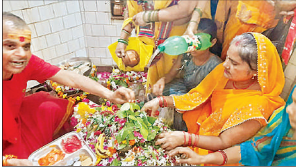
पवित्र पंचमुखी शिवलिंग का अभिषेक करते श्रद्धालु।