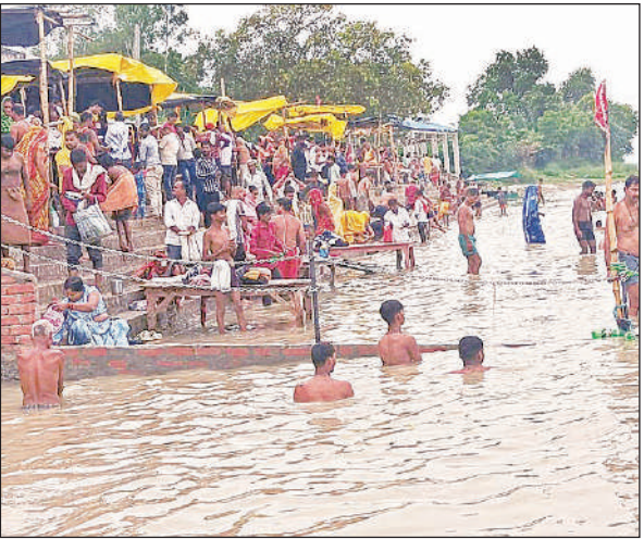
गोकर्ना गंगा तट पर स्नान के लिए लगी लोगों की भीड़।