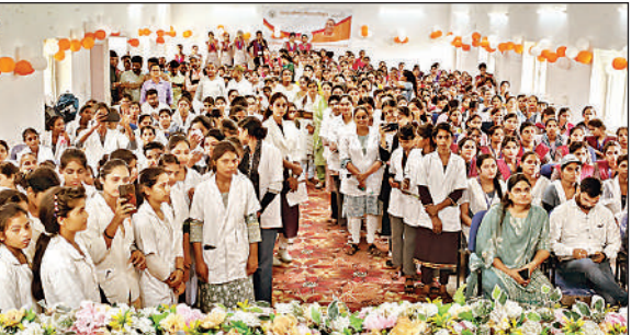
राजकीय आईआईटी गोरा बाजार में आयोजित रोजगार मेला में आए अग्र्यर्थी।

जिलाधिकारी ने निरीक्षण के दौरान कहा कि मेले में जिन युवाओं को नियुक्ति पत्र दिया जा रहा है, उनका लगातार फालोअप भी ले।