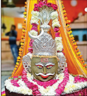
मोटेश्वर महादेव मंदिर में किया गया महाकालेश्वर जैसा श्रृंगार।

सुबह करीब सात बजे से ही श्रद्धालु स्नान के लिए गंगा तट की ओर जाने लगे, जिससे यातायात दबाव बढ़ गया। इस दौरान कानपुर की ओर से आ रही एक ई–बस जब शुक्लागंज में प्रवेश कर रही थी, तभी