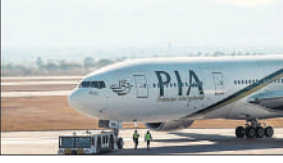
● जेहा में उतरने के बाद आख़न अधिकारियों ने वापस लौटाया