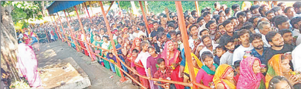
हैदरगढ़ स्थित अवसानेश्वर महादेव मंदिर में जलाभिषेक के लिए कतार में लगकर अपनी बारी का इंतजार करते शिव भक्त।

बाराबंकी, अमृत विचार : जिले के प्रमुख शिवधामों और ग्रामीण अंचलों के शिवालयों में भोर से ही श्रद्धालुओं का तांता लग गया। सिरौलीगौसपुर क्षेत्र के कुंतेश्वर महादेव मंदिर में भक्तों ने जलाभिषेक किया। मरकामऊ पूर्णेश्वर मंदिर खजुरिहा, ओमकरेश्वर मंदिर, जंगलेश्वर मंदिर, बदोसराय पारिजात धाम बरौलिया, मेलारायगंज, सैदनपुर, सहादतगंज, कटका नरदरी, मधवापुर राजापुर आदि शिवालयों में भक्तों ने पूजन अर्चन किया। देवा के सिद्धेश्वर महादेव, शहर में नामेश्वरनाथ मंदिर, कैलाश आश्रम मंदिर, धनोखर मंदिर, पायनिथर चौराहा स्थित शिवमंदिर, पंचमदास कुटी, बंकी के खसपरिया स्थित मत्तेश्वर महादेव, बावली शिव मंदिर पौर बटावन, नीलकंठेश्वर, किल्लेश्वर, भुवनेश्वर महादेव, दुधेश्वर महादेव व कंकड़ेश्वर महादेव मंदिर समेत कई शिवालयों में भक्तों की भीड़ रही। सुबह रुद्राभिषेक के बाद शाम को कैलाश आश्रम मंदिर में के शिवलिंग का विशेष श्रृंगार किया गया। हैदरगढ़ में अवसानेश्वर महादेव मंदिर में भक्तों का तांता लगा रहा। त्रिवेदीगंज के शिवनाम में शिवभक्तों ने जलाभिषेक करके शिव चालीसा का पाठ किया। सिद्धार के मंदिर में भी सुबह से जुटा भक्तों का तांता देर रात तक लगा रहा। रामसुनेहीघाट में बुढ़वा बाबा मंदिर तासीपुर में शिवभक्तों ने पूजन किया। सुबेहा में काली मंदिर से कांवाड़ियों का जत्था औसानेश्वर मंदिर रवाना हुआ। जत्थे में शामिल भक्तों ने डलमऊ से गंगा जल लेकर क्षेत्र के अलग अलग शिवालयों में जलाभिषेक किया। मसौली, बांसा, बड़ागांव, सफदरगंज, उधौली, सैदनपुर, सिसवारा, जकरिया, भयारा, त्रिलोकपुर, बिंदोरा, रानीबाजार और सुवारी सहित क्षेत्र के गांवों के शिवालयों में जलाभिषेक हुआ। गांवों के लोग लोधेश्वर महादेवा भी जलाभिषेक के लिए भी पहुंचे।