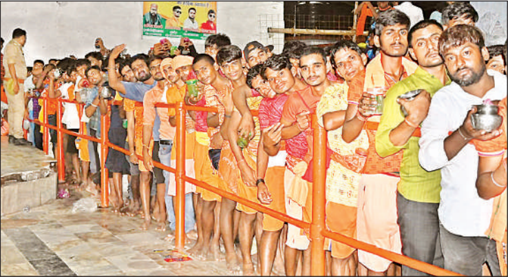
रविवार रात से कतार में लगकर लोधेश्वर महादेवा के पट खुलने का इंतजार करते भक्त।