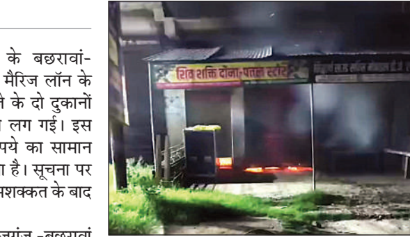
बिजली शार्ट सर्किट से दुकान में लगी आग ।