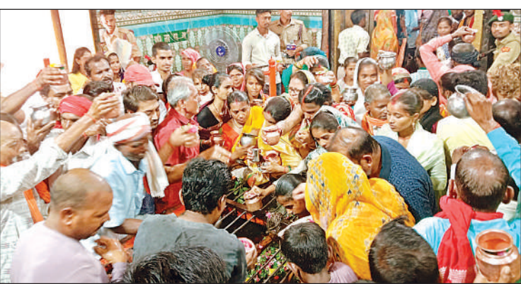
लोधेश्वर महादेवा मंदिर के कपाट खुलते ही जलाभिषेक के लिए उमड़ी श्रद्धालुओं की भीड़।