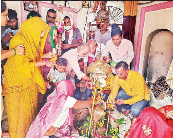
मुकुट नाथ धाम ताला में जलामिषेक व पूजा अर्चना करते श्रद्धालु ।