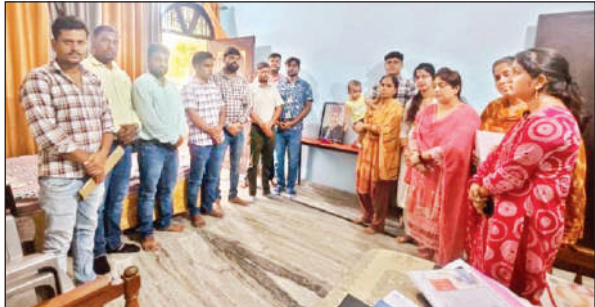
दिवंगत शिक्षक के आवास पर पहुंची टीचर्स सेलफ केयर टीम। अमृत विचार

महिला सुरक्षा हेल्पलाइन नंबर 1090 और 181 का अधिकतम प्रचार-प्रसार कर महिलाओं को इनके उपयोग हेतु प्रेरित किया जाना चाहिए। जनसुनवाई से पहले उन्होंने जिला महिला चिकित्सालय का निरीक्षण कर स्वास्थ्य सेवाओं की स्थिति का जायजा लिया और नवजात कन्याओं व माताओं को स्वास्थ्य किट वितरित की। सामुदायिक स्वास्थ्य केंद्र कोठी और विकासखंड हरख के दो आंगनबाड़ी केंद्रों का निरीक्षण करते हुए उन्होंने साफ-सफाई एवं सेवाओं की गुणवत्ता में सुधार के निर्देश दिए। इसके अलावा वृद्धाश्रम का भी निरीक्षण कर व्यवस्था सुधारने पर बल दिया।