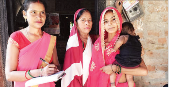
संचारी रोग अभियान की जानकारी देती आशा कार्यकर्त्री।