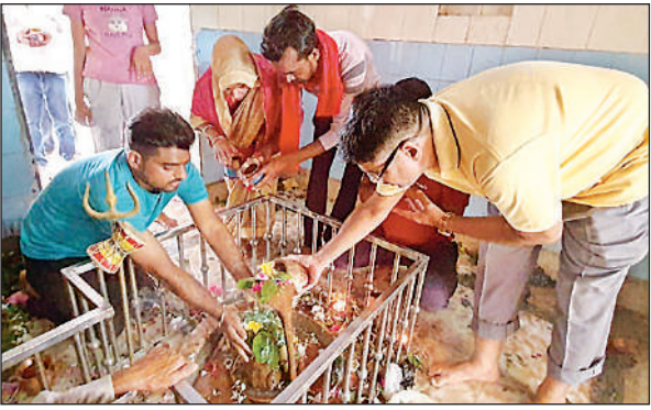
श्री बरखण्डीनाथ महादेव मन्दिर में पूजा- अर्चन करते श्रद्धालु।