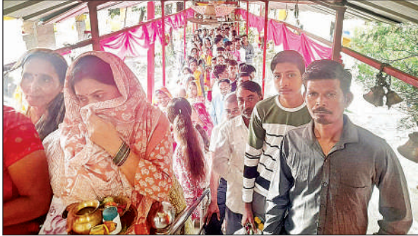
बोधेश्वर मंदिर में लाइन में खड़े श्रद्धालु।