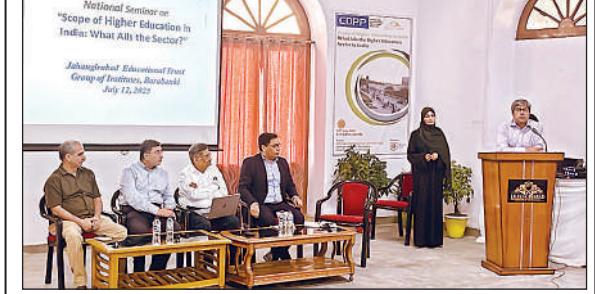
संमिनार को संबोधित करते विशेषज्ञ।