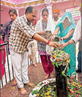
तपेश्वर नाथ मंदिर में जलामिषेक व पूजा अर्चना करते श्रद्धालु ।

करने पहुंच रहे हैं। वहीं सावन के पहले सोमवार को लोगों ने भगवान शिव का व्रत रख उपासना की। शिव