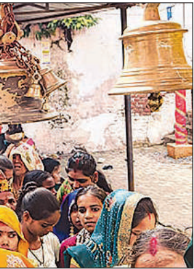
शिव संकट हरण सकाहा मंदिर में भक्तों की लगी कतार।