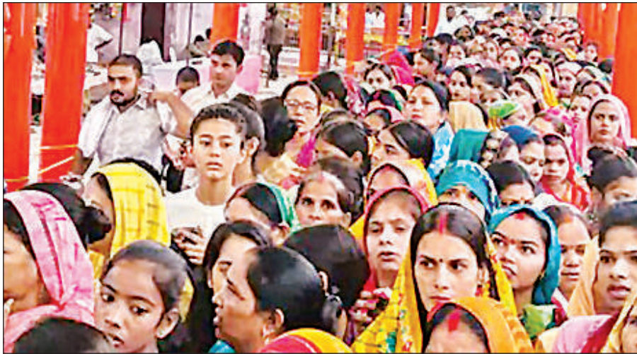
बाबा श्यामनाथ मंदिर में जलाभिषेक के लिए उमड़े श्रद्धालु।