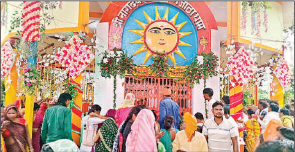
मंजीठा स्थित नाग देवता मंदिर में पूजा-अर्चना करते श्रद्धालु।