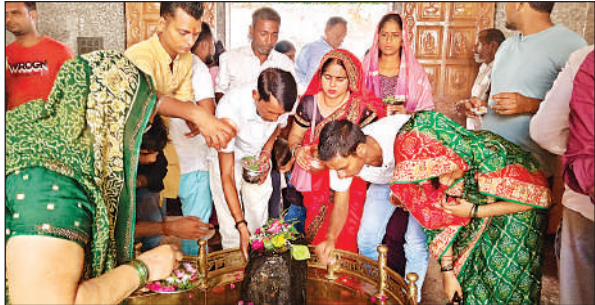
कुंतेश्वर मंदिर में जलाभिषेक करते श्रद्धालु।