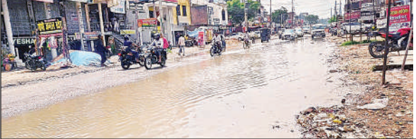
दुकानदारों के दुकान के सामने जलभराव ।