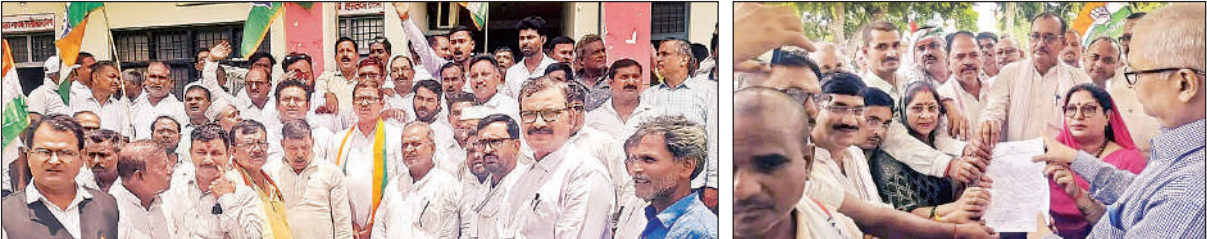
सदर तहसील परिसर में प्रदर्शन करते कांग्रेस कार्यकर्ता।

से जिला अस्पताल में लागू किया जा रहा है। उन्होंने बताया कि अस्पताल के सभी पटलों को इससे अवगत करा दिया गया है। जिला अस्पताल आने वाले ऐसे रोगियों को अब सिटी स्कैन के लिए उन्हें 500 रुपये की अदायगी नहीं करनी पड़ेगी। हालांकि इसके पूर्व में काफी लंबे समय सिटी स्कैन मशीन के खराब होने से तमाम मरीजों व तीमारदारों को परेशान होना पड़ा था। मरीजों को होने वाली इस तरह की परेशानियों के पीछे सीएमएस को भी काफी निराश होना पड़ रहा था। उन्होंने बताया कि मरीजों को अस्पताल में मिलने वाली स्वास्थ्य सुविधाओं को और भी बेहतर करने का प्रयास निरन्तर जारी है।