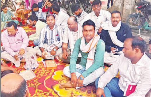
तहसील परिसर में प्रदर्शन करते लेखपाल ।