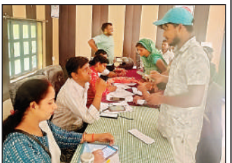
दिव्यांग बच्चों का चिन्होहन व समग्र पुनर्वासन शिविर में मौजूद लोग।

अमावा, रायबरेली, अमृत विचार। सोमवार को ब्लॉक मुख्यालय सभागार में दिव्यांग सशक्तिकरण विभाग द्वारा दिव्यांग बच्चों का चिन्होहन व समग्र पुनर्वासन शिविर का आयोजन किया गया। इस शिविर में दिव्यांगजनों के दिव्यांगता की जांच कर प्रमाण पत्र बनाए जाने के साथ सहायक तंत्रों के लिए नामांकन किया गया। कार्यक्रम की अध्यक्षता करते हुए