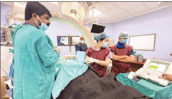
एसआरएन अस्पताल में नई तकनीक से उपचार करते डाक्टर ।