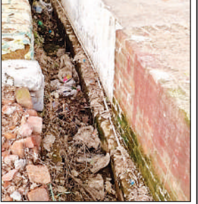
गंदगी से पटी नाली।

पाली, हरदोई, अमृत विचार। प्रदेश सरकार ने जनता की सुविधा के लिए नाली का निर्माण कराया गया, जिसमें लाखों रुपए खर्च होने के बावजूद आज तक नाली लोगों के उपयोग में नहीं आया। नगर के शाहिद आबिद खां की मजार के पास से नाले का निर्माण पुराने बैरियल तक कराया गया जो नाला लोगों की सुविधा के लिए बनाया गया उस नाला को पास के दुकानदारों ने मिट्टी डालकर अतिक्रमण कर रखा है, जिससे घरों का पानी डामर सड़क पर पानी फैलने लगता है। सड़क पर पानी आ जाने से सड़क भी टूट रही है और ऊपर खाबर में तब्दील होने में समय नहीं लगेगा वहां के घरों के लोगों को पानी निकालने के लिए अनेक प्रकार की परेशानियों का सामना करना पड़ रहा है जबकि लोगों का कहना है इस नाले को बनाए जाने पर धो अभियमिएप की गई है उस नाला का उपयोग आम नागरिक नहीं कर पा रहे हैं। नाले के आसपास रहने वाले लोगों का कहना है इस नाले के ऊपर लोगों ने अतिक्रमण कर रखा है उस नाला को खुलवाकर नाले को चालू कराया जाए जिससे वहां के लोग उसका उपयोग कर सकें।