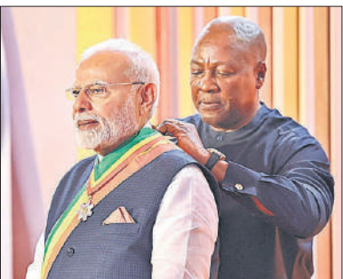
मोदी को सम्मानित करते घाना के राष्ट्रपति महामा।

घाना की संसद को संबोधित करते हुए प्रधानमंत्री मोदी ने कहा कि 'ग्लोबल साउथ' को आवाज दिए बिना प्रगति संभव नहीं है। दो दिवसीय यात्रा पर यहां आए प्रधानमंत्री मोदी ने कहा कि दुनिया के सबसे बड़े लोकतंत्र के रूप में