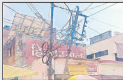
खत्रियाना चौराहे पर झुका खड़ा विद्युत पोल।

लहरपुर, सीतापुर, अमृत विचार : नगर क्षेत्र में विद्युत आपूर्ति निर्धारित रोरिंटिंग के अलावा शिकायतों के निस्तारण के लिए काटी जाती है क्षेत्र में जलते केबिल व कम क्षमता के ट्रांसफार्मर के कारण नगर क्षेत्र में अधिकांश स्थानों पर विद्युत आपूर्ति प्रभावित होती है। नगर क्षेत्र में लगाए गए अधिकांश पोल जर्जर हो चुके हैं। ग्राम गोपेशपुर में हाईटेशन लाइन को बहुत बुरा हाल है। यहां ईंट भूँडे से फेंकटी जाने वाली 11 हजार हाईटेशन लाइन लटक कर काफी नीचे आ गई है, जिससे दुर्घटना की संभावना है। विद्युत आपूर्ति के लिए लगाया गया पोल भी झुक गया, जिससे दुर्घटना की संभावना बढ़ गई।