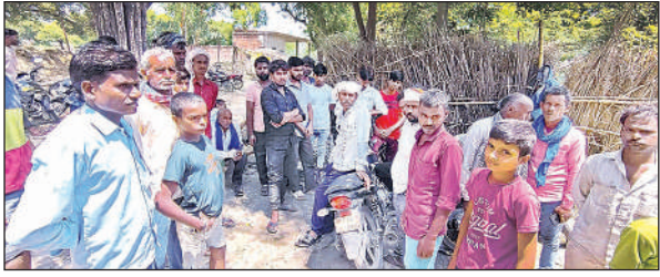
महिला के घर के बाहर लगी लोगों की भीड़।