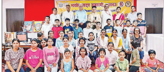
गोपाल सरस्वती विद्या मंदिर में आयोजित कार्यशाला में मौजूद छात्र- छात्राएं ।