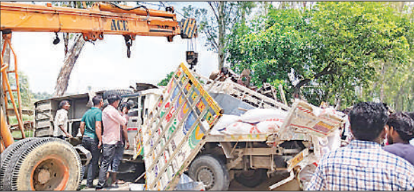
लोडर को हटाती क्रेन।