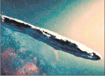
अज्ञात पिंड ए11पीएल3जेड की तार्जा तस्वीर।