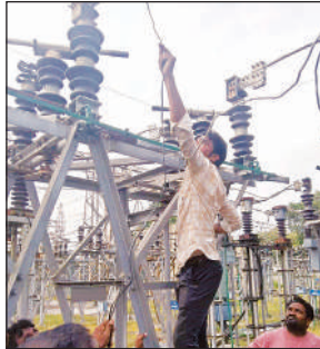
फाल्ट की मरम्मत करते विद्युत कर्मी।

बिजली आपूर्ति बाधित होने से शहरी क्षेत्र ही नहीं, बल्कि ग्रामीण इलाकों की भी बिजली गुल हो गयी। सुबह-सुबह बिजली न मिलने के कारण लोग पानी की बूंद-बूंद को तरस गए। घरों में लगे