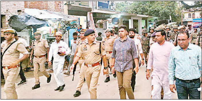
मोहर्रम जुलूस मार्ग का निरीक्षण करते डीएम और एसपी।

तकबीर की सदाओं के साथ जुलूस आगे बढ़ता गया। युवकों की टोली ढोल-ताशा बजा रहे थे तो वहीं लोग मर्सिया व नौहा पढ़ते हुए चल रहे थे। दुलदुल घोड़े को दूध व जलेबी खिलाने के लिए व चादर चढ़ाने के लिए महिलाओं में होड़ मची रही। भारी भीड़ घरों के दरवाजे व छतों पर रही। महिलाओं ने दुलदुल के पहुंचने के बाद दूध व जलेबी खिलाया मन्नतें मांगीं। जिनकी मन्नतें पूरी हो गई थी उन्होंने चादर और चांदी के पंजे चांदी के अनार चढ़ाए। ये सिलसिला देर रात तक जारी रहा। उधर सुरक्षा व्यवस्था को लेकर प्रशासन द्वारा चाक चौबंद इंतजाम किए रहे। माहे मोहर्रम की छठी की रात मेहंदी का जुलूस व सातवीं तारीख के दौरान सुरक्षा व्यवस्था के काफी पुख्ता प्रबंध किए गए थे ताकि किसी भी स्थान पर कोई अप्रिय घटना न हो सके।