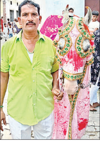
दुलदुल का जुलूस निकालते लोग।