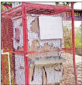
खराब पड़ा वाटर कूलर ।

अमृत विचार । गर्मी में प्यास बुझाने के लिए राहगीरों और स्थानीय नागरिकों को भटकना ना पड़े इसके लिए लाखों की लागत से वाटर कूलर लगाया गया । नगर पंचायत की ओर से देखरेख की जिम्मेदारी भी सौंपी गई । इसके बावजूद जिम्मेदार लापरवाह बने रहे । नतीजतन कई महीनों से वाटर कूलर खराब पड़ा है । अभी तक किसी ने सुध लेना तक मुनासिब नहीं समझा । इससे स्थानीय लोगों में आक्रोश व्याप्त है । परशदेपुर कस्बे में पेयजल की समस्या गंभीर रूप ले चुकी है । नगर