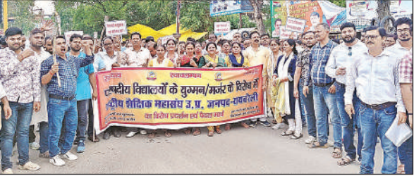
पैदल मार्च कर विरोध प्रदर्शन करते आक्रोशित शिक्षक ।