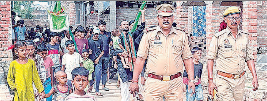
7वीं का जुलूस निकालते लोग व मौजूद पुलिस प्रशासन।

रामपुर मथुरा, महमूदाबाद और सदरपुर समेत अन्य इलाकों में ढोल और बाजों के साथ निकले इन जुलूसों में हजारों लोगों की मौजूदगी रही। अंजुमनों ने ताबूत, अलम और अन्य मजहबी प्रतीकों के साथ अपनी