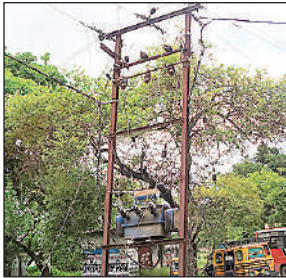
जर्जर लटकते तार व ट्रांसफार्मर पर तारों का मकड़ जाल।

अमृत विचार : बाढ़-कटान प्रभावित क्षेत्र में शासन के लाख प्रयासों के बावजूद आपदाएं विकास कार्यों को प्रभावित कर रही हैं। ऐसे में विद्युत पोल और जर्जर तार व्यवस्था इन दिनों इलाका वासियों के लिए खासी चुनौती बन चुका है। विकास खण्ड रामपुर मथुरा क्षेत्र के बांसुरा स्थित पावर हाउस से निकलने वाले विद्युत तारों पर नजर डालें तो अधिकतर तार जर्जर हैं। कई तो पेड़ों की टहनियों में बंधे हैं। खस्ताहाल तारों की स्थिति ऐसी है कि खेत में सिचाई के दौरान कई बार ग्रामीण हादसे का शिकार हो चुके हैं। हल्की सी स्पाकिंग विद्युत आपूर्ति बाधित