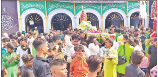
सफीपुर में मोहर्रम के जुलूस में शामिल लोग।

जुलूस बड़े इमामबाड़े से उठा और नगर के प्रमुख मार्गों से होता हुआ दूसरे दिन वापस बड़े इमामबाड़े पहुंचा। जुलूस में बड़ी संख्या में श्रद्धालुओं ने हिस्सा