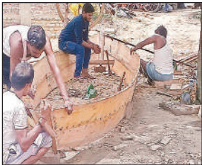
कनरखी ग्राम पंचायत में नांव बनाते कारीगर।