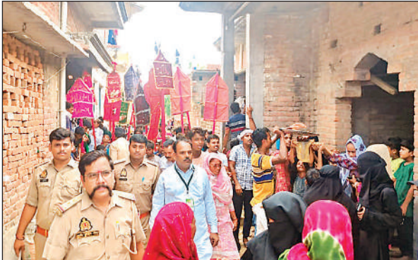
जुलूस में शामिल लोग और मौजूद पुलिस बल।