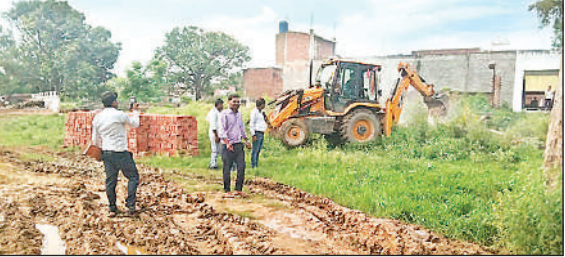
सीओ कार्यालय के नजदीक कब्जा मुकत कराती राजस्व।

गांव में मदरसा, मजार और काल भैरव नाथ मंदिर के करीब बाजार लगती रही है, श्रद्धाओं के कारण बाजार एकसाथ नहीं लग सकी।हाट बाजार विधायक निधि से बनाई गई थी। एक बार फिर प्रयास किया जाएगा कि बाजारें हाट बाजार में लग सकें।