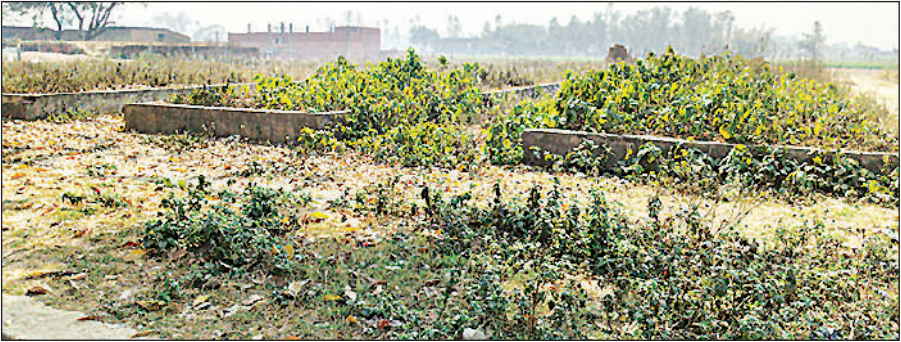
गांव के बाहर बनी हाट बाजार में उगी झाड़ियां।