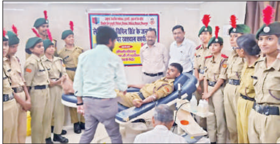
रक्तदान करते एनसीसी कैडेट्स।