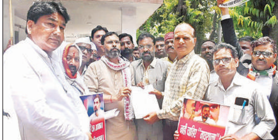
नगर मजिस्ट्रेट को ज्ञापन देते कांग्रेस कार्यकर्ता।