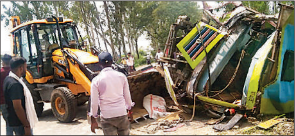
क्षतिग्रस्त बस को सड़क से किनारे करती जेसीबी।

अमृत विचार। उन्नाव-हरदोई मार्ग पर कालीमिट्टी पुलिस ट्रेनिंग सेंटर के पास ट्रक को ओवरटेक कर रहे लोडर व निजी बस में आमने-सामने टक्कर हो गई। इसके बाद ट्रक भी बस में टकरा गया। इससे बस सड़क पर पलट गई। हादसे के बाद बस व लोडर सवारों में चीख पुकार मच गई। सूचना पर पहुंची पुलिस ने घायलों को रेस्क्यू कर सीएचसी भेजा। जहां से 13 को जिला अस्पताल रेफर किया गया। बता दें कि सफ़ीपुर से बांगरमऊ की ओर मुर्गी का दाना लादकर जा रहा तेज रफ्तार लोडर गुरुवार दोपहर फतेहपुर चौरासी थानाक्षेत्र के उन्नाव-हरदोई मार्ग पर पीटीसी व