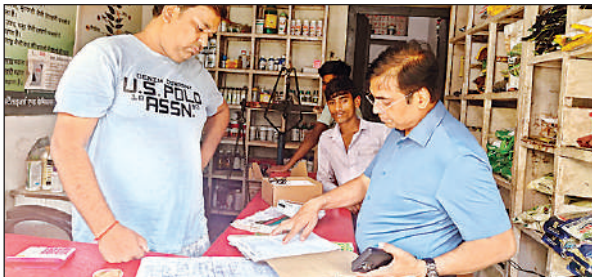
निरीक्षण करते जिला कृषि अधिकारी।