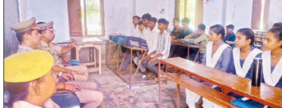
जीजीआरसी इंटर कॉलेज मऊ में छात्राओं को जागरूक करती पुलिस ।