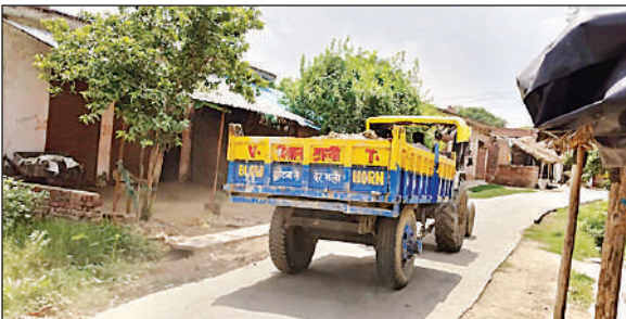
सालेहनगर गांव में मिट्टी लेकर जाती ट्रैक्टर-ट्राली ।

अमृत विचार : देवा क्षेत्र में अवैध खनन का कारोबार खुलेआम चल रहा है। सालेहनगर में मिट्टी माफिया दिन-रात सक्रिय हैं। ट्रैक्टर-ट्रालियों से खेतों और परती जमीनों से मिट्टी निकाली जा रही है। स्थानीय ग्रामीणों के अनुसार पिछले एक सप्ताह से ये गतिविधियां जारी हैं। मिट्टी को निर्माण स्थलों पर ऊंचे दामों में बेचा जा रहा है। खनन माफिया दिन में ही यह कार्य कर रहे हैं। ग्रामीणों ने कई बार विरोध किया। सूत्रों के मुताबिक, शिकायतों के बाद भी कोई कार्रवाई नहीं की जाती। अवैध खनन से किसानों की उपजाऊ भूमि को नुकसान पहुंच रहा है। इससे खेती प्रभावित हो रही है। ग्रामीणों