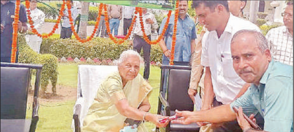
शिक्षक को सम्मानित करती राज्यपाल आनंदीबेन पटेल।

ब्लॉक के सनफरा प्राथमिक स्कूल के बच्चों ने जिले से लेकर प्रदेश तक अपने करतव्य दिखाकर नाम रोशन किया है। राज्यपाल के बुलावे पर उप जिला अधिकारी सवायजपुर स्कूल के शिक्षकों और बच्चों को लेकर राजभवन पहुंचे थे जहां पर राज्यपाल ने एक-एक करके सभी बच्चों और शिक्षकों को सम्मानित किया है। ब्लाक सांडी की ग्राम पंचायत लमकन के मजरा सनफरा प्राथमिक स्कूल के बच्चों ने एक माह पूर्व जनपद मुख्यालय आई राज्यपाल आनंदी बेन पटेल के सामने भारतीय सेना की तरह पीटी कर अपना कर्तव्य दिखाया था जिस पर राजपाल ने सभी बच्चों की और शिक्षकों की जमकर प्रशंसा की थी