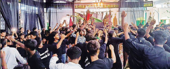
जुलूस में प्रदर्शन करते लोग।