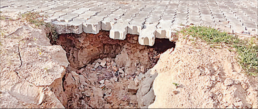
मिट्टी बह जाने के कारण हवा में लटकी इंटरलॉकिंग बनी हादसे का सबब ।

बता दें कि महादेवा पुलिस चौकी से लेकर लोधौरा चौराहा और वहां से सूरतगंज पेट्रोल पंप तक दोनों ओर सड़क किनारे इंटरलॉकिंग लगावाई गई थी। स्थानीय नागरिकों का आरोप है कि ठेकेदार ने निर्माण