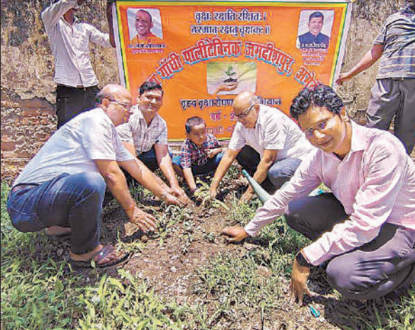
पौधरोपण करते विद्यालय के प्रधानाचार्य एवं उपस्थित लोग।