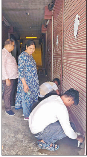
छापेमारी के दौरान दुकान सीज करती औषधि विभाग की टीम।