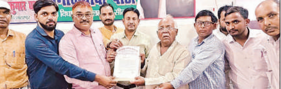
सपा विधायक को ज्ञापन सौंपते शिक्षक।