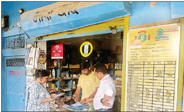
एक केंद्र पर जांच करती एसडीएम सिरौलीगौसपुर ।

अमृत विचार : खरीफ फसलों की बुवाई के मौसम में उर्वरकों की उपलब्धता और निर्धारित दर पर विक्री सुनिश्चित करने के लिए प्रशासन ने कार्रवाई की है। उप जिलाधिकारी सिरौलीगौसपुर और भूमि संरक्षण अधिकारी कुर्सी की टीम ने तहसील सिरौलीगौसपुर में चार उर्वरक विक्री केंद्रों का औचक निरीक्षण किया। निरीक्षण में मेसर्स ट्रेडिज कम्पनी के अभिलेख अपूर्ण मिले। दोनों को कारण बताओ नोटिस जारी किया गया