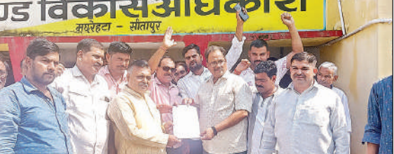
बीडीओ को ज्ञापन सौंपते प्रधान संघ के सदस्य।