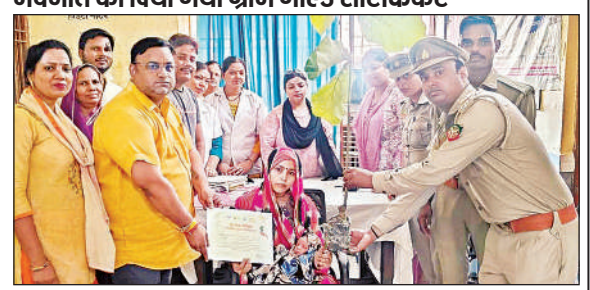
नवजात बच्चे की मां को दिया गया प्रमाण-पत्र।