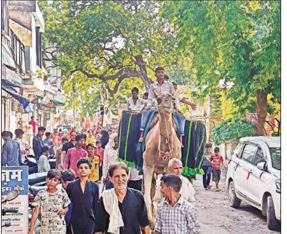
आठवीं के जुलूस में निकलते ऊंट और अलम।