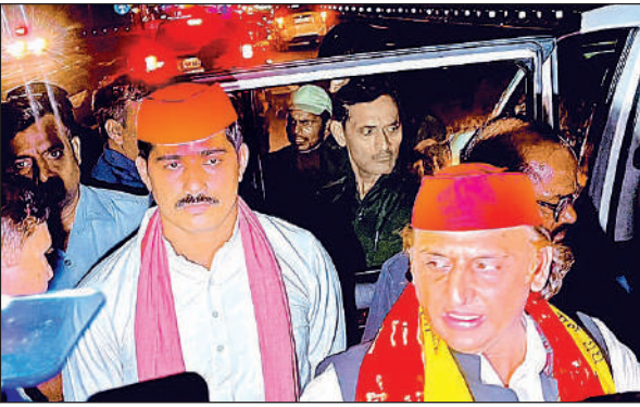
पूर्वांचल एक्सप्रेसवे पर अखिलेश यादव से मुलाकात करते सपा के कार्यकर्ता।