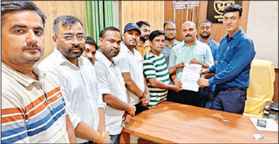
ज्ञापन देते शिक्षक नेता ।