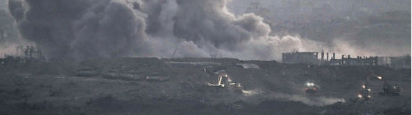
गाजा पट्टी पर इजराइली बमबारी गुरुवार को भी जारी रही।