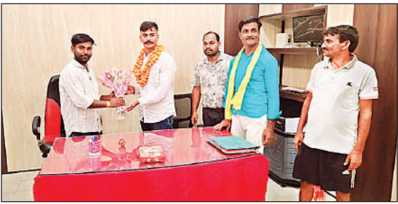
अग्निवीर को सम्मानित करते ग्राम प्रधान ।