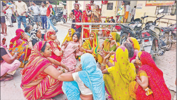
घटना के बाद रोते-बिलखते परिजन।

सदर कोतवाली के लखनऊ-कानपुर हाईवे पर शुक्रवार शाम करीब 6 बजे शेखपुर नरी गांव के मोड़ के पास लखनऊ से कानपुर जा रही