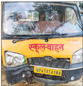
हादसे का शिकार स्कूल वाहन ।

अमृत विचार : शुक्रवार को एक बड़ा हादसा टल गया। छुट्टी के बाद बच्चों को छोड़ने जा रही मैजिक वाहन की स्टेयरिंग फेल हो गई। अनियंत्रित वाहन साइकिल सवार छात्रा को टक्कर मारते हुए पेड़ से जा टकराया। वाहन की टक्कर से छात्रा गंभीर रूप से जखमी हो गई। गनीमत यह कि वाहन में ज्यादा बच्चे नहीं थे। जानकारी के अनुसार, घटना शुक्रवार की दोपहर हुई।