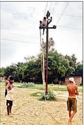
विद्युत उपकेंद्र खीरों के तहत फॉल्ट ठीक करते कर्मचारी।