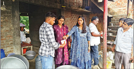
कार्रवाई करती खाद्य सुरक्षा विभाग की टीम ।