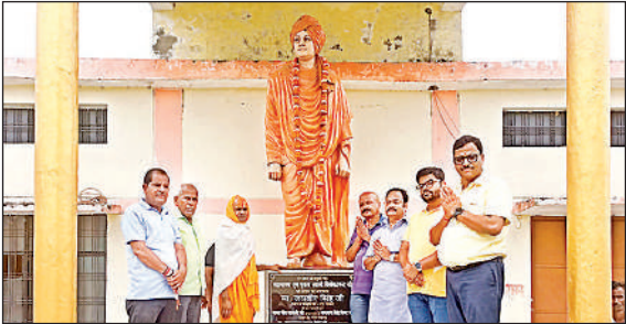
स्वामी विवेकानन्द की प्रतिमा पर माल्यार्पण करते अतिथि ।