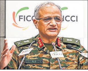
लेफ्टिनेंट जनरल राहुल आर सिंह।

उप सेना प्रमुख लेफ्टिनेंट जनरल राहुल आर. सिंह ने शुक्रवार को कहा कि चीन ने भारत को तकलीफ पहुंचाने के लिए पाकिस्तान का इस्तेमाल किया और वह मई में भारतीय और पाकिस्तानी सेनाओं के बीच ऑपरेशन सिंदूर के तहत चार दिनों तक चले संघर्ष के दौरान अपने सदाबहार सहयोगी को हरसंभव सहायता प्रदान कर रहा था।