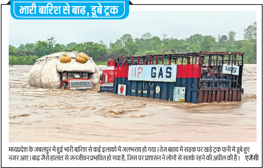
मध्यप्रदेश के जबलपुर में हुई भारी बारिश से कई इलाकों में जलभराव हो गया। तेज बहाव में सड़क पर खड़े ट्रक पानी में डूबे हुए नजर आए। बाढ़ जैसे हालात से जनजीवन प्रभावित हो गया है, जिस पर प्रशासन ने लोगों से सतर्क रहने की अपील की है।