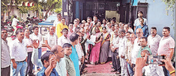
विधायक को ज्ञापन सौंपते शिक्षक।