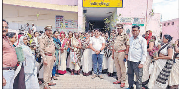
सामुदायिक स्वास्थ्य केंद्र में पौधे लिए अभिभावक, वन विभाग के अधिकारी।