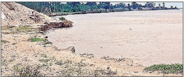
अंगरौरा गांव के करीब कटान करती घाघरा नदी।