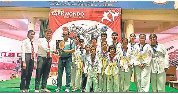
कोच एवं खिलाड़ियों को सम्मानित करते अतिथि।

जनपद मेरठ के मवाना स्थित दिल्ली ग्लोबल स्कूल में जिला स्तरीय ताइक्वांडो प्रतियोगिता का आयोजन किया गया था। प्रतियोगिता में नगर कांठ स्थित आकाश कोरियन तायक्वांडो एकेडमी के आधा दर्जन खिलाड़ियों ने अपने अपने भार वर्गों में गोल्ड, सिल्वर एवं ब्रॉन्ज मैडल प्राप्त कर जिला मुरादाबाद व एकेडमी का नाम