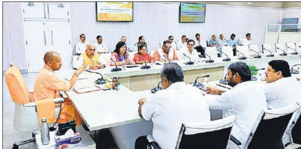
लखनऊ में अपने सरकारी आवास पर कानपुर मंडल के जनप्रतिनिधियों के साथ बैठक करते मुख्यमंत्री योगी आदित्यनाथ।

मुख्यमंत्री आवास पर हुई खास बैठक में सभी विधायकों ने अपनी बातें कहीं। बैठक में लोक निर्माण विभाग के प्रमुख सचिव ने मंडल के छह जिलों में जनप्रतिनिधियों द्वारा प्रस्तावित कुल 1,362 निर्माण कार्यों की विस्तृत समीक्षा प्रस्तुत की। मुख्यमंत्री ने प्रत्येक सांसद और विधायक से कहा कि सतत और संतुलित विकास में कानपुर मंडल की भूमिका अत्यंत महत्वपूर्ण है। यह मंडल राज्य की औद्योगिक