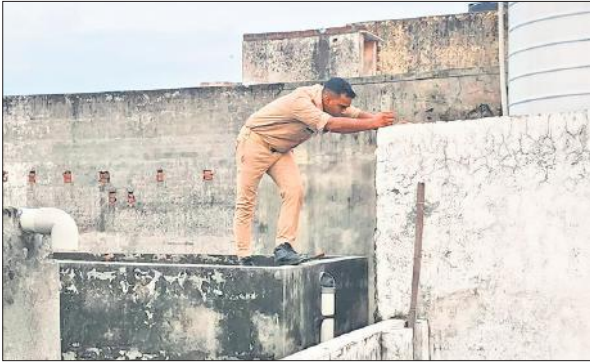
छत पर सुराग तलाशने का प्रयास करता पुलिसकर्मी।