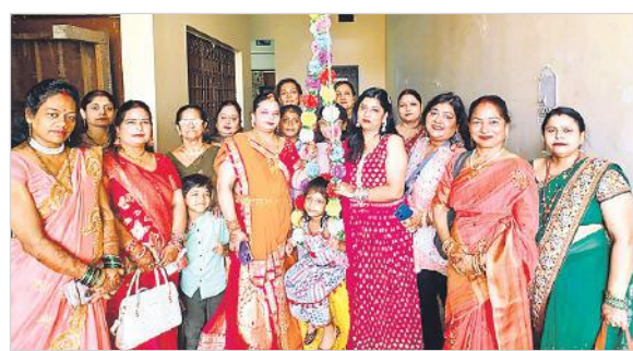
नंद विहार कालोनी में कन्या को झूला झूलाती महिलाएं।