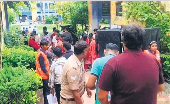
एक परीक्षा केंद्र पर अभ्यर्थियों की होती चेकिंग।

कैमरों की स्थिति देखी एवं ड्यूटीरत अधिकारी/कर्मचारियों को आवश्यक दिशा-निर्देश दिए। परीक्षा शांतिपूर्ण संपन्न होने पर अफसरों ने राहत की सांस ली है। डीआईओएस के मुताबिक आरओ, एआरओ की परीक्षा में केवल 31 फीसदी अभ्यर्थी शामिल हुए हैं। सभी केंद्रों पर शांतिपूर्ण परीक्षा संपन्न हुई है।