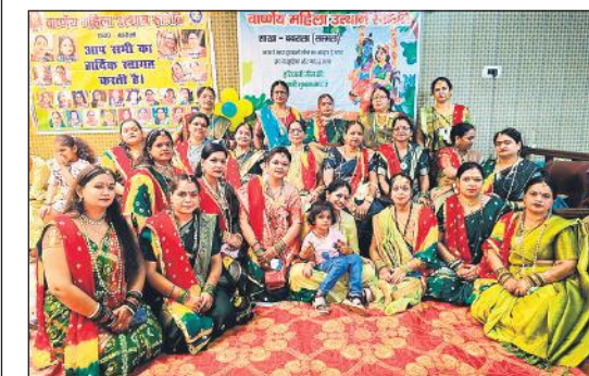
बबराला में हरियाली तीज कार्यक्रम में संगठन से जुड़ी महिलाएं।