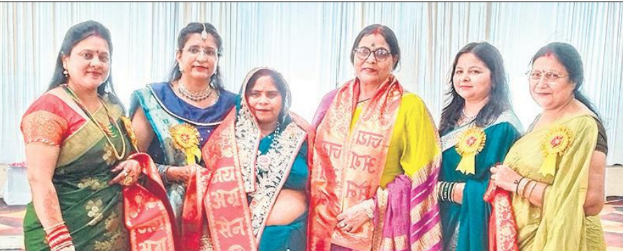
मुख्य अतिथि का स्वागत करती महिलाएं।