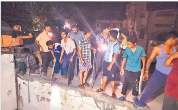
कोट पूर्वी में चोरों के शोर के बाद लाठी-डंडे लेकर एकत्र हुए लोग। ● अमृत विचार