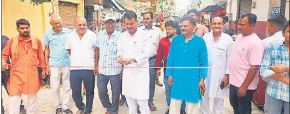
होली का मंदिर पर तीज मेले का आरंभ करते ब्लॉक प्रमुख पति।