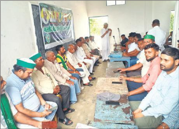
भाकियू अराजनैतिक की मासिक बैठक में बोलते वक्ता।

बैठक में किसानों की प्रमुख समस्याएं बिजली, बकाया गन्ना मूल्य का भुगतान के अलावा ब्लॉक तहसील संबंधी समस्याओं को उठाया गया एवं विस्तार करते हुए युवा मेन बॉडी के पदाधिकारी बनाए गए। बैठक में वक्ताओं ने कहा कि संगठन को मजबूत बनाए बिना समस्याओं का हल नहीं होगा इसलिए हम सभी को संगठित