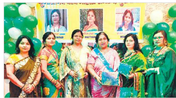
कुमारतनय वैश्य महिला संगठन के तीज कार्यक्रम में उपस्थित महिलाएं

मेहंदी से रंगे हाथ, लाल व हरी चूड़ी संग आकर्षक परिधान पहनकर महिलाओं ने सखी-सहेलियों के साथ मल्हार गाकर नृत्य कर समां बांधा। महिलाओं ने पति की दीर्घायु के लिए व्रत रखा, घरों में पूरी पकवान बने और विधि पूर्वक पूजा-अर्चना की। रविवार को तीज का त्योहार होने की वजह से शहर के सभी मंदिरों में महिला श्रद्धालुओं की ज्यादा भीड़ थी। सुहागिनों ने सुबह सबसे पहले माता पार्वती को सोलह श्रृंगार का सामान अर्पित किया और विधि विधान के साथ उपासना कर अखंड सौभाग्यवती रहने की कामना की। महानगर में कई महिला संगठनों ने धूमधाम से तीजोत्सव मनाया। सावन के गीत, नृत्य, सरप्राइज