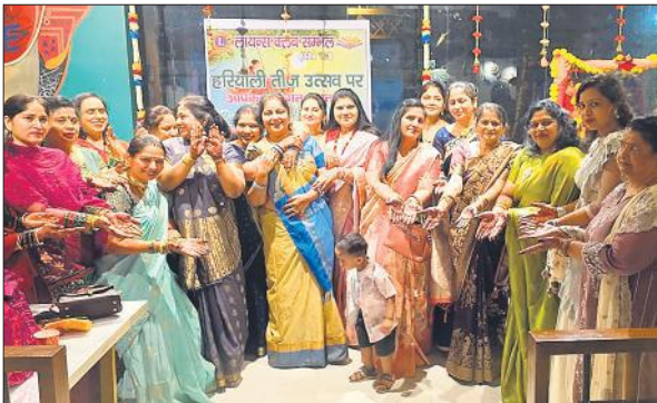
संभल में लायंस क्लब के तीज कार्यक्रम में शामिल महिलाएं।