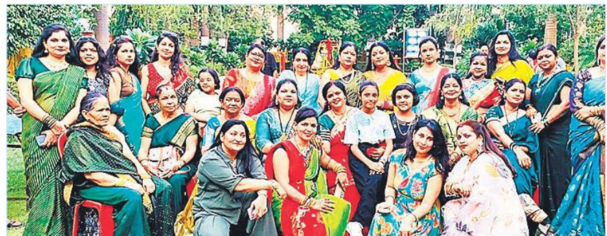
कांशीराम नगर में तीज पर आयोजित कार्यक्रम में उपस्थित महिलाएं।