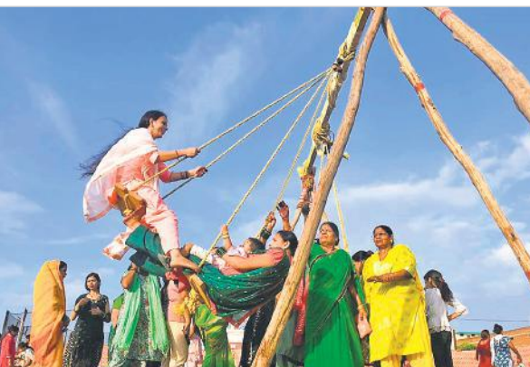
लाइनपार में आयोजित तीज उत्सव में झूला झूलती महिलाएं।