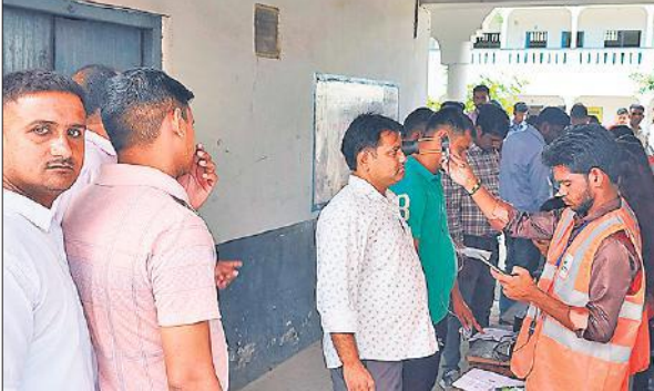
हिंद इंटर कॉलेज में परीक्षार्थियों की जांच पड़ताल करते कर्मचारी। ● अमृत विचार