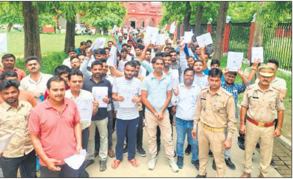
एसएम इंटर कॉलेज में परीक्षा के बाद बाद पेपर दिखाते परीक्षार्थी।