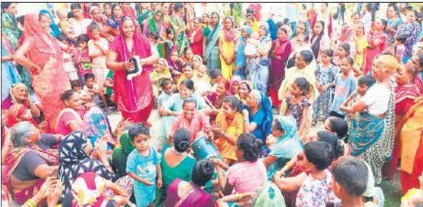
सीएचसी परिसर में ढोलक पर नृत्य करती महिलाएं। ● अमृत विचार

चन्दौसी, अमृत विचार : हरियाली तीज का त्योहार परंपरागत तरीके से मनाया गया। महिलाओं ने नए वस्त्र धारण कर व श्रंगार कर भगवान भोलेनाथ व माता पार्वती की पूजा-अर्चना की। घरों में पकवाने बनाए गए। बड़ा महादेव पर तीज मेले का आयोजन किया गया। सीएचसी में ढोलक पर जमकर नृत्य किया।