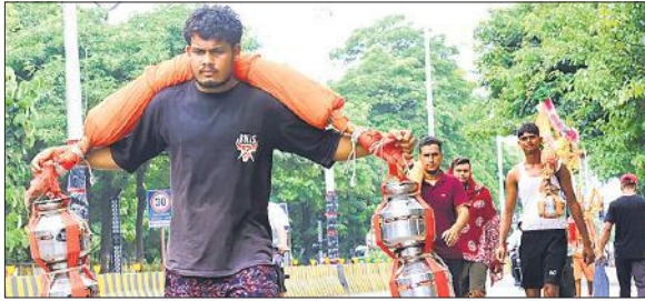
हरिद्वार से कावड़ लेकर आते शिव भक्त।

अमृत विचार : मन में भक्ति, पैरों में छाले, कांधे पर कांवड़, जुवां पर हर-हर बम-बम के जयकारे। भोलेनाथ के भजनों की धुन पर कोई झूमता हुआ तो कोई ऊँ नमः शिवाय का मनन जाप करते हुए अपने गंतव्य की ओर चल रहा था। यह बानगी रविवार को महानगर की सड़कों पर थी। कांठ रोड, दिल्ली रोड, रामपुर रोड जिस ओर नजर जाती भोले की भक्ति में मस्त कांवड़िये नजर आते। बम बम भोले के जयघोष से पूरा शहर शिवमय हो गया। सोमवार को 84 घंटा मंदिर, गंगा मंदिर, काली माता मंदिर, नया मुरादाबाद स्थित