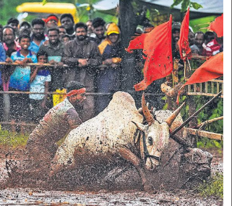
महाराष्ट्र के रत्नागिरी जिले के वहल गांव में शनिवार को नांगरानी उत्सव के दौरान पारंपरिक बैल दौड़ प्रतियोगिता में हिस्सा लेता एक किसान। यह उत्सव किसानों की एकजुटता, परंपरा और खेती से गहरे संबंध का प्रतीक माना जाता है।