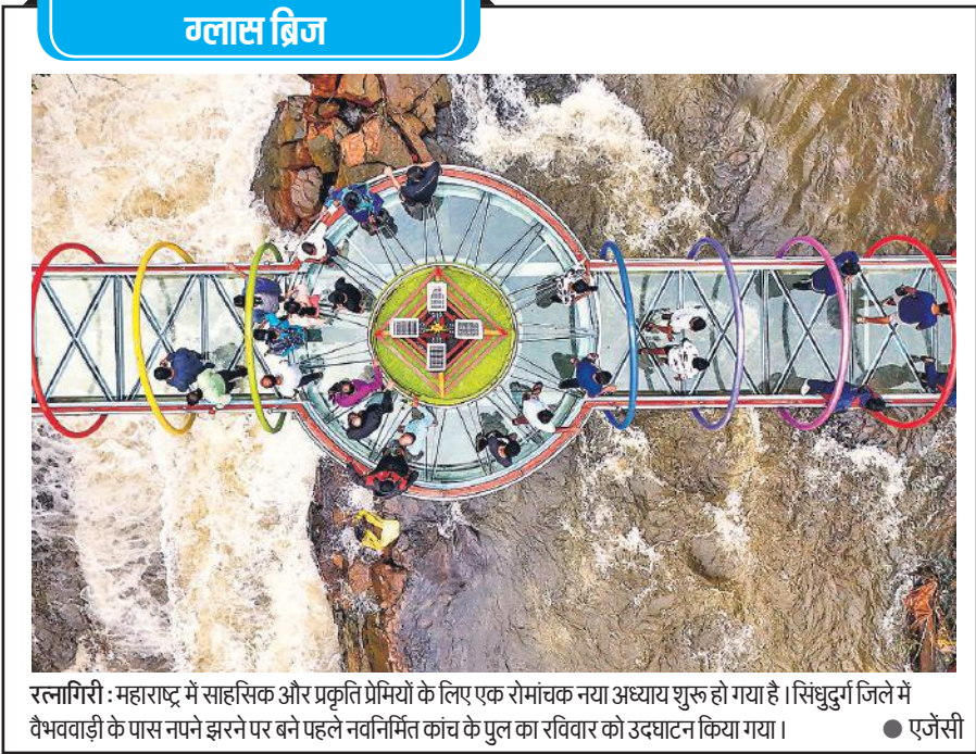
रत्नागिरी : महाराष्ट्र में साहसिक और प्रकृति प्रेमियों के लिए एक रोमांचक नया अध्याय शुरू हो गया है। सिंधुदुर्ग जिले में वैभववाडी के पास नपने झरने पर बने पहले नवनिर्मित कांच के पुल का रविवार को उदघाटन किया गया।

संसद के मानसून सत्र का पहला सप्ताह हंगामे की भेंट चढ़ने के बाद सोमवार से पहलगाम हमले और 'ऑपरेशन सिंदूर' पर तीखी बहस होने की संभावना है, क्योंकि सत्तारूढ़ गठबंधन और विपक्ष राष्ट्रीय सुरक्षा और विदेश नीति से जुड़े दो मुद्दों पर आमने-सामने होंगे। भाजपा के नेतृत्व वाले सत्तारूढ़ राष्ट्रीय जनतांत्रिक गठबंधन (राजग) और विपक्षी दलों द्वारा लोकसभा और राज्यसभा में चर्चा के दौरान अपने-अपने नेताओं को मैदान में उतारें जाने की उम्मीद है। सूत्रों ने बताया कि गृह मंत्री अमित शाह, रक्षा मंत्री राजनाथ सिंह और विदेश मंत्री एस जयशंकर इन मुद्दों पर संक्रा कर पक्ष रखेंगे। ऐसे संकेत हैं कि प्रधानमंत्री राष्ट्रीय सुरक्षा पर अपनी सरकार के 'मजबूत' रुख के