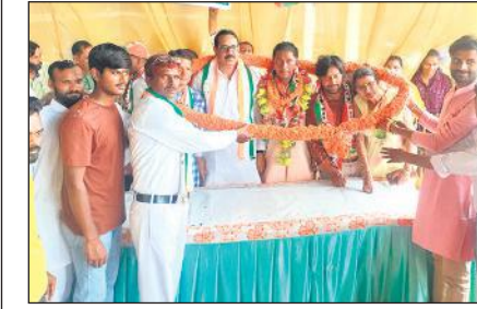
कांग्रेस के नगराध्यक्ष का स्वागत करते कांग्रेसी।