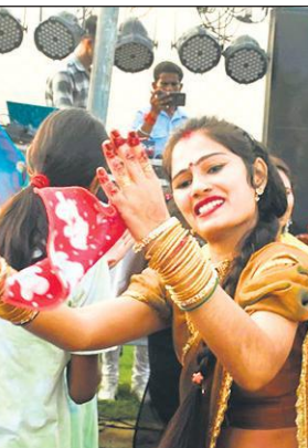
तीज उत्सव में डांस करती महिला।