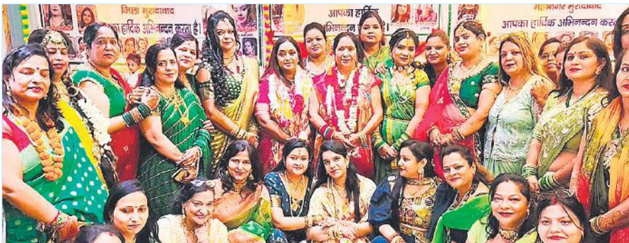
वैश्य समाज द्वारा आयोजित तीज उत्सव में शामिल महिलाएं।