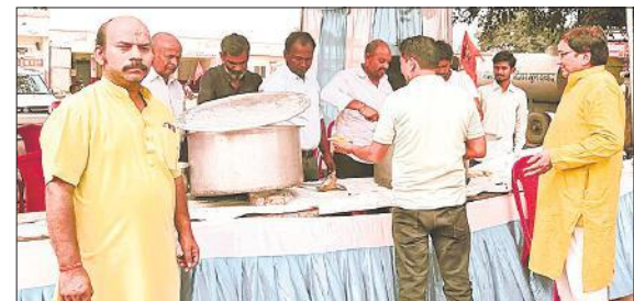
नया बस अड्डा पर लगे शिविर में कांवड़ियों व शिव भक्तों के लिए लगा शिविर।