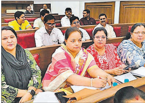
नगर निगम बोर्ड की बैठक में उपस्थित पार्षद।

नगर निगम बोर्ड की गुरुवार हुई बैठक में उत्तर प्रदेश सरकार द्वारा अमृत योजना 2.0 के तहत नगर निगमों को म्युनिसिपल बांड जारी करने के लिए कहा गया है। नगर निगम मुरादाबाद पूल बांड्स अथवा ग्रीन म्युनिसिपल बांड जारी करेगा। जो सेबी के नियमों के अनुसार जारी किया जाएगा।