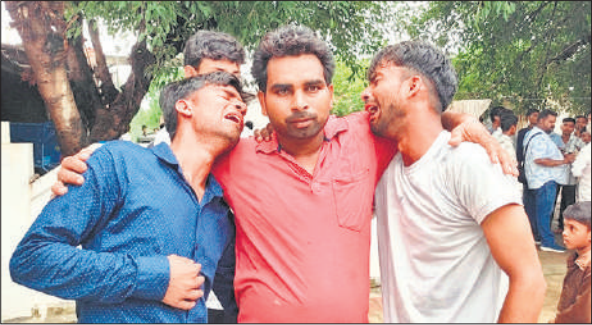
ततारपुर संदल गांव में बच्चों की मौत के बाद बिलखते परिजन।