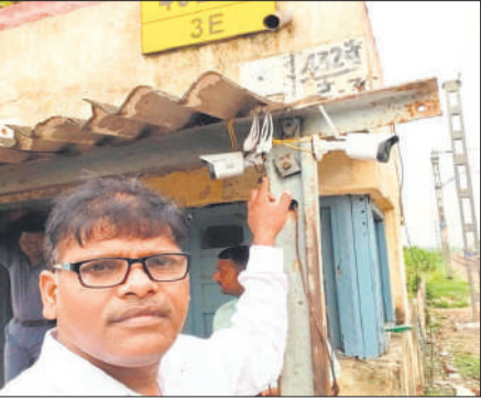
कैमरे को दिखाते एडीओ पंचायत ।

अकबरपुर चैदरी, कासमपुर, मोदी हजरतपुर, मुजफ्फरपुर टांडा, शेरपुर, रसूलपुर चौहरा, सदेहीपुर, मानपुर मुजफ्फरपुर, सराय खजूर, अहमदपुर, निरू नंगला, रसूलपुर गुर्जर, मधुपर इनायतपुरी, फूलपुर मिठनुपर, भीकनपुर असदलपुर, छजलैट, पचकोरा खानपुर, कुरी रवानी, शाहपुर मुबारकपुर कुचावल, लदावली खलीलपुर कददमी, महेंद्रि सिंकंदरपुर सदरपुर मतलब ग्राम पंचायतों में सुरक्षा व्यवस्था की निगरानी होगी। रात में मार्ग