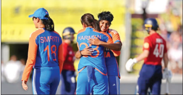
जीत के बाद जश्न मनाती भारतीय महिला टीम की खिलाड़ी ।