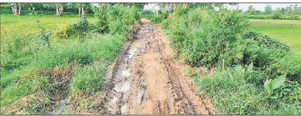
कीचड़ और पानी भरे रास्ते से गुजरने को मजबूर ग्रामीण