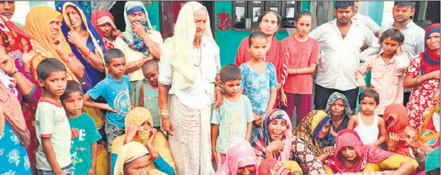
बच्चों की मौत के बाद रोती बिलखती परिवार की महिलाएं व ग्रामीण।