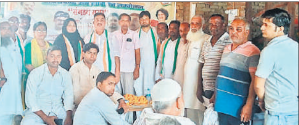
बैठक में उपस्थित कांग्रेस कार्यकर्ता।

हाइड्रोजन जैसे खतरनाक गैसों के प्रबंधन पर गंभीर सवाल खड़े कर दिए हैं। लोग सहमे हुए हैं और इलाके में दहशत का माहौल है। सूचना पर मंडलायुक्त दीपक रावत ने घटना की जांच कराने के लिए जिलाधिकारी नितिन सिंह भट्टौरिया को निर्देश दिए हैं। इस जांच में विस्फोट के कारणों, फैक्ट्री में सुरक्षा मानकों के पालन, लापरवाही के संभावित बिंदुओं और भविष्य में ऐसे हादसों को रोकने के उपायों की पड़ताल की जाएगी।