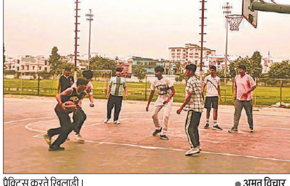
प्रेमिटस करते खिलाड़ी।