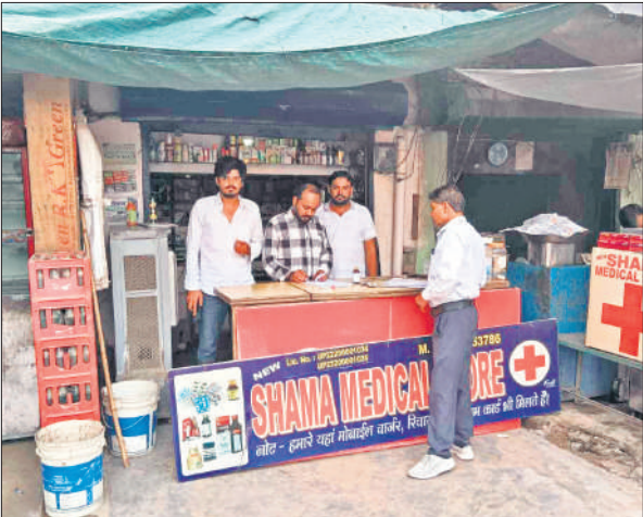
मेडिकल स्टोर को चेक करते औषधि निरीक्षक।

निरीक्षण के दौरान मिलक क्षेत्र स्थित सिंह मेडिकल स्टोर और फैजुल्ला नगर स्थित न्यू शमा मेडिकल स्टोर पर दस्तावेजों और दवाइयों की उपलब्धता जांची गई। औषधि निरीक्षक ने सभी मेडिकल स्टोर संचालकों को प्रतिष्ठान में औषधि लाइसेंस को सार्वजनिक रूप से प्रदर्शित करने के निर्देश दिए। कावड़ यात्रा के दौरान संभावित आपात स्थितियों को देखते हुए दुकानदारों को जीवन रक्षक दवाई पर्याप्त मात्रा रखने के लिए कहा। मांग के अनुसार अतिरिक्त स्टॉक