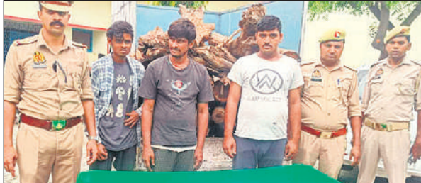
स्वार पुलिस के कब्जे में लकड़ी लूटने के आरोपी।

जारी रहेगी। उर्वरक विक्रेताओं को कड़ी चेतावनी भी दी है कि अगर खाद की कालाबाजारी, होडिंग, ज्यादा दाम वसूलने की शिकायत मिली तो कड़ी कार्रवाई होगी। किसानों से अपील की है कि आवश्यकता के अनुसार ही उर्वरक खरीदें। खरीदारी के समय आधार कार्ड, भूमि की खतौनी विक्रेता को उपलब्ध कराएं। खाद की बिक्री तय रेट से ज्यादा करने पर किसान शिकायत कर सकते हैं। कार्रवाई की जाएगी।