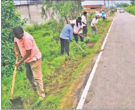
सफाई करते पंचायत राज विभाग के सफाई कर्मचारी ।