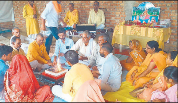
हवन-यज्ञ करते गायत्री परिवार के सदस्य।