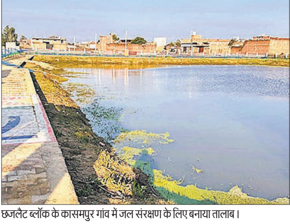
छजलैट ब्लॉक के कासमपुर गांव में जल संरक्षण के लिए बनाया तालाब।