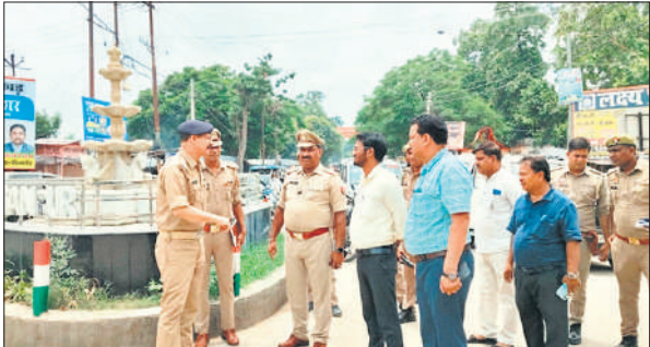
कांवड़ यात्रा मार्ग का निरीक्षण करते सीओ व तहसीलदार