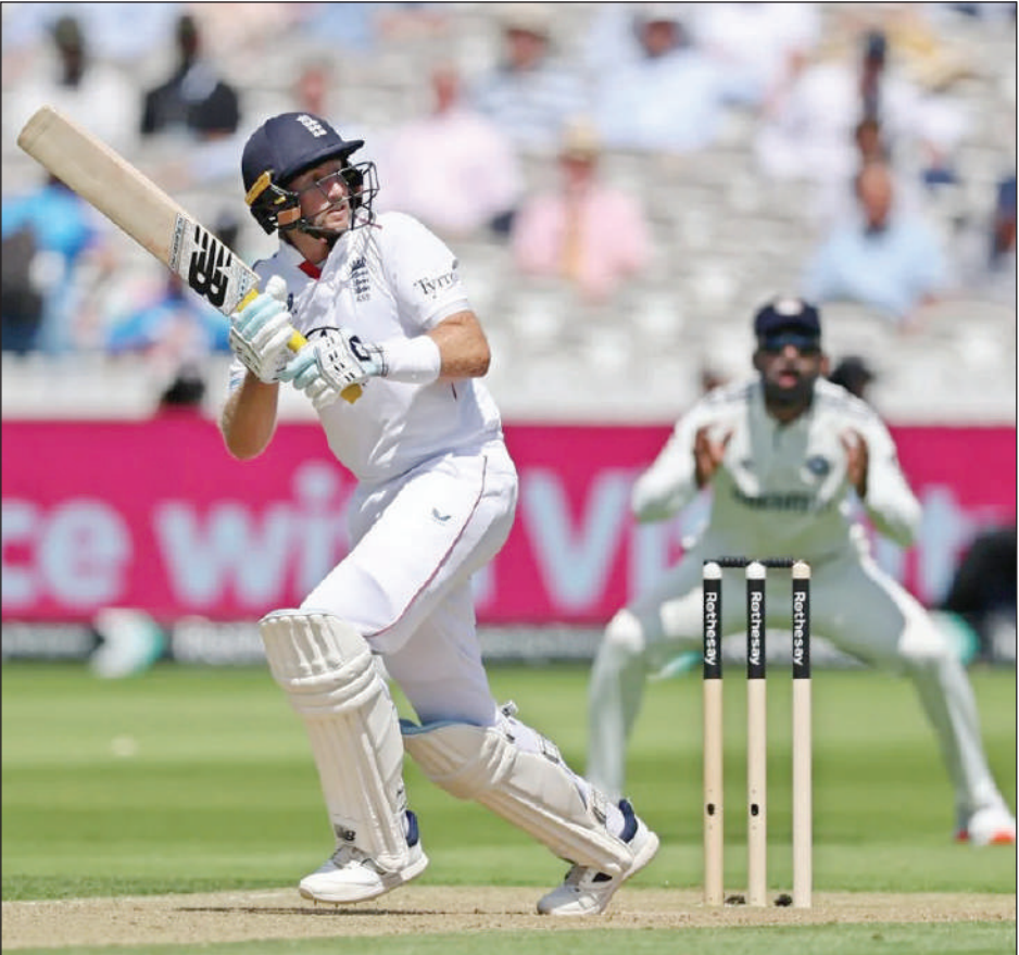
इंग्लैंड के बल्लेबाज जो रूट पारी के दौरान शॉट लगाते हुए ।

नई दिल्ली : भारतीय पुरुष फुटबॉल टीम जून में मिली दो हार से बृहस्पतिवार को जारी फीफा रैंकिंग में छह पायदान की गिरावट से 133वें स्थान पर खिसक गई। भारत चार जून को एक अंतरराष्ट्रीय मैत्री मैच में थाईलैंड (0–2) से हार गया और फिर एशियाई कप क्वालीफाईंग दौर के मैच में उसे निचली रैंकिंग वाली हांगकांग (0–1) से भी पराजय झेलनी पड़ी। इसके बाद मुख्य कोच मनोले मारकेज ने अखिल भारतीय फुटबॉल महासंघ ( एआइएफएफ) से नाता तोड़ लिया। इससे पहले पिछली बार भारतीय टीम की सबसे खराब रैंकिंग दिसंबर 2016 में थी जब वह 135वें स्थान पर थी। भारत की अब तक की सर्वश्रेष्ठ रैंकिंग फरवरी 1996 में 94 थी। भारतीय टीम के अभी 1113.22 रेटिंग अंक हैं जबकि पहले उसके 1132.03 अंक थे। वह 46 एशियाई देशों में 24वें स्थान पर है जिसमें जापान (17वीं रैंकिंग) सबसे आगे है।