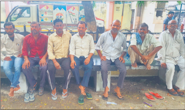
जिला अस्पताल में बैठे मृतक के गमगीन परिजन।