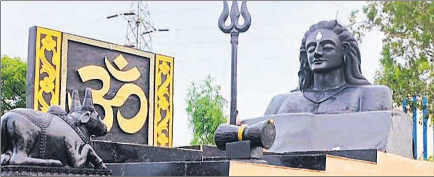
कांट रोड पर आदि योगी भोलेनाथ की विशालकाय प्रतिमा।

श्रावण का पहला सोमवार इस बार 14 जुलाई को पड़ेगा। इसके लिए पुलिस प्रशासन ने यातायात प्रबंधन के लिए रुट डायवर्जन कर दिया है। जो शनिवार से प्रभावी