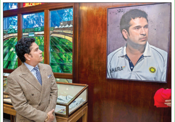
लॉर्ड्स स्थित एमसीसी संग्रहालय में अपने चित्र के अनावरण के दौरान स्वयं मौजूद सचिन तेंदुलकर ।

अंतिम मैच शनिवार को बर्मिंघम में खेला जाएगा। भारत ने 2006 में डर्बी में खेले गए एकमात्र टी-20 मैच में इंग्लैंड को हराया था। उसके बाद से भारतीय टीम इंग्लैंड के खिलाफ घरेलू और विदेशी धरती पर खेली गई प्रत्येक महिला टी-20 श्रृंखला में हारती रही थी। बुधवार की रात को खेले गए मैच में भारत की शानदार जीत में स्पिन गेंदबाजों ने अहम भूमिका निभाई। राधा यादव ( 2/15 ), श्री चरणी ( 2/30 ) और दीप्ति शर्मा ( 1/29 ) ने मिलकर पांच विकेट लिए और मेजबान टीम को सात विकेट पर 126 रन पर रोक दिया। इसके बाद सलामी बल्लेबाज