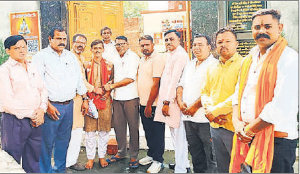
ठाकुरद्वारा में मंदिर के पुजारी को सम्मानित करते भाजपा कार्यकर्ता।