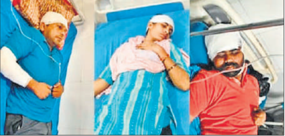
अस्पताल में भर्ती घायल।