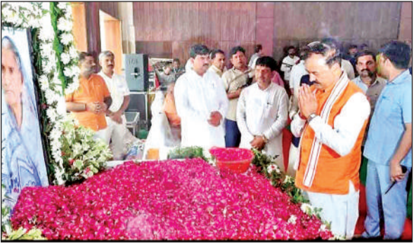
श्रद्धांजलि अर्पित करते उपमुख्यमंत्री केशव प्रसाद मौर्य।