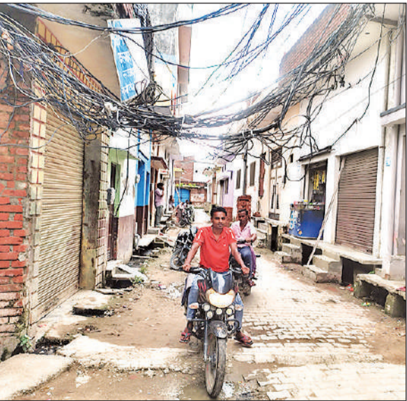
हाथ भर की ऊंचाई पर झूल रहे केबलों के नीचे से गुजरते लोग।

गए हैं। ये केबल भी बड़ा खतरा बने हुए हैं। बिजली खराब होने पर अपना केबल ढूँढना मुश्किल हो जाता है। जबकि उक्त क्षेत्रों के लोग कई बार विद्युत विभाग से विद्युत तारों को ऊंचा कराने व नए विद्युत पोल लगवाने की मांग कर चुके हैं। मगर समस्या का समाधान नहीं होने से लोगों में रोष व्याप्त है।