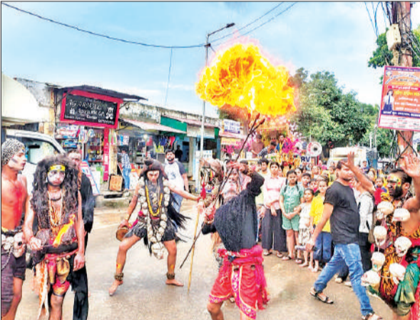
पालकी यात्रा में करतब दिखाते कलाकार।

पालकी फक्वारा चौक, स्टेशन रोड, मालवीय चौक, रामस्वरूप रोड, संभल गेट, लाठी बाजार, फड़याई बाजार, ब्रह्म बाजार, घासमंडी, बड़ा बाजार, हुसैनी बाजार, मुरादाबाद गेट होते हुए मंदिर परंपन्न हुई। इसके बाद मंदिर में साईं बाबा की आरती संपन्न कराई गई। शुक्रवार की