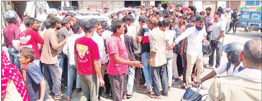
हादसे के बाद मौके पर लगी लोगों की भीड़।