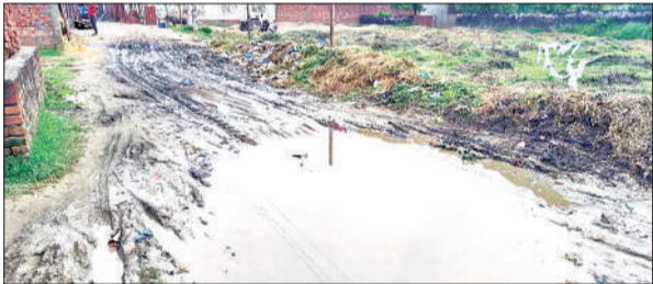
मार्ग पर जल भराव एवं गंदगी।