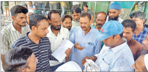
जमीन की गाप के दौरान राजस्व टीम के सामने बात रखते दोनों पक्षों के लोग।

● वही मुस्लिम पक्ष के लोग भूमि पर कर रहे अपना दावा