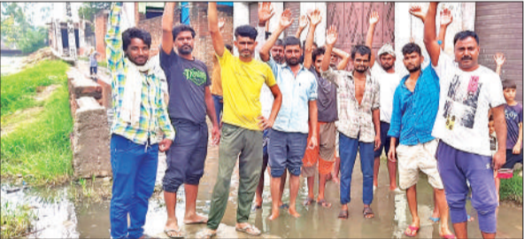
मदन गांव में जलभराव से निजात की मांग को लेकर प्रदर्शन करते ग्रामीण।