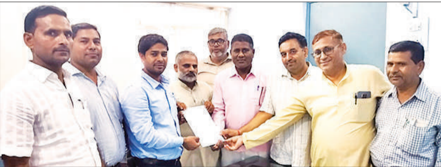
खंड शिक्षाधिकारी को ज्ञापन सौंपते जूनियर हाईस्कूल शिक्षक संघ के पदाधिकारी।