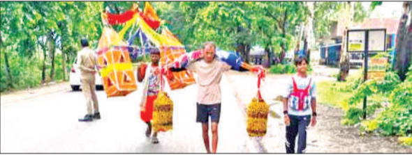
कांवड़ लेकर आते कांवड़िए।