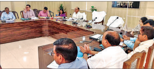
बैठक में संबंधित अधिकारियों को निर्देशित करते सीडीओ।