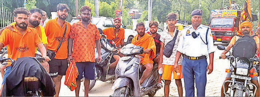
कांवड़ लेने जाते कांवड़िये।