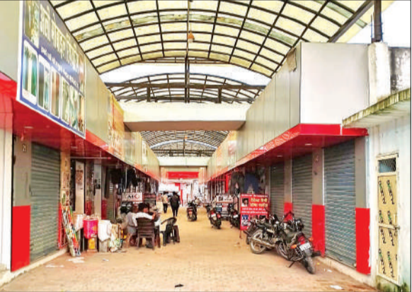
ब्लॉक मिलक के ग्राम धमौरा में बना शॉपिंग मॉल।

शॉपिंग मॉल के बाहर वाहनों के लिए पार्किंग, बच्चों के लिए झूले भी मिलेंगे। खास बात है शॉपिंग मॉल बनवाने में सरकार का कोई पैसा खर्च नहीं हो रहा है। दुकानदारों से ही एडवांस रुपये लेकर मॉल का निर्माण हो गया है। धमौरा के बाद शॉपिंग मॉल बनाने के लिए बिलासपुर और पटवाई में एक-एक एकड़ भूमि चिह्नित हो चुकी है। बाकी ब्लॉकों में बड़ी ग्राम पंचायतों