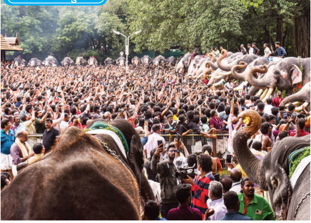
केरल के त्रिशूर स्थित श्री वडकुकुमानाथन मंदिर में गुरुवार को मलयालम महीने कार्किडकम की शुरुआत के उपलक्ष्य में हाथियों को खाना खिलाते लोग, इस रस्म को आनाखूट्टू कहा जाता है। यह भगवान गणेश को समर्पित उत्सव है जिसमें हजारों लोग भाग लेते हैं।