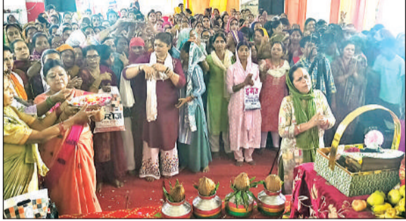
शिव महापुजाण कथा के दौरान आरती करते श्रद्धालु।