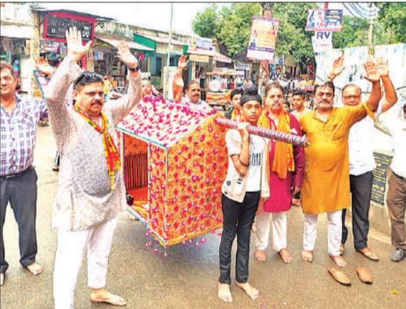
साईं बाबा की पालकी निकालते श्रद्धालु।