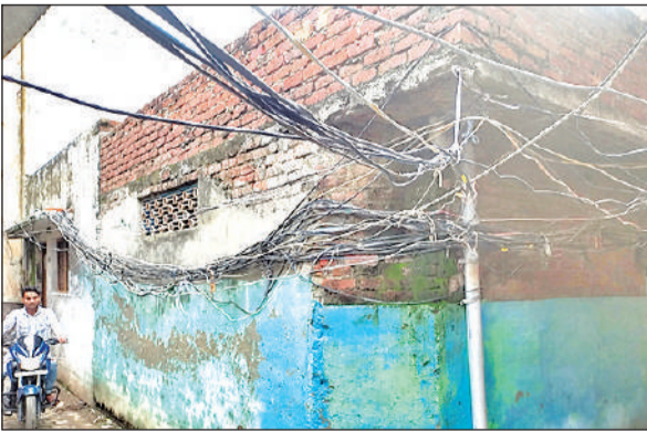
लक्ष्मण गंज क्षेत्र में दीवार के सहारे लटके बिजली के केबल। ● अमृत विचार

शहर में मोहल्ला लक्ष्मण गंज, कागजी मोहल्ला, सीकरी गेट, गणेश कॉलोनी, मिलक, पंचशील कॉलोनी, विकास नगर आदि क्षेत्रों में पर्याप्त विद्युत पोल नहीं होने से लोगों ने अपने घरों पर बिजली के लिए दूर-दूर से केबल खिंचवाये हैं। झुंड के रूप में गली-मोहल्लों में केबल लटके नजर आते हैं। कई जगह केबल इतने नीचे हैं कि आने-जाने वाले लोगों के सिर