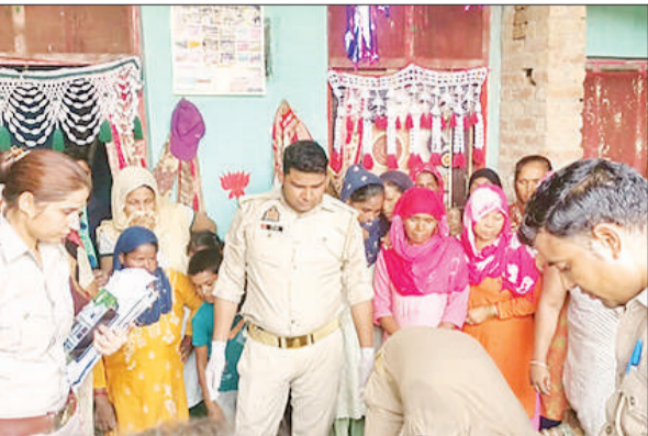
युवक की मौत के बाद पड़ताल करती पुलिस।

● परिजनों ने युवती के पिता और दो भाइयों पर लगाया हत्या का आरोप