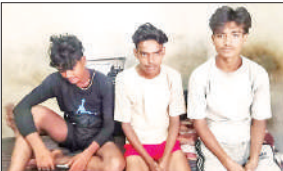
पीड़ित शिव भक्त।