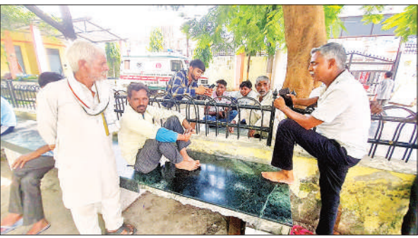
जिला अस्पताल में मौजूद मृतक के परिवारजन।

सामग्री लेने जा रहे युवक मौत हो गई। पुलिस ने शव को पोस्टमार्टम के लिए भेज दिया है। युवक की मौत से परिवार में कोहराम मचा हुआ है।