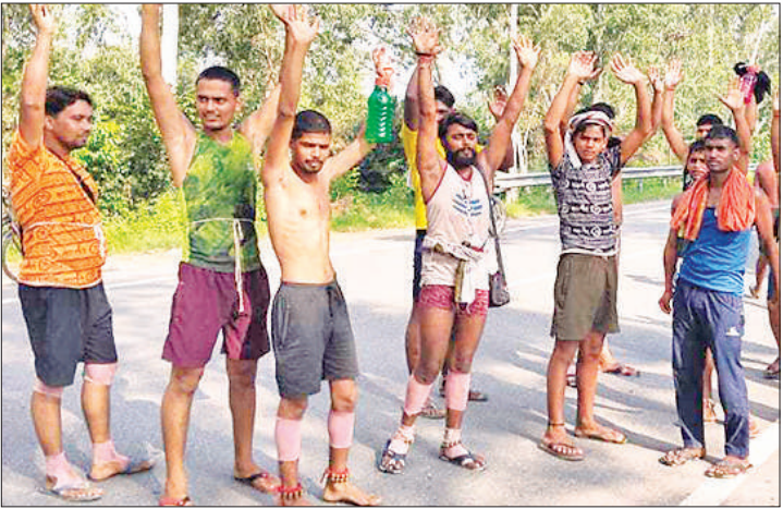
टक्कर लगने के बाद विरोध जताते कांवड़िये।