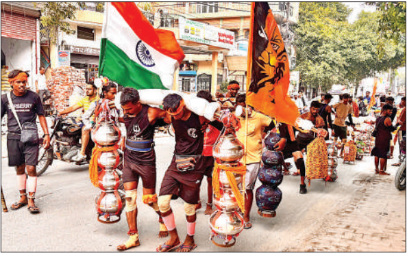
हरिद्वार से जल लेकर आता कांवड़ियों का जत्था।

नेशनल हाईवे पर शिव भक्तों का कांवड़ लेकर आना जाना जारी है। भोलेनाथ के भजनों पर झूमते हुए कांवड़िये हरिद्वार और ब्रजघाट से लगातार वापस आ रहे हैं। वहीं आसपास के क्षेत्रों के कांवड़िये जल लेने के लिए रवाना हो रहे हैं। सड़क पर डीजे पर बज रहे भजनों के चलते माहौल भक्तिमय हो गया। बोलबम के जयघोष से पूरा वातावरण शिवमय बना रहा। जगह जगह कांवड़ यात्री विश्राम करते नजर आए। दोपहर तक मार्ग पर कांवड़ियों की संख्या में बढ़ोत्तरी होने लगी। हाईवे पर कांवड़ यात्रियों का दबाव बढ़ने से यातायात ठहरने लगा। कहीं कहीं जाम की स्थिति बनती नजर आई। जाम खुलवाने के लिए पुलिस दिन भर जुझती नजर आई।