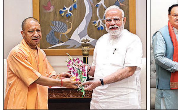
शनिवार को नई दिल्ली में प्रधानमंत्री नरेंद्र मोदी, भाजपा अध्यक्ष जेपी नड्डा और गृह मंत्री अमित शाह से अलग–अलग शिफ्टाचार भेंट करते मुख्यमंत्री योगी आदित्यनाथ।