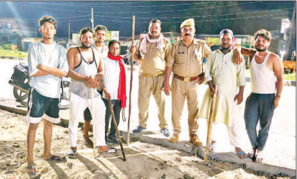
भोट के तालकपुर गांव में लोगों को जागरूक करती पुलिस।