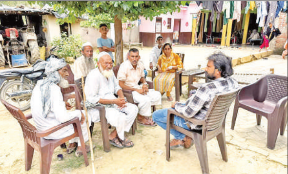
घर में बैठकर चर्चा करते लोग।