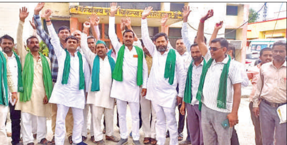
एसीएमओ कार्यालय पर प्रदर्शन करते भाकियू कार्यकर्ता।