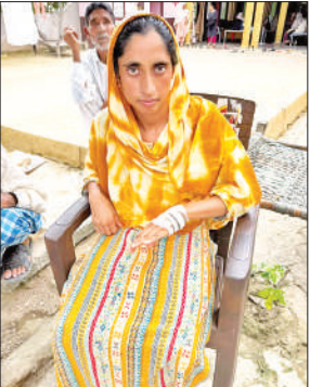
हाथ में लगे छर्रे को दिखाती युवती।