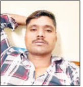
मृतक का फाइल फोटो

अमृत विचार: शुक्रवार देर रात शाहबाद-बिलारी मार्ग पर स्थित मिर्तपुर अहरोला के निकट ई-रिक्शा और बाइक की आमने-सामने टक्कर हो गई। हादसे में कांवड़ की सामग्री लेने जा रहे युवक मौत हो गई। पुलिस ने शव को पोस्टमार्टम के लिए भेज दिया है। युवक की मौत से परिवार में कोहराम मचा हुआ है।