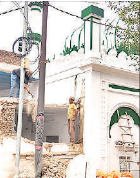
मस्जिद का अतिक्रमण तोड़ते लोग।

संभल-बहजोई मुख्य मार्ग के चौड़ीकरण की कवायद के चलते प्रशासन मार्ग को अतिक्रमण मुक्त करने में लगा है। इसी के तहत जहां हयातनगर में कई दुकानों पर बुलडोजर चला सड़क किनारे बनी मस्जिद को भी तोड़ा गया। दरगाह को कमेटी के लोग खुद पीछे हटा रहे हैं। पिछले दिनों हुई नापजोख में चौधरी सराय में नाले से सटी फूल वाली मस्जिद का आठ फिट हिस्सा अतिक्रमण के रूप में चिन्हित