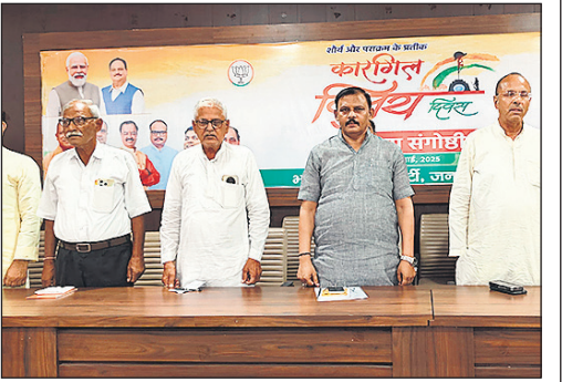
शहीद सैनिकों को श्रद्धांजलि देते भाजपा पदाधिकारी।