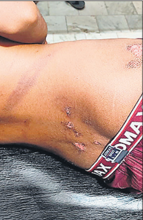
किशोरों के शरीर पर चोटों के निशान।

अमृत विचार: नखासा थाना क्षेत्र में कांवड़ यात्रा देखने व मां की दवाई लेने आए किशोरों को चोर समझ कर भीड़ ने पकड़ लिया और खंभे से बांधकर पीटा। डायल 112 पुलिस ने किसी तरह किशोर को भीड़ के चंगुल से छुड़ाया। माव लीचिंग के इस मामले में पुलिस ने चार दिन बाद मुकदमा दर्ज किया है। संभल के नाहरटेर गांव निवासी दलित वर्ग के दो किशोर 22 जुलाई की शाम 7:30 बजे कावड़ यात्रा देखने व बढ़ई वाली बस्ती में डॉक्टर से मां की दवाई लेने आए थे। रात में दोनों किशोर घुसे तो मोहल्ले के लोगों को उन पर संदेह हुआ। चोर समझकर शोर मचाया तो तमाम लोग इकट्ठा हो गए। दोनों किशोरों को पकड़ लिया और लात चूंसों व लाठी डंडों से मारा पीटा गया। इसके बाद दोनों को बिजली के खंभे से बांधकर पीटा। किसी ने पुलिस को सूचना दी तो डायल 112 पुलिस की टीम मौके पर पहुंची। पुलिस किसी तरह दोनों किशोरों को भीड़ के