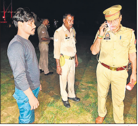
अधिकारियों को जानकारी देते थाना प्रभारी।