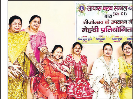
मेहंदी रचे हाथ दिखाती महिलाएं।