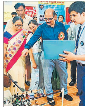
एसडीएम इंटर कॉलेज में लगी प्रदर्शनी में प्रोजेक्ट के बारे में जानकारी देते छात्र।