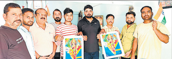
कारगिल विजय दिवस मनाते व्यापार मंडल के पदाधिकारी।