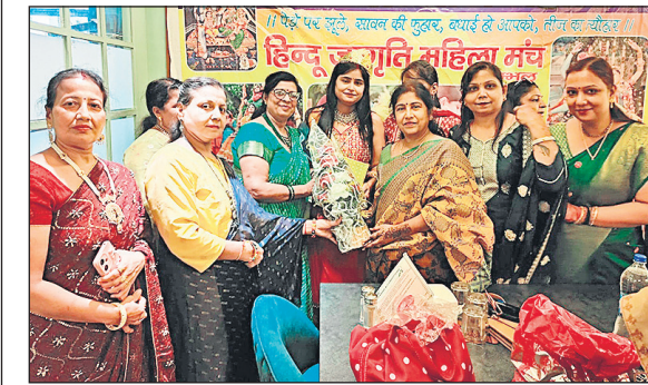
तीजोत्सव में शामिल महिलाएं।