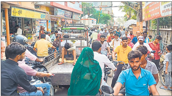
बहजौई के बाजार में जाम में फंसे लोग।