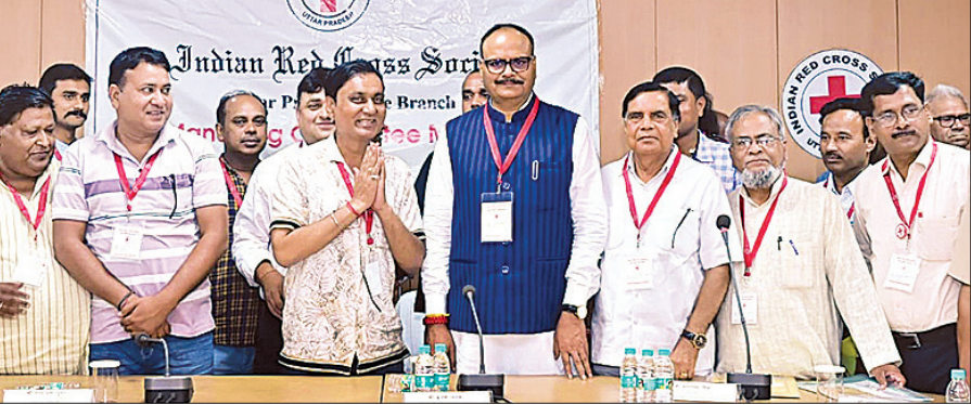
लखनऊ में आयोजित कार्यक्रम में शामिल उप मुख्यमंत्री ब्रजेश पाठक व रेडक्रॉस सोसाइटी के पदाधिकारी।

अमृत विचार, लखनऊ : सपा ने शनिवार को पूरे प्रदेश में आरक्षण दिवस को संविधान मानस्तंभ दिवस के रूप में मनाया। सपा प्रमुख अखिलेश यादव ने कहा है कि भारत के संविधान की प्रति के सान्निध्य में संविधान मानस्तंभ स्थापना दिवस आयोजित करके हम ‘सामाजिक न्याय’ व समता-समानता’ और आरक्षण को बचाए-बनाए रखने का अपना संकल्प दोहरा रहे हैं। इसके पीछे यही मूल भावना है कि संविधान मानस्तंभ वस्तुतः पीपीए प्रकाशस्तंभ के रूप में हमारे सामाजिक न्याय के राज की स्थापना के संकल्प का मार्ग सदैव प्रकाशित और प्रशस्त करता रहे। जब संविधान बचेगा तभी आरक्षण बचेगा। संविधान ही ढाल है, संविधान ही कवच है।