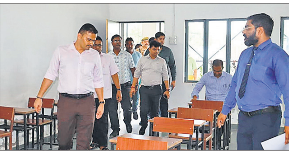
परीक्षा केंद्र पर व्यवस्थाओं का जायजा लेते एसपी व एडीएम।

संभल में शंकर भूषण शरण जनता इंटर कॉलेज, महात्मा गांधी मेमोरियल कॉलेज, आचार्य मुक्तेश हकीम रईस इंटर कॉलेज, सरस्वती इंटर कॉलेज, बाल विद्या मंदिर सीनियर सेकेंडरी स्कूल, राजकीय कन्या इंटर कॉलेज, जवाहरलाल मेमोरियल, नगर पंचायत इंटर कॉलेज, हिंद इंटर कॉलेज, राजकीय महाविद्यालय, जेडीयू इंटर कॉलेज