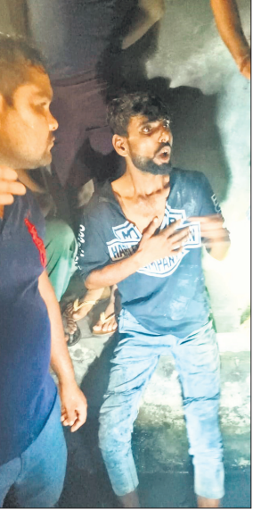
ग्रामीणों को चोर न होने की जानकारी देता युवक।

दूसरा मामला थाना बछरायूं के गांव नसीरपुर का है। जहां आम के बाग की रखवाली कर रहे दो भाइयों