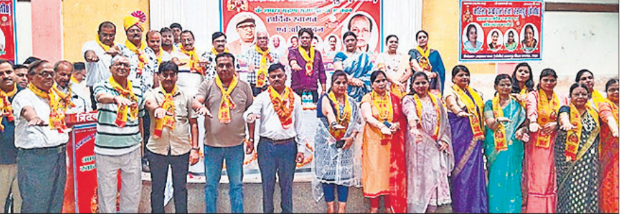
शपथ लेते अग्रवाल सभा हसनपुर के पदाधिकारी।