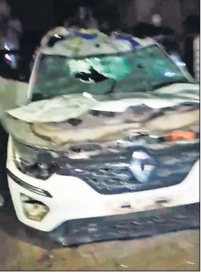
ग्रामीणों ने कार में की तोड़फोड़।