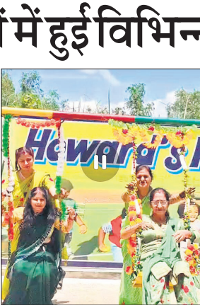
कांड में झुला झूलते स्टाफ व छात्राएं।