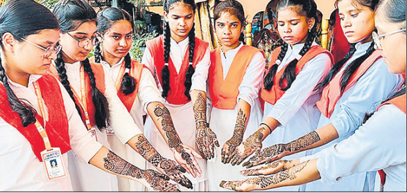
हाथों पर रची मेहंदी दिखाती छात्राएं।

धारदार हथियार से हमला किया गया। सूचना पर बछरायूं पुलिस मौके पर पहुंची और घायलों को अस्पताल भेजा। थाना प्रभारी प्रमोद कुमार ने बताया कि घटना चोर के शक में हुई है। पीड़ित की तहरीर के आधार पर अज्ञात ग्रामीणों के खिलाफ मुकदमा दर्ज कर लिया गया है।