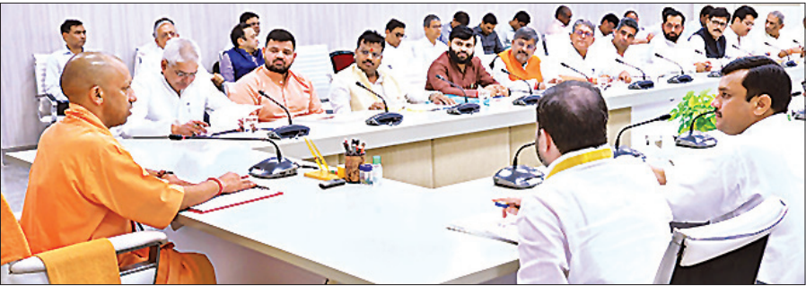
अयोध्या और देवीपाटन मंडल के जनप्रतिनिधियों व अधिकारियों के साथ बैठक करते मुख्यमंत्री योगी।

मुख्यमंत्री ने कहा कि सरकार नगर निकायों को अलग से वित्तीय संसाधन उपलब्ध कराती है और सीएम गिड योजना के माध्यम से नगरों के समग्र विकास को नई दिशा दी जा रही है। निर्देश दिए कि नगर निगम एवं नगर निकाय अपने-अपने क्षेत्र में संचालित विकास योजनाओं की समीक्षा करते समय स्थानीय जनप्रतिनिधियों को अवश्य शामिल करें।