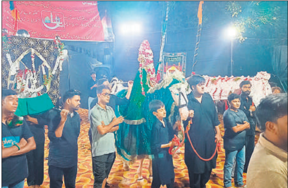
सिरसी में मातमी जुलूस निकालते शिया मुसलमान।

अजादारों ने अपने लहू से यह पैगाम दिया कि हम हर दौर में अपने इमाम के साथ खड़े हैं। जुलूस में गोहर ए अजा, दास्तान ए कर्बला, रैनक ए अजा, बाहर ए रजा, फैज ए पंजतन और गुंचे इस्लाम मकामी अंजुनमों ने शिरकत की। जुलूस के दौरान सुरक्षा के इंतजाम रहे।