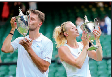
मिश्रित युगल फाइनल जीतने के बाद नीदरलैंड के विजेता सेम वरबीक (बाएं) और चेक गणराज्य की कैटरिना सिनियाकोवा (दाएं) ट्रॉफी चूमते हुए।

हैं। उन्होंने पिछले साल पेरिस ओलंपिक खेलों में टॉमस मचाक के साथ मिश्रित युगल में स्वर्ण पदक जीता था। उन्होंने 2021 के टोक्यो ओलंपिक खेलों में बारबोरा क्रेजिकोवा के साथ मिलकर महिला युगल का स्वर्ण पदक जीता था।