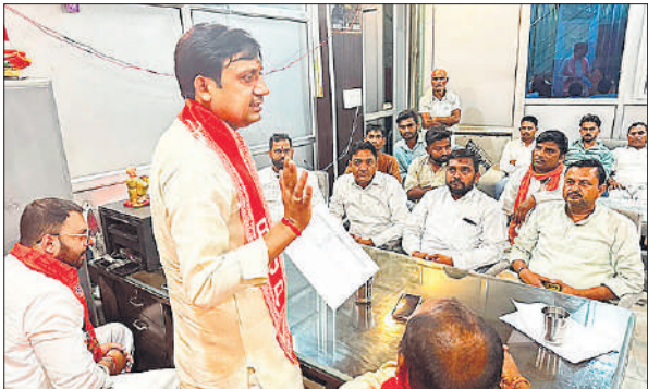
बैठक को संबोधित करते भाजपा जिलाध्यक्ष। ● अमृत विचार

उन्होंने कहा कि पंचायत चुनाव में अधिक समय नहीं बचा है। अब कार्यकर्ताओं को और अधिक क्षमता से कार्य करना होगा। गांव-गांव और मोहल्लों में पंचायतों के माध्यम से लोगों को जानकारी देनी होगी। गांवों में भी भरपूर बिजली आ रही है। सुविधाओं और संसाधनों में इजाफा हो रहा है। किसान सम्मान निधि, आयुष्मान भारत योजना, उज्ज्वला