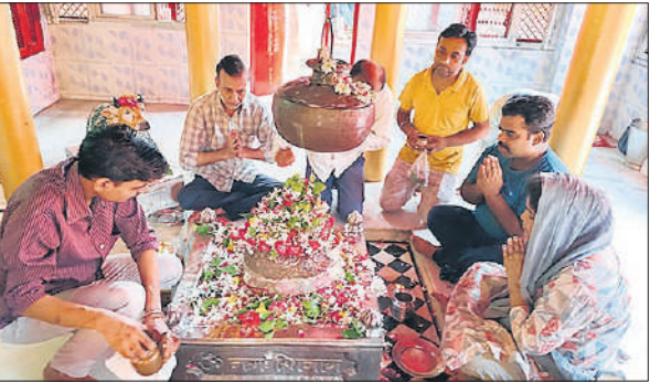
संभल में सूर्यकुंड तीर्थ मंदिर में पूजा व अनुष्ठान करते श्रद्धालु।