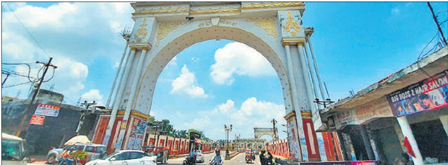
शुक्रवार को रामपुर में उमड़ते-धुमड़ते बादल। ● अमृत विचार

तेज कर दी हैं। मंदिर प्रबंधन भी व्यवस्थाओं को मुकम्मल करने में जुटा है।