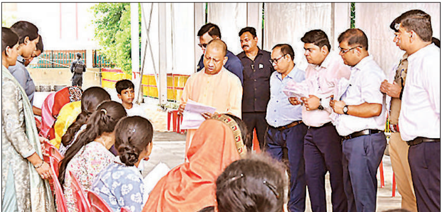
गोरखपुर के गोरखनाथ मंदिर में आयोजित जनता दर्शन में लोगों की समस्याएं सुनते मुख्यमंत्री योगी, साथ में मौजूद अधिकारी।

मुख्यमंत्री शुक्रवार सुबह जनता दर्शन में गोरखनाथ मंदिर परिसर में कुर्सियों पर बैठए गए लोगों तक पहुंचे और एक-एक करके सबकी समस्याएं सुनीं। अधिकारियों से कहा कि जनता की हर पीड़ा का निवारण सुनिश्चित किया जाए। इसमें किसी भी तरह की शिथिलता नहीं होनी चाहिए। मुख्यमंत्री के