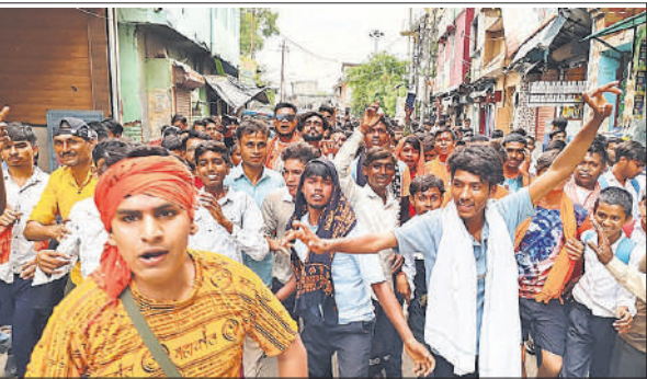
हरिद्वार कांवड़ लेने जाने से पहले नाचते गाते कांवड़िये।

सिलसिला चलते रहने की वजह से माहौल भक्तिमय नजर आया। संभल के अलावा सिरसी, सौधन, पंवासा, बहजोई, धनारी, बबराला,