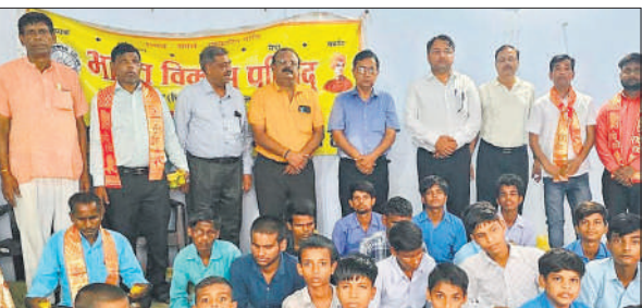
कार्यक्रम के दौरान विद्यालय के बच्चे व संगठन के पदाधिकारी।