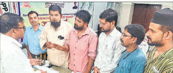
ईओ को ज्ञापन सौंप समस्या से अवगत कराते लोग।