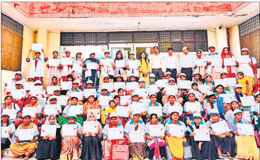
कार्यक्रम के दौरान मौजूद प्रशिक्षक व अधिकारी