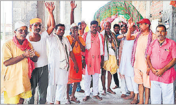
भमरौआ मंदिर में जलामिषेक करने के लिए पहुंचे कांवड़िये।

शुक्रवार को सावन माह के पहले दिन शिव मंदिरों में भक्तों ने विधि विधान से पूजा अर्चना की। भारी संख्या में शिव भक्त ब्रजघाट और हरिद्वार से जल लाकर प्राचीन मंदिरों में चढ़ाते हैं। बृहस्पतिवार को कुछ भक्त डाक कांवड़ लाने के लिए रवाना हो गए थे। शुक्रवार को सावन का पहला दिन होने की वजह से भक्त कांवड़ लेकर भमरौआ मंदिर पहुंचे, जहां पर मंदिर की परिक्रमा करने के बाद बोम बम, हर-हर महादेव, जय-जय शिव शंभु के उद्घोष के साथ शिवालयों में प्रवेश किया। गंगाजल से