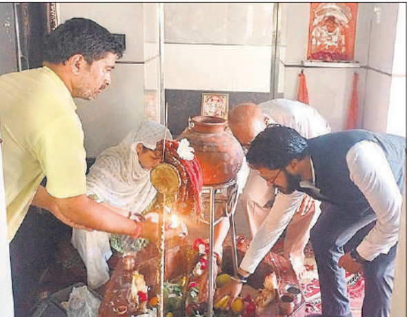
सुभाष स्थित शिव मंदिर में आरती करते श्रद्धालु।

शुक्रवार को सावन माह के पहले दिन सुबह से ही श्रद्धालुओं का शिव मंदिरों पर पहुंच कर जलाभिषेक करने का क्रम आरंभ हो गया। नगर के सीता रोड स्थित मूंछों वाले शिव मंदिर, सुभाष रोड स्थित शिव मंदिर, बड़ा महादेव स्थित शिव मंदिर, मुंसिफ रोड स्थित प्राचीन शिव मंदिर, मिलक स्थित शिव मंदिर, आवास विकास स्थित शिवालय मंदिर, मोती मोहल्ला स्थित अर्द्धनारीशंकर शिव मंदिर, गोलागंज स्थित शिव मंदिर,