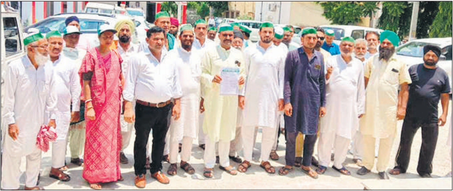
तहसील में प्रदर्शन करते किसान।