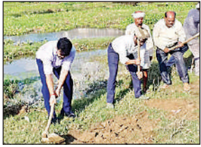
श्रावस्ती में फावड़ा चलाकर कार्य की शुरुआत करते अधिकारी, साथ में अन्य।

बूढ़ी राप्ती नदी की कुल लंबाई 67.03 किमी है, और इसका कैचमेंट एरिया 18356.64 हेक्टेयर है। नदी का 16.91 किमी हिस्सा अवरोधित है, जबकि शेष 51.12 किमी का हिस्सा स्वाभाविक रूप में