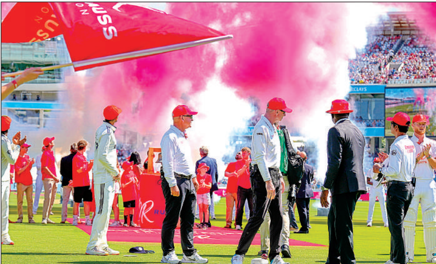
भारत और इंग्लैंड के खिलाड़ी, अपायर और अन्य लोगों के साथ, शुक्रवार को लंदन के लॉर्ड्स क्रिकेट ग्राउंड पर तीसरे टेस्ट क्रिकेट मैच के दूसरे दिन खेल शुरू होने से पहले रूथ स्ट्रॉस फाउंडेशन के लिए एक श्रद्धांजलि समारोह आयोजित किया गया।

है। आपका ध्यान अगर देश को गौरवान्वित करने की ओर है और आपकी भूमिका किसी भी अन्य चीज़ से कहीं ज्यादा बड़ी है और आप उस लक्ष्य, उस उद्देश्य के प्रति प्रतिबद्ध हैं तो मुझे लगता है कि बाकी सब ठीक है। मुझे लगता है कि वह उद्देश्य और वह लक्ष्य किसी भी अन्य चीज से कहीं ज्यादा अहम है। इंग्लैंड के खिलाफ लॉर्ड्स में तीसरे टेस्ट के इतर गंभीर ने यह भी स्वीकार किया कि उन्हें खेल से खुद को अलग करना मुश्किल लगता है। उन्होंने खुलासा किया कि बर्मिंघम में इंग्लैंड पर भारत की जीत के कुछ ही मिनटों बाद वह टीम संयोजनों के बारे में सोच रहे थे। गंभीर से जब पूछा गया कि वह तनाव मुक्त कैसे होते है तो उन्होंने कहा यह एक कठिन सवाल है।