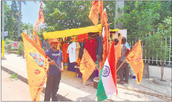
हाईवे पर बिकते भगवा रंग के झंडे।

डीएम के आदेश पर रोजाना एआरटीओ और पीटीओ की ओर से वाहन चैकिंग अभियान चलाया जाता है। इसके बाद सीज किए गए वाहनों को दोनों अधिकारी रोडवेज परिसर में खड़ा करा रहे हैं। शुक्रवार से सावन शुरू होने के बाद शनिवार से जल लाने के लिए कांवड़िये निकलेगे, इससे उन्हें परेशानी हो सकती है। इसको देखते हुए एआरएम प्रशासन ने एआरटीओ को पत्र लिखकर वाहन हटाने के लिए कहा है।