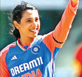
भारतीय उपकप्तान समृति मंधाना।

की बदौलत भारत ने इंग्लैंड को सात विकेट पर 126 रन पर रोक दिया और फिर यह मैच छह विकेट से जीतकर श्रृंखला में 3-1 की निर्णायक बढ़त हासिल की।