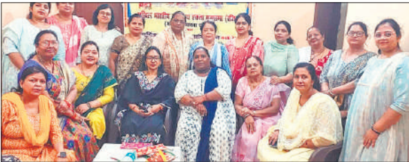
तीज महोत्सव की तैयारियों के संबंध में बैठक करती महिलाएं।