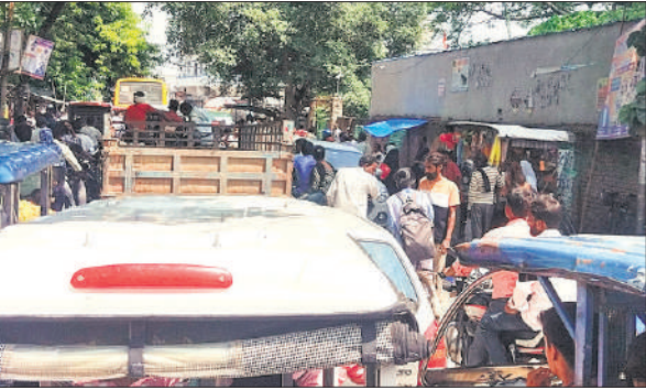
पुराने एसपी बंगला के सामने लगा भीषण जाम।

शहर में जाम की समस्या वैसे तो काफी समय से है। इसकी वजह है कि शहर में कोई पार्किंग स्थल नहीं है, जिससे चालक अपने वाहनों को पार्क कर सकें। मजबूरन चालक वाहनों को शहर की प्रमुख सड़कों पर ही खड़ा कर देते हैं और बाजार, अस्पताल, दफ्तरों आदि में जाकर अपना काम निपटाते हैं। दोनों तरफ वाहनों के खड़ा होने से सड़क पर जगह तक नहीं बचती है। इससे बाइक तो छोड़ दीजिए पैदल गुजरना भी मुश्किल हो जाता है।