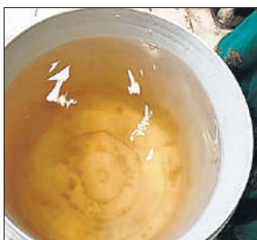
कर्मचारी कॉलोनी में लोगों के घरों में टकी से आने वाला गंदा व बदबूदार पानी।

टंकियों से निकलते गंदे पानी का वीडियो बनाकर सोशल मीडिया पर वायरल किया। इसकी जानकारी मिलने पर टीम पहुंची और शाम को