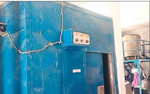
धूल फांक रही पैकिंग मशीन।

जनपद में दुग्ध उत्पादन को बढ़ावा देकर ग्रामीणों की माली हालत मजबूत करने के लिए सलेमपुर कोन में पराग डेयरी की स्थापना की गई, जिससे ग्रामीणों का उनके दूध का उचित दाम मिल सके। दूध संग्रह कर प्लांट में दुग्ध उत्पाद बनने शुरू हुए। इसमें पैक्ड दूध के साथ दही, मट्ठा से लेकर