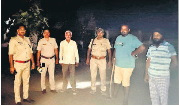
कांबिंग कर तेंदुआ को खदेड़ते वनकर्मी।