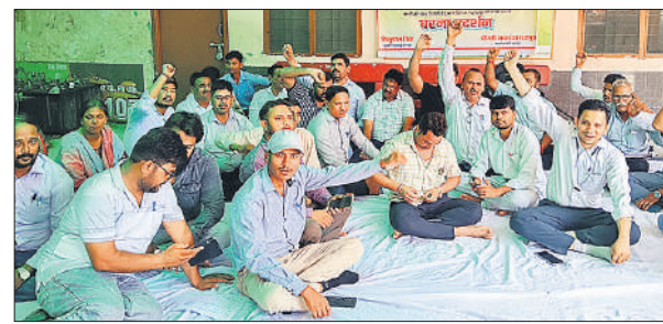
पूरनपुर तहसील में धरना प्रदर्शन करते लेखपाल।