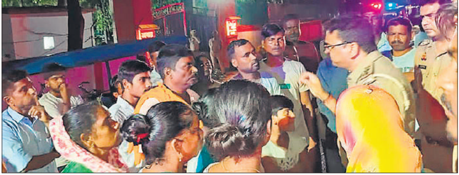
कार्रवाई की मांग करते मृतक के परिजन व अन्य।