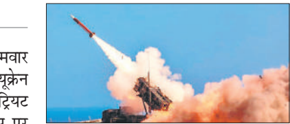
● अमेरिकी राष्ट्रपति ने समझौते पर सहमत न होने पर पुतिन की आलोचना की

उन्होंने कहा, यूरोपीय संघ इसके लिए भुगतान कर रहा है। हम इसके लिए कुछ भी भुगतान नहीं कर रहे हैं। अमेरिका के राष्ट्रपति ने रूसी राष्ट्रपति व्लादिमीर पुतिन पर टिप्पणी करते हुए कहा कि उन्होंने वास्तव में बहुत से लोगों को चौंका दिया है। वह बातें तो अच्छी करते हैं और फिर शाम को सभी पर बमबारी कर देते हैं। इसमें थोड़ी समस्या है और यह उन्हें पसंद नहीं है। जब उनसे पूछा गया कि क्या वह रूस पर प्रतिबंधों की घोषणा करेंगे, तो उन्होंने इसे तार टाल दिया।