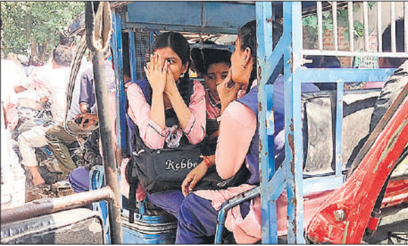
पुराने एसपी बंगला के सामने जाम में फंसे स्कूली बच्चे।

सोमवार तड़के करीब 3 बजे अचानक आसमान में लपक रही बिजली के बीच बारिश शुरू हुई।