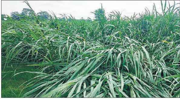
ललौरीखेड़ा क्षेत्र में खेत में बिछी फसल।