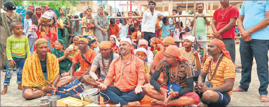
गौरीशंकर मंदिर में पहले सोमवार को जलाभिषेक करने के लिए बाबा भोलेनाथ की प्रार्थना करते कांवड़िए।

शहर के ऐतिहासिक गौरीशंकर मंदिर, अर्द्धनारीश्वर मंदिर, दूधिया नाथ मंदिर आदि में सावन के पहले सोमवार को आकर्षक ढंग से सजाया गया। पहले सोमवार का हर जगह उत्साह देखने को मिला। श्रद्धालुओं ने घरों में पूजा अर्चना करने के बाद मंदिर में बाबा का जलाभिषेक किया। सुबह 5 बजे से कतार लगना शुरू हो गई। व्यवस्था बनाने के लिए पुलिस प्रशासन की ओर से बैरिकेडिंग कराई गई थी। जहां एक-एक कर श्रद्धालुओं को शिवालय में भेजा गया। शिव भक्तों ने बाबा को बेलपत्र, भांग, धतूरा चढ़ाने के बाद दूध और गंगाजल से जलाभिषेक किया और मनौती मांगी। दोपहर डेढ़ बजे तक मंदिर प्रांगण में श्रद्धालुओं की भीड़ जुटी रही। हालांकि दो बजे के बाद भीड़ कम