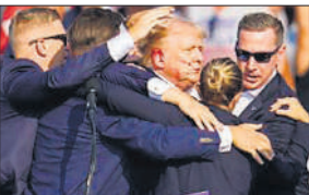
● 45 मिनट पहले मिली थी संदिग्ध शख्स की सूचना, नहीं की कार्रवाई

पिछले वर्ष ट्रंप पर राष्ट्रपति चुनाव के प्रचार के दौरान पेंसिलवेनिया के बटलर में आठ गोलीयां चलाई गई थीं। एक कमांडो ने तत्काल बंदूकधारी को मार गिराया था लेकिन गोलीबारी में एक व्यक्ति की मौत और दो लोगों के घायल होने की घटना ने खुफिया सेवा पर गंभीर सवाल खड़े कर दिए थे। सीनेट की होमलैंड सिक्योरिटी एंड गवर्नमेंटल अफेयर्स कमेटी की रिपोर्ट में कहा गया है जो हुआ वह माफ करने