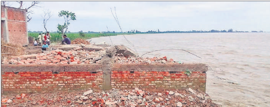
करसौर गांव में कटान के डर से तोड़ा गया मकान।

अमृत विचार: शारदा नदी की तलहटी में बसे गांवों के लोग दशकों से बाढ़ का दर्श झेल रहे हैं। लगातार शारदा नदी क्षेत्र में बाढ़ और कटान रूपी भयंकर तबाही मचाती चली आ रही है। सड़क के किनारे तंबू के अंदर पूरे परिवार के साथ रह रहे बाढ़ पीड़ितों ने बताया कि सड़क किनारे भीषण गर्मी और उमस में तिरपाल के नीचे ज़िंदगी जी रहे हैं उन्हें न तो समय से खाना मिल पा रहा है और न पानी मिल पा रहा है। रात में प्रकाश की कोई बेहतर व्यवस्था न होने से जहरीले जीव-जंतुओं का खतरा निरंतर बना रहता है। शारदा नदी क्षेत्र में कृषि भूमि, वन भूमि, वेश कीमती जंगल