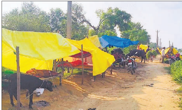
सड़क किनारे बसे कटान पीड़ित परिवार।

रोकने का स्थाई समाधान कराने की मांग की है। प्रतिवर्ष कोई न कोई गांव शारदा की जद में आ ही जाता है। शारदा नदी हर वर्ष भयंकर भू कटान करते हुए क्षेत्र में तबाही पीड़ितों को मात्र आश्वासन दिया जा रहा है। पीड़ित परिवारों ने योगी सरकार से बाढ़ और कटान