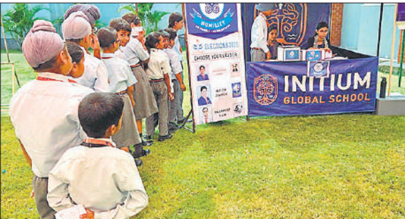
मतदान प्रक्रिया में प्रतिभाग करते बच्चे।