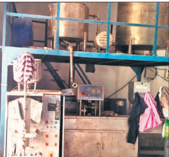
● अमृत विचार प्लांट में कबाड़ हो रही बंद मशीनें।

प्रभावित हुए लोग : पराग डेयरी का प्लांट बंद होने से जिले में श्वेत क्रांति का देखा गया सपना ही चकनाचूर नहीं हो गया, बल्कि प्रत्यक्ष एवं अप्रत्यक्ष रूप से जुड़े तमाम लोग बेरोजगार हो गए थे। बताते हैं कि पैक्ड उत्पाद बनने से जिले भर में इनकी विक्री के लिए काउंटर लगते थे, जो लोगों के लिए कमाई का जरिया बन गए थे। विभागीय लोग बताते हैं कि अब पैक्ड उत्पाद लखनऊ से आते हैं, जिसमें समय लगता है। इसलिए लोगों का