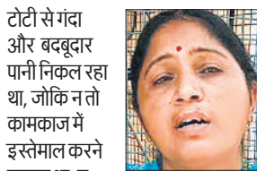
टोटी से गंदा और बदबूदार पानी निकल रहा था, जोकि न तो कामकाज में इस्तेमाल करने लायक था, न पीने लायक। जिससे बड़ी दिक्कत हुई। मूलभूत सुविधाएं दुरुस्त कराई जानी चाहिए।