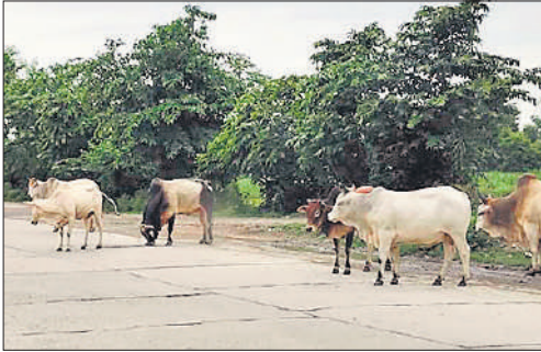
पीलीभीत-पूरनपुर हाईवे पर टोल प्लाजा के पास छुट्टा पशुओं का झुंड।

जनपद में हर साल ही सड़क सुरक्षा के नाम पर लंबी चौड़े दावे किए जाते हैं। आयोजनों में वाहन चलाने समय हेलमेट और सीट बेल्ट लगाने की नसीहतें भी दी जाती हैं। हाईवे समेत सड़कों पर संकेतांक लगाने के साथ व्हाइट पेंटिंग की