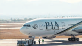
● जेहा में उतरने के बाद आख़िर अधिकारियों ने वापस लौटाया