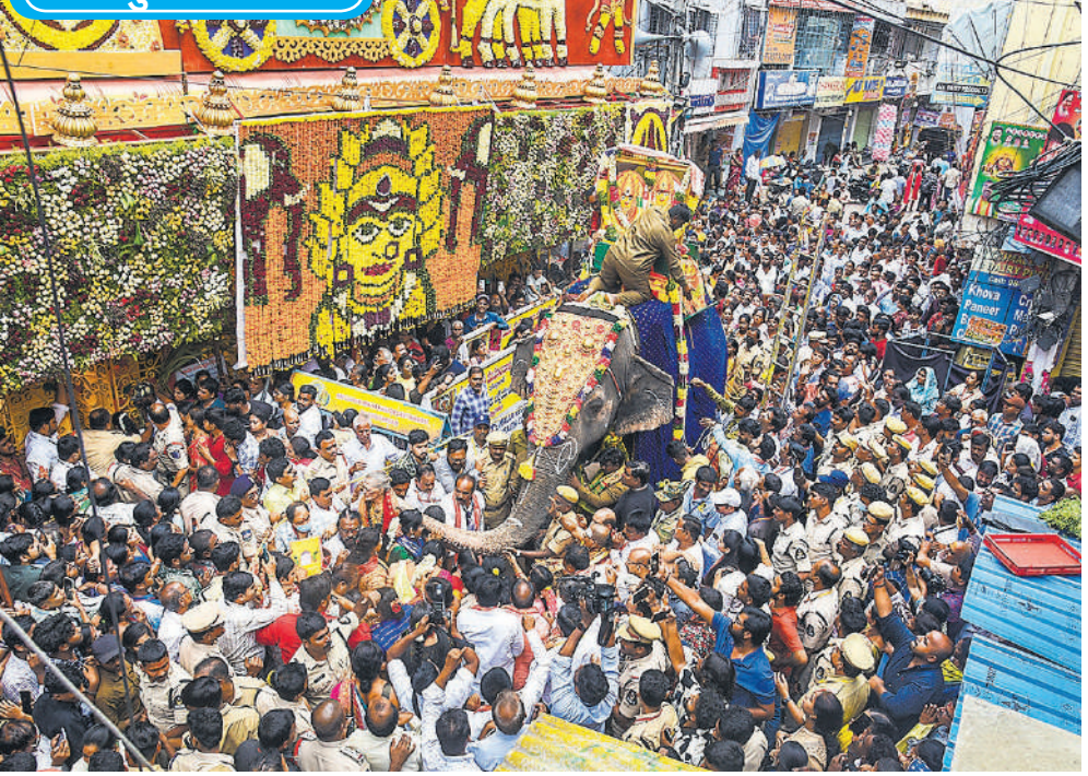
तेलंगाना के सिकंदराबाद में सोमवार को बोनालु जथारा उत्सव के दौरान निकाले गए जुलूस में हजारों श्रद्धालुओं ने भाग लिया। यह उत्सव तेलंगाना का एक वार्षिक हिंदू त्योहार है जो देवी महाकाली को समर्पित है और हैदराबाद और सिकंदराबाद के जुड़वां शहरों में विशेष रूप से मनाया जाता है।