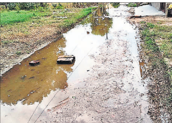
कर्मचारी कॉलोनी में सड़क पर फैली कीचड़।

बता दें कि शहर के नकटादाना कर्मचारी कॉलोनी में सरकारी कर्मचारी परिवार संग रहते हैं। इस कॉलोनी में नगरपालिका की पाइप लाइन से पेयजल की आपूर्ति की जाती है, लेकिन यहां सप्ताह भर से कॉलोनी में पानी की सप्लाई बंद पर नहीं आ सकी है। कॉलोनी वासियों को माँने तो कुछ दिन पानी आया नहीं और जब टोटियों ने पानी की धार निकली तो इसे इस्तेमाल ही