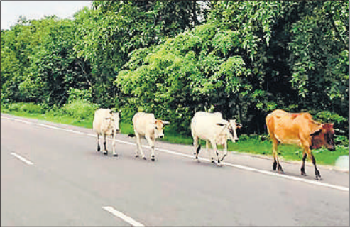
माला कॉलोनी के आगे हाईवे से गुजरते छुट्टा पशु।