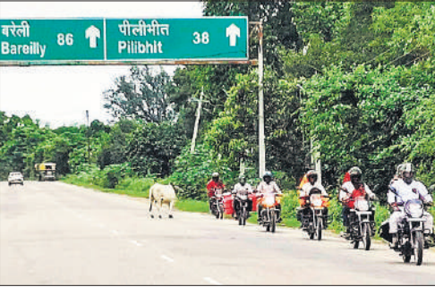
पीलीभीत-पूरनपुर हाईवे पर छुट्टा पशु से बचकर निकलते बाइक सवार।

● असम हाईवे पर घूम रहे छुट्टा पशुओं के झुंड दिन-रात बन रहे मुसीबत