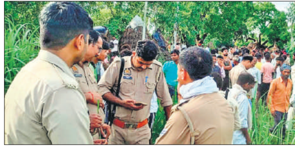
घटना के बाद मौके पर जुटी पुलिस।

जनपद के न्यूरिया क्षेत्र के गांव फुलहर में सोमवार तड़के हुई बाघ हमले की घटना से सनसनी