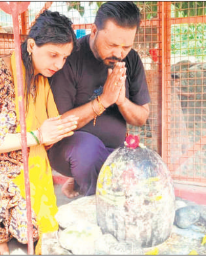
बिलसंडा के शिवालय में पूजा अर्चना करते दंपती।

नाथ मंदिर और अर्धनारीश्वर मंदिर में भी श्रद्धालुओं की भीड़ रही। श्रद्धालुओं के अलावा कांवड़ियों ने भी जलाभिषेक किया। सोमवार की पहली आरती में शामिल होने के लिए भी श्रद्धालुओं का तांता लगा रहा।