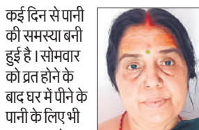
कई दिन से पानी की समस्या बनी हुई है। सोमवार को व्रत होने के बाद घर में पीने के पानी के लिए भी तरस गए। ब्रेद गंदा पानी निकलता रहा। शाम से पानी साफ आना शुरू हो गया लेकिन प्रेशर की दिक्कत अभी बनी हुई है।

सुधार करा दिया। इससे पानी तो साफ आने लगा, लेकिन प्रेशर की दिक्कत ने परेशान कर दिया। वहीं,