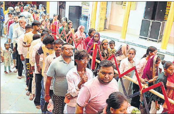
जलाभिषेक करने के लिए लगी श्रद्धालुओं की कतार।