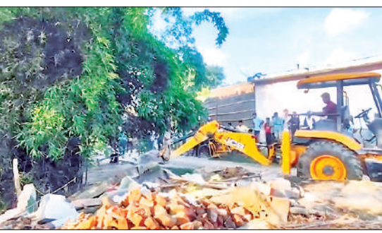
अवैध कब्जे को ध्वस्त करती जेसीबी।