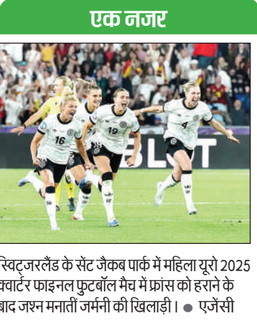
रिवटजरलैंड के सेंट जैकब पार्क में महिला यूरो 2025 क्वार्टर फाइनल फुटबॉल मैच में फ्रांस को हराने के बाद जश्न मनाती जर्मनी की खिलाड़ी ।