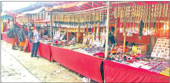
सावन मेला को लेकर सजी दुकानें।