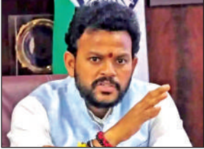
● कड़ा रुख अपनाते हुए नायडू ने विदेशी मीडिया पर निशाना साधा

नई दिल्ली। संसद के मानसून सत्र की पूर्व संख्या पर रविवार को उपराष्ट्रपति जगदीप धनखड़ ने सार्थक और गंभीर चर्चा के लिए राजनीतिक दलों के बीच सौहार्दपूर्ण माहौल का आह्वान किया और सांसदों से अनुचित शब्दों का प्रयोग करने से बचने की अपील की। धनखड़ ने कहा कि सुधार के लिए सुझाव देना निंदा या आलोचना नहीं है तथा पार्टियों को रचनात्मक राजनीति करनी चाहिए। यहां राज्यसभा ‘इंटर्न’ के समूह को संबोधित करते हुए उन्होंने तीखी नोकझोंक होने का जिक्र किया।