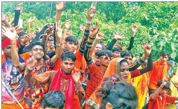
गोला गोकर्ण नाथ में शिव मंदिर में गंगाजल भरकर कांवड़ ले जाते श्रद्धालु।