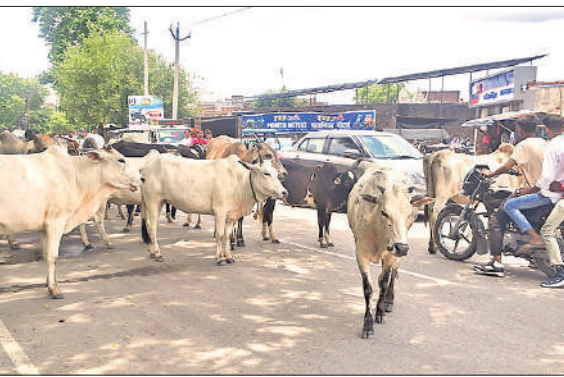
भीरा हाईवे पर खड़ा छुट्टा गोवंशीय पशुओं का झुंड।

हाईवे पर छुट्टा पशुओं का कब्जा होने से हल्के और भारी वाहनों के लिए यह परेशानी का कारण बनने लगे हैं। कुछ पशु तो भगाने पर उत्था हमला कर घायल कर देते हैं। सावन के महीने में लखीमपुर पलिया हाईवे से हजारों भोलेनाथ के भक्त कांवड़ लेकर छोटी काशी गोला गोकर्णनाथ के शिव मंदिर में जलाभिषेक करने के लिए पहुंच रहे हैं, जिनको सड़क पर