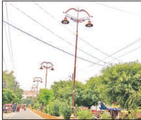
पूरनपुर में स्टेशन रोड पर लगाई गई लाइटें।

अमृत विचार : नगर पालिका पूरनपुर क्षेत्र में हुए कामों के दावे आए दिन जिम्मेदारों की ओर से किए गए। जनपद में विकास की एक अन्ठौ चमक देखने के लिए कहा जाता रहा कि पूरनपुर में देखी जा सकती है। मगर, ज़मीनी हकीकत ने स्वच्छता रैंकिंग ये धड़ाम हो गई। स्वच्छता सर्वेक्षण में नगर पालिका पूरनपुर को को प्रदेश में 722वां और राष्ट्रीय स्तर पर 1157 वां स्थान मिला है, जबकि पिछले वर्ष हुई रैंकिंग में पूरनपुर पालिका बेहतर रही थी। बता दें कि पूरनपुर नगरपालिका क्षेत्र की एक लाख से अधिक आबादी