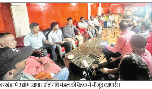
बरखेड़ा में उद्योग व्यापार प्रतिनिधि मंडल की बैठक में मौजूद व्यापारी।

ऐसे करीब 200 से अधिक उपभोक्ताओं का तीन-तीन माह से बिल नहीं आया है। बिल न आने से