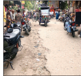
पूरनपुर की जर्जर सड़क।

है। यहां वार्ड की संख्या 25 है। जिम्मेदारों की मानें तो नगरपालिका के स्तर से मूलभूत सुविधाएं मुहैया कराई जा रही हैं। नगर क्षेत्र के भीतर नगरपालिका की ओर से सड़कों का निर्माण, पार्क आदि का निर्माण कराया गया है। यही नहीं, सौंदर्यीकरण के