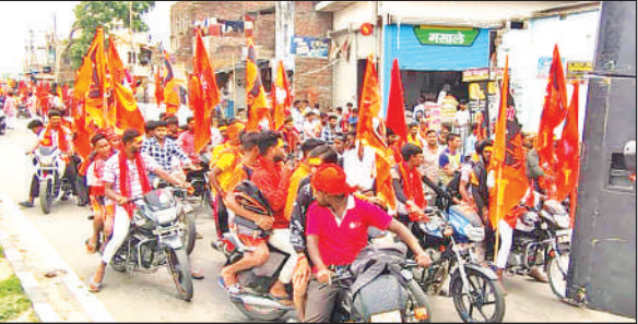
बरखेड़ा से कछला घाट को रवाना हुए शिव भक्त।