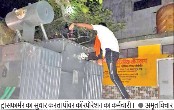
ट्रांसफार्मर का सुधार करता पॉवर कॉरपोरेशन का कर्मचारी।