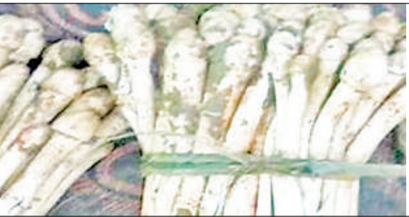
दुधवा के जंगल से लाए गए धरती फूल।

दुधवा के जंगल में बरसात के दिनों में दीमक से बनी बामियों में बड़े पैमाने पर धरती का फूल निकलता है। साथ ही कटरुआ भी पाया जाता है। हिरण, पाढा समेत कई वन्यजीव इसे बड़े चाव से खाते हैं। वन्य जीवों को भोजन का संकट