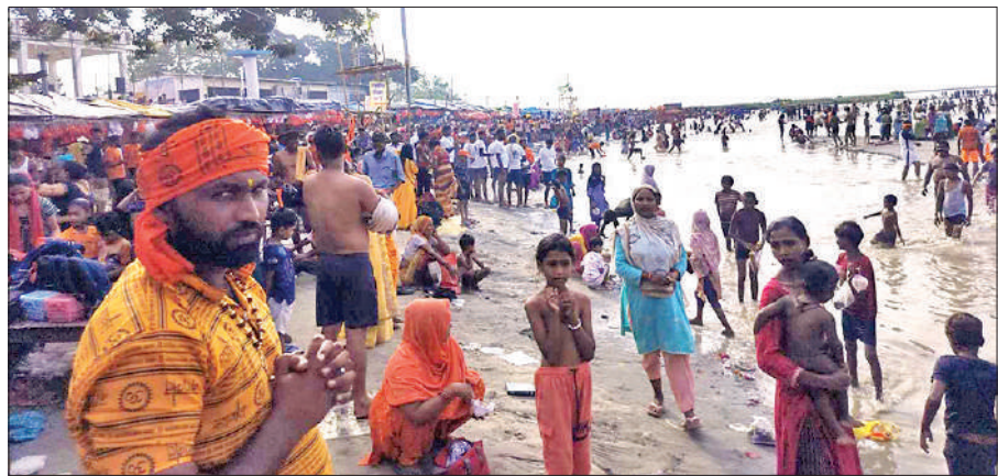
कछला में भागीरथी घाट पर स्नान करते श्रद्धालु।