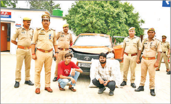
पुलिस की गिरफ्त में अवैध गांजा तस्करी के आरोपी।