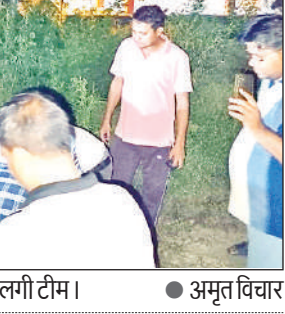
फाल्ट दुरस्त कराने के लिए शनिवार रात लगी टीम।

वजह बता कर्तव्यों से इतिश्री कर गए हैं। जर्जर संसाधनों का खामियाजा उपभोक्ताओं को भुगतना पड़ रहा है। शनिवार को भी दिन में कई बार बिजली आती जाती रही। इसका दोपहर में सुधार कराया गया। इससे राहत महसूस की जा रही थी कि शाम 6 बजते ही हालात बिगड़ गए। 33 केवी रामलीला लाइन का केबिल बॉक्स डेमेज हो गया, जिसके बाद आधे शहर की बत्ती गुल हो गई। कुछ देर तक उपभोक्ता इंतजार करते रहे। उसके बाद भी जब रात 10 बजे तक बिजली नहीं आई और घरों पर लगे इनवर्टर जवाब दे गए तो उपभोक्ता तिलमिला उठे। एक-एक कर तमाम लोगों