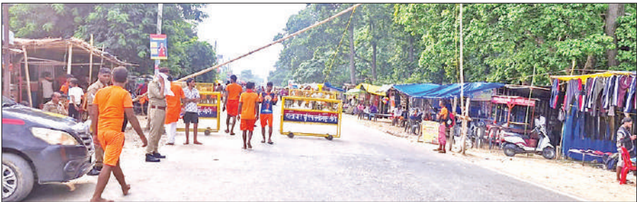
लखीमपुर-गोला मार्ग पर नगर सीमा पर वाहनों को डायवर्ट करने के लिए की गई बैरिकेडिंग।

सावन के दूसरे सोमवार को उमड़ने वाली कांवड़ियों और श्रद्धालुओं की भीड़ के जत्थों की सुरक्षा के लिहाज से रूट डायवर्जन किया गया है। शनिवार रात 11 बजे से सोमवार रात 11 बजे तक 48 घंटों के लिए गोला हाईवे पर वाहनों