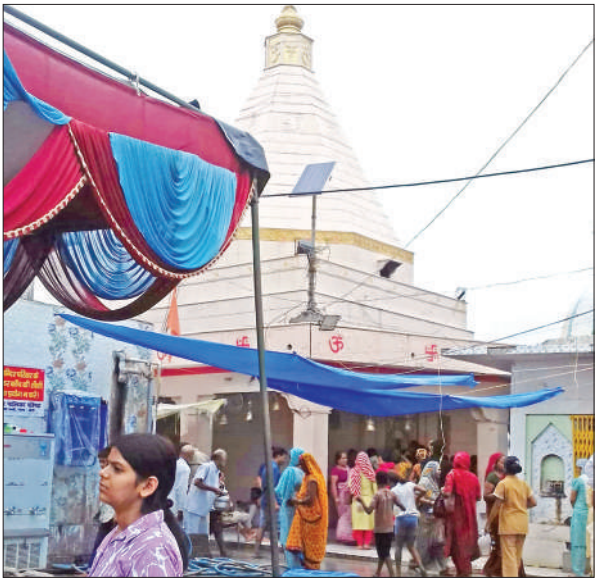
छोटी काशी के पौराणिक शिव मंदिर में जलाभिषेक को पहुंचे भक्त।