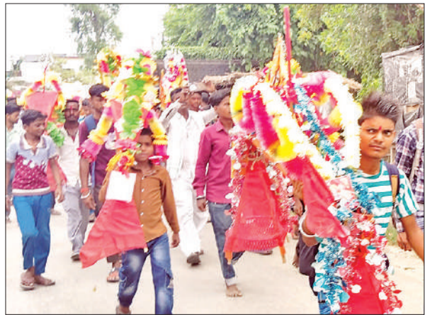
गोला गोकर्ण नाथ में शिव मंदिर में गंगाजल भरकर कांवड़ ले जाते श्रद्धालु।

चौकी पर प्रभारी सहित पुलिसकर्मी कावड़ियों की सेवा में जुटे