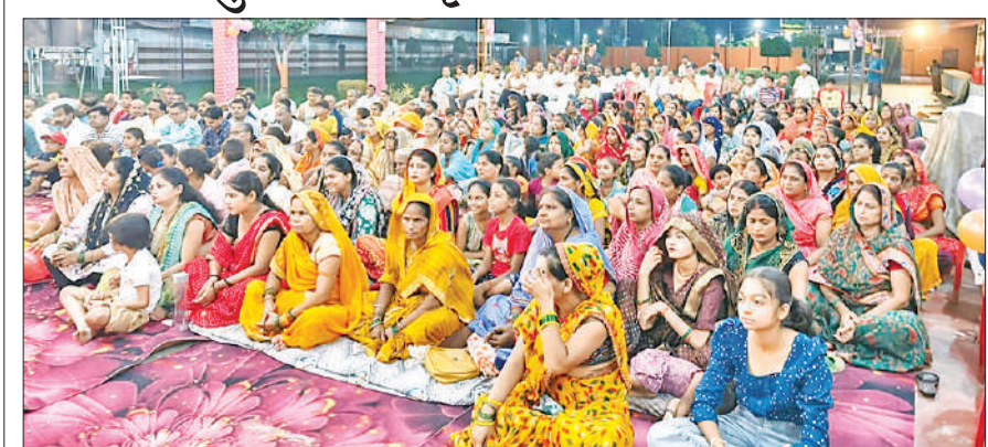
गोला के साई मैरिज लॉन में कथा सुनते श्रद्धालु।

डा.शेख Best Sexologist in India आयुर्वेद मिलें हर मंगलवार ईसाईयों की पुलिया बरेली निकट सेटेलाइट बस स्टैंड 9837023223