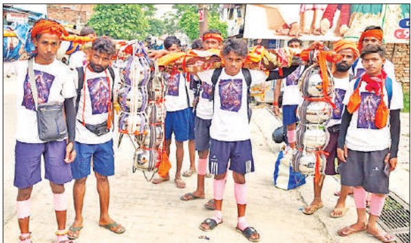
स्टील की गगरों वाली इस कांवड़ में 90 लीटर गंगाजल लाया गया।

अमृत विचार: सावन के दूसरे सोमवार को लेकर छोटी काशी में शिव भक्ति का उत्साह और उल्लास परवान चढ़ता जा रहा है। हरिद्वार और फर्रुखाबाद समेत पलिया और धौरहरा क्षेत्र की शास्त्रा और घाघरा नदी से पवित्र जल लेकर लौट रहे शिव भक्तों की टोलियों ने पूरे जिले को हर-हर महादेव और बोल बम के जयघोष से गुंजायमान कर दिया है। सावन का दूसरा सोमवार आज है। भगवान शिव का जलाभिषेक करने के लिए हजारों की संख्या में शिव भक्त शाहजहांपुर, फर्रुखाबाद, कन्नौज, पीलीभीत, बरेली, सीतापुर, हरदोई से पवित्र नदियों का जल कांवड़ में भरकर छोटी काशी गोला पौराणिक शिव मंदिर आते हैं।