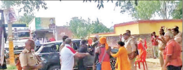
कार को धेरकर खड़े कावड़िया।