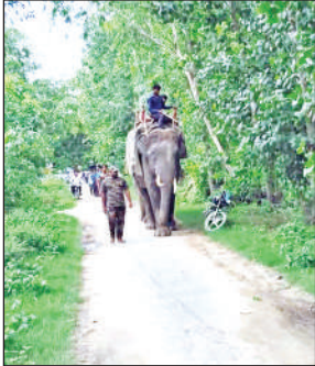
बाधिन की तलाश में जुटी टीमें।