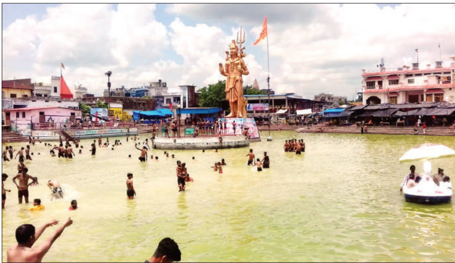
छोटी काशी के गोकर्ण तीर्थ में विशाल शिव की मूर्ति व स्नान करते श्रद्धालु।