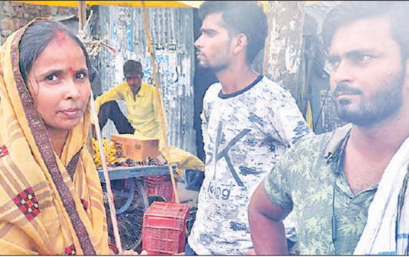
दातागंज तिराहे पर टप्पेबाजी की जानकारी देती पीड़िता।