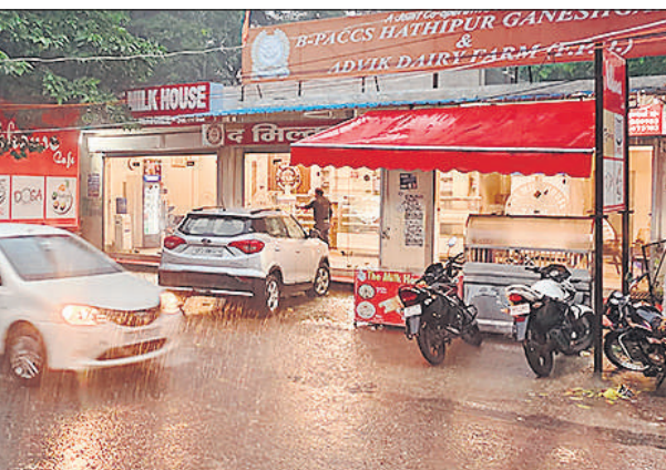
शाम 5.50 बजे : लखीमपुर के नौरंगाबाद रोड पर बादलों के कारण जलीं वाहनों की लाइटें व हो रही बारिश।

गुरुवार की रात करीब साढ़े सात बजे के करीब 33 केवीए की मेन लाइन में फाल्ट आ गई। इससे पूरे शहर की बिजली गुल हो गई। बिजली न होने से लोग भीषण उमस भरी गर्मी से बिलबिला उठे। रात करीब 12 बजे के करीब बिजली आई तो लोगों को राहत मिली, लेकिन दस मिनट के बाद फिर गुल हो गई। यह क्रम रात में कई बार चला। रात करीब एक डेढ़ बजे गई बिजली