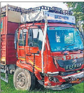
पुलिस के कब्जे में डीसीएम।