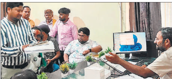
डिविजन परिसर में एक्सईएन से वार्ता करते भाकियू कार्यकर्ता।

अमृत विचार: जर्जर लाइनों और बिजली कटौती से गर्मी में हाहाकार मचा है। भाकियू कार्यकर्ताओं ने एक्सईएन का घेराव करते हुए आपूर्ति से संबंधित समस्याओं के निस्तारण की मांग की। तहसील क्षेत्र के गांव पिपरिया दुलई और इस फीडर से जुड़े गांवों में जर्जर बिजली लाइनें पड़ी हैं। इसमें आए दिन फाल्ट होते हैं। भीषण गर्मी में दिन के अलावा रात में भी कटौती हो रही है। जिससे उपभोक्ता बेहाल हैं। शुक्रवार को भारतीय किसान यूनियन भानू के कार्यकर्ता अधिशासी अभियंता कार्यालय पहुंचे। कार्यकर्ताओं ने एक्सईएन