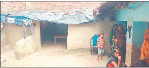
मृतक के घर की मौजूदा स्थिति व परिवार की महिलाएं।