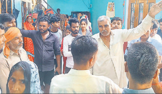
दियोराजपुर गांव में घटना के बाद पीड़ित के घर जमा लोग।

बता दें कि क्षेत्र के गांव हेमपुर, जादमपुर, खुटरायां, पिपरगहना समेत दर्जनभर गांवों में गुरुवार रात ड्रोन उड़ने का शोर मचा। ग्रामीणों में दहशत फैलने लगी है। एक ग्रामीण ने ड्रोन की आपने मोबाइल से वीडियो बना ली। इसके बाद ग्रामीणों में डर