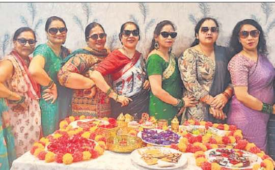
कार्यक्रम में मौजूद महिलाएं।