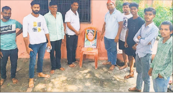
गोला में पूर्व सांसद फूलनदेवी के चित्र पर माल्यार्पण करते सपाईं।

बरती जा सकती। यदि ऐसे लोगों को कठोर सजा न दी गई तो यह न्याय की मंशा के विपरीत होगा।