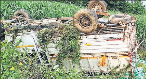
मोहम्मदी रोड पर सड़क किनारे पलटी पिकअप।