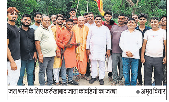
जल भरने के लिए फरुखाबाद जाता कांवड़ियों का जत्था