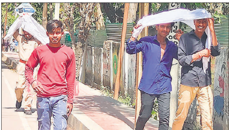
दोपहर 2 बजे : लखीमपुर शहर में उमस से कुछ इस तरह बचाव कर जाते बेहाल राहगीर।