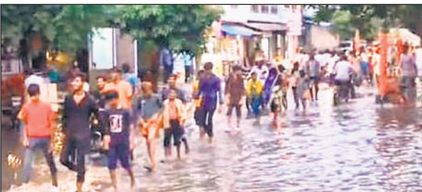
वीर अब्दुल हमीद मार्केट, मेला मैदान सहित तमाम जगहों पर वर्षा का पानी भर गया, जिससे लोगों को दिक्कत हुई है।

गोला गोकर्णनाथ, अमृत विचार : कई दिनों से पड़ रही भीषण गर्मी के बाद शुक्रवार को दोपहर हुई बरसात से सावन के महीने में पौराणिक शिव मंदिर में दर्शन करने वाले श्रद्धालु पानी में भीगते हुए सड़क पर जयकारा लगाते हुए निकलते रहे। वर्षा हो जाने से गर्मी में कुछ राहत मिली है। शुक्रवार को दोपहर बाद हुई बरसात से नगर के निचले इलाकों में जल भराव की स्थिति हो गई। अंबेडकर पार्क से मिल डाइवर्जन रोड, सिनेमा चैराहे से लखीमपुर रोड,