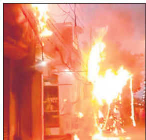
दुकान से उठी आग की लपटें।

हादसा बीसलपुर नगर के तहसील रोड पर हुआ। यहां पर स्थित जूते और रेडीमेड कपड़ों की दुकान के ऊपर से बिजली के तार गुज रहे हैं। बताते हैं कि गुरुवार रात तारों से निकली चिंगारी से दुकान में आग लग गई। कुछ ही देर में आग तीखी बहस हुई। इस हादसे के पीछे तिरपाल और कपड़े में आग लगी। इसके बाद भीतर रखे सामान को