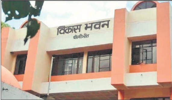
विकास भवन की इमारत।