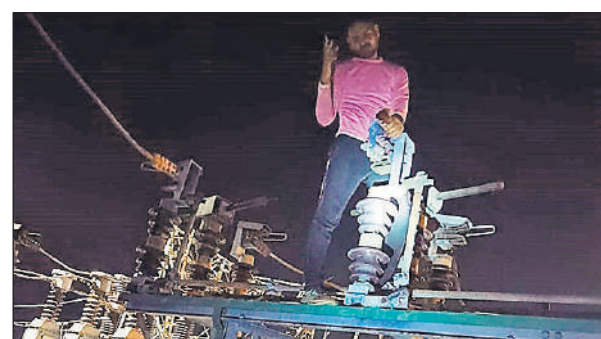
छाउछ पाँवर हाउस पर फाल्ट को ठीक करते बिजली कर्मचारी।

कारण अभिभावकों ने स्कूल का समय बदलने की डीएम से मांग की है।