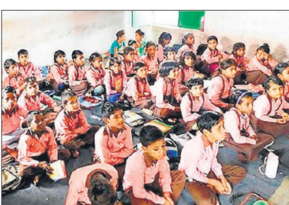
प्राथमिक विद्यालय में भीषण गर्मी में पढ़ाई करते बच्चे।