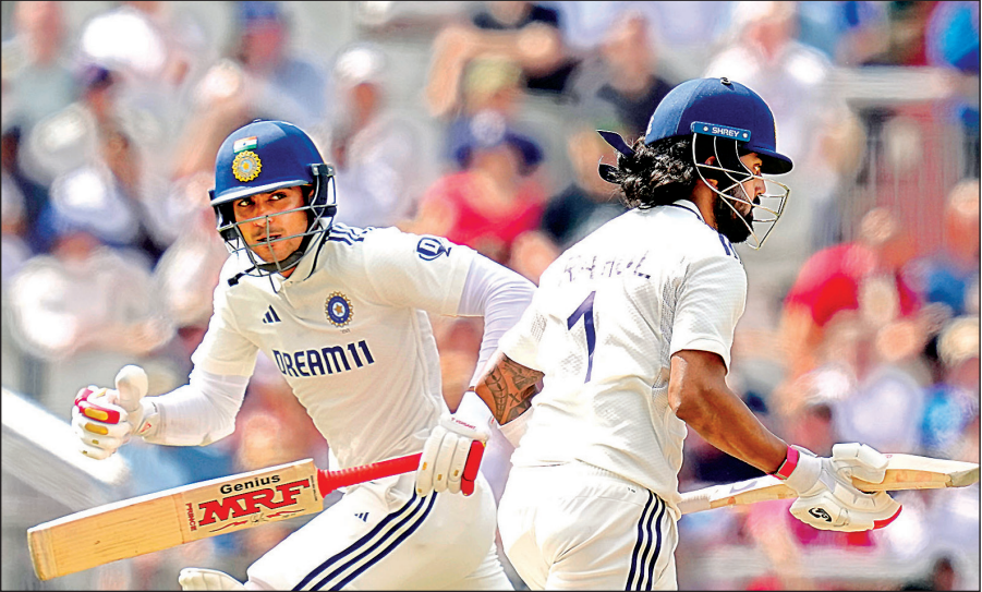
इंग्लैंड के ओल्ड ट्रैफर्ड मैदान पर भारतीय कप्तान शुभमन गिल और केएल राहुल रन लेते हुए।

कप्तान शुभमन गिल ने शुरुआती झटकों से उबरते हुए शनिवार को इंग्लैंड के खिलाफ चौथे टेस्ट मैच के चौथे दिन अर्धशतक जड़कर दूसरे सत्र में कोई विकेट नहीं गिरने दिया जिससे भारत ने दो विकेट पर 86 रन बना लिए। इंग्लैंड के तेज गेंदबाजों में विशेषकर जोफ्रा आर्चर ने गिल के पैड पर कुछ खतरनाक इनस्विंगर फेंकीं, लेकिन भारतीय कप्तान इनसे उबरकर शानदार शॉट खेलने में सफल रहे। गिल (नाबाद 52 रन) का साथ हमेशा भरोसेमंद केएल राहुल (नाबाद 30 रन) ने दिया, जो इस श्रृंखला में भारत की बल्लेबाजी की नींव रहे हैं। भारत के लिए अब भी मैच बचाना मुश्किल काम है क्योंकि चाय तक वह इंग्लैंड से 225 रन पीछे है। भारत ने दूसरी पारी के पहले ओवर में लगातार दो गेंदों पर यशस्वी जायसवाल और साई सुदर्शन के विकेट गंवा दिए जबकि तब टीम का खाता भी नहीं खुला था। लंच के समय टीम का स्कोर एक रन पर दो विकेट था। इसके बाद गिल को किस्मत का भी साथ मिला क्योंकि जब वह 46 रन