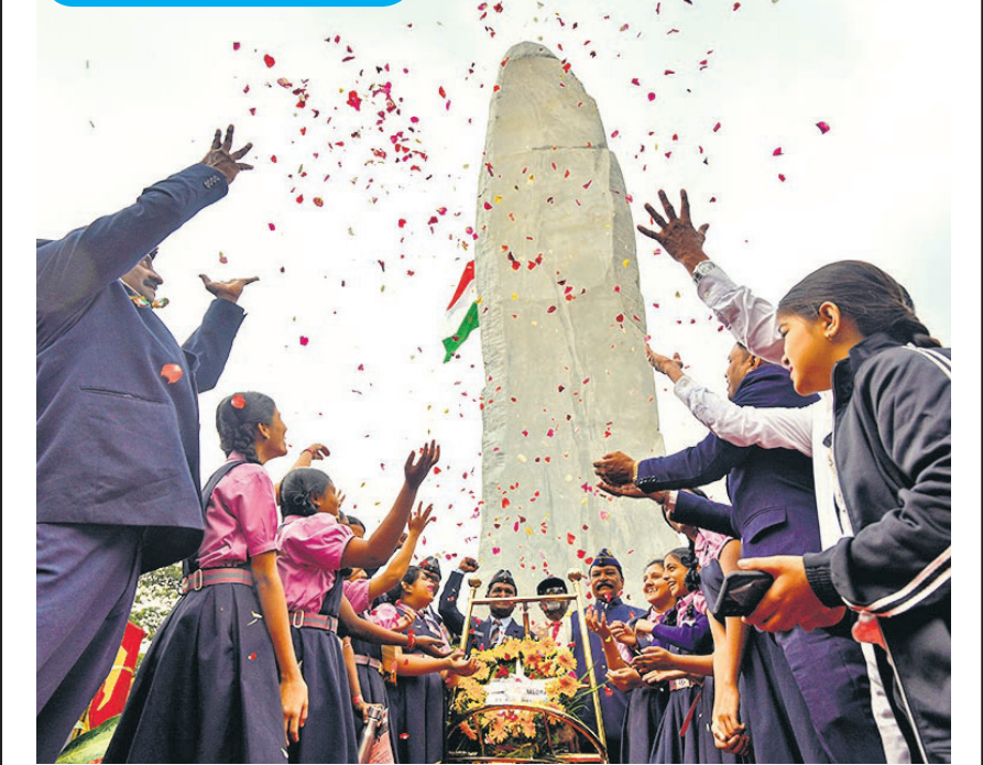
शनिवार को बैंगलुरु स्थित राष्ट्रीय सैन्य स्मारक पर कारगिल विजय दिवस के 26 साल पूरे होने के उपलक्ष्य में 75 फीट ऊंचे वीरगल्लू (नायक पथर) के अनावरण के दौरान घुषाप्राण करते छात्र और पूर्व सैन्य कर्मचारी।