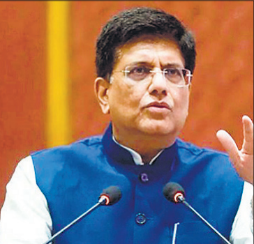
● कहा- 22 से 23 वर्ष की कशमकश के बाद संभव हुआ यह समझौता

नई दिल्ली। आरबीआई ने इंडसइंड बैंक की निगरानी समिति का कार्यकाल एक महीने बढ़ाकर 28 अगस्त तक कर दिया है। बैंक पिछले एमडी और सीईओ सुमंत कटपालिया के इस्तीफे के बाद नए एमडी और सीईओ की तलाश में है। कटपालिया ने 29 अप्रैल को इस्तीफा दिया था, जिसके बाद इस समिति का गठन किया गया। समिति का कार्यकाल 28 जुलाई, 2025 तक था।