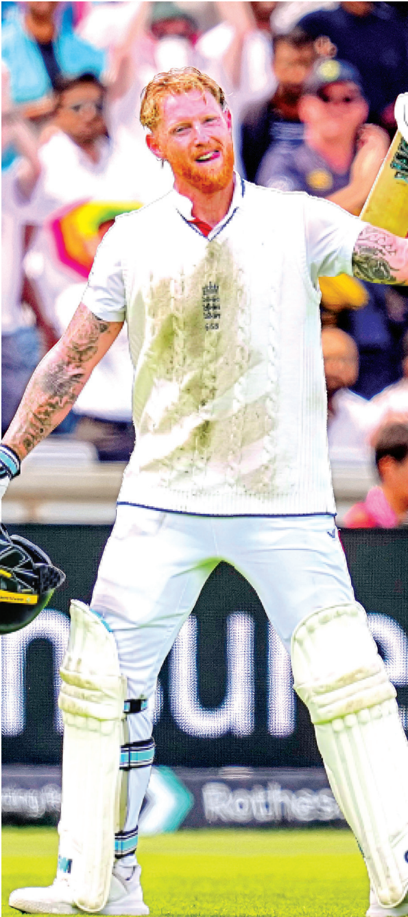
शतक लगाने के बाद जश्न मनाते इंग्लैंड के कप्तान बेन स्टोक्स।

विराट कोहली, रोहित शर्मा और रविचंद्रन अश्विन भी संन्यास ले चुके हैं। और अब लगता है, बुमराह की बारी है। क्रिकेट प्रशंसकों को शायद इसकी आदत डालनी होगी। अब आपको बुमराह के बिना टेस्ट मैच देखने की आदत डालनी होगी। -मोहम्मद कैफ