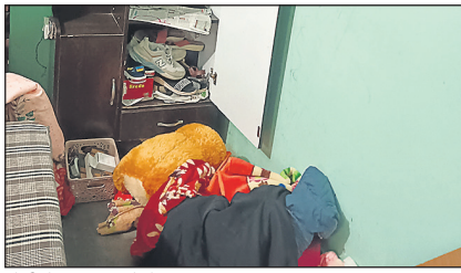
चोरी के बाद कमरे में बिखरा पड़ा सामान।

घर में चोरी होने की सूचना पर जांच पड़ताल की गई है। संदिग्धों को हिरासत में लेकर पूछताछ की जा रही है, जल्द ही घटना का खुलासा किया जाएगा।