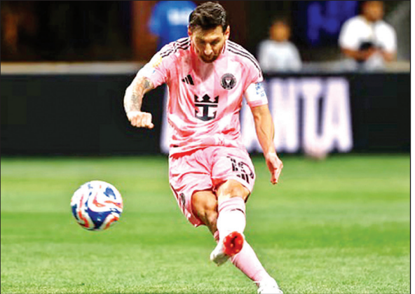
क्लब इंटर मियामी के एक मैच के दौरान किंग लगाते लियोनेल मेसी।