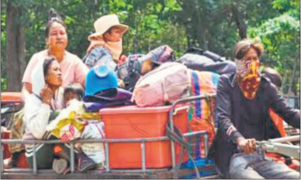
कंबोडिया में सीमावर्ती इलाके से पलायन करता एक परिवार।

क्षेत्रीय समूह दक्षिण पूर्व एशियाई राष्ट्र संघ (आसियान) पर अपने दोनों सदस्य देशों के बीच तनाव कम करने का दावा बंद रहा है। शुक्रवार को एक आपात बैठक के दौरान, संयुक्त राष्ट्र सुरक्षा परिषद के सदस्यों ने तनाव कम करने का आह्वान किया और आसियान से शांतिपूर्ण समाधान के लिए मध्यस्थता कराने की अपील