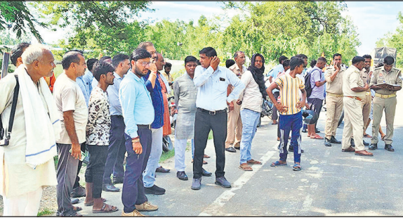
हादसे के बाद मौके पर लगी भीड़।