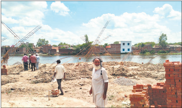
तालाब किनारे बन रहे भवनों की पैमाइश करती राजस्व टीम