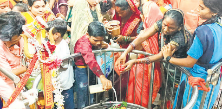
गौरीशंकर मंदिर में जलाभिषेक करते श्रद्धालु।