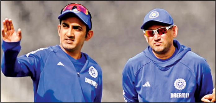
भारतीय हेड कोच गौतम गंभीर व मुख्य चयनकर्ता अजित आगरकर।

अंशुल कंबोज का टेस्ट क्रिकेट में पदार्पण अच्छा नहीं रहा और उनकी जगह