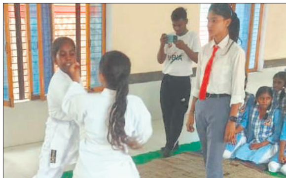
कराटे प्रतियोगिता में भाग लेती छात्राएं।

अलग भार वर्ग में जीत दर्ज की। अब विजेता मंडलीय प्रतियोगिता में प्रतिभाग करेंगे। निर्णायक मंडल