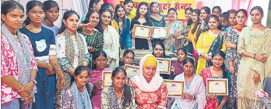
कार्यक्रम में प्रमाण पत्रों के साथ मौजूद प्रतिभागी।

आरोप है शादी के बाद पति सहित ससुरालियों ने बेटी से एक लाख रुपये की मांग करते हुए प्रताड़ित करना शुरू कर दिया। जब बेटी ने शिकायत की तो पति