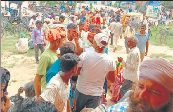
जुआरी फार्म हब लिमिटेड पर खाद लेने वालों की लगी भीड़।

किसानों के लिए कोई खाद की कमी नहीं है। सरकार के इस दावे की सच्चाई खाद दुकान के बाहर लगी किसानों की भीड़ उजागर कर रही है। मझगई थाना क्षेत्र में खाद की किल्लत ने किसानों की कम्पर तोड़ दी है। सहकारी समितियों में ताले पड़े हैंऔर किसान सुबह से शाम तक कतारों में खड़े रहने को मजबूर हैं। छोटे किसानों को