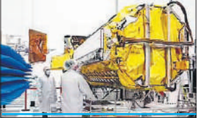
● दोहरे आवृत्ति सिंथेटिक अपचर रडार वाला पहला उपग्रह

‘निसार’ का वजन 2,3१2 किलोग्राम है। पृथ्वी का अवलोकन करने वाला यह पहला उपग्रह है, जो दोहरे आवृत्ति सिंथेटिक अपचर रडार (नासा का एल-बैंड और इसरो का एस-बैंड) के साथ पृथ्वी का निरीक्षण करेगा। ऐसा पहली बार होगा जब यह उपग्रह ‘स्वीप एसएआर’ प्रौद्योगिकी