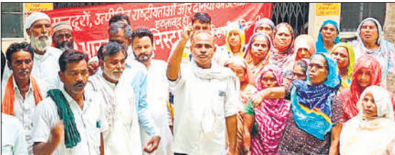
शेरपुरकला में प्रदर्शन करते भाकपा माले कार्यकर्ता।