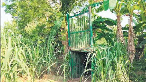
गन्ने के खेत में लगाया गया पिंजड़ा।