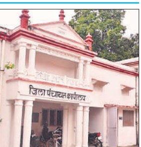
जिला पंचायत कार्यालय।