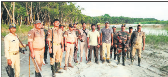
बाघ देख ठिठकी दुधवा में पेट्रोलिंग टीम।