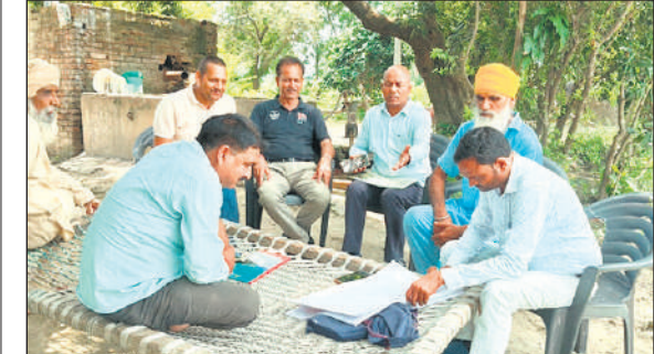
गांव धूसर में सट्टा प्रदर्शन का निरीक्षण करते एससीडीआई।

बाघ दिखाई दिया। वहीं दुधवा से चंदन चौकी मार्ग पर पेट्रोलिंग कर रही दूसरी टीम को रेलवे क्रॉसिंग के निकट रेल पथ पर एक भालू नजर आया, जिसे वन टीमों ने अपने-अपने कैमरों में कैद किया। इसके अतिरिक्त कई स्थानों पर चीतल, पांडा, काकड़, नीलगाय, सुअर,लोटमी, खरगोश, नेवला आदि भी दिखाई दिए।