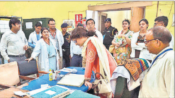
मेडिकल कॉलेज में दवा का स्टोर चेक करती एनएमसी की टीम।

बता दें कि संयुक्त चिकित्सालय के बाद वर्ष 2023 में एलओपी करने के बाद उसको मेडिकल कॉलेज के अधीन कर दिया गया, जिसके बाद एकेडमिक ब्लॉक को चालू करते हुए एमबीबीएस की पढ़ाई के साथ डीएनबी कोर्स शुरू करने का दम भरा जा रहा है। मेडिकल कॉलेज के