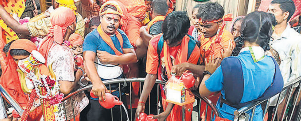
कछला घाट से जल लेकर पहुंचे कांवड़ियों ने किया गौरीशंकर मंदिर में करते जलाभिषेक।