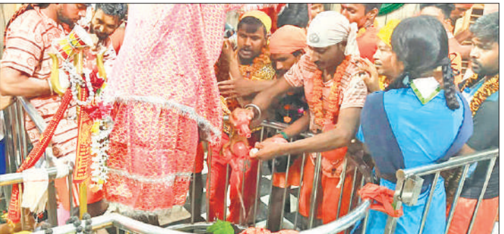
गौरीशंकर मंदिर में कांवड़ लेकर पहुंचे कांवड़िए।

मंत्रों की गूंज सुनाई देने लगी। इधर, तपती गर्मी और उमस से राहत देने के लिए एक बजे बारिश शुरू हुई। जहां कांवड़ियों के जयघोष भिगते हुए शिवालय में पहुंचे। बारिश में कांवड़ियों को उत्साह देखते बन रहा था। इधर, भगवान शिव का जलाभिषेक करने के लिए इन दिनों कांवड़ियों का कछला जाने का सिलसिला जारी है। कांवड़ियों के जयघोष जलाभिषेक करने के लिए पहुंचे। शहर में प्रवेश करते हुए कांवड़ियों की कड़ी सुरक्षा के बीच मंदिर तक पहुंचाने के लिए पुलिस फोर्स जुटी रही। तीसरे सोमवार को बाबा का जलाभिषेक करने के लिए कांवड़ियों के जयघोष पहुंचे।