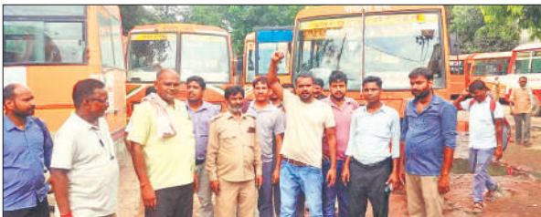
डिपो परिसर में प्रदर्शन करते रोडवेज कर्मचारी संघ के पदाधिकारी व चालक-परिचालक।