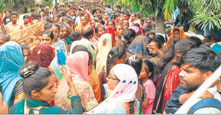
गौरीशंकर मंदिर के बाहर सड़क तक लगी श्रद्धालुओं की भीड़।