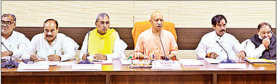
वाराणसी में जनप्रतिनिधियों के साथ बैठक करते मुख्यमंत्री योगी, साथ में अन्य।

योगी ने जनप्रतिनिधियों से उनके विधानसभा क्षेत्र की परिस्थितियों, जन अपेक्षाओं एवं विकासपरक कार्यों की प्राथमिकताओं के विषय में एक-एक कर व्यक्तिगत रूप से चर्चा की। बैठक का उद्देश्य मात्र योजनाओं की