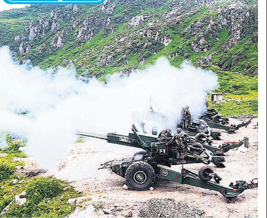
दूर तक देखने, हालात को समझने और तुरंत कार्रवाई करने में महारत हासिल करने के लिए भारतीय सेना ने सोमवार को पूर्वी सिक्किम में दिव्य दृष्टि सैन्य अभ्यास किया। ये अभ्यास विभिन्न सर्वािास, ड्रोन, रडार और सेंसर पर आधारित था।

मैं न होता तो पाकिस्तान से अब तक युद्ध कर रहा होता भारत: डोनाल्ड ट्रंप लंदन। अमेरिकी राष्ट्रपति डोनाल्ड ट्रंप ने सोमवार को फिर दावा किया कि यदि उन्होंने हस्तक्षेप नहीं किया होता और व्यापार वार्ता रोकने की धमकी न दी होती तो भारत और पाकिस्तान के बीच युद्ध चल रहा होता। ट्रंप ने स्कॉटलैंड में ब्रिटेन के प्रधानमंत्री केअर स्टार्मर के साथ आधिकारिक वार्ता से पहले मीडिया से कहा कि उन्होंने दुनिया भर में छह बड़े युद्ध को रोकने में हस्तक्षेप किया, जिनमें भारत और पाकिस्तान के बीच संभावित युद्ध भी शामिल है। वह गाजा में संघर्ष समाप्त करने के लिए इजराइल पर दबाव डालने के बारे में पूछे गए प्रश्न का उत्तर दे रहे थे।