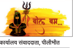
कार्यालय संवाददाता, पीलीभीत