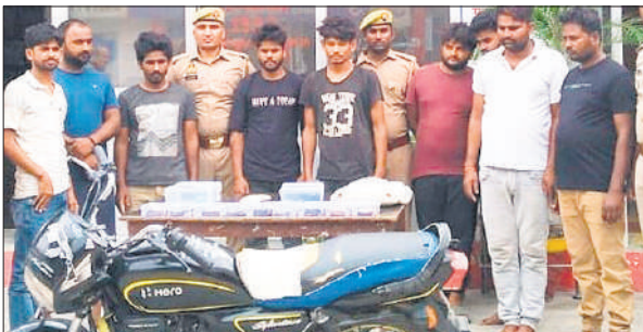
लूट मामले में गिरफ्तार आरोपी।