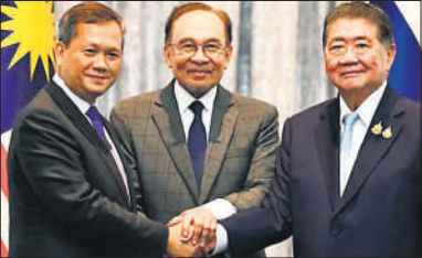
● मलेशिया के प्रधानमंत्री ने की घोषणा, तत्काल और बिना शर्त लागू होगा संघर्ष विराम

अनवर ने आसियान (दक्षिण पूर्व एशियाई राष्ट्रों का संगठन) क्षेत्रीय समूह के प्रमुख के रूप में वार्ता की अध्यक्षता की। उन्होंने कहा कि दोनों पक्षों में सामान्य स्थिति बहाल करने के लिए आवश्यक कदम उठाने पर आम सहमति बन गई है। अनवर ने एक संयुक्त बयान पढ़ते हुए कहा कि कंबोडिया के प्रधानमंत्री हुन मानेत और थाईलैंड के कार्यवाहक प्रधानमंत्री फुमथाम वेचयाचाई 28 जुलाई को मध्यरात्रि से तत्काल और बिना शर्त संघर्ष-विराम पर