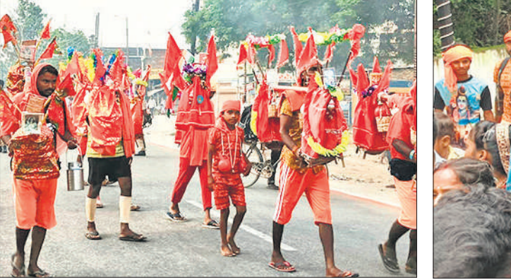
मंडी समिति से गौरीशंकर मंदिर को जाता कांवड़ियों का जत्था।