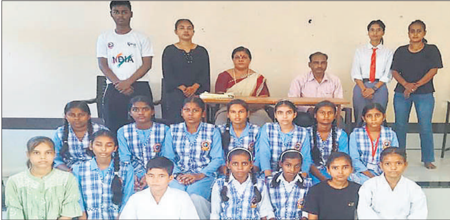
मंडलीय प्रतियोगिता के लिए चयनित खिलाड़ी।