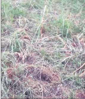
हाथियों द्वारा रौंदी गई खेत में खड़ी गन्ने की फसल।

क्षेत्र में पिछले दिनों बाघ और तेंदुए का काफी आतंक था। कई लोग इनके हमले से घायल हुए और मारे जा चुके हैं। इससे ग्रामीणों में बाघ और तेंदुए का खौफ आज भी है। आलम यह है कि किसान सूरज