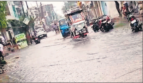
शहर के मुख्य स्टेशन रोड पर जलभराव के बीच गुजरते राहगीर।