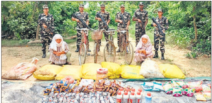
नेपाल सीमा पर बरामद माल के साथ गिरफ्तार महिलाएं।