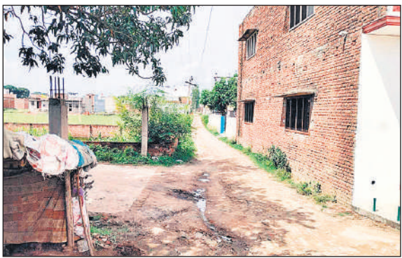
अधूरा छोड़ा गया जर्जर खड़ंजा मार्ग।

आबादी को किया महारूम कार्यालय संवाददाता, पीलीभीत