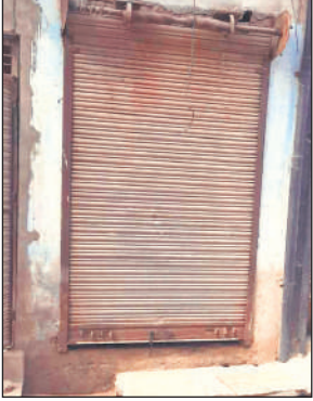
कस्बा बरखेड़ा के पुराना बाजार मार्ग पर इसी दुकान को किया गया था सील।