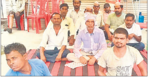
गोला के इंदिरा पार्क में धरने पर बैठे दिव्यांगजन।