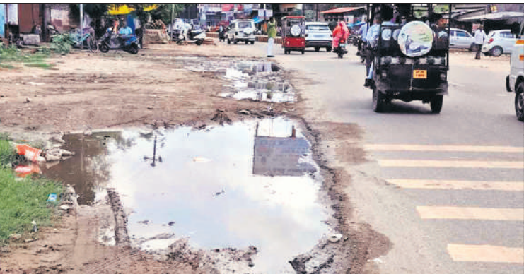
टनकपुर हाईवे पर छतरी चौराहा के पास सड़क किनारे जमा गंदा पानी।