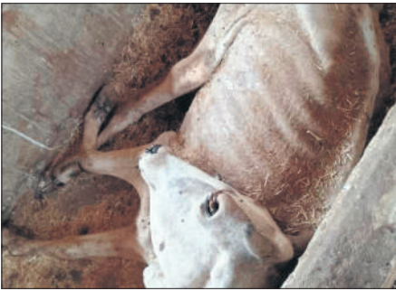
गोशाला की चरनी में पड़ा गोवंश।