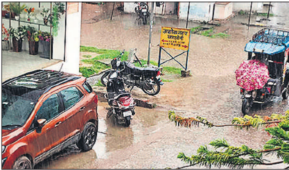
बारिश के बीच अशोक कॉलोनी से गुजरता ई-रिक्शा।

अमृत विचार: दिनभर की उमस भरी गर्मी के बाद शाम को अचानक मौसम ने करवट ली। कुछ देर हुई तेज बारिश के बाद गर्मी से राहत मिली, मगर सड़कों पर जलभराव ने परेशानी बढ़ा दी। वहीं, कुछ लोगों ने जलभराव के वीडियो बनाकर सोशल मीडिया पर वायरल कर दिए और नगर पालिका की नाला सफाई से जोड़कर सवाल उठाए। तराई क्षेत्र में वैसे तो मानसून पूर्व में ही दस्तक दे चुका है। पिछले कुछ