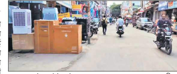
मुख्य बाजार में दुकानों के आगे रखा सामान।

लंबे समय से शहर की एक बड़ी समस्या के तौर पर सड़कों पर फैला अतिक्रमण है। मुख्य मार्गों पर दिन में कई बार जाम लगता है। दुकानों के