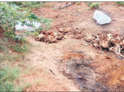
गोशाला के समीप पड़े कंकाल।

अमृत विचार: गोशालाओं में गोवंशीय पशुओं की देखभाल को लेकर व्यवस्था दुरुस्त होने के जिम्मेदारों के दावे एक बार फिर हवाहवाई साबित हो गए। इस बार भी सवाल तब उठे जब सोशल मीडिया पर गोशाला में गोवंश की दुर्दशा से जुड़े वीडियो फोटो वायरल हो गए। इस बार मामला ललौरीखेड़ा ब्लॉक क्षेत्र की नूरपुर गोशाला का बताया गया। जिसमें वायरल वीडियो में कई गोवंश के मृत हालत में पड़े होने का दावा किया जाता रहा। मामला संज्ञान में आने पर प्रशासनिक अमले में खलबली मची रही। जिम्मेदारों ने गोवंश के मृत होने से इन्कार कर दिया है। बीमार व घायल पशुओं के इलाज की बात कही जा रही है। सोशल मीडिया पर वायरल हो रहे वीडियो ललौरीखेड़ा ब्लॉक की नूरपुर गोशाला के बताए गए। इस वायरल वीडियो और फोटो में कुछ गोवंश चरनी के समीप ही मरणासन्न