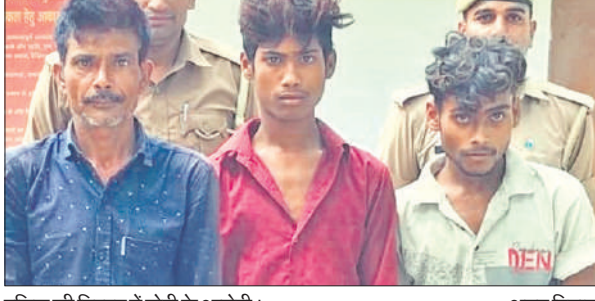
पुलिस की गिरफ्तार में चोरी के आरोपी।