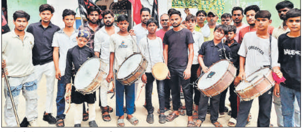
भितौली में जुलूस निकालते अकीदतमंद।

मोहल्ला इस्लामनगर से बुधवार रात को छठी का जुलूस निकाला गया। जुलूस कस्बे के विभिन्न गलियों में होकर गुजरा। गुरुवार दोपहर को मोहर्रम की सातवीं का जुलूस कस्बे के नूरी जामा मस्जिद माहल्ले से शुरू हुआ। इसके बाद वह