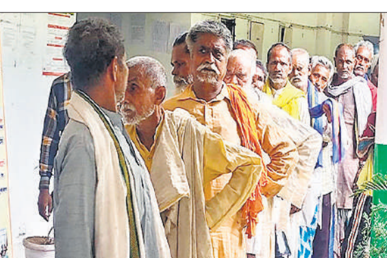
जिला समाज कल्याण अधिकारी कार्यालय के बाहर लाइन में खड़े नट समुदाय के लोग।

गोला तहसील के कस्बा अमीरनगर के निकट स्थित गांव कोटनाथ में करीब 800 और दुधियाना गांव में करीब 300 परिवार नट समुदाय के रहते हैं।