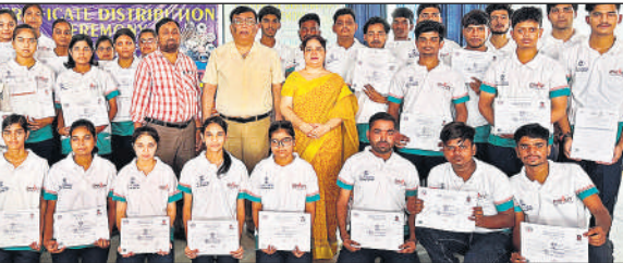
कार्यकारी निदेशक के साथ प्राप्त प्रमाण पत्र दिखाते अभ्यर्थी।