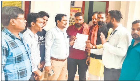
डीएम कार्यालय में ज्ञापन देने पहुंचे हिंदू महासभा कार्यकर्ता। ● अमृत विचार

पीलीभीत, अमृत विचार : कोतवाली क्षेत्र की रहने वाली एक युवती ने पुलिस को दी तहरीर में बताया कि क्षेत्र के एक युवक ने अपना नाम बदलकर मार्च 2016 में प्रेमजाल में फंसा लिया। शादी करने का झांसा देकर शोषण किया। शादी की बात तय होने पर उसने मौलवी को बुलाकर निकाह की बात कही। तब पीड़िता को हकीकत की जानकारी हुई। विरोध करने पर आरोपी ने उससे धर्म परिवर्तन करने के लिए दबाव बनाया। मना करने पर युवक ने बिना शादी किए मरने की धमकी दी, जिसके बाद उसने युवक के कहने पर अपना धर्म परिवर्तन करा लिया। उसका नाम बदलकर अर्सी रखा गया। वर्ष 2018 में उसने एक पुत्र और वर्ष 2020 में उसने एक पुत्री को जन्म दिया। इसके बाद युवक और उसके भाई के अलावा उसकी मां ने उसको प्रतिबधित पशु का मीट खिलाने के लिए दबाव बनाया। युवती ने अपने जेट पर दुष्कर्म करने का भी आरोप लगाया। उसने बताया कि 30 जून 2025 को वह आरोपियों के पास से निकली और मायके पहुंचकर जानकारी दी। कोतवाल राजीव कुमार सिंह ने बताया कि रिपोर्ट दर्ज कर मामले की जांच की जा रही है।