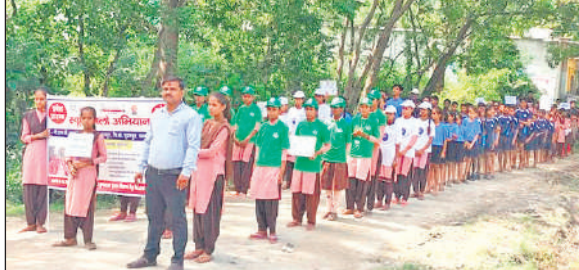
जागरुकता रैली निकालते बच्चे।