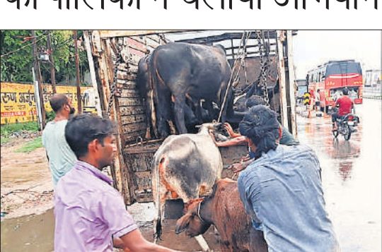
शहर की सड़कों पर घूम रहे गोवंश को पकड़कर गोशाला ले जाते पालिका कर्मी।