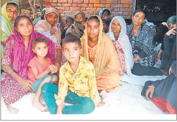
खम्हौल गांव में गमगीन बैठी परिवार की महिलाएं।