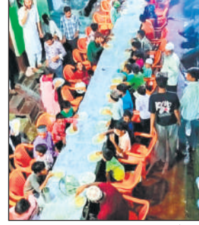
बिलसंडा जामा मस्जिद परिसर में हुए लंगर में शामिल लोग।