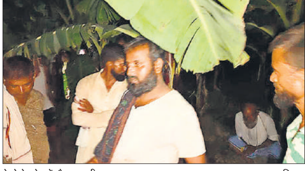
केले के खेत में मौजूद ग्रामीण।

मौके पर पहुंचीं सीओ और कोतवाल के काफी समझाने के बावजूद घर वाले डीएम और एसपी के आए बिना शव पेड़ से उतारने देने को राजी नहीं थे। हालांकि बाद में सीओ ने परिजनों को किसी तरह से समझ बुझाकर शांत कराया और कई कार्रवाई का आश्वासन दिया। तब परिजन माने और पुलिस को शव उतारने दिया।