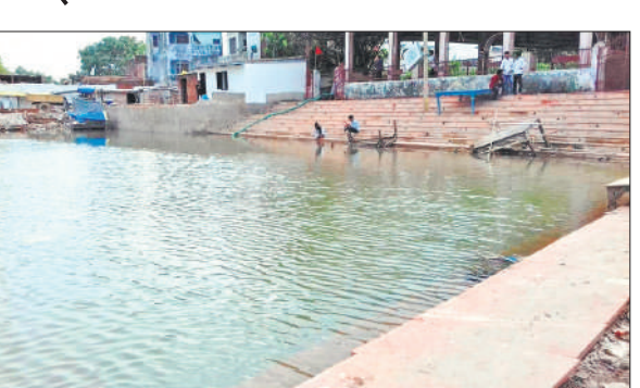
गोकर्ण तीर्थ में भरा बारिश का पानी।