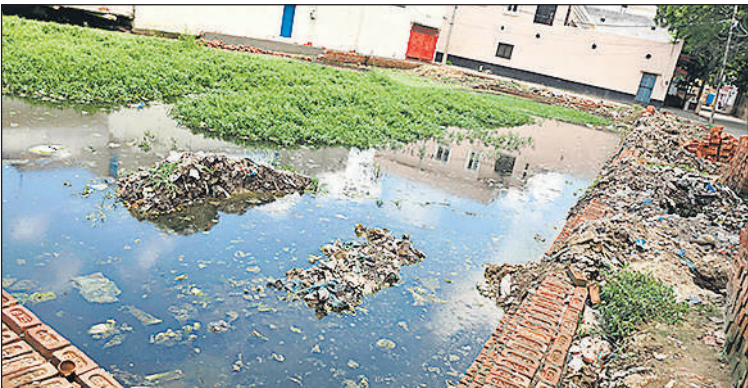
नकटादानी चौराहा के पास निर्माणाधीन पार्क में जमा गंदा पानी और सिल्ट का ढेर।

इन दिनों प्रशासन संचारी रोगों से निपटने के लिए अभियान चला रहा है। जिसकी जिम्मेदारी स्वास्थ्य विभाग और नगरपालिका, नगर पंचायतों को दी गई है। ताकि वह अपने क्षेत्र में साफ सफाई कराने के साथ ही दवा का छिड़काव और फॉगिंग कराएं। इस अभियान को लेकर दावे और धरातल की हकीकत भिन्न है।